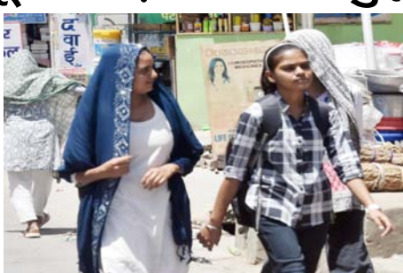
चलते नजर आए। बड़ा बाजार, नया बाजार, गांधी चौक, कबाड़ी बाजार, माजरा रोड और नेहरू

शाह टाइम्स संवाददाता शामली। बुधवार को सुबह से ही तेज धूप और गर्म हवाओं ने लोगों को बेहाल कर दिया। सुबह 10 बजे ही तापमान 37 डिग्री सेल्सियस तक पहुंच गया, जबकि दिन का अधिकतम तापमान 44 डिग्री सेल्सियस और न्यूनतम तापमान 27 डिग्री सेल्सियस दर्ज किया गया। गर्मी और उमस के कारण जनजीवन प्रभावित रहा। दोपहर के समय शहर के बाजारों और सड़कों पर सन्नाटा पसरा दिखाई दिया। जरूरी कार्य से बाहर निकलने वाले लोग रिसर और चहेरे को कपड़े से ढंककर