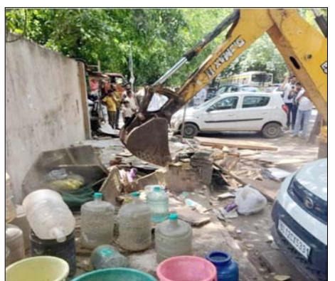
एमसीडी कर्मचारी कुतुब इंस्टीट्यूशनल एरिया में अतिक्रमण विरोधी अभियान चलाते हुए।

दिल्ली नगर निगम अतिक्रमणकारियों के खिलाफ आगे भी सख्त कार्रवाई जारी रखेगी और यह सुनिश्चित करेगा कि सार्वजनिक स्थान बाधा रहित बने रहें।