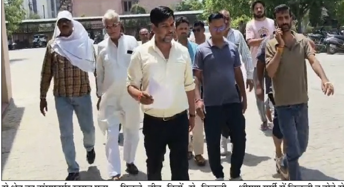
से क्षेत्र का ट्रांसफार्मर खराब पड़ा हुआ है। वहीं कई गलियों में पिछले तीन दिनों से बिजली आपूर्ति पूरी तरह बाधित है। भीषण गर्मी में बिजली न होने से लोगों का घरों में रहना मुश्किल

शाह टाइम्स संवाददाता हापुड़। भीषण गर्मी के बीच बिजली संकट को लेकर शहर में लोगों का आक्रोश बढ़ता जा रहा है। नगर कोतवाली क्षेत्र के अर्जुन नगर के लोगों ने बुधवार को जिला मुख्यालय पहुंचकर डीएम कार्यालय के बाहर प्रदर्शन किया और खराब ट्रांसफार्मर बदलवाने की मांग उठाई। प्रदर्शनकारियों ने आरोप लगाया कि पिछले कई दिनों से क्षेत्र की बिजली व्यवस्था पूरी तरह चरमपरा गई है, जिससे लोगों को भारी परेशानियों का सामना करना पड़ रहा है।