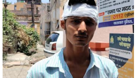
प्रत्यक्षदर्शियों के अनुसार हादसे को समय कक्षा में बड़ी संख्या में छात्र-छात्राएं मौजूद थीं। अचानक छत से प्लास्टर गिरने लगा, जिससे कक्षा में अफरा-तफरी और चीख-पुकार मच गई। स्थानीय लोगों का आरोप है कि कोचिंग सेंटर की छत लंबे समय से जर्जर हालत में थी। इसके बावजूद भवन

शाह टाइम्स संवाददाता हापुड़। पिलखुवा क्षेत्र स्थित लाल बहादुर शास्त्री कोचिंग सेंटर में मंगलवार को उस समय हड़कंप मच गया, जब पहाई के दौरान अचानक छत का प्लास्टर टूटकर छात्रों के ऊपर गिर पड़ा। हादसे में कई छात्र घायल हो गए, जबकि एक छात्र के सिर में गंभीर चोट आने पर उसे अस्पताल में भर्ती कराया गया, जहां डॉक्टरों ने उसके सिर में छह टांके लगाए।