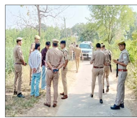
ने कार सवार दोस्तों पर ताबड़तोड़ फायरिंग कर उन्हें जान से मारने का प्रयास किया है। हालांकि पुलिस का कहना है कि एक्सिडेंटल फायरिंग में युवक घायल हुआ है। घटना की जांच के लिए फॉरेंसिक टीम को मौके पर बुलाया गया है। सूचना मिलने पर एसपी देहात मयंक पाठक भी मौके पर पहुंचे और घटना की विस्तृत जानकारी ली।

आई-20 कार में सवार युवक पिस्टल से गोली चलने के कारण घायल होने की सूचना मिली थी। पुलिस ने मौके पर पहुंचकर घायल व उसके साथियों से पूछताछ की तो पता चला कार सवार चारों दोस्त कहीं जा रहे थे जिनके पास अवैध पिस्टल था उस पिस्टल की मिस्हेडलिंग के दौरान यह एक्सिडेंटल फायर हुआ है जिसमें युवक घायल हुआ है। घटना के संबंध में विधिक कार्रवाई की जा रही है।