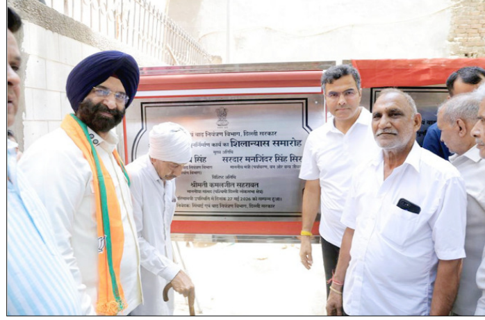
कैबिनेट मंत्री प्रवेश साहिब सिंह तथा कैबिनेट मंत्री एवं राजौरी गार्डन विधानसभा क्षेत्र के स्थानीय विधायक मनजिंदर सिंह सिरसा अंबेडकर चौपाल का शिलान्यास करते हुए।

गार्डन विधानसभा क्षेत्र के स्थानीय विधायक मनजिंदर सिंह सिरसा द्वारा किया गया। यहाँ के स्थानीय लड़के सुविधाओं को सुदृढ़ करने के लिए लंबे समय से बेहतर और सुविधाजनक सामुदायिक स्थान की मांग कर रहे थे। इन चौपालों का निर्माण होने से उनकी यह समस्या खत्म होगी और लोगों को विश्वास एवं अन्य सामाजिक-सांस्कृतिक आयोजनों के लिए व्यवस्थित स्थान की सुविधा भी प्राप्त होगी। अंबेडकर चौपाल का निर्माण कार्य लगभग रु. 1.33 करोड़ की अनुमानित लागत से किया जा रहा है।