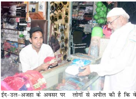
ईद-उल-अजहा के अवसर पर लोगों में अपील की है कि वे