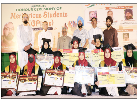
मौजूद रहे। देश की एकता और अखंडता को दर्शाते इस भव्य कार्यक्रम में छात्राओं ने विभिन्न सांस्कृतिक प्रस्तुतियां दी। कार्यक्रम में कक्षा 10