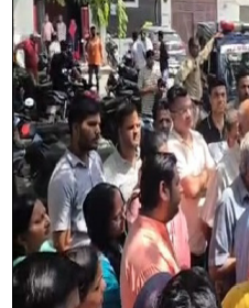
गौरतलब है कि मंगलवार सुबह मंदिर में पूजा करने पहुंचे श्रद्धालुओं ने शनिदेव की मूर्ति टूटी हुई देखा था। घटना की जानकारी मिलते ही क्षेत्र में आक्रोश फैल गया और मौके पर लोगों की भीड़ जुट गई। लोगों ने इसे धार्मिक भावनाओं को आहत

शाह टाइम्स संवाददाता हापुड़। पिलखुवा के बस स्टैंड पुलिस चौकी के निकट स्थित राधा-कृष्ण मंदिर में भगवान शनिदेव की मूर्ति खंडित किए जाने के मामले में 24 घंटे बाद भी आरोपित की गिरफ्तारी नहीं होने पर लोगों का गुस्सा भड़क उठा। बुधवार को बड़ी संख्या में महिला-पुरुष मंदिर परिसर के बाहर जमा हो गए और पुलिस प्रशासन के खिलाफ प्रदर्शन करते हुए जल्द कार्रवाई की मांग की।