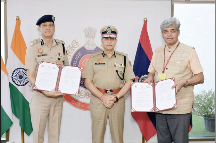
दिल्ली पुलिस व एनआईईएलआईटी ने पुलिस कर्मियों के लिए उन्नत साइबर कोर्स हेतु एमओयू पर हस्ताक्षर किए।

शाह टाइम्स संवाददाता नई दिल्ली। मुख्यमंत्री रखा गुप्ता ने दिल्ली की पहचान और जनभावनाओं का सम्मान करते हुए मेट्रो स्टेशनों, अस्पतालों आदि के नाम में परिवर्तन किया है। रोहिणी वेस्ट मेट्रो स्टेशन अब 'डॉ. बाबा साहेब अंबेडकर अस्पताल' कहलाएगा। इसके अलावा बेगमपुर (रोहिणी) में निर्माणाधीन खेल परिसर का नाम पूर्व प्रधानमंत्री भारत रत्न स्वर्गीय श्री अटल बिहारी वाजपेयी जी के नाम 'अटल खेल परिसर' रखा जाएगा। वहां पूर्व प्रधानमंत्री श्री की प्रतिमा भी स्थापित की जाएगी।