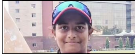
पहली टी-20 मुंबई महिला लीग: युवा सनसनी इराजावह सबसे महंगी खिलाड़ी बनीं खेल टाइम्स