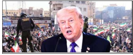
ईरान और अमेरिका के बीच फिर छिड़ सकता है युद्ध