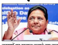
कारणों पर सवाल उठाते हुए कहा कि चाहे अंतरराष्ट्रीय परिस्थितियां जिम्मेदार हों या अन्य कारण, सरकार को आम जनजीवन के हित को ध्यान में रखते हुए नीतियां बनानी चाहिए। उन्होंने सुझाव दिया कि जैसे चुनावों के दौरान पेट्रोलियम उत्पादों की कीमतों को नियंत्रित रखा गया, वैसे ही वर्तमान में भी जनहित और जनकल्याण को प्राथमिकता दी जानी चाहिए।

कर्मशियल सिलेंडर महंगा होने पर मायावती ने जताई चिंता लखनऊ, वार्ता देश में कर्मशियल गैस सिलेंडर की कीमतों में एकमुश्त 993 रुपये की बढ़ोतरी के बाद राजनीतिक प्रतिक्रियाएं तेज हो गई हैं। बहुजन समाज पार्टी प्रमुख मायावती ने इस बढ़ोतरी को लेकर चिंता व्यक्त करते हुए कहा है कि इसका सीधा असर आम जनजीवन पर पड़ेगा और महंगाई और बढ़ने की आशंका है। उन्होंने कहा कि कर्मशियल सिलेंडर की भारी किल्लत के बीच कीमतों में अचानक वृद्धि की खबरें सभी मीडिया माध्यमों में प्रमुखता से सामने आई हैं, जिससे लोगों में बेचैनी बढ़ी है। उनका मानना है कि इससे रसोई गैस के साथ-साथ पेट्रोल, डीजल और अन्य पेट्रोलियम पदार्थों की कीमतों में भी बढ़ोतरी हो सकती है। मायावती ने इस स्थिति के