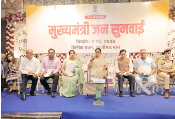
मुख्यमंत्री रेखा गुप्ता शालीमार बाग विधानसभा क्षेत्र के लोगों की समस्याएं सुनी हुईं।

दिए। उन्होंने साफ कहा कि जनसुनवाई केवल औपचारिक प्रक्रिया नहीं है, बल्कि यह जनता की अपेक्षाओं को समझने और उन्हें जल्द पूरा करने का एक प्रभावी माध्यम है। इस अवसर पर मुख्यमंत्री ने कहा कि जनसुनवाई से मिलने वाले सुझाव और फीडबैक सरकार के लिए बेहद महत्वपूर्ण होते हैं, क्योंकि इन्होंने के आधार पर नीतियां और योजनाओं को अधिक जनो-मुखी बनाया जाता है। उन्होंने दोहराया कि दिल्ली सरकार आम नागरिकों की समस्याओं के त्वरित और पारदर्शी समाधान के लिए पूरी तरह प्रतिबद्ध है।