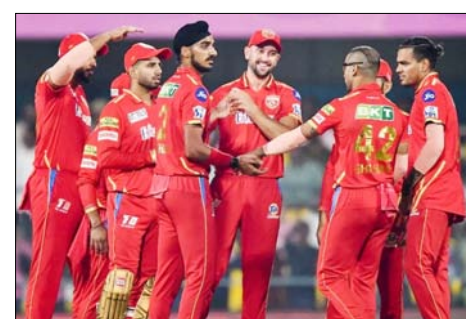
दिल्ली कैपिटल्स के खिलाफ पंजाब का 265 रनों का रिकॉर्ड-तोड़ चेज है। एक ऐसे फॉर्मेट में जहां कभी 200 रनों के स्कोर को छूना भी नामुमकिन माना जाता था, पंजाब किंग्स ने

अहमदाबाद, वार्ता। पंजाब किंग्स आईपीएल 2026 में एक ऐसे मुकाम पर पहुंच गई है, जहां अब बड़े से बड़े टारगेट भी उन्हें रोकने के लिए काफी नहीं लगते। रविवार रात नरेंद्र मोदी स्टेडियम में गुजरात टाइटन्स का सामना करने की तैयारी करते हुए, पंजाब किंग्स टूर्नामेंट की सबसे निडर चेज करने वाली टीम के तौर पर अपनी साख बनाए हुए हैं। एक ऐसी टीम जो 220 से ज्यादा के स्कोर को भी आसानी से चेज करने लायक बना सकती है। यह साख सिर्फ हवा-हवाई बातों से नहीं बनी है। इसे लगातार बेहतरीन बैटिंग परफॉर्मेंस से बनाया गया है, जिसकी सबसे बड़ी मिसाल इस सीजन की शुरुआत में