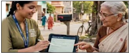
उपराज: जनगणना 2027: दो चरणों में होगी प्रक्रिया, घर-घर जाकर जुटाया जाएगा डेटा

नई दिल्ली, मुजफ्फरनगर, देहरादून, हल्द्वानी, मुरादाबाद, बरेली, मेरठ व लखनऊ से प्रकाशित