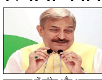
जनमास में संदेह और असहजता पैदा की है तथा मुख्यमंत्री पद की गरिमा पर प्रश्नचिह्न खड़े किए हैं। हालांकि तिवारी ने यह भी कहा कि इन आरोपों की सच्चाई स्पष्ट होना आवश्यक है। उन्होंने मुख्यमंत्री से आग्रह किया कि वे इन सभी मुद्दों पर खुलकर स्पष्टीकरण दें। उनका कहना है कि लोकतंत्र में पारदर्शिता और जवाबदेही सर्वोपरि होती है, खासकर जब बात किसी राज्य के सार्वजनिक चर्चा का विषय बन चुकी है। उन्होंने पूर्व में विदेश यात्रा के दौरान विमान से उतारने की कथित घटना और संसद के समय उठे सवाल का हवाला देते हुए कहा कि इन घटनाओं ने

कांग्रेस सांसद तिवारी ने मान पर लगे आरोपों पर मांग जावा नई दिल्ली। कांग्रेस पार्टी के राज्यसभा सांसद प्रमोद तिवारी ने पंजाब के मुख्यमंत्री भगवंत मान पर लगा रहे आरोपों को लेकर स्पष्ट जवाब देने की मांग की है। उन्होंने कहा कि पंजाब जैसे महत्वपूर्ण राज्य के मुख्यमंत्री पर बार-बार नशे से जुड़े गंभीर आरोप लगना बेहद दुर्भाग्यपूर्ण और चिंताजनक है। प्रमोद तिवारी ने हाल ही में सामने आए आरोपों का जिक्र करते हुए कहा कि यह दावा किया जा रहा है कि पंजाब के मुख्यमंत्री मान विधानसभा में नशे को हालत में पहुंचे थे। उन्होंने कहा कि यह कोई पहला मामला नहीं है, इससे पहले भी इस तरह की घटनाएं सार्वजनिक चर्चा का विषय बन चुकी हैं। उन्होंने पूर्व में विदेश यात्रा के दौरान विमान से उतारने की कथित घटना और संसद के समय उठे सवाल का हवाला देते हुए कहा कि इन घटनाओं ने