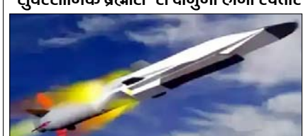
शाह टाइम्स ब्यूरो

'सुपरसोनिक ब्रह्मोस' से दोगुनी होगी रफ्तार