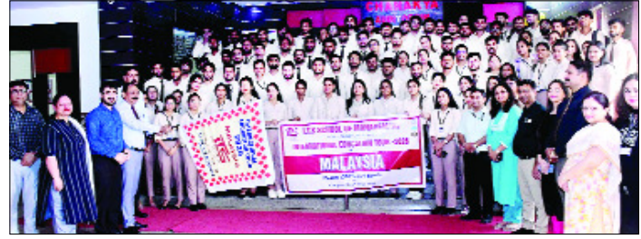
पुत्रा (प्रधानमंत्री कार्यालय), पुत्राजाया झील और भविष्यवादी सेरी बवासन पुल का अवलोकन करेंगे। इसके अतिरिक्त छात्र विविध विद्यालय भ्रमण एवं