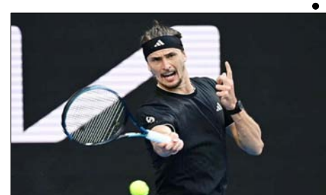
बहुत खुश हूँ। बहुत सारे कड़े मुक. अबले हुए, खासकर टूर्नामेंट की शुरुआत में। मैं जानिक के साथ फिर से खेलने का इंतजार कर रहा हूँ और एक कड़े मैच की उम्मीद कर रहा हूँ। रविवार को जो बेहतर खेलना, वही जीतगा। दूसरे वरीयता प्राप्त खिलाड़ी ने क्वार्टर-फाइनल में फ्लेवियो कोबोली को सिर्फ पांच गेम गंवाकर हराया था और उसी लीज को अपने अगले मुकाबले में भी जारी रखा। यह मुकाबला पहली बार मास्टर्स 1000 सेमीफाइनल में पहुंचे ब्लॉक्स के साथ था, जिन्होंने अप्रैल से पहले टूर-स्तर

मैड्रिड, वार्ता। अलेक्जेंडर ज्वेरेव दुनिया के नंबर 1 खिलाड़ी जानिक सिनर के साथ एक और बड़े मुकाबले के लिए तैयार हैं। जर्मन खिलाड़ी ने शुरुआत में 21 साल के बेल्जियम के खिलाड़ी अलेक्जेंडर ब्लॉक्स के खिलाफ 6-2, 7-5 से शांत और संयमित जीत के साथ मैड्रिड ओपन के फाइनल में अपनी जगह पकड़ी कर ली, और इस टूर्नामेंट में अपने शानदार रिकॉर्ड को बनाए रखा। स्पेन की राजधानी में अपनी 30वीं जीत के साथ, ज्वेरेव रोजर फेडरर और राफेल नडाल के बाद तीसरे ऐसे खिलाड़ी बन गए हैं जो मैड्रिड में चार बार फाइनल में पहुंचे हैं। ज्वेरेव ने जीत के बाद कहा कि मै फाइनल में पहुंचकर