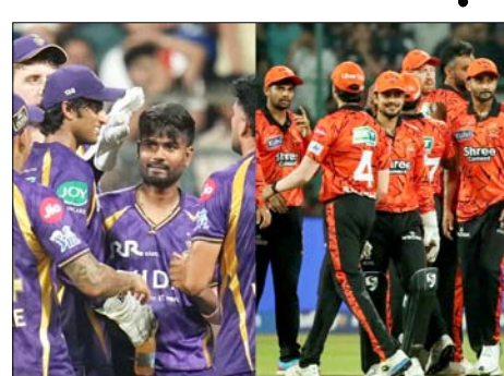
बैटिंग टीम बन गई है, जो टॉप ऑर्डर में लगातार आक्रामक खेल और मिडिल ऑर्डर में गहराई के दम पर अपने विरोधियों पर हावी हो रही है। उनकी ताजा मिसाल मुंबई इंडियंस के खिलाफ देखने

हैदराबाद, वार्ता। सनराइजर्स हैदराबाद की विस्फोटक बैटिंग का नया इम्फिहान तब होगा, जब वे रविवार को यहां राजीव गांधी इंटरनेशनल क्रिकेट स्टेडियम में आईपीएल 2026 के दिन के मैच में कोलकाता नाइट राइडर्स की मेजबानी करेंगे। इस मैच में सबकी नजर इस बात पर होगी कि क्या केकेआर टूर्नामेंट की सबसे खतरनाक बैटिंग यूनिट को रोक पाएगा।