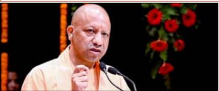
बेटी, व्यापारी को छेड़ने वाले का इंटरजार अब यमराज करते हैं: मुख्यमंत्री योगी पेज 2

shahtimes2015@gmail.com च्येठ शुक्ल पक्ष 13 विक्रमी सम्वत् 2083 12 जिलाहिज्जा 1447 हिजरी नई दिल्ली, मुजफ्फरनगर, देहरादून, हल्द्वानी, मुगदाबाद, बरेली, मेरठ व लखनऊ से प्रकाशित