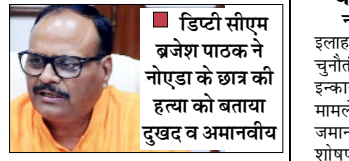
डिप्टी सीएम ब्रजेश पाठक ने नोएडा के छात्र की हत्या को बताया दुःखद व अमानवीय