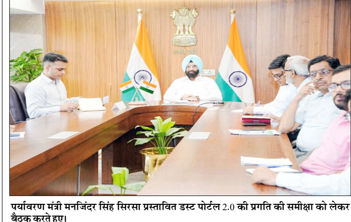
पर्यावरण मंत्री मनजिंदर सिंह सिरसा प्रस्तावित डस्ट पोर्टल 2.0 की प्रगति की समीक्षा को लेकर बैठक करते हुए।

(AI), रियल-टाइम विश्लेषण, स्वचालित मूल्यांकन, AI-पावर्ड कैमरे, पार्टिकुलेट मैटर (PM) सेंसर और डिजिटल गवर्नंस टूलस का इस्तेमाल करेगा। यह पोर्टल अधिक डेटा वाले ग्रोन एंटी-डस्ट नेट और एंटी-स्मॉग गन जैसे पर्यावरण को नियंत्रित करने वाले उपकरणों की निगरानी करने में सहायक साबित होगा। अगर प्रदूषण के स्तर में तय मानकों से अधिक कोई भी बदलाव होता है, तो स्वतः अलर्ट जारी हो जाएंगे, जिससे समय पर प्रदूषण को नियंत्रित करने के लिए आवश्यक उपाय किए जा सकेंगे।