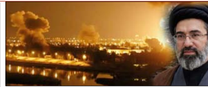
ईरान ने चार जहाजों पर दागी मिसाइलें, अमेरिकी विमान गिराने का भी दावा पेज 12