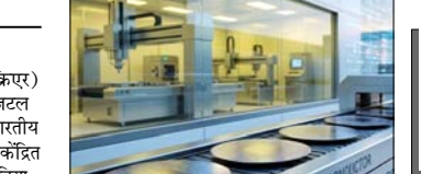
यह व्यापक अध्ययन, जो वैश्विक सकल घरेलू उत्पाद (जीडीपी) के 96 प्रतिशत को कवर करता है, दर्शाता है कि भारत डिजिटल प्रदर्शन में जर्मनी, फ्रांस, जापान और कनाडा जैसी विकसित अर्थव्यवस्थाओं से आगे निकल रहा है। रिपोर्ट वैश्विक डिजिटल परिदृश्य में एक बड़े बदलाव को दर्शाती है।

नई दिल्ली। भारतीय अंतर्राष्ट्रीय आर्थिक संबंध अनुसंधान परिषद (इक्रिए) और पॉर्स सेंटर फॉर इंटरनेट एंड डिजिटल इकोनॉमी (आईपीसीआईडी) की भारतीय डिजिटल अर्थव्यवस्था की स्थिति पर केंद्रित इस वर्ष की रिपोर्ट के अनुसार भारत दुनिया की पांचवीं सबसे अधिक डिजिटलाइज्ड अर्थव्यवस्था और चिप-एआई इंडेक्स में चौथे स्थान पर उभरा है। शुक्रवार को यहां जारी स्टेट ऑफ इंडिया एस डिजिटल इकोनॉमी (एसआईडी) 2026 शीर्षक इस रिपोर्ट के अनुसार, 71 देशों को शामिल करने वाला