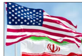
यूएई ने इस हमले की कड़ी निंदा करते हुए इसे तनाव बढ़ाने वाला कदम बताया है

वाशिंगटन/तेहरान। ईरान और अमेरिका के बीच हुआ युद्धविराम अब होर्मुज जलडमरूमध्य को लेकर खतरे में पड़ता नजर आ रहा है। अमेरिकी राष्ट्रपति डोनाल्ड ट्रम्प की ओर से ईरान के ताजा प्रस्ताव को खारिज करने और होर्मुज से जहाजों के पारगमन में मदद के लिए 'प्रोजेक्ट फ्रीडम' शुरू करने के बाद तनाव चरम पर है।