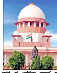
कोर्ट में धार्मिक जगहों पर महिलाओं के साथ भेदभाव और अलग-अलग धर्मों के प्रवेश पर आजादी के दायरे से जुड़ी याचिकाओं पर 11वें दिन भी सुनवाई जारी। सितम्बर 2018 में 5 जजों की संविधान बेंच ने 4:1 के बहुमत से फैसला सुनाते हुए सबरीमाला अयथा मंदिर में 10 से 50 साल की महिलाओं के प्रवेश

जज ने कहा: अपने लोगों के लिए काम करें कोर्ट में धार्मिक जगहों पर महिलाओं के साथ भेदभाव और अलग-अलग धर्मों के प्रवेश पर आजादी के दायरे से जुड़ी याचिकाओं पर 11वें दिन भी सुनवाई जारी। सितम्बर 2018 में 5 जजों की संविधान बेंच ने 4:1 के बहुमत से फैसला सुनाते हुए सबरीमाला अयथा मंदिर में 10 से 50 साल की महिलाओं के प्रवेश