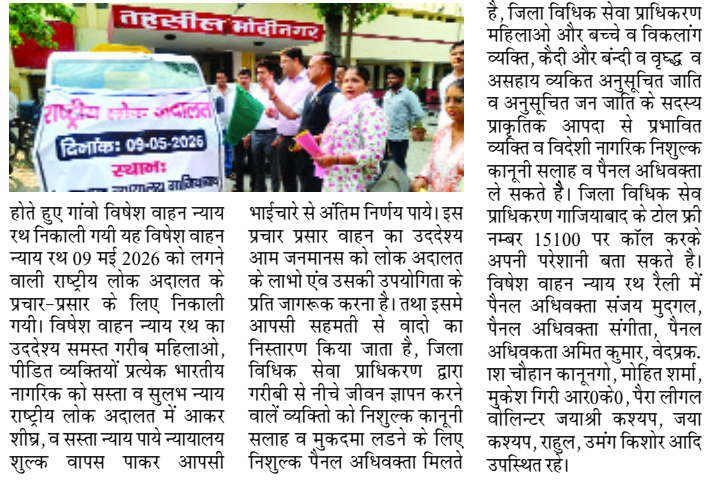
होते हुए गांवों विधेय वाहन न्याय रथ निकाली गयी यह विधेय वाहन न्याय रथ 09 मई 2026 को लगने वाली राष्ट्रीय लोक अदालत के प्रचार-प्रसार के लिए निकाली गयी। विधेय वाहन न्याय रथ का उद्देश्य समस्त ग्रामीण महिलाओं, पीछे छूटी व्यक्तियों प्रत्येक भारतीय नागरिक को सस्ता व सुलभ न्याय राष्ट्रीय लोक अदालत में आकर शीघ्र, व सस्ता न्याय पाये न्यायालय शुल्क वापस पाकर आपसी