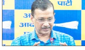
भाजपा ने जनतंत्र को हाइजेक कर लिया है, जनतंत्र की हत्या कर दी है, पूरे देश में कोई भी पार्टी जीत कर आ जाए, इन्हें कोई फर्क नहीं पड़ता

नई दिल्ली, वार्ता आम आदमी पार्टी के राष्ट्रीय संयोजक अरविंद केजरीवाल ने भारतीय जनता पार्टी पर जनतंत्र की हत्या करने का आरोप लगाते हुए कहा कि पूरे देश में कोई भी पार्टी जीत कर आ जाए, इन्हें कोई फर्क नहीं पड़ता है, क्योंकि एजेंडियां लगाकर विधायकों को तोड़कर सरकारें गिरा देते हैं। केजरीवाल ने पंजाब के मुख्यमंत्री भगवंत सिंह मान के साथ दिल्ली आए पार्टी के विधायकों के साथ कपूरथला हाउस में संवाद किया। उन्होंने इस दौरान कहा कि आज पूरे देश में बहुत बंध संकेत छाया हुआ है। भाजपा ने जनतंत्र को हाइजेक कर लिया है, जनतंत्र की हत्या कर दी है। पूरे देश में कोई भी पार्टी जीत कर आ जाए, इन्हें कोई फर्क नहीं पड़ता है। इसके बाद ए ईडी-सीबीआई और पीसे से, उस पार्टी के विधायक तोड़ लेते हैं, पार्टीयां तोड़ लेते हैं, जेल भेज देते हैं और सरकारें गिरा देते हैं। जीतने के लिए ये लोग वोट काट देते हैं, अपना वोट जुड़वा देते हैं। सोमवार को पश्चिम बंगाल चुनाव का आया परिणाम कोई चुनाव नहीं था। पिछले 3-4 महीने से हम देख रहे हैं कि पश्चिम बंगाल के अंदर तांडव चल रहा है। इसी तरह इन्होंने बिहार, महाराष्ट्र में भी किया। उन्होंने कहा कि जब मैं जेल गया, उससे पहले नई दिल्ली विधानसभा में 1 लाख 48 हजार वोट थे। जब मैं लौट कर आया तो 1 लाख 6 हजार वोट बचे थे। इन्होंने करीब 6 महीने के अंदर 42 हजार वोट काटवा दिया। पिछली बार नई दिल्ली विधानसभा सीट से मैं 30 हजार वोट से जीता था। इन्होंने 42 हजार