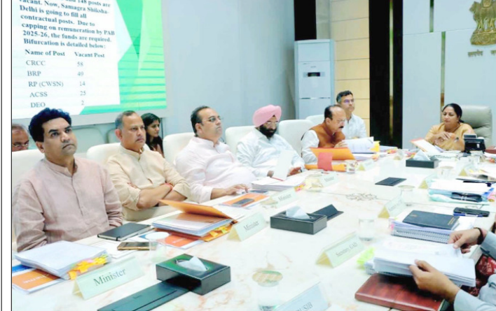
मुख्यमंत्री के नेतृत्व में आयोजित कैबिनेट में वोकेशनल शिक्षकों व समग्र शिक्षा अभियान के तहत संचालित विशेष प्रशिक्षण केंद्रों में कार्यरत शिक्षकों के वेतन में वृद्धि का फैसला लिया।

जाता है और उन्हें मुख्यधारा में लाने के लिए विशेष प्रशिक्षण दिया जाता है। मुख्यमंत्री ने कहा कि अब समग्र शिक्षा अभियान के शिक्षकों को प्राइमरी और अपर प्राइमरी शिक्षकों के बराबर वेतन मिलेगा। यह निर्णय केवल वेतन वृद्धि नहीं है, बल्कि उन शिक्षकों के समर्पण और मेहनत का सम्मान है, जो चुनौतीपूर्ण परिस्थितियों में बच्चों को शिक्षा से जोड़ने का काम कर रहे हैं। इन सभी शिक्षकों के वेतन में बढ़ोतरी होने से न केवल उनकी आर्थिक स्थिति मजबूत होगी, बल्कि उनका मनोबल भी बढ़ेगा।