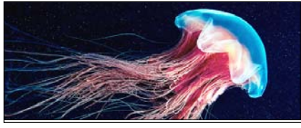
जेलीफिश मनुष्यों के समान सोती है