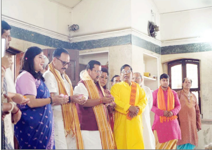
भाजपा राष्ट्रीय अध्यक्ष भाजपा की जीत के बाद माँ काली बाड़ी मंदिर में पूजा अर्चना करते हुए।

सम्मेलन 31 मई को आयोजित होगा, जिसमें अफ्रीकी देशों के राष्ट्राध्यक्षों और प्रतिनिधियों के शामिल होने की संभावना है। इस सम्मेलन का उद्देश्य भारत और अफ्रीकी देशों के बीच रणनीतिक, आर्थिक और कूटनीतिक संबंधों को और मजबूत बनाना है। यह आयोजन अफ्रीकी संघ के सहयोग से किया जाएगा, जिससे दोनों पक्षों के बीच साझेदारी को नई दिशा मिलने की उम्मीद है। वहीं, 28 मई से 1 जून तक आयोजित होने वाला इंटरनेशनल विंग कैट एलायंस समिट अपने प्रकार का पहला वैश्विक आयोजन है।