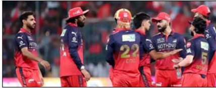
बेंगलुरु में आईपीएल फाइनल की मेजबानी के मौकों पर संकट