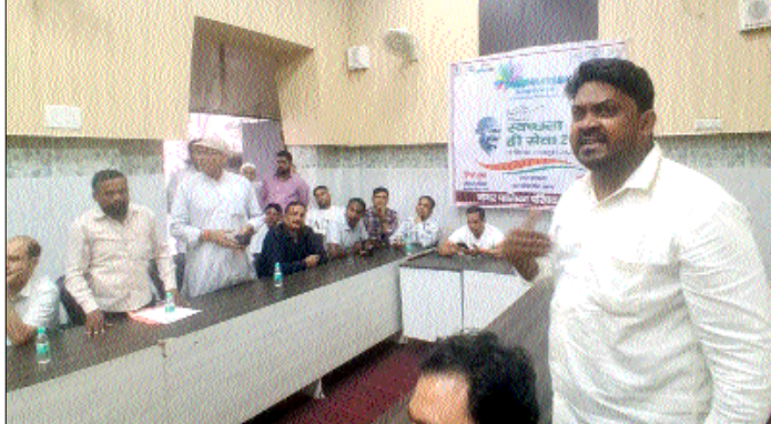
सरधना नगर पालिका में आयोजित बैठक में उलझते सभासदगण।

नाम को लेकर फिर गहराया विवाद दरअसल, सरधना में लगने वाला यह मेला वर्षों पुरानी परंपरा से जुड़ा हुआ है। नगर के कई वरिष्ठ सभासदों और स्थानीय लोगों का कहना है कि यह मेला करीब 60 वर्षों से ‘बूढ़ा बाबू’ के नाम से