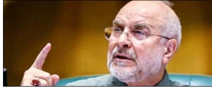
होर्मुज तनाव के बीच अमेरिकी प्रभाव कम हो जाएगा: गालिबफ