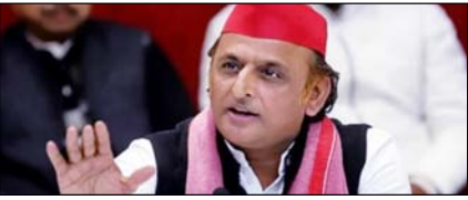
महिला आरक्षण पर भाजपा अपना रुख साफ करे: अखिलेश यादव

नई दिल्ली, मुजफ्फरनगर, देहरादून, हल्द्वानी, मुदाबाद, बरेली, मेरठ व लखनऊ से प्रकाशित