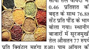
सोया तेल वायदा भी 0.46 प्रतिशत की बढ़त के साथ 76.88 सेंट प्रति पीड के भाव बोला गया। स्थानीय बाजारों में सूरजमुखी तेल औसतन 77 रुपये प्रति क्विंटल महंगा हुआ। पाम ऑयल की कीमत 69 रुपये और सोया तेल की 44 रुपये बढ़ गई। सरसों तेल 13 रुपये और वनस्पति चार रुपये मजबूत हुआ। वहीं मूंगफली तेल में नौ रुपये प्रति क्विंटल की गिरावट देखी गई। मीठे के बाजार में आज गुड़ का औसत भाव 35 रुपये प्रति क्विंटल बढ़ा। चीनी भी चार रुपये महंगी हुई। सरकारी वेबसाइट पर जारी खाद्यान्नों के दिन के औसत थोक भाव इस प्रकार रहे: दाल-दलहन: दाल चना 7663.62 रुपये, मसूर काली 8130.38 रुपये, मूंग दाल 10167.95 रुपये, उड़द दाल 10835.36 रुपये, तुअर दाल 11222.93 रुपये प्रति क्विंटल रही।

नई दिल्ली, वार्ता घरेलू थोक जिंस बाजारों में मंगलवार को चावल का औसत भाव बढ़ गया। चावल के साथ चीनी में भी तेजी देखी गई जबकि मंगलवार को दालों और खाद्य तेलों में घट-बढ़ रही। औसत दर्जे के चावल की औसत कीमत 30 रुपये बढ़कर 3,860 रुपये प्रति क्विंटल रह गई। गेहूं छह रुपये सस्ता हुआ और 2,775 रुपये प्रति क्विंटल बोला गया। आटे की कीमत भी छह रुपये घट गई। दाल-दलहनों में उतार-चढ़ाव रहा। मसूर दाल औसतन 38 रुपये प्रति क्विंटल महंगी हुई। उड़द दाल की कीमत 24 रुपये और मूंग दाल की 17 रुपये बढ़ गई। तुअर दाल में 23 रुपये और चना दाल में सात रुपये प्रति क्विंटल की नरमी देखी गई। मलेशिया के दूरसा मलेशिया डेविलेटिव एक्सचेंज में पाम ऑयल का जुलाई दाल 88 रिगिट चढ़कर 4,710 रिगिट प्रति टन पर पहुंच गया। जुलाई का अमेरिकी