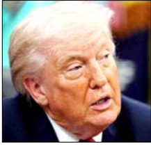
ट्रम्प इस युद्ध के लिए समय-समय पर अलग-अलग शब्दों का इस्तेमाल कर रहे

वाशिंगटन। अमेरिका के राष्ट्रपति डोनाल्ड ट्रम्प ने ईरान के साथ जारी सैन्य संघर्ष को 'छोटा युद्ध' करार देते हुए इसको प्रभाव और पैमाने को कमतर बताने का प्रयास किया है। ट्रम्प ने व्हाइट हाउस में छोटे व्यवसायों से जुड़े एक कार्यक्रम को संबोधित करते हुए कहा कि हमारा देश इस समय काफी तरक्की कर रहा है, जबकि हम एक संघर्ष में उलझे हुए हैं, जिसे मैं जिसे मैं लघु युद्ध कहता हूँ। गौरतलब है कि ट्रम्प इस युद्ध के लिए समय-समय पर अलग-अलग शब्दों का इस्तेमाल कर रहे हैं। कभी वह इसे 'युद्ध' कहते हैं, तो कभी 'सैन्य अभियान', 'भ्रमण' या सिर्फ एक