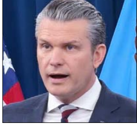
अमेरिकी रक्षा मंत्री हेगसेथ बोले- सीजफायर अभी भी लागू

वाशिंगटन/तेहरान। पश्चिम एशिया में तनाव एक बार फिर बढ़ता दिख रहा है, जहां ईरान और अमेरिका के बीच स्ट्रेट ऑफ होर्मुज को लेकर स्थिति बेहद संवेदनशील बनी हुई है। हालात ऐसे हैं कि सीजफायर की घोषणा के बावजूद दोनों पक्षों की सैन्य गतिविधियां जारी हैं। अमेरिकी रक्षा मंत्री पीट हेगसेथ ने स्पष्ट किया है कि सीजफायर अभी भी लागू है और इसे खत्म नहीं माना जा सकता। उन्होंने कहा कि स्ट्रेट ऑफ होर्मुज में जहाजों की सुरक्षा के लिए चलाया जा रहा अभियान अलग और सीमित प्रकृति का है। उन्होंने यह भी कहा कि यह ऑपरेशन केवल वाणिज्यिक जहाजों की