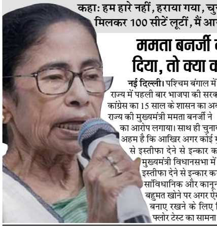
कहा: हम हारे नहीं, हराया गया, चुनाव आयोग विलेन, भाजपा से मिलकर 100 सीटें लूटीं, मैं आजाद पंछी, शेर की तरह लड़ूंगी

कोलकाता, वार्ता पश्चिम बंगाल की मुख्यमंत्री ममता बनर्जी ने मंगलवार को कोलकाता में प्रेस कॉन्फ्रेंस के दौरान कहा कि मैं सीएम पद से इस्तीफा नहीं दूंगी। हम जनता से नहीं, साजिश से हारे हैं। इस्तीफा देने राजभवन नहीं जाऊंगा। ममता ने आगे कहा कि चुनाव आयोग असली विलेन है। उसने भाजपा के साथ मिलकर 100 सीटें लूटीं। अब मेरे पास कोई इस्तीफा नहीं है, मैं आजाद पंछी हूँ। कहीं से भी चुनाव लड़ सकती हूँ, सड़कों पर रहूंगी। ममता ने आरोप लगाया कि भाजपा ने काउंटिंग सेंट्रों पर कब्जा कर लिया था। मेरे साथ बदसलूकी की। उम्मीदवारों और कार्यकर्ताओं के साथ अत्याचार किया। पार्टी और इंडिया गठबंधन के नेता मेरे साथ हैं। हम फिर से उभरेंगे और शेर की तरह लड़ेंगे। पश्चिम बंगाल सहित 5