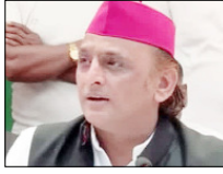
कहा: महिला आरक्षण को उत्तर प्रदेश के 2027 विधानसभा चुनाव में लागू किया जाए

शाह टाइम्स ब्यूरो लखनऊ। समाजवादी पार्टी अध्यक्ष अखिलेश यादव ने महिला आरक्षण को लेकर भाजपा सरकार पर निशाना साधते हुए मंगलवार को कहा कि पीडीए (पिछड़ा, दलित, अल्पसंख्यक) की स्पष्ट मांग है कि संसद में पारित महिला आरक्षण को उत्तर प्रदेश के 2027 विधानसभा चुनाव में लागू करने की तत्काल घोषणा की जाए। यादव ने कहा कि यह विधेयक समस्त विपक्ष के सहयोग से पारित हुआ है, ऐसे में अब भाजपा सरकार को अपनी मंशा स्पष्ट करनी चाहिए। यदि सरकार इस पर घोषणा नहीं करती है, तो उसे यह भी स्पष्ट करना चाहिए कि क्या भाजपा और