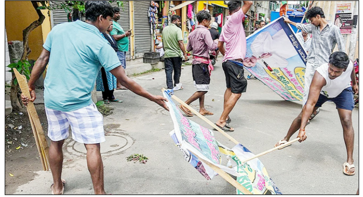
कोलकाता। पश्चिम बंगाल विधानसभा चुनाव में भाजपा की जीत के बाद टॉलीगंज निर्वाचन क्षेत्र की सड़कों से टीएमसी के होर्डिंग्स-बैनर फाड़कर फेंकते भाजपा समर्थक।

अधिकारियों ने बताया कि 'ज्याइंट टास्क फोर्स साउदर्न स्पियर' ने उस नाव को निशाना बनाया जिसके बारे में जानकारी मिली थी कि वह प्रतिबंधित आतंकवादी संगठनों से जुड़ी है और ड्रग्स तस्करी के रास्ते पर जा रही है। इस पूरी कार्रवाई में किसी भी अमेरिकी सैनिक को चोट नहीं आई है। यह ताजा कार्रवाई ट्रम्प प्रशासन द्वारा लैटिन अमेरिका में 'नाको-टेररिज्म' के खिलाफ सितम्बर से चलाए जा रहे अभियान का हिस्सा है। कैरिबियन और पूर्वी प्रशांत क्षेत्र में फेले इस अभियान में अब तक कम से कम 188 लोग मारे जा चुके हैं। हालांकि, अमेरिकी सेना ने अभी तक सार्वजनिक रूप से ऐसे सन्तुष्ट पेश नहीं किए हैं जिनसे यह पुष्टि हो सके कि निशाना बनाए गए जहाजों में नशीली दवाएं मौजूद थीं। भले ही इस समय दुनिया का ध्यान पश्चिमी एशिया के संघर्ष पर है, लेकिन पिछले कुछ हफ्तों में इस तरह के हमलों की संख्या में वृद्धि हुई है। इससे यह संकेत मिलता है कि पश्चिमी गोलाार्ड में अमेरिका के नशीली दवाओं के खिलाफ चलाए जा रहे अभियान उसकी प्राथमिकता बने हुए है।