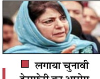
लगाया चुनावी हेराफेरी का आरोप

श्रीनगर, वार्ता जम्मू-कश्मीर की पूर्व मुख्यमंत्री एवं पीपुल्स डेमोक्रेटिक पार्टी की अध्यक्ष महबूबा मुफ्ती ने मंगलवार को चुनाव आयोग पर गंभीर आरोप लगाते हुए कहा कि यह संस्था केंद्रीय एजेंडियां के साथ मिलकर चुनावी प्रक्रिया को कमजोर कर रही है। सुश्री मुफ्ती का यह बयान पश्चिम बंगाल चुनावों में भारतीय जनता पार्टी की बड़ी जीत के एक दिन बाद आया है। उन्होंने इन परिणामों को देश की लोकतांत्रिक संस्थाओं की गिरती स्थिति के प्रति बड़ी चिंता का हिस्सा बताया। पीडीपी अध्यक्ष ने सोशल मीडिया प्लेटफॉर्म 'एक्स' पर एक पोस्ट में कहा कि टीएन शेषन द्वारा किए गए सुधारों के बाद कभी भारत की मजबूत चुनाव प्रणाली की पूरी दुनिया में प्रशंसा होती थी और आयोग को लोकतंत्र का 'निडर