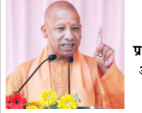
घायलों का त्वरित और समुचित इलाज तथा सभी प्रभावितों को 24 घंटे के भीतर अनुमन्य राहत राशि उपलब्ध कराई जाए: मुख्यमंत्री

शाह टाइम्स ब्यूरो लखनऊ। उत्तर प्रदेश के मुख्यमंत्री योगी आदित्यनाथ ने प्रदेश में आंधी, वर्षा और आक. शीघ्र बिजली से हुई जनहानि को गंभीरता से लेते हुए प्रशासन को अलर्ट मोड पर रखने के निर्देश दिए हैं। मंगलवार को मुख्यमंत्री ने मृतकों के परिजनों के प्रति गहरी संवेदना व्यक्त करते हुए अधिका. रियों को सख्त निर्देश दिया कि घायलों का त्वरित और समुचित इलाज सुनिश्चित किया जाए तथा सभी प्रभावितों को 24 घंटे के भीतर अनुमन्य राहत राशि उपलब्ध कराई जाए। मुख्यमंत्री ने स्पष्ट कहा कि जनहानि, पशुहानि और घायलों को समयबद्ध सहायता देना प्रशासन की प्राथमिक जिम्मेदारी है। उन्होंने चेतावनी दी कि राहत कार्यों में किसी भी स्तर पर लापर. रवाही बर्दाश्त नहीं की जाएगी और जिम्मेदार अधिकारियों के खिलाफ कार्रवाई तय होगी। उन्होंने सभी जिलाधिकारियों को निर्देश दिया है कि वे फील्ड में रहकर राहत एवं बचाव कार्यों को लगातार निगरानी करें। साथ ही, प्रभावित क्षेत्रों में आवश्यक संसाधनों की उपलब्धता सुनिश्चित करने के लिए शासन से समन्वय बनाए रखें। प्रशासन ने लोगों से अपील की है कि खराब मौसम के दौरान घरों में ही रहें और खुले स्थानों, पेड़ों तथा बिजली के खंभों से दूर रहें। प्रभावित क्षेत्रों में राहत और बचाव टीमें सक्रिय कर दी गई हैं, ताकि किसी भी आपात स्थिति में त्वरित कार्रवाई की जा सके और जनहानि को न्यूनतम रखा जा सके। दूसरी ओर उत्तर प्रदेश में आगामी दिनों में मौसम का मिजाज बदलता नजर आएगा। मौसम विभाग द्वारा मंगलवार को जारी ताजा पूर्वानुमान