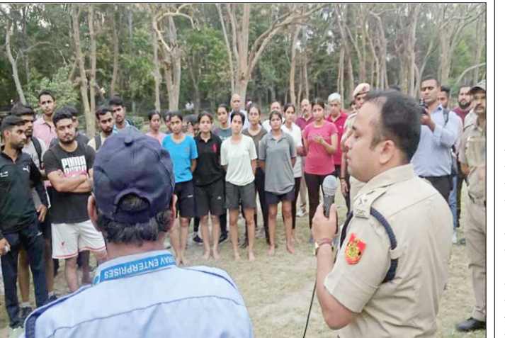
पश्चिमी जिला पुलिस के जवान सामुदायिक पुलिसिंग पहल 'विमुक्त' की शुरुआत करते हुए।