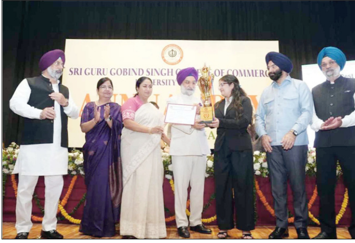
उपराज्यपाल सरदार तरनजीत सिंह संधू व मुख्यमंत्री रेखा गुप्ता डीयू के श्री गुरु गोविंद सिंह कॉलेज ऑफ कॉमर्स के 42वें वार्षिक समारोह में शिरकत करते हुए।

शाह टाइम्स संवाददाता नई दिल्ली। सीलमपुर क्षेत्र में ब्रह्मपुरी पुलिसिया के पास नाले में पशु के अवशेष मिलने के बाद इलाके में तनाव की स्थिति बन गई। सूचना फेलते ही बजरंग दल व अन्य हिंदू संगठनों के कार्यकर्ता मौके पर पहुंच गए और गांवशा की हत्या का आरोप लगाया। बड़ी संख्या में भीड़ जुटती देख पुलिस ने तत्काल मौके पर पहुंचकर स्थिति को संभाला। इलाके में भारी पुलिसबल तैनात कर दिया गया। कार्रवाई का अश्वासन मिलने के बाद कार्यकर्ता शांत होकर लौट आए। ब्रह्मपुरी पुलिसिया के पास नाले में पशु अवशेष होने की सूचना कुछ लोगों ने पुलिस को दी।