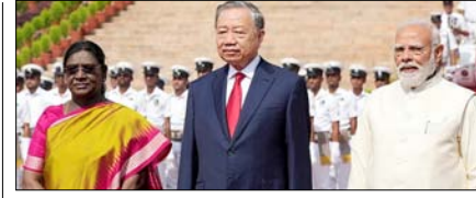
भारत-वियतनाम रणनीतिक साझेदारी होगी प्रगाढ़