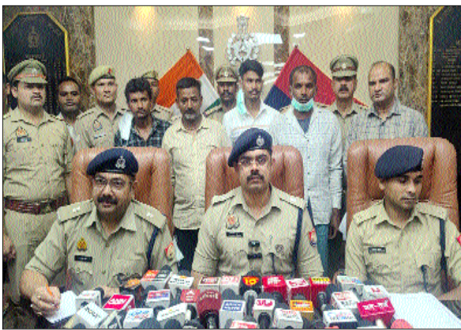
असलाह फैक्ट्री चलाते हुए पकड़े गए आरोपी।