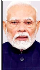
मोदी ने भारत यात्रा पर आए वियतनाम के राष्ट्रपति तो लम के साथ बुधवार को यहां द्विपक्षीय वार्ता में परस्पर संबंधों के पहलुओं पर व्यापक बातचीत की।

नई दिल्ली। प्रधानमंत्री नरेन्द्र मोदी ने कहा है कि भारत और वियतनाम ने अपनी समग्र रणनीतिक साझेदारी को और अधिक प्रगाढ़ बनाने का निर्णय लिया है और दोनों देश एक-दूसरे के विजन तथा लक्ष्यों में सहयोग करते हुए, विकसित राष्ट्र बनने की अपनी आकांक्षाओं को मिलकर साकार करेंगे। मोदी ने भारत यात्रा पर आए वियतनाम के राष्ट्रपति तो लम के साथ बुधवार को यहां द्विपक्षीय वार्ता में परस्पर संबंधों के पहलुओं पर व्यापक बातचीत की। इसके बाद मोदी ने संयुक्त वक्तव्य में कहा कि तो लम ने अपनी भारत यात्रा की शुरुआत बोध गथा से की है। उन्होंने कहा कि यह हमारे दोनों देशों की साझा सभ्यतागत और आध्यात्मिक परंपरा को दर्शाता है। उनकी इस यात्रा और सार्थक चर्चाओं से, हम अपनी सदभावना को कई टोस परिणामों में बदल रहे हैं। प्रधानमंत्री ने कहा कि दोनों देशों के बीच एक दृशक से समग्र रणनीतिक साझेदारी है और इस दौरान संबंधों में व्यापक प्रगति हुई है। दोनों देशों के बीच व्यापार, प्रौद्योगिकी और पर्यटन संबंध मजबूत हुए हैं। इस मजबूत नींव पर आगे बढ़ते हुए आज हम अपने संबंधों को और अधिक