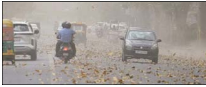
उत्तरी-पश्चिमी भारत में आंधी-तूफान के साथ बारिश की चेतावनी

नई दिल्ली, मुजफ्फरनगर, देहरादून, हल्द्वानी, मुगदाबाद, बरेली, मेरठ व लखनऊ से प्रकाशित