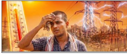
बिजली की मांग अपने सर्वोच्च स्तर पर सम्पादकीय