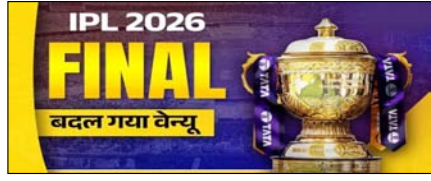
बेंगलुरु की जगह अहमदाबाद में होगा आईपीएल 2026 का फाइनल