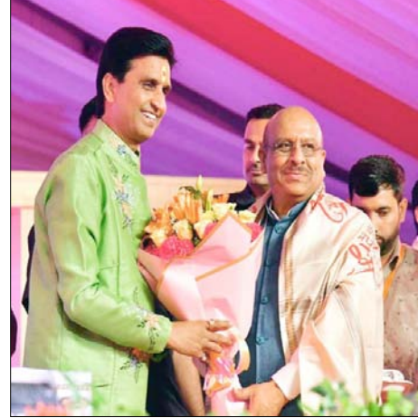
विधानसभा अध्यक्ष विजेंद्र गुप्ता राम कथा वक्ता डॉ. कुमार विश्वास का स्वागत करते हुए।

है कि आवासीय क्षेत्रों में व्यावसायिक गतिविधियां नहीं चलाई जा सकती। यदि ऐसा पाया गया तो दुकानों और कारोबार को सील किया जा सकता है। उन्होंने कहा कि इससे राजधानी के लाखों लोगों के सामने राजगार और आजीविका का संकट खड़ा हो गया है। कांग्रेस प्रदेश अध्यक्ष ने आरोप लगाया कि भाजपा शासित निगम राहत देने के बजाय अनधिकृत, नियमित और स्वीकृत कॉलोनियों में वर्षों से छोटे स्तर पर कारोबार कर रहे लोगों पर कार्रवाई की तैयारी कर रहा है।