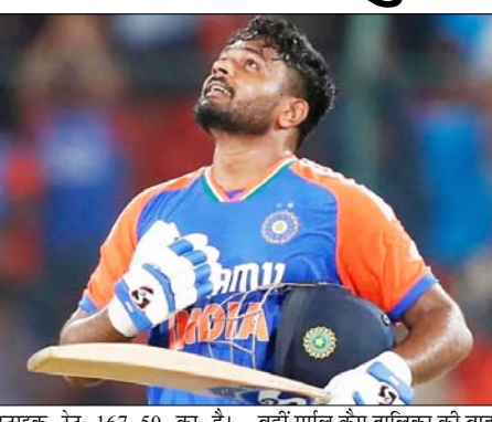
स्ट्राइक रेट 167-50 का है। बुधवार रात सनराइजर्स हैदराबाद का मुकाबला पंजाब किंग्स से होना है। ऐसे में अभिषेक शर्मा और क्लासन दोनों के पास टॉप स्थान तक पहुंचने का मौका रहेगा।

नई दिल्ली, वार्ता। चेन्नई सुपर किंग्स (सीएसके) के सलामी बल्लेबाज संजू सैमसन ने धीमी और टन ले रही दिल्ली की पिच पर 52 गेंदों में नाबाद 87 रन की मैच जिताऊ पारी खेलकर ऑरेंज कैप तालिका के शीर्ष पांच में जगह बना ली। सैमसन ने मंगलवार को दिल्ली कीपिटलस के खिलाफ यह कारनामा किया। उन्होंने गुजरात टाइटंस के वी साई सुदर्शन को पांचवें स्थान से हटाया। इसके साथ ही वह केएल राहुल, अभिषेक शर्मा, हाइनरिक क्लासन और वैभव सूर्यवंशी के साथ आईपीएल 2026 में 400 या उससे अधिक रन बनाने वाले बल्लेबाजों की सूची में शामिल हो गए। सैमसन को इस सीजन 10 पारियों में 402 रन हो गए हैं। उनका औसत 57-42 और