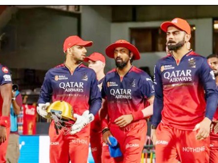
एलएसजी का अभियान लगातार पटरी से उतरता गया है, जिसने नौ मैचों में सिर्फ दो जीत हासिल की हैं। लखनऊ पंचाइजी के लिए सबसे ज्यादा चिंता की बात यह रही है कि वह घरेलू मैदान के फायदे का लाभ उठाने में नाकाम

लखनऊ, वार्ता। रॉयल चैलेंजर्स बेंगलुरु (आरसीबी) की टीम इंडियन प्रीमियर लीग (आईपीएल) 2026 में बुधवार को यहाँ भारत रत्न श्री अटल बिहारी वाजपेई इकाना क्रिकेट स्टेडियम में लखनऊ सुपर जायंट्स (एलएसजी) से भिड़ेगी। इस मुकाबले में आरसीबी की कोशिश टॉप-2 में अपनी जगह पक्की करने और एलएसजी की घरेलू मैदान पर चल रही खराब किस्मत को और गहरा करने की होगी। यह मुकाबला इस सीजन में दो ऐसी टीमों के बीच हो रहा है जो बिल्कुल अलग-अलग दिशाओं में आगे बढ़ रही हैं। आरसीबी इस टूर्नामेंट की सबसे संतुलित टीमों में से एक नजर आई है, जिसने अपने नौ में से छह मैच जीते हैं। वहीं,