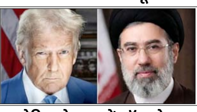
28 फरवरी को ईरान के खिलाफ शुरू किए गए आक्रामक सैन्य अभियान के सभी रणनीतिक लक्ष्य प्राप्त कर लिए गए हैं।

वाशिंगटन। अमेरिका ने आधिकारिक तौर पर घोषणा की है कि ईरान के खिलाफ चलाया गया प्रमुख सैन्य अभियान 'ऑपरेशन एपिक प्युरी' अब समाप्त हो गया है। वाइट हाउस में मंगलवार दोपहर 3:30 बजे के आसपास प्रेस ब्रीफिंग के दौरान विदेश मंत्री मार्को रूबियो ने स्पष्ट किया कि अमेरिका ने इस अभियान के अपने सभी सैन्य लक्ष्यों को सफलतापूर्वक प्राप्त कर लिया है। रूबियो ने स्पष्ट किया कि 28 फरवरी को ईरान के खिलाफ शुरू किए गए आक्रामक सैन्य अभियान के सभी रणनीतिक लक्ष्य प्राप्त कर लिए गए हैं।