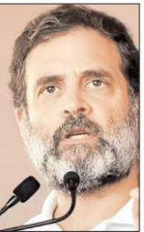
राहुल गांधी नेता विपक्ष, लोकसभा

वोट चोरी से कभी सीटें चुराई जाती हैं, कभी पूरी सरकार, लोकसभा में भाजपा के 240 सांसदों में से लगभग हर छठा सांसद वोट चोरी से जीता है, ऐसे लोगों को क्या भाजपा की भाषा में घुसपैठियाकहा जाना चाहिए, हरियाणा में तो वहां की पूरी सरकार ही 'घुसपैठिया' है, जो संस्थाओं को अपने नियंत्रण में रखते हैं और मतदाता सूचियों व चुनावी प्रक्रिया में हस्तक्षेप करते हैं, वे खुद रिमोट कंट्रोल से संचालित हैं, निष्पक्ष चुनाव होने पर सत्ताधारी दल 140 सीटों के आसपास भी नहीं पहुंच पाएगा।