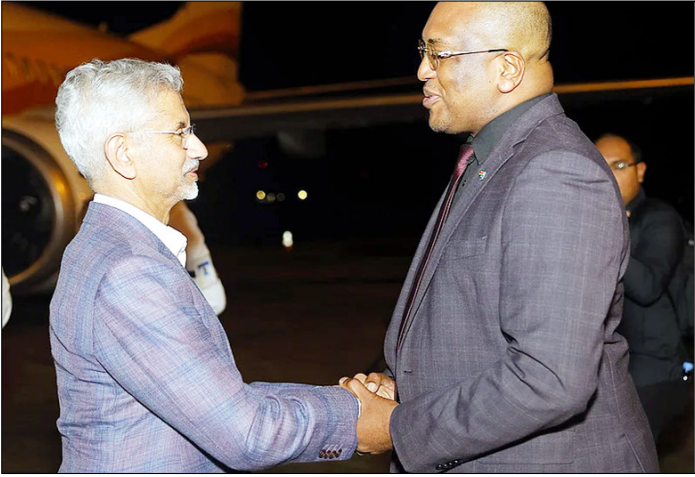
सूरीनाम। पारामरिबो पहुंचने पर विदेश मंत्री एस जयशंकर का स्वागत करते सूरीनाम के विदेश मंत्री मेरिवन बोवा।