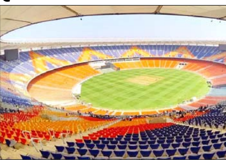
विजेता टीम सीधे फाइनल में जगह बनाएगी, बीसीसीआई ने प्लेऑफ मुकाबलों के शेड्यूल का ऐलान किया

मुम्बई, वार्ता। भारतीय क्रिकेट कंट्रोल बोर्ड (बीसीसीआई) ने बुधवार को कहा कि इंडियन प्रीमियर लीग (आईपीएल) 2026 का 31 मई को होने वाला फाइनल मुकाबला अहमदाबाद के नरेंद्र मोदी स्टेडियम में खेला जाएगा। बीसीसीआई ने इसी के साथ को प्लेऑफ मुकाबलों के शेड्यूल का ऐलान कर दिया। साथ ही प्लाईट टेबल की टॉप दो टीमों 26 मई को धर्मशाला के एचपीसीए स्टेडियम में क्वालिफायर वन खेलेंगी। इस मुकाबले की विजेता टीम सीधे फाइनल में जगह बनाएगी। इसके बाद प्लेऑफ का कारनामा न्यू चंडीगढ़ पहुंचेगा। 27 मई को न्यू इंटरनेशनल क्रिकेट स्टेडियम में एलिमिनेटर मैच