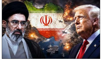
अमेरिका ईरानी प्रॉपर्टी लौटाएगा, ईरान होम्लुज स्ट्रेट खोलेगा, न्यूक्लियर प्रोग्राम रोकेगा

अमेरिका और ईरान युद्ध खत्म करने और परमाणु बातचीत का रास्ता तय करने के बेहद करीब पहुंच गए हैं। अमेरिकी वेबसाइट एक्सियोस की रिपोर्ट के मुताबिक ईरान 48 घंटे के भीतर सीजफायर को लेकर सहमत दे सकता है। दोनों देशों के बीच 14 प्वाइंट वाला समझौता (एमओयू) तैयार है। हालांकि अभी यह फाइनल नहीं हुआ है, लेकिन बातचीत पहले से ज्यादा आगे बढ़ चुकी है। समझौते की अहम शर्तें, सबसे पहले युद्ध खत्म करने की घोषणा होगी, 30 दिनों तक दोनों देशों की विस्तृत बातचीत होगी, इसमें