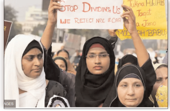
केरल में कुल 140 सीटें हैं। कांग्रेस के सिंबल पर यहां से 8 मुस्लिम जीते हैं। तमिलनाडु में कांग्रेस के सिंबल पर एक मुस्लिम जीतकर सदन पहुंचे हैं।

बंगाल में सबसे ज्यादा 36 मुस्लिम विधायक चुनकर विधानसभा पहुंचे हैं। केरलम से 35 मुस्लिम विधायकों ने जीत हासिल की है। असम के 22 विधायक ऐसे हैं, जो मुस्लिम समुदाय से ताल्लुक रखते हैं। इसी तरह तमिलनाडु से मुस्लिम समुदाय के 9 विधायक जीतकर सदन पहुंचे हैं। असम, बंगाल के विधानसभा चुनाव में जहां मुसलमानों का दबदबा कम हो गया है। वहीं केरल में मुस्लिम विधायकों की संख्या में बढ़ोतरी हुई है। चुनाव परिणाम के आंकड़ों के मुताबिक इस बार विपक्ष के मजबूत सपोर्ट के बावजूद असम और बंगाल में 15 मुस्लिम विधायक कम हो गए हैं।