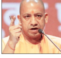
सफल संचालन के लिए 5.47 लाख कर्मचारियों की तैनाती जनगणना से प्राप्त सटीक आंकड़े आधारभूत संरचना, शिक्षा, स्वास्थ्य, सामाजिक सुरक्षा और जनकल्याणकारी योजनाओं के प्रभावी क्रियान्वयन में महत्वपूर्ण भूमिका निभाते हैं। सही जनगणना

शाह टाइम्स ब्यूरो लखनऊ। उत्तर प्रदेश के मुख्यमंत्री योगी आदित्यनाथ ने गुरुवार को जनगणना-2027 के प्रथम चरण का औपचारिक शुभारंभ करते हुए कहा कि जनगणना केवल जनसंख्या की गणना नहीं, बल्कि समग्र, समावेशी और सुनियोजित विकास का मजबूत आधार है। मुख्यमंत्री आवास पर आयोजित कार्यक्रम में उन्होंने 'हमारी जनगणना-हमारा विकास' के संकल्प के साथ मकान सूचीकरण एवं मकानों की गणना कार्य को शुरुआत की। उन्होंने कहा कि आज का दौर डेटा आधारित निर्णयों का है और