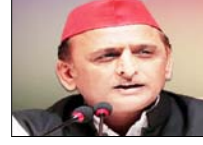
कोलकाता पहुंचकर सपा मुखिया ने ममता से की मुलाकात निवर्तमान मुख्यमंत्री को भवानामक समर्थन दिया। अखिलेश यादव कोलकाता में टीएमसी प्रमुख के आवास पर ममता और उनके भतीजे अभिषेक बनर्जी से मिले। ममता बनर्जी से मुलाकात के बाद अखिलेश यादव ने बीजेपी पर जमकर हमला बोला और कहा कि 'दीदी' हारी नहीं हैं। बीजेपी ने जो-जो बंगाल में किया है, यूपी में उसका पहले ट्रायल

कोलकाता, वार्ता बंगाल विधानसभा चुनाव में तुणमूल कांग्रेस की करारी हार के बाद समाजवादी पार्टी के प्रमुख अखिलेश यादव ने गुरुवार को कोलकाता पहुंचकर निवर्तमान मुख्यमंत्री ममता बनर्जी से मुलाकात की और कहा कि दीदी आप हारी नहीं हैं। बीजेपी और चुनाव आयोग ने लोकतंत्र को लूटा है। ममता के कालीघाट आवास पर हुई इस मुलाकात में अखिलेश ने कहा कि दीदी आप हारी नहीं हैं। उन्होंने ममता को उपहार भी भेंट किए। अखिलेश ने इस दौरान ममता के सांसद भतीजे व तुणमूल कांग्रेस के राष्ट्रीय महासचिव अभिषेक बनर्जी को गले लगाया। अखिलेश यादव ने पश्चिम बंगाल विधानसभा चुनावों में मिली करारी हार के बाद