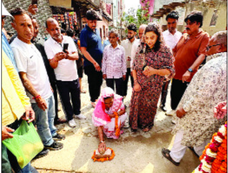
मेहनत के साथ अच्छी क्वालिटी का माल लगाकर आम जनता के लिये मजबूत व टिकाऊ कार्य करे जो कि लंबे समय तक चले जिससे आम जनमानस को चलने के लिये अच्छा मार्ग मिले। रंजीता धामा ने कालोनी की महिलाओं के साथ संवाद करते हुये कहा कि आप सभी मेरे

शाह टाइम्स संवाददाता लोनी। नगर पालिका अध्यक्ष रंजीता धामा ने विकास कार्यों का नारियल फाड़कर उद्घाटन किया। इस अवसर पर कालोनी वासियों ने रंजीता धामा का फूलमाला पहनाकर स्वागत किया। जानकारी देते हुए बताया कि आज वार्ड नंबर 25 कालोनी परमानंद विहार में 35 लाख रुपये की लागत से, व वार्ड 7 की गोविन्द टाउन कालोनी में लगभग सवा करोड़ रुपये, व वार्ड 19 अमित विहार में लगभग 22 लाख रुपये की लागत से इंटरलाकिंग टाइल्स व आरसीसी नाली का निर्माण कराया जायेगा। लोनी नगरपालिका अध्यक्ष रंजीता धामा ने मौके पर उपस्थित उकेदारों को निर्देश देते हुये कहा कि आप लोग