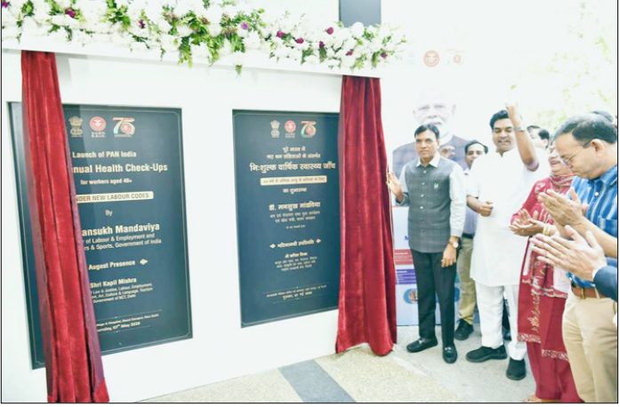
बसईं दारापुर में ईएसआईसी मेडिकल कॉलेज एवं अस्पताल का शुभारम्भ करते श्रम एवं रोजगार मंत्री कपिल मिश्रा।

है, इफ़ेक्टिव बनाना जा रहा है, कानून बनाए जा रहे हैं, उनमें प्रधानमंत्री जी का विशेष विजन रहा है। श्रम मंत्री ने कहा कि केंद्र सरकार के निर्देशों और सुझावों पर दिल्ली सरकार लगातार सुधारों पर कार्य कर रही है। दिल्ली की महिला श्रमिक बहनों के लिए बहुल सारे नियमों में परिवर्तन किए हैं। उन्हें 24 घंटे काम करने में जो कानूनी बाधाएँ आती थीं, उन सभी बाधाओं को दिल्ली सरकार ने दूर किया है। अब रात में भी दिल्ली की महिला श्रमिक बहनों चाहें तो विभिन्न प्रतिष्ठानों में काम कर सकती हैं।