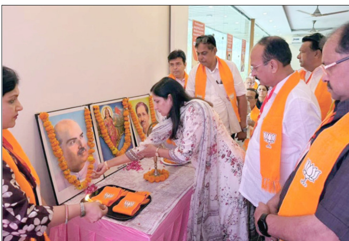
पं. दीनदयाल उपाध्याय महाप्रशिक्षण अभियान के अंतर्गत दिल्ली भाजपा के जिला स्तरीय प्रशिक्षण सत्र आज से शुरू हुआ।