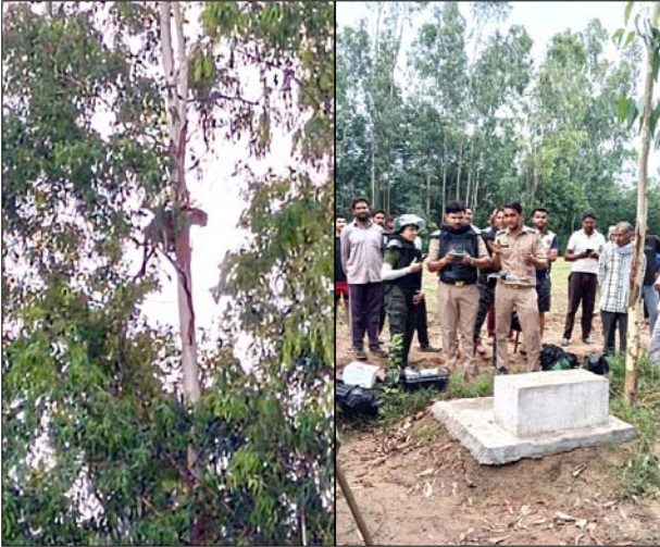
पेड़ पर चढ़ा तेंदुआ व मौके पर रेस्क्यू करती वन विभाग व पुलिस की टीम।

शाह टाइम्स संवाददाता बहसूमा। थाना क्षेत्र के गांव मोड़कला में उस वक्त दहशत का माहौल बन गया जब तेंदुआ पेड़ पर चढ़ते हुए देखा गया। जिसमें ग्रामीणों में दहशत का माहौल बन गया। ग्रामीणों ने पुलिस एवं वन विभाग को तेंदुआ होने की सूचना दी। सूचना पाकर मौके पर पहुंचे विभागीय कर्मचारियों ने तेंदुआ को पकड़ने की कोशिश की लेकिन तेंदुआ पेड़ से छलांग लगाते हुए खेतों की ओर दौड़ लगा दी। तेंदुआ होने की सूचना पर आसपास के गांव में अफरा-तफरी मची हुई है और ग्रामीण दहशत में हैं। वन विभाग की टीम ने अपनी सुझाव से रेस्क्यू करते हुए चारों ओर खेतों की ओर दौड़ लगा दी। तेंदुआ अपनी बेहोश करने वाली गन् की च्वाइंट से बेहोश करते हुए पकड़ लिया तथा जाल में कैद कर दिया जिससे ग्रामीण एवं वन विभाग की टीम में खुशी की लहर दौड़ गई।