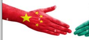
रिश्तों पर असर डाल सकता है बांग्लादेश का कदम

बीजिंग। बांग्लादेश की नई सरकार ने तीस्ता नदी परियोजना को लेकर चीन का समर्थन औपचारिक रूप से मांग लिया है। यह कदम भारत और बांग्लादेश के रिश्तों पर असर डाल सकता है। बुधवार को बीजिंग में बांग्लादेश के विदेश मंत्री खालिदुर रहमान और चीन के विदेश मंत्री वांग यी के बीच हुई बैठक में तीस्ता रिवर कामिप्रॉजेक्ट मैनेजमेंट एंड रिस्ट्रिक्शन प्रोजेक्ट पर चर्चा हुई। तीस्ता नदी पूर्वी हिमालय से निकल कर सिबिकम और पश्चिम बंगाल से गुजरते हुए बांग्लादेश में प्रवेश करती है। यह नदी बांग्लादेश में सिंचाई और लाखां लोगों की आजीविका का प्रमुख स्रोत मानी जाती है। बैठक में वांग यी ने नई बांग्लादेश सरकार के प्रति चीन का समर्थन जताते हुए कहा कि चीन, वेल्फे एंड