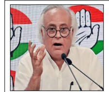
ऑपरेशन सिंदूर की पहली वर्षगांठ पर सरकार की नीतियों की आलोचना युद्धविराम की पहली घोषणा अमेरिकी विदेश मंत्री ने दस मई को की थी विभिन्न मंचों पर सैन्य अभियान रुकवाने का दावा दोहराया, लेकिन प्रधानमंत्री नरेंद्र मोदी ने सार्वजनिक रूप से कभी इस दावे के खंडन नहीं किया। रमेश ने कहा कि उसके बाद 30 मई को सिंगापुर में चीफ ऑफ डिफेंस स्टाफ जनरल अनिल चौहान ने स्वीकार किया था कि शुरुआती चरण में टैक्टिकल गलतियों के कारण भारत को नुकसान उठाना पड़ा, हालांकि बाद में रणनीतिक सुधार कर पाकिस्तान के भीतर सटीक कार्रवाई की गई। उन्होंने कहा कि 10 जून 2025 को जकार्ता में भारतीय दूतावास के डिफेंस

नई दिल्ली, वार्ता कांग्रेस ने ऑपरेशन सिंदूर की पहली वर्षगांठ पर सशस्त्र बलों की उपलब्धियों को नमन कर उस दौरान सरकार की नीतियों की आलोचना की है। कांग्रेस संचार विभाग के प्रभारी जयराम रमेश ने गुरुवार को यहां एक बयान में कहा कि आज ऑपरेशन सिंदूर के लॉन्च की पहली वर्षगांठ है और यह अवसर सशस्त्र बलों के साहस, पराक्रम और पेशेवर क्षमता को सम्मान देने का है, लेकिन इसके साथ ही कुछ महत्वपूर्ण तथ्यों को भुलाया नहीं जा सकता और उनको याद रखना भी जरूरी है। उन्होंने कहा कि पिछले वर्ष 10 मई को युद्धविराम की पहली घोषणा अमेरिकी विदेश मंत्री मार्को रबियो ने की थी और इसका श्रेय राष्ट्रपति डोनाल्ड ट्रम्प के हस्तक्षेप को दिया गया था। उनका कहना था कि उसके बाद ट्रम्प ने