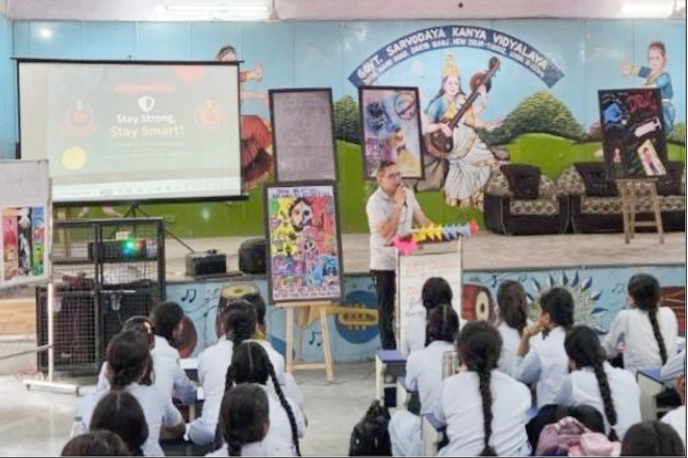
दिल्ली पुलिस की एंटी-नारकोटिक्स टास्क फोर्स ने दरियागंज इलाके में 'नशा मुक्त भारत अभियान' के तहत जागरूकता कार्यक्रम में भाग लेती छात्राएं।