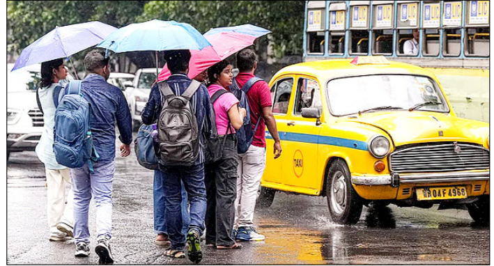
कोलकाता। बारिश के दौरान छाता लेकर चलते लोग।

वाशिंगटन। महत्वपूर्ण खिन्जों की आपूर्ति श्रृंखला को सुरक्षित करने और वैश्विक कृत्रिम बुद्धिमत्ता पारिस्थितिकी तंत्र के निर्माण के उद्देश्य से विकसित अंतर्राष्ट्रीय गठबंधन 'पैक्स सिलिका' में नॉर्वे आधिकारिक तौर पर शामिल हो गया है। पैक्स सिलिका के सदस्य के रूप में नॉर्वे विविध महत्वपूर्ण खिन्ज आपूर्ति श्रृंखलाओं को विकसित करने में अग्रणी भूमिका निभाएगा। अमेरिका में नॉर्वे की राजदूत अन्निकेन हूडफेल्ड ने वाशिंगटन डीसी में 'पैक्स सिलिका' का घोषणापत्र पर हस्ताक्षर किए। इसके साथ ही नॉर्वे इस पहल में शामिल होने वाला 15वां देश बन गया है। इस गठबंधन में ऑस्ट्रेलिया, फिनलैंड, भारत, इजरायल, जापान, फिलीपींस, कतर, दक्षिण कोरिया, सिंगापुर, स्वीडन, संयुक्त अरब अमीरात, ब्रिटेन और अमेरिका जैसे देश पहले से शामिल हैं।