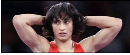
विनेश फोगाट एशियन गेम्स 2026 के सिलेक्सन ट्रायल के लिए अयोग्य: WFI खेल टाइम्स