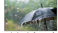
पड़ने की उम्मीद है। असम और मेघालय में भी भारी बारिश का अलर्ट जारी किया गया है। दिल्ली-एनसीआर में मौसम विभाग ने गुरुवार को खासकर दोपहर और शाम के समय हल्की आंधी और बिजली कड़कने का अनुमान जताया है। उत्तर, दक्षिण, पश्चिम दिल्ली, शाहदरा और नई दिल्ली जैसे इलाकों में बादल छाए रह सकते हैं और कहीं-कहीं धूल भी आंधी चल सकती है। दिल्ली से सटे शहरों जैसे गुरुग्राम, नोएडा, गाजियाबाद और फरीदाबाद में भी हल्की बारिश और तेज हवाएं चलने की संभावना है। मौसम विशेषज्ञों का कहना है कि यह राहत बस कुछ समय के लिए है। इसके बाद तापमान में तेजी से बढ़ोतरी होगी। वीकेंड (शनिवार-रविवार) तक दिल्ली का पारा 40 डिग्री सेल्सियस के करीब पहुंच सकता है।

नई दिल्ली, वार्ता मौसम विभाग ने 7 मई से 12 मई के बीच देश के कई राज्यों के लिए चेतावनी जारी की है। उत्तर, पूर्व और दक्षिण भारत में बदलते मौसम के कारण आंधी-तूफान, भारी बारिश और तेज हवाएं चलने के साथ-साथ तापमान में भी बढ़ोतरी हो सकती है। आईएमडी के अनुसार आने वाले दिनों में कम से कम 13 राज्यों में मौसम खराब रहने की आशंका है। उत्तर-पश्चिम भारत में आंधी और तेज हवाएं चल सकती हैं, जबकि दक्षिण और पूर्वोत्तर राज्यों में बिजली कड़कने के साथ भारी बारिश हो सकती है। मौसम विभाग ने बताया कि पंजाब, हरियाणा, हिमाचल प्रदेश, उत्तराखंड, उत्तर प्रदेश और राजस्थान के कुछ हिस्सों में 50 से 60 किमी प्रति घंटे की रफ्तार से हवाएं चल सकती हैं और आंधी आ सकती है। कुछ इलाकों में हवा की रफ्तार इससे भी ज्यादा होने की संभावना है। वहीं कर्नाटक, तमिलनाडु और पुडुचेरी में भारी बारिश और गरज के साथ बौझरें