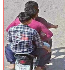
5804 है। जबकि पंजाब पुलिस द्वारा इसी नंबर की मोटर साइकिल का चालान किया गया। बताया गया कि मोटर साइकिल चालक तीन सवारी बैठा कर

विना हैलमेट वाहन चला रहा था, जिसके चलते दो अलग-अलग ई-चालान जारी किए गए। पहला चालान एक हजार रुपए का नंबर पीबी 4281103250407011860 सात अप्रैल 2025 को सुबह काटे गया। जिसकी राशि 1000 रुपये की गई। वहीं दूसरा चालान नंबर पीबी 4281103250327122150 सप्ताईस मार्च 2025 को सुबह काटा गया। जिसकी राशि भी 1000 रुपये बताई गई है। दोनों चालान तीन सवारी बैठाकर वाहन चलाने के आरोप में किए गए हैं।