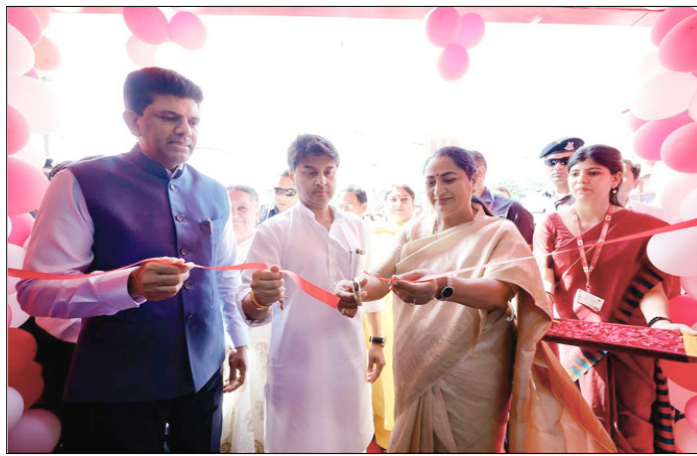
मुख्यमंत्री रेखा गुप्ता नेहरू प्लेस स्थित पुनर्विकसित पोस्ट ऑफिस 'जन सेवा कनेक्ट' के उद्घाटन कार्यक्रम में केंद्रीय संचार मंत्री ज्योतिरादित्य सिंधिया व केंद्रीय संचार राज्य मंत्री डॉ. पेम्मासांनी चंद्रशेखर के साथ।

"मिशन पंजाब" का हिस्सा हैं। उन्होंने आरोप लगाया कि पंजाब में भय और तनाव का माहौल बनाकर राजनीतिक लाभ लेने की कोशिश की जा रही है। संजय सिंह ने कहा कि भाजपा का उद्देश्य राज्य के सामाजिक सौहार्द और शांति को प्रभावित करना है। उन्होंने कहा कि वर्ष 2017 के विधानसभा चुनाव से पहले भी इसी तरह की घटनाएं सामने आई थीं, जब राज्य में शिरोमणि अकाली दल और भाजपा की सरकार थी। उस समय हुए मौल विस्फोट मामले का आज तक पूरी तरह खुलासा नहीं हो पाया।