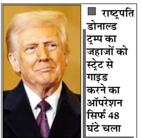
राष्ट्रपति डोनाल्ड ट्रम्प का जहाजों को स्ट्रेट से गाइड करने का ऑपरेशन सिर्फ 48 घंटे चला

दुबई। अमेरिका के राष्ट्रपति डोनाल्ड ट्रम्प ने हाल ही में होमजुज स्ट्रेट में फंसे जहाजों के ट्रांजिट के लिए प्रोजेक्ट फ्रीडम की शुरुआत की थी। हालांकि, अमेरिकी मीडिया ने बताया कि होमजुज में 1600 के करीब जहाज फंसे हुए हैं और ट्रम्प का प्रोजेक्ट फ्रीडम 48 घंटे तक ही टिक पाया। अमेरिकी मीडिया सीएनएन के अनुसार, लगभग 1600 जहाज अब भी होमजुज स्ट्रेट के पास फंसे हुए हैं, शिपिंग कंपनियों को एक महंगी और जोखिम भरी स्थिति का सामना करना पड़ रहा है। वे दो महीने से ज्यादा समय से पानी के रास्ते से निकलने का मौका ढूँढ रही हैं। राष्ट्रपति डोनाल्ड ट्रम्प का जहाजों को स्ट्रेट से गाइड करने का ऑपरेशन सिर्फ 48 घंटे चला।