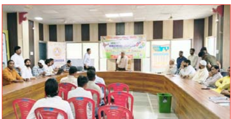
परिवार की जानकारी सरकारी पोर्टल पर दर्ज कर सकेंगे। उन्होंने अभियान की सफलता के लिए जन-जागरूकता को महत्वपूर्ण बताया। उन्होंने कर्मचारियों को वाई स्तर पर जागरूकों को जागरूक करने के निर्देश दिए। उन्होंने कहा कि सरकारी

शाह टाइम्स संवाददाता नहतौर। जनगणना-2027 को लेकर नगर पालिका के सभागार में बैठक आयोजित की गई। ईओ ने कहा कि बैठक का उद्देश्य स्व-गणना अभियान को सफल बनाना था। यह अभियान जनगणना को सुव्यवस्थित और डिजिटल रूप से संपन्न करने के लिए शासन के निर्देशों के तहत चलाया जा रहा है। बैठक का संचालन अधिशासी अधिकारी ओम गिरी ने किया। उन्होंने बताया कि जनगणना-2027 पिछली गणनाओं से अलग और अधिक आधुनिक होगी। इसमें स्व-गणना की सुविधा दी गई है, जिससे नागरिक स्वयं अपने और अपने