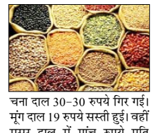
रुपये प्रति क्विंटल सस्ता हुआ। वनस्पति 41 रुपये और मूंगफली तेल 39 रुपये फिसल गया। सोया तेल की औसत कीमत 32 रुपये और सूरजमुखी तेल की 23 रुपये बढ़ गई। पाम ऑयल 13 रुपये प्रति क्विंटल महंगा हुआ। मोटे के बाजार में आज गुड़ का औसत भाव 13 रुपये प्रति क्विंटल टूट गया। चीनी पिछले कारोबारी दिवस के स्तर पर पड़ी रही। सरकारी वेबसाइट पर जारी खाद्यान्नों के दिन के औसत थोक भाव इस प्रकार रहे: दाल-दलहन: दाल चना 7646.58 रुपये, मसूर काली 8105.63 रुपये, मूंग दाल 10140.90 रुपये, उड़द दाल 10808.99 रुपये, तुअर दाल 11238.47 रुपये प्रति क्विंटल रही।

नई दिल्ली, वार्ता घरेलू थोक जिंस बाजारों में गुरुवार को चावल का औसत भाव टूट गया। चावल के साथ गेहूं में भी नरमी देखी गई। चीनी की कीमत पिछले कारोबारी दिवस पर ही स्थिर रही जबकि दालों और खाद्य तेलों में घट-बढ़ का रुख रहा। औसत दर्जे के चावल की औसत कीमत 22 रुपये गिरकर 3,848 रुपये प्रति क्विंटल रह गयी। गेहूं 11 रुपये सस्ता हुआ और 2,780 रुपये प्रति क्विंटल बोला गया। आटे की कीमत भी नौ रुपये उतर गई। दाल-दलहन में उतार-चढ़ाव रहा। उड़द दाल की औसत कीमत 36 रुपये प्रति क्विंटल टूट गई। तुअर दाल और