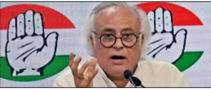
ऑपरेशन सिंदूर: कांग्रेस ने सरकार की नीतियों की आलोचना की

नई दिल्ली, मुजफ्फरनगर, देहरादून, हल्द्वानी, मुदाबाद, बरेली, मेरठ व लखनऊ से प्रकाशित