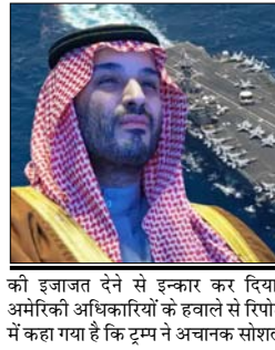
क्राउन प्रिंस की नाराजगी के बाद टम्प ने होर्मुज से जहाजों का रेस्क्यू रोकना

दुबई, वार्ता अमेरिका ने 4 मई को होर्मुज स्ट्रेट में जहाजों की आवाजाही शुरू करने के लिए 'प्रोजेक्ट फ्रीडम' शुरू किया था। हालांकि एक दिन बाद ही टम्प ने इसे रोकने का आदेश दिया। अब टम्प ने कहा था कि पाकिस्तान के कहने पर उन्होंने यह ऑपरेशन रोकना है।