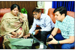
विवरण अपलोड किया। स्वगणना को लेकर जिला प्रशासन के अलावा जनप्रतिनिधि भी आगे आकर न सिर्फ नागरिकों को प्रेरित कर