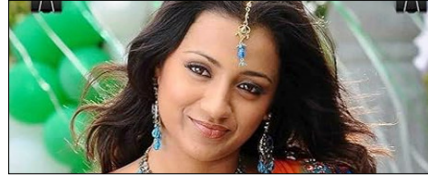
विजय थलापति का नाम सुन शरमाई तृष्णा कृष्णन बॉलीवुड