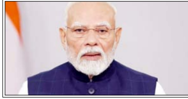
■ भारत आज 'असीम आकांक्षाओं' और 'असीम प्रयासों' के साथ दुनिया की अग्रणी अर्थव्यवस्था बनने की दिशा में तेजी से आगे बढ़ रहा है: पीएम

भारतीय समुदाय को संबोधित करते हुए उन्होंने उन लोगों को दोनों देशों के संबंधों की असली ताकत तथा जीवंत सेतु करार दिया और कहा कि सरकार ने सूरीनामी हिंदुस्तानी समाज के लिए ओसीआईआई कार्ड पात्रता चौथी पीढ़ी से बढ़ाकर छठी पीढ़ी तक कर दी है। मोदी ने आर्थिक, प्रौद्योगिकी क्षेत्र और लो. कर्तांत्रिक उपलब्धियों को रेखांकित किया तथा उन लोगों से भारत-नीदरलैंड संबंधों को नई ऊंचाई देने का आह्वान किया। उन्होंने कहा कि भारत आज 'असीम आकांक्षाओं' और 'असीम प्रयासों' के साथ दुनिया की अग्रणी अर्थव्यवस्था बनने की दिशा में तेजी से आगे बढ़ रहा है। उन्होंने कहा कि नीदरलैंड के