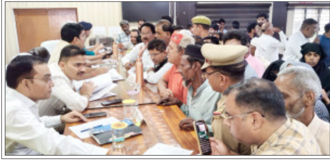
सम्भल। सम्पूर्ण समाधान दिवस में फरियादियों की समस्याओं का समाधान करते डीएम व एएसपी