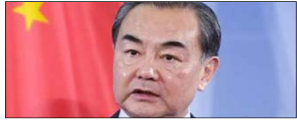
चीनी विदेश मंत्री वांग ई ने ट्रम्प को दी कड़ी चेतावनी पेज 11