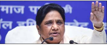
आंधी-तूफान पीड़ितों की पूरी उदारता से मदद करे सरकार: मायावती पेज 2

नई दिल्ली, मुजफ्फरनगर, देहरादून, हल्द्वानी, मुरादाबाद, बरेली, मेरठ व लखनऊ से प्रकाशित