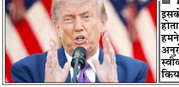
■ मैं वास्तव में इसके पक्ष में नहीं हूँ, लेकिन हमने इसे पाक के अनुरोध को स्वीकार करते हुए किया: ट्रम्प

एयर फोर्स वन। अमेरिकी राष्ट्रपति डोनाल्ड ट्रम्प ने कहा है कि पश्चिम एशिया में शत्रुता को समाप्त करने के लिए राजनयिक मार्ग खोलने के उद्देश्य से ईरान के साथ किया गया युद्धविराम समझौता 'पाकिस्तान के अनुरोध पर' किया गया था।