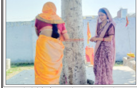
बबराला-पति की दीर्घायु को वट वृक्ष की पूजा करती सुहागिन महिलाएं।