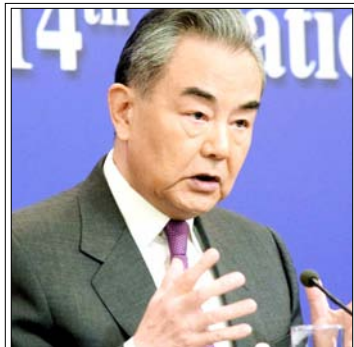
■ दुनिया की दो सबसे बड़ी अर्थव्यवस्थाएँ होने के नाते चीन और अमेरिका एक-दूसरे के बिना काम नहीं कर सकते

चीन-अमेरिका टकराव दोनों देशों और पूरी दुनिया के लिए विनाशकारी साबित हो सकता है: वांग इं