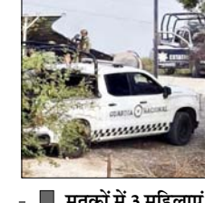
मृतकों में 3 महिलाएं और एक बच्चा, हमलावर फरार, अगले महीने मेक्सिको में फूटबाल वर्ल्ड कप होना है

मेक्सिको सिटी। मेक्सिको के पुएब्ला राज्य में एक बड़े गोलीकांड में 10 लोगों की मौत हो गई। राज्य सरकार ने पुष्टि की कि मरने वालों में छह पुरुष, तीन महिलाएं और एक नाबालिग शामिल है। अधिकारियों ने अभी तक किसी पीड़ित का नाम सार्वजनिक नहीं किया है। अधिकारियों के मुताबिक, पड़ोसियों ने गोलीयों की आवाज सुनने के बाद पुलिस को सूचना दी। पुलिस जब मौके पर पहुंची तो घर के अंदर कई लोग गोली लगने से घायल मिले। एक महिला को अस्पताल ले जाया जा रहा था, लेकिन रास्ते में उसकी मौत हो गई। तेहुइलिंगो करीब 11300 आबादी वाला शहर है, जो मेक्सिको सिटी से लगभग 208 किमी पर है। मेक्सिको 11 जून से फीफा वर्ल्ड कप की सह-मेजबान बनने जा रहा है। मेक्सिको सिटी, मन्ट्रेरी और ग्वाडालाहरा में 13 मैच खेले जाएंगे। राष्ट्रपति क्लॉडिया शौनबाम 1 लाख सुरक्षा कर्मियों की तैनाती का एलान कर चुकी हैं। पुएब्ला सरकार ने कहा कि पीड़ितों पर हथियारबंद लोगों ने हमला किया। अब तक किसी गिरफ्तारी की जानकारी नहीं दी गई है। हमले की वजह भी सफा नहीं है। अधिकारी मामले की जांच