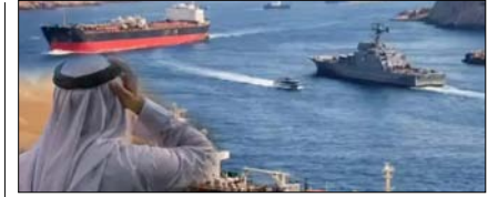
होर्मुज स्ट्रेट बंद होने से कतर का गैस निर्यात ठप