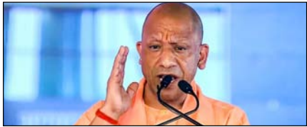
उत्तम में पंचायत चुनाव के लिए पिछड़ा वर्ग आयोग गठित

नई दिल्ली, मुजफ्फरनगर, देहरादून, हल्द्वानी, मुरादाबाद, बरेली, मेरठ व लखनऊ से प्रकाशित