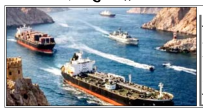
युद्ध और तनाव की खबरों ने पर्यटन और कारोबार पर भी असर डाला

दोहा। कतर फारस की खाड़ी में मौजूद एक छोटा-सा रिंगस्तानी देश था, जहां ज्यादातर लोग मोती निकालने और समुद्र से जुड़े छोटे-मोटे कारोबार पर निर्भर थे। फिर प्राकृतिक गैस ने इस देश की किस्मत पूरी तरह बदल दी। कतर ने 90 के दशक में बड़े पैमाने पर एलएनजी यानी लिक्विफाइड नैचुरल गैस बनाकर उसे होर्मुज स्ट्रेट के जरिए दुनियाभर में भेजना शुरू किया। इससे उसे हर साल अरबों डॉलर की कमाई होने लगी। सिर्फ 30 साल में वह दुनिया के सबसे अमीर देशों में शामिल हो गया, लेकिन 28 फरवरी के बाद अचानक सब बदल गया। जंग शुरू होने के बाद होर्मुज स्ट्रेट बंद हो गया और कतर की दुनिया तक पहुंच लगभग कट गई है। युद्ध और तनाव की खबरों ने पर्यटन और कारोबार पर भी असर डाला है। इससे उसे हर महीने का खतरा बढ़ गया है। भारत भी कतर से भारी मात्रा में प्राकृतिक गैस खरीदता है। अलग-अलग रिपोर्टों के मुताबिक, भारत की कुल एलएनजी आयात का करीब 40 प्रतिशत से 47 प्रतिशत हिस्सा कतर से आया है। कतर में 1971 में नार्थ फोल्ड नाम का विशाल गैस भंडार मिला था। इसे दुनिया के सबसे बड़े प्राकृतिक गैस भंडारों में गिना जाता है। तब दुनिया में ज्यादातर देशों तक गैस पाइपलाइन के जरिए पहुंचाई जाती थी। समस्या यह थी कि कतर एक छोटा-सा खाड़ी देश है और उससे सीधे यूरोप या एशिया तक पाइपलाइन बिछाना बेहद महंगा और मुश्किल था। तब कतर ने एक बड़ा