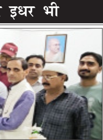
सम्भल-हाई और लो वोल्टेज समस्या के विरोध में ज्ञापन देते सपाइयों।