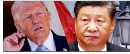
चीन से खाली हाथ लौटे ट्रम्प, नहीं बोल पा रहे हैं खुलकर सम्पादकीय