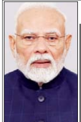
मुझे विश्वास है कि भारत व स्वीडन साझेदारी एक अधिक समृद्ध और भविष्य-दृष्टि संपन्न विश्व के निर्माण में सार्थक योगदान देगी: पीएम

गोथेनबर्ग (स्वीडन)। प्रधानमंत्री नरेंद्र मोदी ने कहा है कि भारत और स्वीडन के बीच सुरक्षा, आर्थिक, प्रौद्योगिकी और नवाचार सहित छह क्षेत्रों में हुए समझौतों और घोषणाओं से भारत-स्वीडन संबंधों को नई ऊर्जा और गति मिलेगी। स्वीडन की यात्रा पर गए मोदी ने रविवार देर रात स्वीडन के प्रधानमंत्री उल्फ क्रिस्टर्सन के साथ द्विपक्षीय वार्ता की जिसके बाद दोनों देशों ने छह क्षेत्रों में सहयोग की घोषणा और समझौते किए। मोदी ने सोमवार को सोशल मीडिया पर एक पोस्ट में विश्वास व्यक्त किया कि भारत-स्वीडन साझेदारी एक अधिक समृद्ध और भविष्य-दृष्टि संपन्न विश्व के निर्माण में सार्थक योगदान देगी। इन समझौतों और घोषणाओं के तहत दोनों देशों ने अपने संबंधों को रणनीतिक साझेदारी के स्तर तक ले जाने का निर्णय लिया है। इसके अंतर्गत स्थिरता और सुरक्षा के लिए दोनों देश रणनीतिक संवाद करेंगे। उनके बीच अगली पीढ़ी की आर्थिक