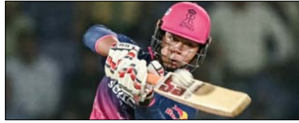
सूर्यवंशी एक सीजन में सबसे ज्यादा सिक्स लगाने वाले भारतीय खेल टाइम्स