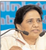
श्रीश्री मायावती, अध्यक्ष बहुजन समाज पार्टी

सरकारों को ऐसा कुछ नहीं करना चाहिए, जिससे संकीर्ण राजनीति, धार्मिक भेदभाव या जातीय द्वेष का आरोप लगे, भारत की दुनिया भर में अच्छी और अनोखी मानवतावादी पहचान बाबा साहेब डा. भीमराव अम्बेडकर के संविधान से है, जो पूरी तरह धर्मनिरपेक्षता के सिद्धांत पर आधारित है। संविधान सभी धर्मों के लोगों को एक-समान आदर-सम्मान, जान-माल और मजहब की आजादी की सुरक्षा सुनिश्चित करता है, उच्च न्यायालय के निर्देशों के बाद सरकारों को अराजकता के विरुद्ध सख्त हो जाना चाहिए, ताकि किसी भी सरकार पर संकीर्ण राजनीति, धार्मिक भेदभाव, जातीय द्वेष व पक्षपात का दोष न लगे। यह अति-चिंता की बात होनी चाहिए, जनहित में बनाए गए कानूनों का अनुपालन सभी धर्मों के लोगों पर एक समान रूप से होना चाहिए, संविधान और कानून की मान-मर्यादा बनाए रखना जरूरी है।