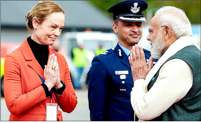
नॉर्वे। ओस्लो पहुंचने पर प्रधानमंत्री नरेंद्र मोदी का स्वागत करते हुए।

ट्रम्प ने चीन से 17 अरब डॉलर के वार्षिक कृषि उत्पाद खरीदने का वादा किया वाशिंगटन। अमेरिका और चीन ने एक समझौते पर हस्ताक्षर किए हैं जिसके तहत चीन ने अगले तीन वर्षों तक प्रतिवर्ष कम से कम 17 अरब अमेरिकी डॉलर मूल्य के अमेरिकी कृषि उत्पाद खरीदने की प्रतिबद्धता जताई है। यह अक्टूबर 2025 में की गई सोयाबीन संबंधी पूर्व प्रतिबद्धताओं के अतिरिक्त है। व्यापार के अलावा यह समझौता दो नए द्विपक्षीय तंत्रों, अमेरिका-चीन व्यापार बोर्ड और अमेरिका-चीन निवेश बोर्ड की स्थापना भी करता है, जिनका उद्देश्य राष्ट्रपति ट्रम्प की चीन यात्रा के बाद आर्थिक समन्वय को मजबूत करना है। दोनों पक्षों ने ईरान, उत्तर कोरिया और होमजुंग जलजलमरुमध्य सहित प्रमुख भू-राजनीतिक मुद्दों पर भी सहमति के संकेत दिए हैं।