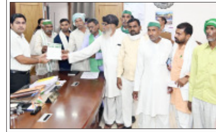
सम्भल- भूमि अधिग्रहण से पूर्व समस्याओं के निराकरण की मांग को ज्ञापन देते।

सम्भल। औद्योगिक गलियारों के लिए भूमि अधिग्रहण से पूर्व भारतीय किसान यूनियन असली सामने खड़ी हो गयी है। भाकियू नेताओं ने जिलाधिकारी को ज्ञापन सौंपकर अधिग्रहण से पूर्व विभिन्न समस्याओं का निराकरण करने की मांग की है। गंगा एकसुप्रसवे के चालू होने के बाद औद्योगिक गलियारों की कवायद तेज हो गयी है। औद्योगिक गलियारों के लिए प्रस्तावित ग्रामों में भूमि अधिग्रहण की प्रक्रिया की जानी है लेकिन अधिग्रहण प्रक्रिया पूरी करने से पहले भारतीय किसान यूनियन असली की ओर से डीएम को ज्ञापन देकर किसानों की विभिन्न समस्याओं का निराकरण करने की