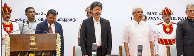
थाई वलथु' सबसे आखिर में बजाया गया। पिछली सरकारों में ये हमेशा पहले बजाया जाता था। तमिलनाडु में सीएम विजय की कैबिनेट का विस्तार हुआ, जिसमें 23 विधायकों ने मंत्री पद की शपथ ली। इनमें दो कांग्रेस के विधायक भी शामिल हैं।