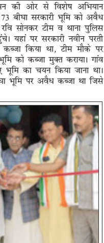
सम्भल-पिशान इंटरनेशनल एकेडमी में समर कैम्प का उदघाटन करते।