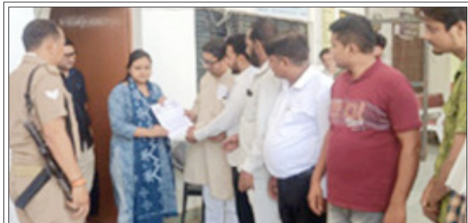
सम्भल। लखनऊ में वकीलों पर लाठीचार्ज के विरोध में एसडीएम को ज्ञापन देते आजाद अधिकार सेना के कार्यकर्ता।

सम्भल। लखनऊ में अधिक्ताओं के साथ की गई बर्बरता का विरोध और तेज होता जा रहा है। समाज सेवी संस्थाओं के साथ राजनैतिक दल भी इसके विरोध में खड़े होने लगे हैं। पूर्व आईपीएस की आजाद अधिकार सेना के कार्यकर्ताओं की ओर से उपजिलाधिकारी कारी को ज्ञापन सौंपकर वकीलों पर की गई लाठीचार्ज का विरोध किया गार महामहिम राष्ट्रपति को ज्ञापन भेजकर अधिवक्ताओं की सुरक्षा व संरक्षण को अधिवक्ता संरक्षण अधिनियम लागू करने की मांग की। आजाद अधिकार सेना के