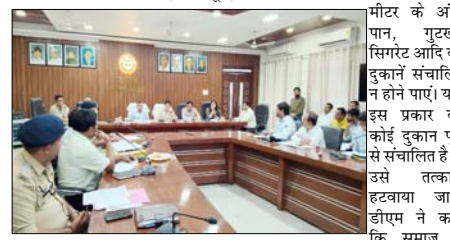
पान, गुटखा, सिगरेट आदि की दुकानें संचालित न होने पाएँ। यदि इस प्रकार की कोई दुकान पूर्व से संचालित है तो उसे तत्काल हटवाया जाए। डीएम ने कहा कि समाज में विशेषकर नवयुवकों में बढ़ रही नशे की कुप्रवृत्ति पर अंकुश लगाने तथा इस तरह के अवैध व्यापार में सलिलियन व्यक्तियों के विरुद्ध अभियान चलाकर कार्यावाही की जाए। नुकसं नोट आदि का आयोजन कराकर जनता को जागरूक किया जाए। उन्होंने कहा कि नशाले पदार्थों के सेवन से विशेष रूप से नवयुवकों का भविष्य अंधकारमय हो रहा है और उनका जीवन उद्देश्यहीन होता जा रहा है।

मुरादाबाद। जिलाधिकारी डॉ. राजेंद्र पेंसिया और वरिष्ठ पुलिस अधीक्षक सतपाल अंतिल को उपस्थित में कलेक्ट्रेट सभागार में एनकार्ड संबंधी बैठक सम्पन्न हुई। बैठक में नशा मुक्त भारत अभियान को लेकर अधिकारियों को विस्तृत दिशा-निर्देश दिए गए। जिलाधिकारी ने बेमिफ शिक्षा और उच्च शिक्षा विभाग के अधिकारियों को निर्देश दिए कि स्कूल, कॉलेजों के आस-पास कम से कम 100 मीटर के अंतर