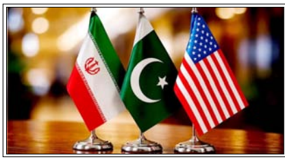
ईरान अमेरिका के साथ अच्छी नीयत से बातचीत कर रहा है, लेकिन उसे अमेरिका पर अब भी गहरा शक है: बघाई

तेहरान। अमेरिका ने पश्चिम एशिया संघर्ष को स्थाई रूप से खत्म करने के लिए पाकिस्तान के जरिये नया युद्धविराम प्रस्ताव भेजा है। अल अरबिया की रिपोर्ट के मुताबिक, इस मामले से जुड़े कूटनीतिक सूत्रों ने यह जानकारी दी है। ईरान इस प्रस्ताव की समीक्षा कर रहा है, लेकिन अब तक उसने कोई आधिकारिक जवाब नहीं दिया है। दोनों पक्षों के बीच मतभेद कम करने के लिए मध्यस्थ लगाने का प्रयास किया जा रहा है। इसी बीच, पाकिस्तान के सेना प्रमुख आसिम मुनीर ने ईरान यात्रा का प्लान बनाया है। इससे पहले ईरान के विदेश मंत्रालय के प्रवक्ता इस्माइल बघाई ने कहा था कि ईरान अमेरिका के साथ अच्छी नीयत से बातचीत कर रहा है, लेकिन उसे अमेरिका पर अब भी गहरा शक है। ईरान के सरकारी मीडिया प्रेस टीवी के मुताबिक, बघाई ने कहा कि ईरान को उसके 14 सूत्रीय प्रस्ताव पर अमेरिका का जवाब मिल गया है और उसकी समीक्षा की जा रही है। उन्होंने बताया कि पाकिस्तान के गृह मंत्री मोहसिन नकवी की तेहरान यात्रा का मकसद दोनों पक्षों के बीच बातचीत को आसान बनाना है। बघाई ने कहा कि इस समय हमारी प्राथमिकता लेबनान समेत सभी मोर्चों पर युद्ध खत्म करना है। ईरान ने अपनी मुख्य मांगों में जमा फंड जारी करने, समुद्री रास्तों में कथित