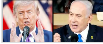
कतर, सऊदी अरब और यूएई जैसे खाड़ी देशों की अपील पर यह फैसला लिया गया: ट्रम्प

नेल अविव/वाशिंगटन। ईरान युद्ध को लेकर अमेरिकी राष्ट्रपति डोनाल्ड ट्रम्प और इजरायली प्रधानमंत्री बेजायिन नेतन्याहू के बीच मतभेद खुलकर सामने आ गए हैं। एक रिपोर्ट के मुताबिक, नेतन्याहू चाहते हैं कि ईरान पर हमले जारी रहें, जबकि ट्रम्प फिलहाल बातचीत और डील को मौका देना चाहते हैं। रिपोर्ट के मुताबिक, मंगलवार को दोनों नेताओं के बीच करीब एक घंटे तक फोन पर बातचीत हुई। अमेरिकी अधिकारी ने बताया कि नेतन्याहू ने ट्रम्प से कहा कि ईरान पर प्रस्तावित हमले रोकना गलती है और सैन्य कार्रवाई जारी रहनी चाहिए। ट्रम्प ने नेतन्याहू को बताया था कि अमेरिका ईरान पर नए टारगेट हमले की तैयारी कर रहा है। इस ऑपरेशन को 'ऑपरेशन स्लेजहैमर' नाम दिया जाना था, लेकिन करीब 24 घंटे बाद ट्रम्प ने घोषणा कर दी कि मंगलवार के लिए तय हमलों को फिलहाल रोक दिया गया है। ट्रम्प ने कहा कि कतर, सऊदी अरब और यूएई जैसे खाड़ी देशों को