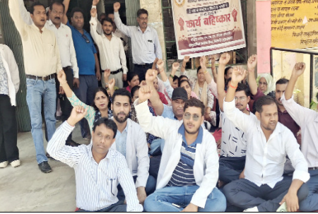
कार्य बहिष्कार शुरू कर दिया है। कर्मचारियों ने आरोप लगाया कि माचं और अप्रैल 2026 का मानदेय अब तक जारी नहीं किया गया है, जबकि मई माह भी समाप्त हो चुका है। इससे कर्मचारियों और उनके परिवारों के

शाह टाइम्स ब्यूरोद्वारा। उत्तर प्रदेश राष्ट्रीय स्वास्थ्य मिशन संविदा कर्मचारियों के मानदेय न मिलने पर एनएचएम संविदा कर्मचारियों ने लंबित मानदेय भुगतान को मांग को लेकर