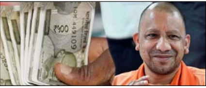
यूपी के कर्मचारियों-पेंशनरों को राहत, डीए 2 प्रतिशत बढ़ा

नई दिल्ली, मुजफ्फरनगर, देहरादून, हल्द्वानी, मुरादाबाद, बरेली, मेरठ व लखनऊ से प्रकाशित