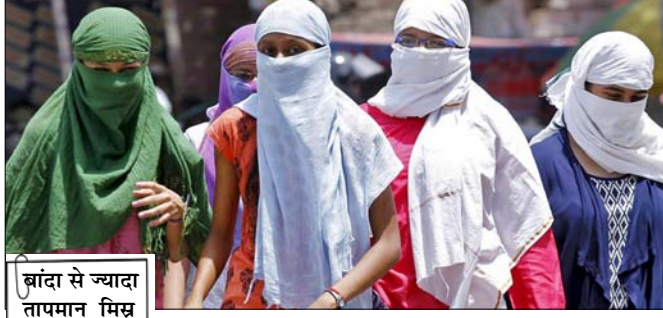
बांदा से ज्यादा तापमान मिस्त्र के असवान में 49.4 डिग्री और सऊदी के अराफात में 48.4 डिग्री सेल्सियस रहा

नई दिल्ली। 25 मई से नौतपा शुरू हो रहा है, लेकिन उससे पहले ही तापमान 48 डिग्री सेल्सियस पहुंच गया है। यह अंडाऊ उत्तर प्रदेश के बांदा में रिकॉर्ड हुआ। तापमान के लिहाज से 20 मई को बांदा दुनिया का तीसरा सबसे गर्म शहर रहा। बांदा से ज्यादा तापमान केवल मिस्त्र के असवान में 49.4 डिग्री सेल्सियस और सऊदी अरब के अराफात में 48.4 डिग्री सेल्सियस रहा। दुनियाभर में सबसे ज्यादा तापमान वाले टॉप-5 शहरों में खजुराहो 47.4 डिग्री सेल्सियस के साथ चौथे नंबर पर रहा। इधर, बलरामपुर में भीषण गर्मी के कारण कस्तूरबा गांधी आवासीय विद्यालय में पढ़ाई के दौरान 8 छात्राएं बेहोश हो गईं। सभी को उल्टी, सिरदर्द और बेहोशी जैसी शिकायतें -शेष पृष्ठ दो पर