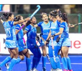
महलपूरी करम सफित होमी टीम के रसाना होने से पहले कप्तान ने कहा, 'पूरी टीम इस दौर का सबसे से इंतजार कर रही है। ऑस्ट्रेलिया के खिलाफ आगामी मैच एक महलपूरी करम सफित होमी टीम के रसाना होने से पहले कप्तान ने कहा, 'पूरी टीम इस दौर का सबसे से इंतजार कर रही है। ऑस्ट्रेलिया के खिलाफ आगामी मैच एक

बेंगलुरु, वार्ता। भारतीय महिला हॉकी टीम गुरुवार तक के ऑस्ट्रेलिया के पर्य दौरे के लिए स्वाना हो गई। टीम 26, 27, 29 और 30 मई को पर्य हॉकी स्टेडियम में मेजबान टीम के खिलाफ चार मैच खेलेगी। यह दौर कई प्रतिस्पर्धी अंत में का अवसर प्रदान करेगा, जिससे भारतीय महिला हॉकी टीम को दुनिया की सर्वश्रेष्ठ टीमों में से एक के खिलाफ खूब को परखने का मौका मिलेगा।