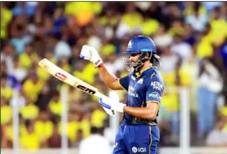
लॉग-ऑफ पर शार्द को कैच धमक बैठा। सुदर्शन ने 53 गेंदों में 84 रन का बहतरीन पाये खेले, जिसमें 7 चौके और 4 छक्के शामिल हैं। इसके बाद तबतिया विना खाला खाले रन आउट हो गए। गायकबाड़ ने मिड-आफ से शानदार ड्राइवकर रिट लगाकर उन्हें पवेलियन भेजा। हालांकि,

अहमदाबाद, वार्ता। आईपीएल 2026 का 66वां मुक. तबला गुजरात टाइटंस और चेन्नई सुपर किंग्स के बीच खेला जा रहा है। चेन्नई ने अहमदाबाद के नरेंद्र मोदी स्टेडियम में टॉस जीतकर पहले बलिंग का फैसला किया है। गुजरात ने 19 ओवर के बाद एक विकेट के नुकसान पर 216 रन बना लिए हैं।