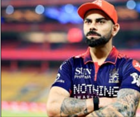
विराट कोहली को रॉयल चैलेंजर्स बेंगलुरु और सनराइज हैदराबाद की विस्फोटक बैटिंग ताकत के बीच एक बल्लेबाज के मुकाबला शुरूआत की यहा राखिण गोटे इंटरनेशनल क्रिकेट स्टेडियम में घुम मानसे के लिए तैयार है।

हैदराबाद, वार्ता। विराट कोहली को रॉयल चैलेंजर्स बेंगलुरु और सनराइज हैदराबाद की विस्फोटक बैटिंग ताकत के बीच एक बल्लेबाज के मुकाबला शुरूआत की यहा राखिण गोटे इंटरनेशनल क्रिकेट स्टेडियम में घुम मानसे के लिए तैयार है।