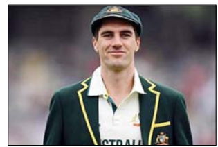
होने वाला बॉर्डर-गायकर ट्राईपी में ऑस्ट्रेलिया के शुरुआती नाइटूड प्रखरवां से कुछ खराबी थी। कैमिंस भी पांच में चर्चा के केंद्र में आए थे, जब उन्होंने विक्सन और स्प्योर्डर पॉइंडकार पर विचारविर्था के बीच एक तनाव को हल करने की बात कही थी।

नई दिल्ली, वार्ता। पैट कैमिंस ने स्पष्ट कहा है कि क्रिस के कम अगले कुछ वॉ तक ऑस्ट्रेलियाई क्रिकेट उनकी प्राथमिकता होगी। यह बयान प्रस वरतन के बीच आया है, जिसमें कहा जा रहा है कि ऑस्ट्रेलिया के कुछ बड़े खिलाड़ी आईपीएल से आगे बढ़कर अन्य पंचांडजी क्रिकेट खेलने के लिए स्ट्रेटोय टीम से दूरी बना सकते हैं।