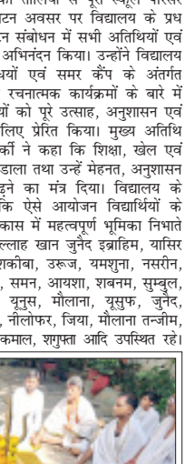
सम्भल-योगेश्वर गोरक्षनाथ महातपा पर यज्ञ करते।

सम्भल- लक्ष्य क्रिकेट एकेडमी का फीता काटकर उदघाटन करते।