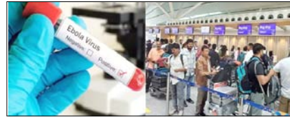
इबोला का डर: नजर रखें और सतर्क रहें