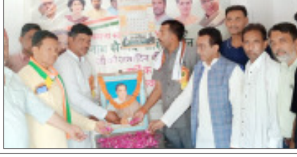
सम्भल- पूर्व पीएम राजीव गांधी को श्रद्धा समुन अर्पित करते कांग्रेसी।