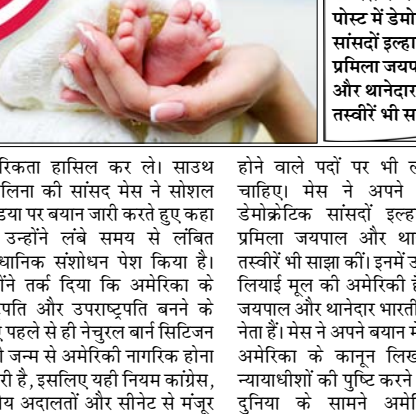
मेस ने अपने पोस्ट में डेमोक्रेटिक सांसदों इल्हान उमर, प्रमिला जयपाल और थानेदार की तस्वीरें भी साझा कीं

वाशिंगटन। अमेरिका में प्राकृतिक रूप से नागरिकता हासिल करने वाले लोगों के अधिकारों को लेकर नई बहस छिड़ गई है। रिपब्लिकन सांसद नैन्सी मेस ने एक संवैधानिक संशोधन प्रस्ताव पेश किया है, जिसमें प्राकृतिक रूप से अमेरिकी नागरिक बने लोगों को कांग्रेस सदस्य, संघीय न्यायाधीश और सीनेट की पुष्टि वाले महत्वपूर्ण पदों पर नियुक्त होने से रोकने की मांग की गई है। इस प्रस्ताव को लेकर डेमोक्रेटिक नेताओं ने तीखी प्रतिक्रिया दी है और इसे नस्लवादी, घृणित और विधेयक मूल के लोगों के खिलाफ बताया है। प्राकृतिक रूप से नागरिकता का मतलब है कि कोई व्यक्ति जन्म से उस देश का नागरिक न हो, लेकिन बाद में कानूनी प्रक्रिया पूरी करके उस देश की