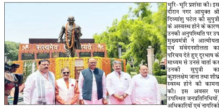
साकार की जा रही है, वह अत्यंत सराहनीय एवं प्रेरणादायक है। उप मुख्यमंत्री श्री ब्रजेश पाठक ने नगर आयुक्त श्री दिव्यांशु पटेल को नवाचार, सांस्कृतिक विरासत को समर्पित स्थलों का निर्माण तथा जनसुविधाओं के विस्तार से मुरादाबाद प्रदेश में ईई पहचान स्थापित कर रहा है। सर्किट हाउस

में उपस्थित जनप्रतिनिधियों, अधिकारियों एवं गणमान्य व्यक्तियों ने भी नगर आयुक्त के कार्यों की करतल ध्वनि के साथ भुर्रि-भुर्रि प्रशंसा की। इस दौरान नगर आयुक्त श्री दिव्यांशु पटेल को सुपुत्री के अस्वस्थ होने के कारण उनकी अनुपस्थिति पर उप मुख्यमंत्री ने आत्मीयता एवं संवेदनशीलता का परिचय देते हुए दूरभाष के माध्यम से उनसे वार्ता कर उनकी सुपुत्री का कुशलक्षेम जाना तथा शीघ्र स्वस्थ होने की कामना की। इस अवसर पर उपस्थित जनप्रतिनिधियों, अधिकारियों एवं नागरिकों ने नगर निगम मुरादाबाद की कार्यशैली की सराहना करते हुए इसे "स्वच्छ, सांस्कृतिक एवं विकसित मुरादाबाद" की दिशा में एक महत्वपूर्ण कदम बताया।