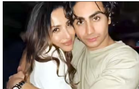
मलाइका ने माना कि बेटे की सोच उनसे अलग है। उन्होंने उसे समझाया कि जिंदगी के हर पफेज का अलग अनुभव होता है और परिवार बनाना भी उसका हिस्सा है। उन्होंने कहा कि रिश्ते बदलते रहते हैं और जिंदगी में कुछ भी स्थायी नहीं होता। इंटरव्यू में मलाइका ने सेल्फ-लव पर भी बात की। उन्होंने कहा कि वह हर दिन खुद से प्यार करने को कहती हैं।

उसने कहा कि एक्यूआई 500-1000 तक पहुंच रहा है, ऐसे माहौल में बच्चों को दुनिया में लाना सही नहीं लगता। मलाइका ने माना कि बेटे की सोच उनके अलग है। उन्होंने उसे समझाया कि जिंदगी के हर फेज का अलग अनुभव होता है और परिवार बनाना भी उसका हिस्सा है। उन्होंने कहा कि रिश्ते बदलते रहते हैं और जिंदगी में कुछ भी स्थायी नहीं होता। इंसान को परिस्थितियों के हिसाब से खुद को ढालना पड़ता है। इंटरव्यू में मलाइका ने सेल्फ-लव पर भी बात की। उन्होंने कहा कि वह हर दिन खुद से प्यार करने को कहती हैं, क्योंकि अगर इंसान खुद को स्वीकार नहीं करेगा, तो जिंदगी खुलकर नहीं जी पाएगा। मलाइका अरोड़ा की शादी 1998 में अरबाज खान से हुई थी। दोनों का 2017 में तलाक हो गया था।