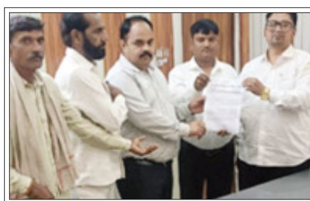
सम्भल-आईजीआरएस में मनमानी के विरोध में जापन देते आ. अ. सेना के कार्यकर्ता।