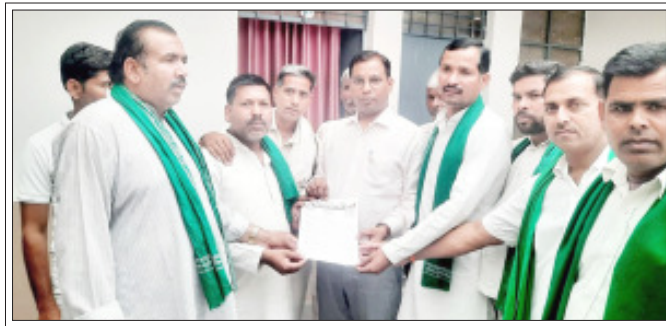
सम्भल- बिजली समस्याओं को लेकर उपजिलाधिकारी को जापन देते भाकियू कार्यकर्ता।

शाह टाइम्स संवाददाता बबुराला। भारतीय किसान यूनियन (टिकैट) ने उपजिलाधिकारी कारी गुनौर को छह सूत्रीय दिव्ये जापन सौंपकर तहसील क्षेत्र में जो चल रहे प्राइवेट विद्यालय में किसानों के बच्चों को कमेंस व फीस के नाम को जा रही रोकें जाने की मांग की गई। सोधे-साधे किसानों को जमीनों पर भू माफिया हावी है तथा कुछ सरकारी पर भी कब्जा किये हैं इन पर कार्यवाही की जाये। यारा वेरा फर्टिलाइजर द्वारा एक बड़ा गोदाम खाद का खुलवाया जाये। जिससे क्षेत्र के किसानों को खाद की दिक्कत का सामना न करना पड़े। वहीं फेक्टरी द्वारा जमीन में गन्दा पानी डाला जा रहा है। इसके कारण क्षेत्रय आम जन को हेपेटाइटिस सी तथा कैंसर जैसी भयंकर बीमारियों का सामना करना पड़ रहा है। इसे रोकना जाये तथा पानी को अशुद्ध क्षेत्रय लोगों को सुविधा मुहैया कराई जाये। तहसील क्षेत्र में बिजली विभाग द्वारा जो किसानों के घर व स्मार्ट मीटर लगा दिये गये हैं उन्हें हटवाये जाये तथा सूचारू रूप से किसानों को बिजली सप्लाई दी जाये।प्राम जहानपुर में एक व्यक्ति