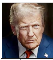
मैं ही कार और ट्रक बनाएंगी, तो उन पर कोई टैक्स नहीं लगाया जाएगा। ट्रंप के मुताबिक, इस समय अमेरिका में कई नई

ट्रंप का कहना है कि यूरोपीय संघ पहले से तय व्यापार समझौते का पालन नहीं कर रहा है, इसलिए यह फैसला लिया गया है। हालांकि अगर यूरोपीय कंपनियां अमेरिका