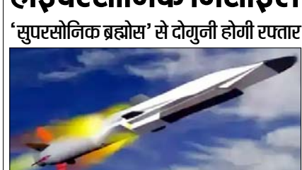
शाह टाइम्स ब्यूरो

'सुपरसोनिक ब्रह्मोस' से दोगुनी होगी रफ्तार