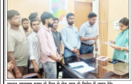
सम्भल-महाराणा प्रताप के चित्र से छेड़-छाड़ के विरोध में ज्ञान ज्ञान