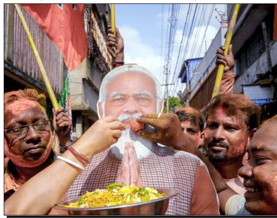
पश्चिम बंगाल में भाजपा की जीत, वर्षों की साधना सिद्ध: मोदी

उधर तमिलनाडु में अभिनेता विजय के करिश्मे के दम पर टीवीके स्पष्ट रूप से सबसे बड़ी पार्टी के रूप में उभरी है। केरल में सत्ता परिवर्तन के संकेतों के बीच एक दशक बाद कांग्रेस के नेतृत्व में संयुक्त लोकतांत्रिक मोर्चा की सरकार बनेगी। असम और पुडुचेरी में राष्ट्रीय जनतांत्रिक गठबंधन सरकार की वापसी निश्चित हो गई है। चुनाव आयोग के रूझानों के आँकड़ों के अनुसार पश्चिम बंगाल में एगजिट पोल के अनुमानों के अनुरूप भाजपा को शुरूआती रूझानों में स्पष्ट बहुमत मिल रही है और वह अकेले दम पर जबरदस्त बहुमत हासिल करने जा रही है। राज्य की 294 विधानसभा सीटों में से 284 के आरंभिक रूझानों में विपक्षी