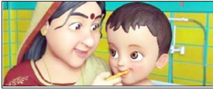
न हाथ में डिब्बी फिर भी जिंदगियां देती दाईं मां सम्पादकीय