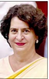
-प्रियंका गांधी वाड़ा कांग्रेस सांसद, वायनाड

केरल की जनता का भरोसा ही यूडीएफ के लिए मार्गदर्शक शक्ति बनेगा और आने वाले पांच वर्षों में इमानदारी एवं विनम्रता के साथ किए गए वादों को पूरा करने का प्रयास किया जाएगा, वायनाड में यूडीएफ को 7 में से 7 सीटों पर मिली जीत जनता के मजबूत विश्वास का प्रतीक है, क्षेत्र के विकास के लिए सभी प्रतिनिधि मिलकर काम करेंगे और जनता की उम्मीदों पर खरा उतरने की पूरी कोशिश करेंगे, यूडीएफ कार्यकर्ताओं और नेताओं के अथक प्रयासों से एकजुट और प्रगतिशील केरल का संदेश हर घर तक पहुंचा है तथा आने वाले वर्षों में जनता की सेवा का संकल्प और मजबूत होगा।