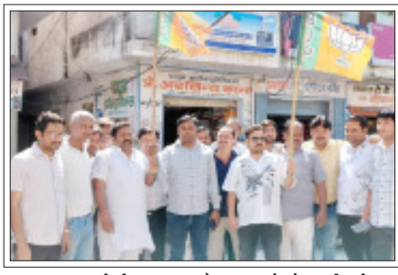
बबराला- भाजपा की जीत का जश्न मनाते भाजपा कार्यकर्ता व पदाधिकारी।

शाह टाइम्स, ब्यूरो सम्भल/बबराला। भारतीय जनता पार्टी की पश्चिम बंगाल में प्रचंड बहुमत से ऐतिहासिक जीत पर बबराला नगर में भाजपा कार्यकर्ताओं के बीच जबरदस्त उत्साह और खुशी का माहौल है। जनपद में जगह-जगह भाजपाईयों ने जीत का जमकर जश्न मनाया और एक-दूसरे को मिठाई खिलाई तथा आतिशबाजी कर अपनी सन्मत्ता का इजहार किया।