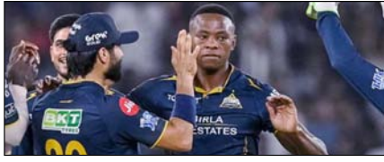
ऑरेंज कैप फिर से अभिषेक के सिर, रबाडा पर्पल कैप की दौड़ में खेल टाइम्स