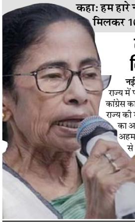
कहा: हम हारे नहीं, हराया गया, चुनाव आयोग विलेन, भाजपा से मिलकर 100 सीटें लूटीं, मैं आजाद पंछी, शेर की तरह लड़ूंगी

कोलकाता, वार्ता पश्चिम बंगाल की मुख्यमंत्री ममता बनर्जी ने मंगलवार को कोलकाता में प्रेस कॉन्फ्रेंस के दौरान कहा कि मैं सीएम पद से इस्तीफा नहीं दूंगी। हम जनता से नहीं, साजिश से हारे हैं। इस्तीफा देने राजभवन नहीं जाऊंगा। ममता ने आगे कहा कि चुनाव आयोग असली विलेन है। उसने भाजपा के साथ मिलकर 100 सीटें लूटीं। अब मेरे पास कोई इस्तीफा नहीं है, मैं आजाद पंछी हूँ। कहीं से भी चुनाव लड़ सकती हूँ, सड़कों पर रहूंगी। ममता ने आरोप लगाया कि भाजपा ने काउंटिंग सेंट्रों पर कब्जा कर लिया था। मेरे साथ बदसलूकी की। उम्मीदवारों और कार्यकर्ताओं के साथ अत्याचार किया। पार्टी और इंडिया गठबंधन के नेता मेरे साथ हैं। हम फिर से उभरेंगे और शेर की तरह लड़ेंगे। पश्चिम बंगाल सहित 5 राज्यों के विधानसभा चुनाव के नतीजे सोमवार को आ चुके हैं। बंगाल में भाजपा ने 293 में से 207 सीटें जीत ली हैं। पार्टी 9 मई को