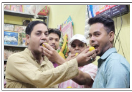
बबराला- भाजपा की जीत पर एक दूसरे को मिष्ठाण खिलाते कार्यकर्ता।