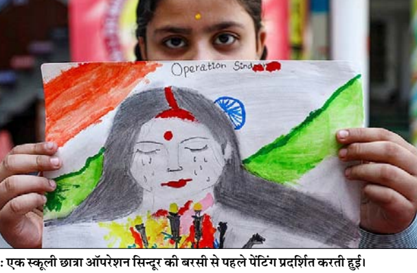
जम्मू: एक स्कूली छात्रा ऑपरेशन सिन्दूर की बरसी से पहले पेंटिंग प्रदर्शित करती हुई।

नई दिल्ली। भाजपा ने मंगलवार को केंद्रीय गृह मंत्री अमित शाह को बंगाल और केंद्रीय स्वास्थ्य एवं परिवार कल्याण मंत्री जगत प्रकाश नड्डा को असम के लिए पर्यवेक्षक बनाया। भाजपा के राष्ट्रीय महासचिव अरुण निंदासह की ओर से मंगलवार को जारी विज्ञापन में श्री शाह पश्चिम बंगाल में पार्टी के विधायक दल के नेता के चुनाव के लिए केंद्रीय पर्यवेक्षक होंगे। वहीं ओडिशा के मुख्यमंत्री मोहन चरण आओडिशा के सीएम मोहन चरण माझी सह पर्यवेक्षक बनाए गए माझी सह पर्यवेक्षक की भूमिका निभाएंगे। श्री निंदासह ने बताया कि श्री नड्डा ओडिशा में पार्टी के विधायक दल के नेता के चुनाव के लिए केंद्रीय पर्यवेक्षक होंगे। वहीं हरियाणा के मुख्यमंत्री नायब निंदासह सैनी सह पर्यवेक्षक की भूमिका निभाएंगे।