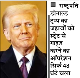
राष्ट्रपति डोनाल्ड ट्रम्प का जहाजों को स्ट्रेट से गाइड करने का ऑपरेशन सिर्फ 48 घंटे चला

दुबई। अमेरिका के राष्ट्रपति डोनाल्ड ट्रम्प ने हाल ही में होमजुज स्ट्रेट में फंसे जहाजों के ट्रांजिट के लिए प्रोजेक्ट फ्रीडम की शुरुआत की थी। हालांकि, अमेरिकी मीडिया ने बताया कि होमजुज में 1600 के करीब जहाज फंसे हुए हैं और ट्रम्प का प्रोजेक्ट फ्रीडम 48 घंटे तक ही टिक पाया। अमेरिकी मीडिया सीएनएन के अनुसार, लगभग 1600 जहाज अब भी होमजुज स्ट्रेट के पास फंसे हुए हैं, शिपिंग कंपनियों को एक महंगी और जोखिम भरी स्थिति का सामना करना पड़ रहा है। वे दो महीने से ज्यादा समय से पानी के रास्ते से निकलने का मौका ढूँढ रही हैं। राष्ट्रपति डोनाल्ड ट्रम्प का जहाजों को स्ट्रेट से गाइड करने का ऑपरेशन सिर्फ 48 घंटे चला।