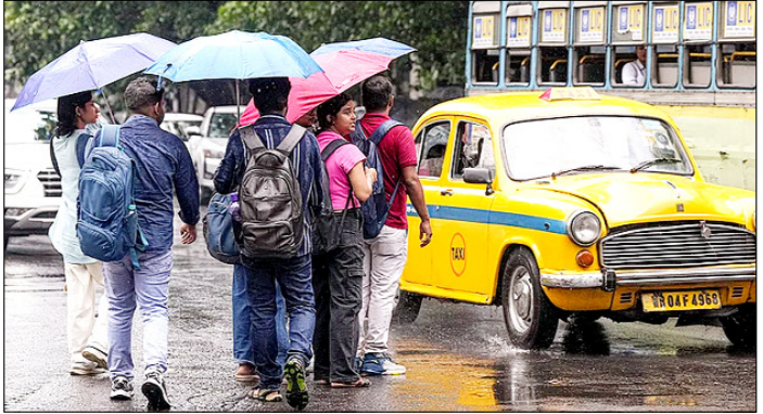
कोलकाता। बारिश के दौरान छाता लेकर चलते लोग।