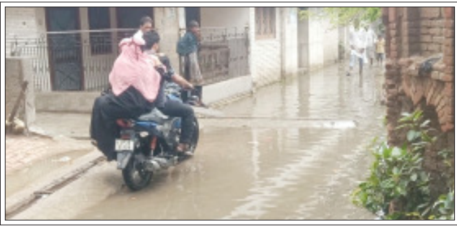
सम्भल। सुबह-सवेरे हुई मामूली बारिश में जल मगन सड़क से गुजरते राहगीर।