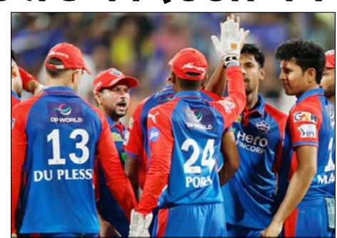
को बीच अब तक 34 मैच हुए हैं, जिसमें केकेआर को 19 और डीसी को 15 मैचों में जीत मिली है। वहीं दिल्ली में दोनों के बीच हुए अब तक 11 मुकाबलों में भी डीसी को पांच जबकि केकेआर

नई दिल्ली, वार्ता। आईपीएल में शुक्रवार को कोलकाता नाइट राइडर राइडर्स (केकेआर) का मुकाबला दिल्ली में दिल्ली कैपिटल्स (डीसी) के साथ होगा। 10 मैचों में सिर्फ चार जीत के साथ मेजबान डीसी प्लेऑफ की दौड़ में बहुत पीछे छूट गई है और यह मुकाबला उसके लिए प्लेऑफ की आखिरी उम्मीद है। हालांकि प्लेऑफ के लिए उसे अपने सभी बचे चारों मैच जीतने होंगे। वहीं केकेआर को भी नौ मैचों में सिर्फ तीन जीत मिली है, लेकिन ए टीमों जीत पिछले तीन मैचों में आई है और वे अच्छे फॉर्म व बड़े हुए आत्मविश्वास के साथ इस मैच में प्रवेश करेंगे। दोनों टीमों को छह मुकाबलों में जीत मिली है। 2024 से अभी तक डीसी, केकेआर को एक भी मैच में नहीं हरा पाई है, तो क्या डीसी इस सिलसिले को तोड़ पाएगी? केएल राहुल पर बहुत ज्यादा निर्भर है डीसी को बल्लेबाजी केएल राहुल आईपीएल 2026 में शानदार फॉर्म में हैं और 10 पारियों में 49-4 की औसत और 181 के स्ट्राइक रेट से तीन अर्धशतक और एक शतक के साथ 445 रन बना चुके हैं। लेकिन डीसी के लिए मुश्किल बात यह है कि उनके अन्य बल्लेबाज फॉर्म या निरंतरता की कमी से जूझ रहे हैं। राहुल ने डीसी के अकेले 26 फीसदी रन बनाए हैं और इस दौरान बीच के ओवरों में उनका स्ट्राइक रेट बहुत शानदार रहा है। सात से 16 ओवरों के बीच राहुल ने 211 के स्ट्राइक रेट से 249 रन बनाए हैं और हर तीसरी गेंद पर बाउंड्री लगा रहे हैं। बीच के ओवरों में उनका स्ट्राइक रेट सिर्फ रजत पाटीदार (217) से कम है।