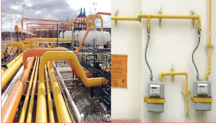
रिफिलिंग प्लांट लगाया जा रहा है। अगर उक्त प्लांट से नगर पालिका