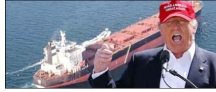
टम्प को झटका, होर्मुज में फंसे 1600 जहाज, शिपिंग कंपनियों को हो रहा नुकसान