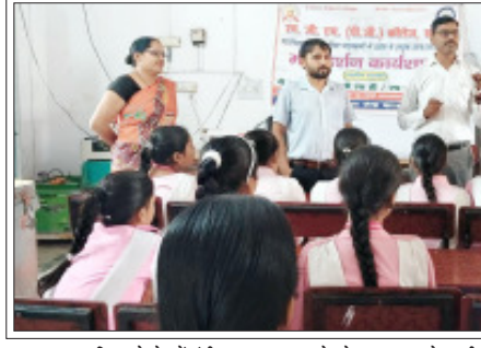
सम्भल- उच्च शिक्षा के क्षेत्र में पंजीकरण अनपात बढ़ाने को जागरूक करते एमजीएम कॉलेज के शिक्षक।

सम्भल। उच्च शिक्षा के क्षेत्र में पंजीकरण अनपात को बढ़ाने तथा विद्यार्थियों को उच्च शिक्षा के प्रति प्रेरित करने के उद्देश्य से चलाये जा रहे जागरूकता कार्यक्रम में महाविद्यालय के शिक्षकों की समितियों ने स्कूलों में शैक्षिक प्रमगण उच्च शिक्षा के महत्व और करियर निर्माण की सम्भावनाओं पर विस्तार से प्रकाश डाला।