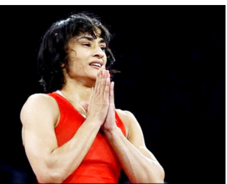
नहीं लिया है, क्योंकि वह पेरिस 2024 ओलंपिक के बाद से प्रतिस्पर्धा से दूर रही हैं और इसलिए पात्रता मानदंडों को पूरा नहीं करती हैं। उन्होंने प्रीमकालीन खेलों के तुरंत बाद रिसलिंग से संन्यास ले लिया था, लेकिन पिछले साल दिसम्बर में विनेश ने कुश्ती में फिर से वापसी की घोषणा की थी। मैदान से दूर रहने के दौरान उन्होंने एक व्यक्तिगत उपलब्धि भी हासिल की।

नई दिल्ली, वार्ता। तीन बार की ओलंपियन विनेश फोगाट को रिसलिंग फेडरेशन ऑफ इंडिया (डब्ल्यूएफआई) द्वारा घोषित मानदंडों के अनुसार एशियन गेम्स 2026 के सिलेक्शन ट्रायल के लिए बुधवार को अयोग्य घोषित कर दिया गया। फेडरेशन के अनुसार, सिलेक्शन ट्रायल के लिए पात्रता तीन घरेलू प्रतियोगिताओं - 2025 सोनियर नेशनल रिसलिंग चैंपियनशिप, 2026 सोनियर फेडरेशन कप और अंडर-20 नेशनल रिसलिंग चैंपियनशिप के पदक विजेताओं तक सीमित है। सोनियर नेशनल चैंपियनशिप दिसम्बर में विनेश ने आयोजित की गई थी, जबकि फेडरेशन कप फरवरी में हुआ था। विनेश फोगाट ने इनमें से किसी भी प्रतियोगिता में हिस्सा नहीं लिया है, क्योंकि वह पेरिस 2024 ओलंपिक के बाद से प्रतिस्पर्धा से दूर रही हैं और इसलिए पात्रता मानदंडों को पूरा नहीं करती हैं। उन्होंने प्रीमकालीन खेलों के तुरंत बाद रिसलिंग से संन्यास ले लिया था, लेकिन पिछले साल दिसम्बर में विनेश ने कुश्ती में फिर से वापसी की घोषणा की थी। मैदान से दूर रहने के दौरान उन्होंने एक व्यक्तिगत उपलब्धि भी हासिल की।