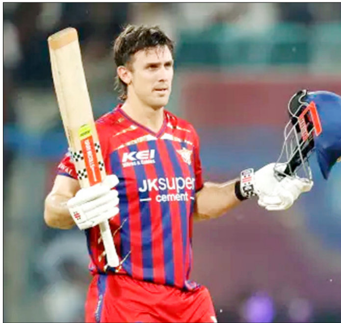
LSG के मिचेल मार्श बेंगलुरु के खिलाफ अपने आईपीएल करियर का दूसरा शतक लगाने के बाद दर्शकों का अभिवादन स्वीकार करते हुए।