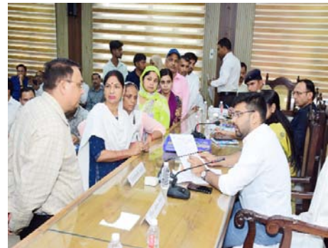
इस व्यवस्था से फरियादियों को एक ही छत के नीचे समस्याओं का समाधान मिल सकेगा तथा उन्हें विभिन्न कार्यालयों के