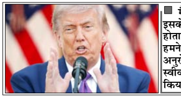
■ मैं वास्तव में इसके पक्ष में नहीं हूँ, लेकिन हमने इसे पाक के अनुरोध को स्वीकार करते हुए किया: ट्रम्प

एयर फोर्स वन। अमेरिकी राष्ट्रपति डोनाल्ड ट्रम्प ने कहा है कि पश्चिम एशिया में शत्रुता को समाप्त करने के लिए राजनयिक मार्ग खोलने के उद्देश्य से ईरान के साथ किया गया युद्धविराम समझौता 'पाकिस्तान के अनुरोध पर' किया गया था।