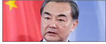
चीनी विदेश मंत्री वांग कंग ने ट्रम्प को दी कड़ी चेतावनी पेज 11