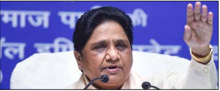
आंधी-तूफान पीड़ितों की पूरी उदारता से मदद करे सरकार: मायावती पेज 2

नई दिल्ली, मुजफ्फरनगर, देहरादून, हल्द्वारी, मुतादाबाद, बरौली, मेरठ व लखनऊ से प्रकाशित