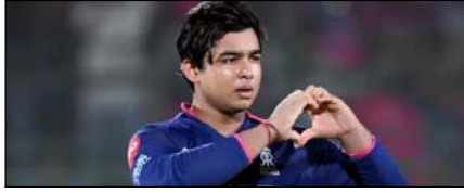
डीसी की प्लेऑफ की उम्मीदों को सूर्यवंशी से खतरा खेल टाइम्स