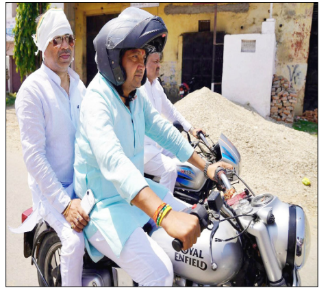
क्षेत्र में निराश्रित गोवंश के संरक्षण में मौल का पत्थर साबित होगी। उन्होंने ग्रामीणों से सीधा संवाद कर उनकी समस्याओं को भी सुना।