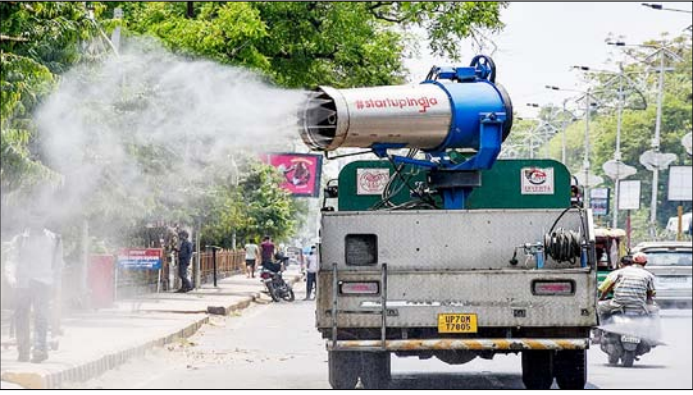
प्रयागराज। भीषण गर्मी के दिन में लोगों को राहत देने के लिए पानी का छिड़काव करता नगर निगम का वाटर स्पिकलर ट्रक।