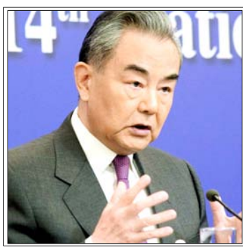
■ दुनिया की दो सबसे बड़ी अर्थव्यवस्थाएँ होने के नाते चीन और अमेरिका एक-दूसरे के बिना काम नहीं कर सकते

चीन-अमेरिका टकराव दोनों देशों और पूरी दुनिया के लिए विनाशकारी साबित हो सकता है: वांग इं ताइवान को 12 अरब अमेरिकी डॉलर के हथियारों की आपूर्ति फिलहाल स्थगित: ट्रम्प