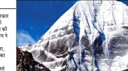
पर्यटन जैसी एक्टिविटी न करने की अपील करता रहा है। नेपाल ने चीन को भी आधिकारिक तौर पर यह जानकारी दी है कि लिपुलेख उसका हिस्सा है। नेपाल की हालिया टिप्पणी के बाद भारत ने अपना रुख स्पष्ट किया है। विदेश मंत्रालय के

नई दिल्ली। काठमांडू। नेपाल सरकार ने भारतीय तीर्थयात्रियों से लिपुलेख के रास्ते कैलाश मानसरोवर यात्रा न करने की अपील की है। नेपाल के विदेश मंत्रालय ने बयान जारी कर कहा कि 1816 की सुगौली संधि के मुताबिक लिपुलेख, लिपुलेख और कालापानी क्षेत्र नेपाल का हिस्सा है। सरकार ने कहा कि लिपुलेख के रास्ते प्रस्तावित कैलाश मानसरोवर यात्रा को लेकर उसने भारत और चीन दोनों को डिप्लोमैटिक तरीके से अपनी आपर्ति और चिंता से अवगत करा दिया है। नेपाल ने यह भी बताया कि वह पहले भी भारत से इस इलाके में सड़क निर्माण, व्यापार और