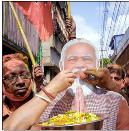
उधर तमिलनाडु में अभिनेता विजय के करिश्मे के दम पर टीवीके स्पष्ट रूप से सबसे बड़ी पार्टी के रूप में उभरी है। केरल में सत्ता परिवर्तन के संकेतों के बीच एक दशक बाद कांग्रेस के नेतृत्व में संयुक्त लोकतांत्रिक मोर्चा की सरकार बनेगी। असम और पुडुचेरी में राष्ट्रीय जनतांत्रिक गठबंधन सरकार की वापसी निश्चित हो गई है। चुनाव आयोग के रूझानों के आँकड़ों के अनुसार पश्चिम बंगाल में एगजिट पोल के अनुमानों के अनुरूप भाजपा को शुरूआती रूझानों में स्पष्ट बहुमत मिल रही है और वह अकेले दम पर जबरदस्त बहुमत हासिल करने जा रही है। राज्य की 294 विधानसभा सीटों में से 284 के आरंभिक रूझानों में विपक्षी

नई दिल्ली। पांच राज्यों के विधानसभा चुनाव की मतगणना के रूझानों में पश्चिम बंगाल और तमिलनाडु में भारी उलटफेर की संभावना के साथ भारतीय जनता पार्टी बंगाल में अपने दम पर जबरदस्त बहुमत हासिल करने जा रही है। पश्चिम बंगाल की मुख्यमंत्री और टीएमसी अध्यक्ष ममता बनर्जी भवानीपुर से सुबेदु अधिकारी से 15,114 वोटों से चुनाव हार गईं। सुबेदु के खिलाफ यह उनको लगातार दूसरी हार है। 2021 विधानसभा चुनाव में सुबेदु नंदीग्राम से ममता के खिलाफ जीते थे। ममता हार से पहले ही काउंटिंग सेंटर से निकल गईं। उन्होंने आरोप लगाया कि, मुझे अंदर धक्का दिया और पीटा गया। यहाँ दोबारा काउंटिंग होनी चाहिए।