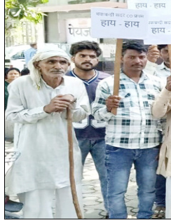
आरक्षण नियमों के विरुद्ध समाप्त कर दिया गया। इस आरक्षण के खिलाफ तय सीमा तक आपत्ति दर्ज नहीं कराई फिर भी चकवर्ती

शाह टाइम्स संवाददाता मुजफ्फरनगर। आरक्षित भूमि को बचाने की मांग को लेकर तितावी के ग्रामीणों ने कलेक्ट्रेट पर पैदल मार्च करते हुए प्रशासन के खिलाफ नारेबाजी कर विरोध जताया। ग्रामीणों का कहना था कि यह विवाद चकवर्ती प्रक्रिया के दौरान हरिजन समुदाय के लिए आरक्षित की गई भूमि से संबंधित है। ग्रामीणों के अनुसार गाँव में अंबेडकर पार्क हरिजन आबादी और बारातघर के लिए गाटा संख्या 588 (0.2800 हेक्टेयर) भूमि पूर्व में सुरक्षित की गई थी। ग्रामीणों का आरोप है कि बाद में इस भूमि का