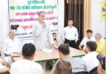
मिलकर गौ माता के लिए चारे का प्रबंध करना चाहिए जिससे कोई भी पशु चारे के लिए भूखा न रह

शाह टाइम्स संवाददाता मोरना। पूर्व केंद्रीय मंत्री संजीव बालियान ने मोरना ब्लॉक के सभागार में आयोजित कार्यक्रम में ग्राम प्रधानों से काऊ सेंचुरी में पशुओं लिए भूसे की व्यवस्था का आह्वान किया इस दौरान ब्लॉक प्रमुख सहित दर्जनों ग्राम प्रधान मौजूद रहे। सोमवार को मोरना ब्लॉक के सभागार में आयोजित कार्यक्रम में पूर्व केंद्रीय मंत्री संजीव बालियान ने पुरकाजी क्षेत्र के गाँव तुगल, कपुर कम्हेडा में स्थित काऊ सेंचुरी में पशुओं के लिए भूसे की व्यवस्था करने का आह्वान करते हुए कहा कि गौ माता की सेवा ही सच्ची सेवा है हम सभी को