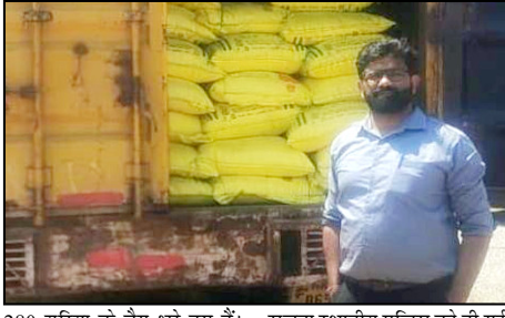
280 यूरिया के बैग भरे हुए हैं। ट्रक मालिक से जब इस संबंध में बात की गई तो ट्रक के मालिक ने कागजात लाने की बात कही लेकिन घंटों बीत जाने के बाद भी मौके पर ट्रक मालिक कागजात लेकर नहीं पहुंचा। घटना की