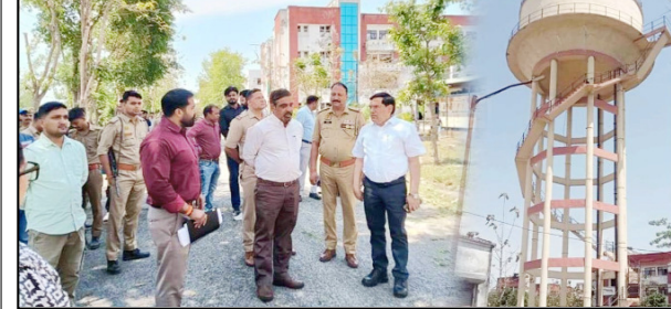
शाह टाइम्स ब्यूरो सहारनपुर। सरसावा क्षेत्र के पिलखनी स्थित राजकीय मेडिकल कॉलेज में उस समय हड़कंप मच गया जब एक आउटसोर्सिंग कर्मचारी नौकरी से हटाए जाने के विरोध में पेट्रोल की बोतल लेकर पानी की टंकी पर चढ़ गया। युवक को इस कदम से

युवक को समझाने का प्रयास किया, जिसके बाद वह सुरक्षित नीचे उतर आया-बताया जा रहा है कि संबंधित कर्मचारी को कंपनी द्वारा लापरवाही के आरोप में हटाया गया था। प्राचार्य ने स्पष्ट किया कि टैंडर समाप्त होने के बाद कर्मचारियों का दूसरी कंपनी में स्वतः हस्तांतरण नहीं होता और पहले भी लापरवाही के मामलों में कार्रवाई की जा चुकी है। फिलहाल स्थिति नियंत्रण में है और पुलिस मामले की जांच कर रही है।