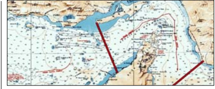
ईरान ने होर्मुज स्ट्रेट का नया नक्शा जारी किया पेज 12