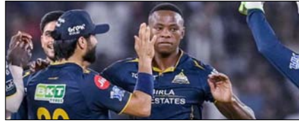
ऑरेंज कैप फिर से अभिषेक के सिर, रबाडा पर्पल कैप की दौड़ में खेल टाइम्स