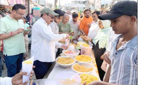
यह क्लियर हो गया कि असम, पाण्डुचेरी तथा बंगाल में भग्ना सरकार बहुमत के साथ आ रही है तो जिले के ग्रामीण क्षेत्रों से भी भाजपा नेताओं व कार्यकर्ताओं का मुजफ्फरनगर आना शुरू हो गया। सायं चार बजे शिव चौक पर