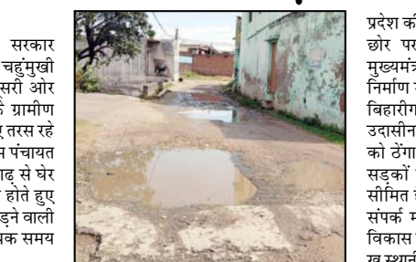
बन जाती है। गंदा पानी गड्ढों में भर जाने के कारण पैदल चलना भी दूबर हो जाता है। इस मार्ग से प्रतिदिन सैकड़ों स्कूली बच्चे गुजरते हैं। कीचड़ और गड्ढों के कारण बच्चे अक्सर फिसलकर गिर जाते हैं, जिससे उनकी वर्दी खराब हो जाती है और चोट लगने का भय बना रहता है। उत्तर प्रदेश सरकार की मंशा है कि

शाह टाइम्स संवाददाता बिहारीगढ़। एक ओर जहाँ सरकार अंत्योद्य और ग्रामीण क्षेत्रों के चहुँमुखी विकास का दावा करती है, वहीं दूसरी ओर ग्राम पंचायत थापल इस्माइलपुर के ग्रामीण आज भी बुनियादी सुविधाओं के लिए तरस रहे हैं। विकास खंड मुजफ्फाबाद की ग्राम पंचायत थापल इस्माइलपुर के मजरे बिहारीगढ़ से घेर कर्मा, घेर कलीराम और हसनावाला होते हुए तहसील मुख्यालय भगवानपुर को जोड़ने वाली मुख्य सड़क पिछले 10 वर्षों से अधिक समय से खंडहर में तब्दील हो चुकी है। तस्वीरों में साफ देखा जा सकता है कि सड़क पर अब डामर का नामोनिशान नहीं बचा है। पूरी सड़क गहरे गड्ढों में तब्दील हो गई है। स्थानीय निवासियों का कहना है कि प्रशासन और जनप्रतिनिधियों को कई बार अवगत कराने के बावजूद स्थिति जिस की तस तबनी हुई है। हल्की सी बारिश होते ही सड़क ताल-तलैया