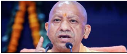
उपरी की तबादला नीति में सरकार ने किया बदलाव पेज 2

नई दिल्ली, मुजफ्फरनगर, देहरादून, हल्द्वानी, मुगदाबाद, बरेली, मेरठ व लखनऊ से प्रकाशित