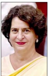
-प्रियंका गांधी वाड़ा कांग्रेस सांसद, वायनाड

केरल की जनता का भरोसा ही यूडीएफ के लिए मार्गदर्शक शक्ति बनेगा और आने वाले पांच वर्षों में इमानदारी एवं विनम्रता के साथ किए गए वादों को पूरा करने का प्रयास किया जाएगा, वायनाड में यूडीएफ को 7 में से 7 सीटों पर मिली जीत जनता के मजबूत विश्वास का प्रतीक है, क्षेत्र के विकास के लिए सभी प्रतिनिधि मिलकर काम करेंगे और जनता की उम्मीदों पर खरा उतरने की पूरी कोशिश करेंगे, यूडीएफ कार्यकर्ताओं और नेताओं के अथक प्रयासों से एकजुट और प्रगतिशील केरल का संदेश हर घर तक पहुंचा है तथा आने वाले वर्षों में जनता की सेवा का संकल्प और मजबूत होगा।