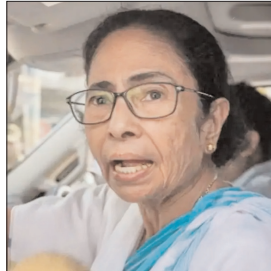
टीएमसी का हवाला दिया, जिसमें कहा गया था कि अगर जीत का अंतर हटाए गए वोटों से कम है, तो अदालत शिकायतों पर विचार कर सकती है। चुनाव आयोग अधिवक्ता डीएस नायडू ने कहा कि इसका उपाय चुनाव याचिका

दीदी की दलील ■ यहां जीत का अंतर एसआईआर में कटे वोटों से कम ■ सुप्रीम कोर्ट ने कहा नई याचिकाएं लगाएं