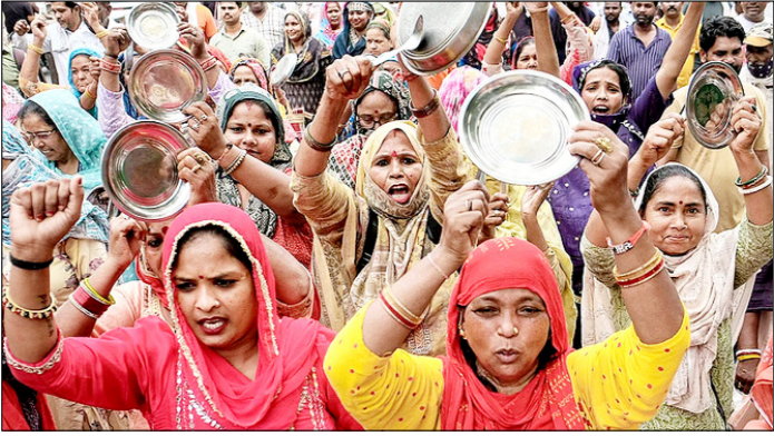
गुजरात। हरियाणा में राज्य सरकार के खिलाफ अपनी मांगों के समर्थन में आयोजित विरोध रैली के दौरान गुजरात नगर निगम (एमसीजी) के कर्मचारी बर्तन बजाते हुए।