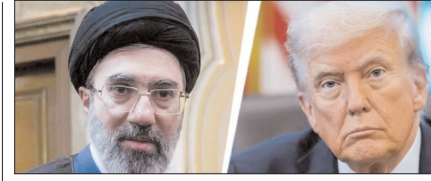
ईरान ने अमेरिकी योजना को किया खारिज पेज 12