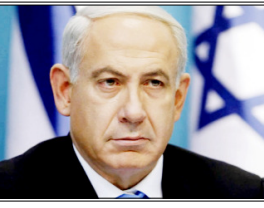
ईरान क्षेत्रीय प्रॉक्सी समूहों का समर्थन करना जारी रख रहा है और अपनी बैलिस्टिक मिसाइल क्षमताओं को बढ़ा रहा है। अमेरिका-इजरायल के ईरान पर किए गए हमलों के बाद हुई प्रतिक्रिया को स्वीकार करते हुए नेतन्याहू ने इस बात पर जोर दिया कि अब भी बड़ी चुनौतियां बनी हुई हैं, विशेष रूप से ईरान के परमाणु कार्यक्रम को लेकर। उन्होंने सुझाव दिया कि किसी भी व्यावहारिक व्यवस्था के तहत संवर्धित यूरेनियम को वहां से से हटाना होगा। उन्होंने कहा कि अगर आपक पास कोई समझौता है और आप अंदर जाकर उसे बाहर निकाल लेते हैं, तो क्यों नहीं? यही सबसे अच्छा तरीका है। नेतन्याहू इस बात से सहमत हैं कि समझौता होना चाहिए, लेकिन परमाणु मुद्दा समझौता के अन्वय नहीं है। उनकी यह टिप्पणी ऐसे समय में आई है, जब अमेरिका का रुख है कि किसी भी

नेल अबीव। इजरायल के प्रधानमंत्री बेंजामिन नेतन्याहू ने दो.हराया है कि ईरान के साथ युद्ध तब तक 'खत्म नहीं होगा', जब तक कि प्रमुख रणनीतिक मुद्दों का समाधान नहीं हो जाता जिनमें ईरान के संवर्धित यूरेनियम के भंडार को हटाना, परमाणु केंद्रों को नष्ट करना और ईरान के क्षेत्रीय प्रभाव पर अंकुश लगाना शामिल है। सोबीएस-न्यूज के कार्यक्रम '60 मिनट्स' को दिए साक्षात्कार में नेतन्याहू ने कहा कि यह अभी खत्म नहीं हुआ है, क्योंकि अब भी वहां परमाणु सामग्री और संवर्धित यूरेनियम मौजूद है। इसे ईरान से हटाकर निकालना होगा। अब भी वहां संवर्धन केंद्र हैं, जिन्हें नष्ट करना बाकी है। उन्होंने कहा कि ईरान क्षेत्रीय प्रॉक्सी समूहों का समर्थन