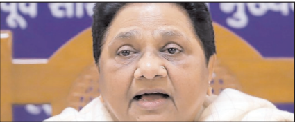
मंत्रिमंडल विस्तार का सकारात्मक असर आमजन के जीवन पर पड़े, तो बेहतर: माया पेज 2

नई दिल्ली, मुजफ्फरनगर, देहरादून, हल्द्वानी, मुगदाबाद, बरेली, मेरठ व लखनऊ से प्रकाशित