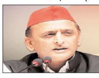
■ भाजपाई अपनी कमाई के स्वर्णकरण में लगे

बीजेपी पर सपा मुखिया अखिलेश यादव ने बोला तीखा हमला शाह टाइम्स ब्यूरो लखनऊ। उत्तर प्रदेश के पूर्व मुख्यमंत्री और समाजवादी पार्टी के राष्ट्रीय अध्यक्ष अखिलेश यादव ने भारतीय जनता पार्टी पर तीखा हमला बोलते हुए सोमवार को कहा कि चुनाव खत्म होते ही सरकार को 'संकट' याद आ गया। उन्होंने कहा कि देश के लिए सबसे बड़ा संकट भाजपा ही है और केंद्र सरकार की हालिया अपीलें उसकी आर्थिक व नीतिगत विफलताओं को उजागर करती हैं। सपा प्रमुख ने कहा कि यदि इतनी पाबंदियां लगानी पड़ रही हैं, तो पांच ट्रिलियन डॉलर की जुमलाई अर्थव्यवस्था कैसे बनेगी। आरोप लगाया कि भाजपा सरकार के हाथ से आर्थिक व्यवस्था की लगाम छूट चुकी है। डॉलर लगातार मजबूत हो रहा है और रुपया कमजोर होता जा रहा है। यादव ने सोने की खरीद को लेकर सरकार को अपील पर भी कटाक्ष किया। जनता तो वैसे भी डेढ़ लाख तोले का सोना खरीदने की स्थिति में नहीं है, बल्कि भाजपा के लोग ही अपनी काली कमाई का स्वर्णकरण करने में लगे हैं। इसकी जानकारी लखनऊ से लेकर गोरखपुर और अहमदाबाद से लेकर गुवाहाटी तक ली जा सकती है।