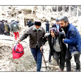
पश्चिम एशिया में युद्ध समाप्त करने के लिए ईरान का प्रस्ताव उदार और तार्किक

तेहरान। ईरान ने अमेरिका को दिए अपने जवाब में अमेरिकी शांति प्रस्ताव को यह कहते हुए खारिज कर दिया कि इसका मतलब अमेरिकी सरकार की अत्यधिक मांगों के आगे झुकना होगा। प्रेस टीवी की एक रिपोर्ट में यह जानकारी दी गई। ईरानी समाचार एजेंसी आईएसएनए ने पहले बताया था कि अमेरिकी संदेश पर ईरान की प्रतिक्रिया युद्ध समाप्त करने और फारस की खाड़ी और होर्मुज जलडमरूमध्य में जहाजों की सुरक्षा सुनिश्चित करने पर केंद्रित थी। अमेरिकी राष्ट्रपति डोनाल्ड ट्रम्प ने संघर्ष समाधान के लिए अमेरिकी प्रस्ताव पर ईरान की प्रतिक्रिया को पूरी तरह अस्वीकार्य बताया। प्रेस टीवी के अनुसार, ईरान की प्रतिक्रिया योजन में इस बात पर जोर दिया गया है कि अमेरिका को इस्तामिक गणराज्य को युद्ध क्षतिपूर्ति का भुगतान करना होगा। मुझे की शुरुआत में ईरानी विदेश मंत्रालय के एक प्रवक्ता ने कहा कि तेहरान को इस्तामिक गणराज्य के नए 14 सूत्री प्रस्ताव के संबंध में पाकिस्तान के माध्यम से अमेरिका से जवाब मिला है। ईरान की तत्समना समाचार एजेंसी ने रविवार को बताया कि अमेरिका के साथ बातचीत के लिए ईरान के प्रस्तावों का पाठ, जिसे तेहरान ने वाशिंगटन को भेजकर जवाब दिया था, में प्रतिबंध हटाने, होर्मुज जलडमरूमध्य पर ईरान का पूर्ण नियंत्रण और विदेशों में ईरानी संपत्तियों को मुक्त