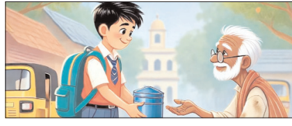
दयालुता मानवता का सबसे बड़ा सौंदर्य, इसे बनाए रखें सम्पादकीय