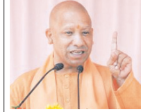
■ भारत की चेतना में बसता है सनातन और चेतना अजर-अमर है सोमनाथ देश की जड़ों को जोड़ने का प्रयास

वाराणसी, वार्ता सोमनाथ योगी ने कहा कि द्वादश ज्योतिर्लिंगों में से एक सोमनाथ महादेव के स्वाभिमान पर्व के कार्यक्रम में प्रधानमंत्री नरेन्द्र मोदी की प्रेरणा से 'एक भारत, श्रेष्ठ भारत' की संकल्पना को साकार होते देख रहा है। उन्होंने कहा कि इसका साकार रूप भगवान सोमनाथ महादेव के भव्य मंदिर की पुनर्प्रतिष्ठा, सुंदरीकरण और वहां आयोजित कार्यक्रमों के साथ ही काशी में श्री काशी विश्वनाथ धाम, महाकाल में महालोक की स्थापना, श्री अयोध्या धाम में श्री राम जन्मभूमि पर भव्य राम मंदिर के निर्माण समेत अनेक सनातन परंपरा से जुड़े पवित्र तीर्थ स्थलों को अपने वैभव के साथ विकास