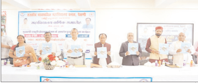
अगले शैक्षिक सत्र से शुरू होंगे बीटेक, बीएड, एमबीए व एमसीए पाठ्यक्रम, उच्च शिक्षा मंत्री ने व्यावसायिक महाविद्यालय में किया शौर्य दीवार का अनावरण