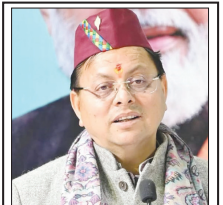
■ मुख्यमंत्री ने प्रदेश की जनता से की अपील

शाह टाइम्स ब्यूरो देहरादून। परिचय एशिया में चल रहे विवाह के बीच गैस और अन्य ऊर्जा संसाधनों की पर्याप्त मात्रा में सप्लाई नहीं हो पा रही है। जिसके चलते भारत सरकार लगातार, इस बात पर जोर दे रही है कि ऊर्जा संसाधनों का सीमित इस्तेमाल किया जा जाए।