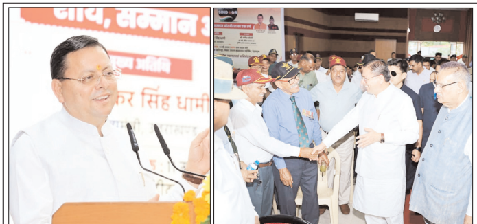
■ देहरादून में ऑपरेशन सिंदूर-शौर्य, सम्मान और वीरता का एक वर्ष पूर्ण होने के अवसर पर कार्यक्रम आयोजित

शाह टाइम्स ब्यूरो देहरादून। मुख्यमंत्री पुष्कर सिंह धामी ने कहा कि प्रधानमंत्री नरेंद्र मोदी के नेतृत्व एवं सेना के शौर्य के कारण आतंकवाद के विरुद्ध ऑपरेशन सिंदूर को सफलतापूर्वक अंजाम दिया गया। मुख्यमंत्री ने सेना के साहस और शौर्य के प्रति अपनी कृतज्ञता व्यक्त करते हुए कहा कि सेना के साहस, समर्पण और त्याग के कारण दुश्मन कभी भी भारत की ओर आँख उठाने की हिम्मत नहीं कर सकता।