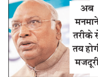
अब मनमाने तरीके से तय होगी मजदूरी

नई दिल्ली, वार्ता कांग्रेस पार्टी के राष्ट्रीय अध्यक्ष मल्लिकार्जुन खड्गे ने मोदी सरकार पर पांच राज्यों के विस चुनाव खत्म होने के तुरंत बाद चार श्रम संहिताओं (लेबर कोड) को लागू करने का आरोप लगाते हुए कहा कि सरकार ने कायदापूर्ण तरीके से 8 और 9 मई 2026 को गजट अधिसूचनाओं के जरिए इन श्रमिक विरोधी कानूनों को लागू किया। खड्गे ने सोमवार को बयान जारी कर कहा कि ये कानून करोड़ों मजदूरों के लिए हाथ पर एंड फायर, रोजगार और यूनियन अधिकारों में कटौती का रास्ता खोलते हैं। उन्होंने आरोप लगाया कि मोदी सरकार ने बिना किसी व्यापक चर्चा और श्रमिक संगठनों से सलाह-मशविरा किए इन कानूनों को लागू किया। उन्होंने