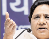
■ मामला ताकत की बजाय कानूनी तरीके से सुलझाए

शाह टाइम्स ब्यूरो लखनऊ। बहुजन समाज पार्टी अध्यक्ष मायावती ने सहारनपुर जिले के लालवाला गांव में हुई हिंसा पर चिंता जताते हुए निष्पक्ष कार्रवाई की मांग की है। सुश्री मायावती ने सोमवार को एकसुर पर लिखा, सहारनपुर के एक गांव में एक भूमि पर मूर्ति रखने को लेकर दो पक्षों के बीच विवाद हुआ, जो बाद में संघर्ष में बदल गया। उन्होंने आरोप लगाया कि इस घटना में दलित समाज के कई लोग घायल हुए हैं। बसपा अध्यक्ष ने पुलिस और प्रशासन से मामले में तत्काल तथा निष्पक्ष कार्रवाई करने की मांग करते हुए कहा कर्प प्रशासन को हालात पर पूरी तरह नियंत्रण रखते हुए शांति व्यवस्था बनाए रखने के लिए प्रभावी कदम उठाने चाहिए। बसपा सुप्रीमो ने दोनों पक्षों से भी संयम बरतने और आपसी सौहार्द बनाए रखने की अपील की। उन्होंने कहा कि मामले को ताकत के बजाय कानूनी तरीके से सुलझाया जाना चाहिए, ताकि क्षेत्र में तनाव न बढ़े और शांति कायम रह सके। गौरतलब है कि सहारनपुर के देवबंद क्षेत्र के लालवाला गांव में 9-10 मई को लगभग दो बीघा जमीन पर कब्जे और कथित तौर पर महाराणा प्रताप की मूर्ति लगाने को लेकर दो समुदायों के बीच हिंसक झड़प हुई। पत्थरबाजी और लाठीचार्ज में तीन महिलाओं समेत आठ लोग घायल हो गए। पुलिस ने घटना के बाद गांव में सुरक्षा बलों को तैनात कर निगरानी बढ़ा दी है। प्रशासनिक अधिकारी स्थिति पर नजर बनाए हुए हैं।