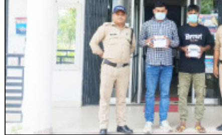
मोड़कर पुराना पथरी पावर हाउस की ओर भागने लगे। सैंडिच होने पर पुलिस टीम ने तत्परता दिखाते हुए दोनों युवकों का पीछा किया। भागने के दौरान बाइक अनियंत्रित होकर फिसल गई, जिसके बाद दोनों युवक