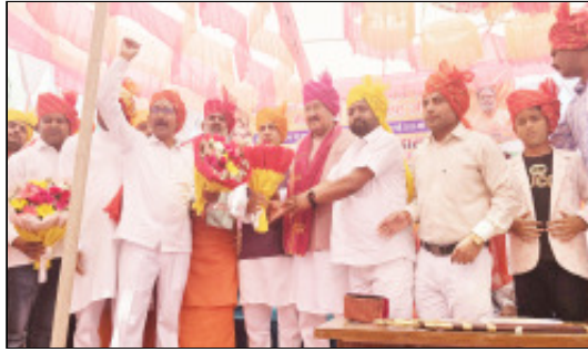
उन्होंने महाराणा प्रताप के जीवन को संघर्षमयी जीवन बताते हुए कहा कि ताकतों की सला होती। उन्होंने युवाओं को उन्हें अपना प्रेरणास्रोत बनाकर