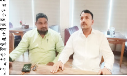
मैं है, यदि भाजपा पार्टी ने उन्हें आशीर्वाद दिया, तो वह इन मुद्दों को प्राथमिकता में शामिल रखेंगे

और विधानसभा क्षेत्र का प्रत्येक व्यक्ति सुराहाल होगा। एक सवाल में उन्होंने कहा कि वह भाजपा के