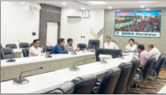
निगम हरिद्वार एवं रुड़की, विकासखंडों तथा लोक निर्माण विभाग को अपने-अपने क्षेत्रों के सभी छोटे-बड़े नालों और कलवर्टों

बैठक में आपदा के दौरान उपयोग होने वाले उपकरणों और संसाधनों की जांच, मरम्मत एवं खोज-बचाव सामग्री की उपलब्धता सुनिश्चित करने के भी निर्देश दिए गए। इसके अलावा नगर निगम हरिद्वार और रुड़की में कंट्रोल रूम सक्रिय करने तथा जिला आपदाकालीन परिचालन केंद्र से समन्वय बनाए रखने पर जोर दिया गया। अपर जिलाधिकारी ने सभी विभागों और स्थानीय निकायों को नालों की सफाई की दैनिक रिपोर्ट प्रतिदिन शाम 4 बजे तक आपदा प्रबंधन कार्यालय को भेजने के निर्देश दिए। वहीं वर्तमान आंधी-तूफान की स्थिति को देखते हुए सड़कों और आवासीय क्षेत्रों में जर्जर पेड़ों की कटाई एवं शाखाओं की छांटने समय से कराने के निर्देश भी जारी किए गए।