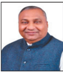
जुड़े मुद्दों को गंभीरता और प्रमुखता के साथ उठाने का कार्य किया है। सर्व समाज के हित में जो भी प्रयास सम्भव हो सके, उन्हें पूरी जिम्मेदारी, पारदर्शिता और ईमानदारी के साथ कराने का प्रयास