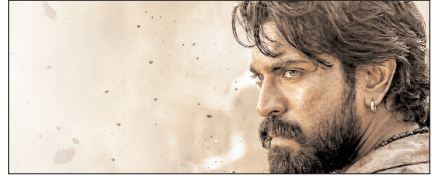
भोपाल में 16 मई को होगा 'पेड्डी' का ग्रैंड ट्रेलर लॉन्च