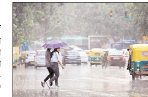
14 मई तक सामान्य से कम बारिश होने की संभावना