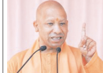
कैबिनेट विस्तार और संगठन में फेरबदल तथा आयोगों, निगमों और बोर्डों में खाली पदों पर नियुक्तियां जल्द