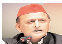
बीजेपी दुरावादी पार्टी आपस में करवाती है झगड़ा

महाराणा प्रताप की जयंती पर दो दिन का अवकाश घोषित करेंगे: सपा शाह टाइम्स ब्यूरो लखनऊ। यूपी की राजधानी लखनऊ में शनिवार को सपा जवादी पार्टी कार्यालय में महाराणा प्रताप की जयंती मनाई गई। इस दौरान पार्टी के मुखिया और पूर्व मुख्यमंत्री अखिलेश यादव ने एक प्रस कॉन्फ्रेंस कर एलान किया कि महाराणा प्रताप की जयंती पर दो दिन का अवकाश घोषित किया जाएगा। इसके साथ ही उन्होंने बीजेपी पर जमकर निशाना साधा। अखिलेश ने बीजेपी को दुरावादी करार दिया और कहा कि बीजेपी के लोग दुरावादी हैं, आपस में झगड़ा करवाने वाले लोग हैं। उन्होंने कहा कि बीजेपी के पास कोई काम नहीं है, ये लोग बस नकारात्मकता फैलाते हैं और एक-दूसरे के बीच लड़ाई लगावते हैं। सपा प्रमुख ने कहा कि हमको कल एक विकसित देश में बैलेट से वोट डाले गए, बैलेट से वोट पड़े, ये मांग हमारी रहेगी। वहीं एनसीआरवी के आंकड़ों पर अखिलेश यादव ने कहा कि उत्तर प्रदेश सरकार के वो आंकड़े हैं एनसीआरवी के वो सरकार के ही हैं। उन्होंने कहा कि महिलाएं और बेटियां प्रदेश में असुरक्षित हैं, उनमें डर का माहौल है। उन्होंने कहा कि जो जीरो टॉलरेंस की बात करते हैं उन्होंने ला एंड ऑर्डर जारी कर दिया। सपा प्रमुख ने कहा कि आने वाले समय में जब भी समाजवादी पार्टी की सरकार होगी, तो महाराणा प्रताप की जयंती पर दो दिन का अवकाश घोषित किया जाएगा। उन्होंने कहा कि गोमती रिबर फ्रंट पर पार्टी महाराणा प्रताप की चर्चा प्रथम लागाएगी, जिसमें चेतक भी होगा, सोने का भाला भी होगा।