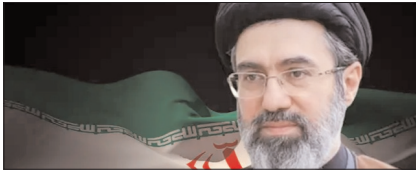
ईरान में प्रमुख ताकत बनकर उभरे मुजतबा खामेनेई