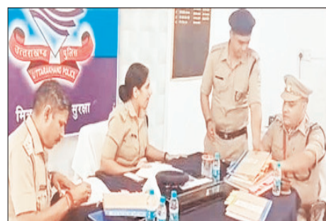
करने को कहा गया। उन्होंने बताया कि शहर में जाम की समस्या से निपटने के लिए पार्किंग व्यवस्था को मजबूत किया जा रहा है और नए पार्किंग स्थलों के चयन की प्रक्रिया जारी है। आगामी चारधाम यात्रा को देखते हुए विशेष ट्रैफिक प्लान तैयार किया जा रहा है, जिसके तहत अलग टीम गठित कर नियमित पैट्रोलिंग कराई जाएगी। एसपी ट्रैफिक ने कहा कि पुलिस आम जनता की सेवा के लिए प्रतिबद्ध है और सड़क सुरक्षा सुनि

निरीक्षण के दौरान उन्होंने अधिकारियों से आम जनता की ट्रैफिक से जुड़ी समस्याओं की जानकारी ली और उनके समाधान के लिए प्रभावी कदम उठाने के निर्देश दिए। साथ ही कर्मचारियों से भी उनकी समस्याएं जानीं और उन्हें प्राथमिकता के आधार पर निस्कारित करने का भरोसा दिलाया। एसपी ट्रैफिक ने कहा कि ट्रैफिक पुलिस का मुख्य उद्देश्य आम जनता