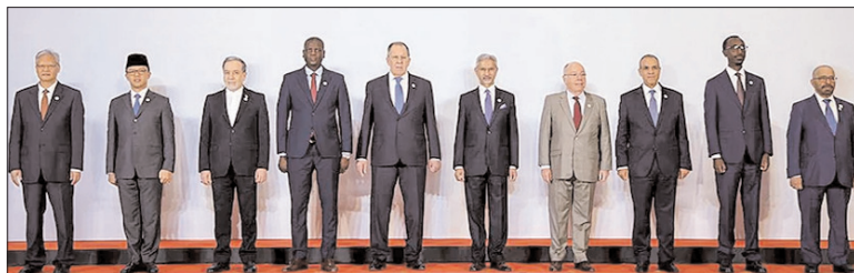
संस्थागत सुधारों पर केंद्रित संयोजन में अनिश्चितता का सामना कर रही है। इसके पीछे सशस्त्र संघर्ष, जलवायु संकट और कोविड महामारी के दीर्घकालिक प्रभाव प्रमुख कारण हैं। विदेश मंत्री ने कहा कि ये संकट अलग-अलग घटनाएं नहीं हैं, बल्कि

विदेश मंत्री डा. एस. जयशंकर ने गुरुवार को यहां हुए ब्रिक्स देशों के विदेश मंत्रियों की बैठक में अंतर्राष्ट्रीय सुरक्षा, आर्थिक असुरक्षा और