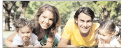
सामाजिकता की सबसे बड़ी कुंजी है परिवार सम्पादकीय