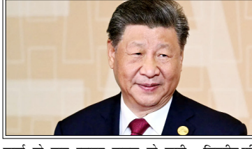
■ चीन के राष्ट्रपति ने कहा: अमेरिका-चीन के बीच टकराव का कारण बन सकता है ताइवान

बीजिंग। चीन के राष्ट्रपति शी जिनपिंग ने बीजिंग में हुई द्विदिवसीय वार्ता के दौरान अमेरिका के राष्ट्रपति डोनाल्ड ट्रम्प को चेतावनी दी है कि ताइवान मुद्दे पर किसी भी प्रकार की गलत रणनीति दोनों देशों को 'संघर्ष' की ओर धकेल सकती है। गुरुवार को महाशक्ति शिखर सम्मेलन के तहत हुई बैठक में ट्रम्प ने शी को 'महान नेता' और 'मित्र' बताते हुए कहा कि दोनों देशों का 'भविष्य शानदार' होगा। शी ने औपचारिक स्वागत समारोह के बीच अपेक्षाकृत सख्त लहजे में यह भी कहा कि दोनों देशों को 'प्रतिद्वंद्वी नहीं, बल्कि साझेदार' होना चाहिए। उन्होंने शुरूआत में ही ताइवान मुद्दे को चीन-अमेरिका संबंधों का सबसे महत्वपूर्ण विषय बताया। चीनी सरकारी मीडिया के अनुसार शी ने कहा कि ताइवान प्रश्न चीन-अमेरिका संबंधों का सबसे महत्वपूर्ण मुद्दा है। यदि इसे गलत तरीके से संभाला गया, तो दोनों देश टकराव या यहां तक कि संघर्ष की स्थिति में पहुंच सकते हैं, जिससे पूरे चीन-अमेरिका संबंध अत्यंत खतरनाक स्थिति में चले जाएंगे। यूरो-यूज की एक रिपोर्ट के अनुसार, करीब सवा दो घंटे तक चली प्रारंभिक