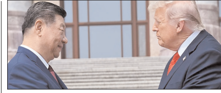
ताइवान पर चीन की अमेरिका को सख्त चेतावनी