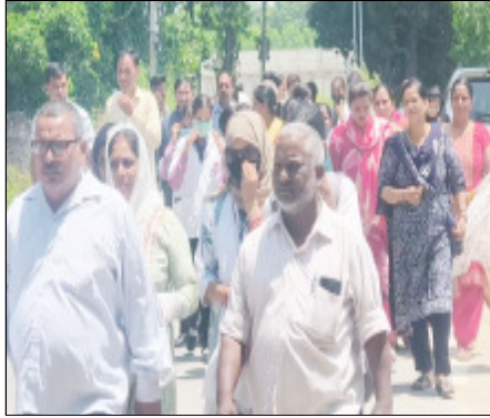
दौर की बातचीत के बावजूद अब तक कोई ठोस समाधान सामने नहीं आया है। गुरुवार को कॉलेज पहुंचे

बहादुराबाद। क्षेत्र के रोहालकी किरानपुर स्थित केयर कॉलेज में पिछले कई दिनों से चल रहा विवाद अब और गहरा गया है। गुरुवार को बड़ी संख्या में छात्र-छात्राओं के परिजन कॉलेज पहुंचे, लेकिन कॉलेज प्रबंधन और परिजनों के बीच हुई बातचीत किसी नतीजे पर नहीं पहुंच सकी। वार्ता असफल रहने के बाद मामले में तनाव और बढ़ता नजर आया। मिली जानकारी के अनुसार, छात्र-छात्राएं लंबे समय से अपने भविष्य, पढ़ाई और कॉलेज प्रबंधन से जुड़े मुद्दों को लेकर सवाल उठा रहे हैं। लगातार विरोध और कई