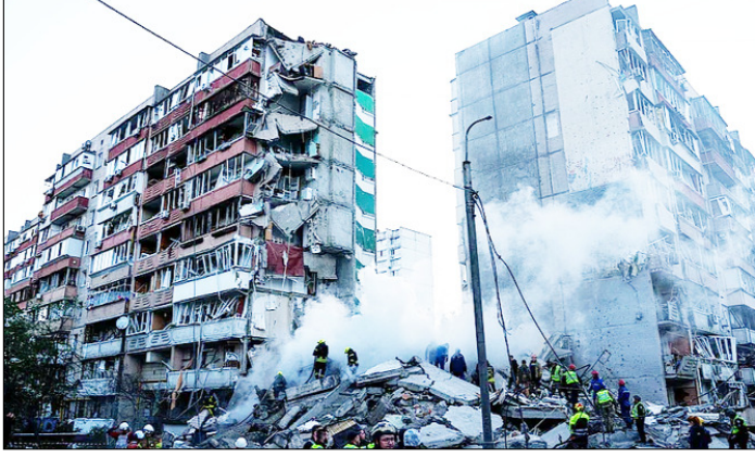
कीट। रूसी हमले के बाद एक आवासीय इलाके में बुरी तरह क्षतिग्रस्त हुए घर के मलबे को हटाने का काम चल रहा है।

न्यूयॉर्क। संयुक्त राष्ट्र बाल कोष (यूनिसेफ) ने कहा है कि 17 अप्रैल से लागू युद्धविराम के बाद से लेबनान में कम से कम 23 बच्चों की मौत हो चुकी है, जबकि 93 बच्चे घायल हुए हैं। यूनिसेफ ने बुधवार को जारी बयान में कहा, स्वास्थ्य मंत्रालय के अनुसार, सौजन्यपूर्ण शुरू होने के बाद से अब तक कम से कम 23 बच्चे मारे गए और 93 घायल हुए हैं। दो मार्च से अब तक कुल 200 बच्चों की मौत और 806 बच्चे घायल हुए हैं, यानी औसतन हर दिन लगभग 14 बच्चे मारे गए या फिर घायल हुए हैं। बयान में यह भी कहा गया कि पिछले सात दिनों में ही लेबनान में हमलों में मारे गए और घायल बच्चों की संख्या 59 पहुंच गई है। मंगलवार सुबह बेरूत के दक्षिण में एक कार पर हुए हमले में दो बच्चों और उनकी मां की मौत हुई है।