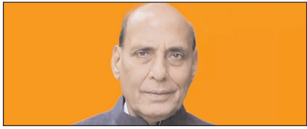
रक्षा विनिर्माण के क्षेत्र में आत्मनिर्भरता जरूरी: राजनाथ सिंह

नई दिल्ली, मुजफ्फरनगर, देहरादून, हल्द्वानी, मुगदाबाद, बरेली, मेरठ व लखनऊ से प्रकाशित