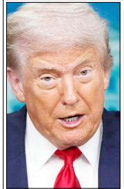
■ ट्रम्प के साथ विदेश मंत्री मार्को रुबियो, ट्रेजरी सचिव स्कॉट बेसेंट और रक्षा मंत्री पीट हेगसेथ भी चीन पहुंचे हैं

वाशिंगटन। चीन ताइवान को अपना हिस्सा मानता है, जबकि अमेरिका ताइवान को हथियार देने की तैयारी कर रहा है। ट्रम्प प्रशासन ने ताइवान के लिए 11 अरब डॉलर के हथियार पैकेज को मंजूरी दी है, हालांकि उसकी डिलीवरी अभी शुरू नहीं हुई है। ताइवान दुनिया में चिप निर्माण का बड़ा केंद्र है और आर्टिफिशियल इंटेलिजेंस उद्योग के लिए बेहद महत्वपूर्ण माना जाता है। ट्रम्प अमेरिका में चिप उत्पादन बढ़ाने के लिए ताइवान के साथ व्यापारिक सहयोग मजबूत करना चाहते हैं। इसी सिलसिले में एनवीडिया के सीओओ जेन्सेन हुआंग भी अमेरिकी प्रतिनिधिमंडल का हिस्सा बने हैं। ट्रम्प के साथ विदेश मंत्री मार्को रुबियो, ट्रेजरी सचिव स्कॉट बेसेंट और रक्षा मंत्री पीट हेगसेथ भी चीन पहुंचे हैं। इसके अलावा टेक, रक्षा, कृषि और वित्त क्षेत्र के कई बड़े कारोबारी भी प्रतिनिधिमंडल में शामिल हैं।