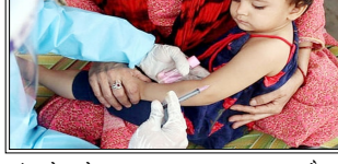
■ देश में खसरे के पुष्ट और संदिग्ध मामलों की कुल संख्या 60 हजार से अधिक हो गई है

मीडिया रिपोर्टों के अनुसार, पिछले 24 घंटों में कम से कम आठ और लोगों की मौत