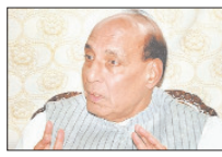
तेजी से बदलते वैश्विक सुरक्षा परिदृश्य में पुराने तरीकों पर निर्भर नहीं रह सकते: रक्षा मंत्री

नई दिल्ली, वार्ता रक्षा मंत्री राजनाथ सिंह ने रक्षा विनिर्माण के क्षेत्र में आत्मनिर्भरता पर जोर देते हुए विभिन्न हितधारकों के बीच बेहतर समन्वय को मजबूत करने का आह्वान किया है और कहा है कि तेजी से बदलते वैश्विक सुरक्षा परिदृश्य के बीच राष्ट्रीय सुरक्षा अब पुराने तरीकों पर निर्भर नहीं रह सकती। सिंह ने गुरुवार को यहां प्रमुख रणनीतिक संवाद 'कलम और कवच' में अपने वचुंअल संदेश में कहा कि इस मंच का नाम ही देश के भविष्य के सुरक्षा ढांचे की सशक्त दुष्टि को दर्शाता है। रक्षा मंत्री ने कहा कि कलम विचारों, तर्कों और आगे की सोच रखने के साहस का प्रतीक है। कवच शक्ति, सुरक्षा और राष्ट्र की रक्षा करने की क्षमता का प्रतीक है। जो देश स्पष्ट रूप से सोच सकता है और मजबूती से अपनी रक्षा कर सकता है, वही दुनिया में ऊंचा खड़ा होता है। हम ऐसे ही भारत के निर्माण की दिशा में काम कर रहे हैं। वैश्विक संघर्षों के बदलते स्वरूप पर सिंह ने कहा कि दुनिया भर में रणनीतिक परिदृश्य लगातार अधिक अनिश्चित, प्रतिस्पर्धी और प्रौद्योगिकी-आधारित होता जा रहा है। उन्होंने भू-राजनीतिक तनाव, संघर्ष, साइबर खतरों, आपूर्ति श्रृंखला की कमजोरी और हाइब्रिड युद्ध के उभरते स्वरूप को देशों के सामने मौजूद प्रमुख चुनौती बताया। उन्होंने कहा कि ऐसी दुनिया में राष्ट्रीय सुरक्षा पुराने आयामों पर आधारित नहीं रह सकती। इसके लिए हमारी तैयारी, लचीलापन, नवाचार और रणनी. तिक आत्मविश्वास आवश्यक है। रक्षा क्षेत्र में आत्मनिर्भरता के महत्व पर जोर देते हुए सिंह ने कहा कि आत्मनिर्भरता केवल आर्थिक लक्ष्य नहीं, बल्कि भारत के लिए रणनीतिक आवश्यकता