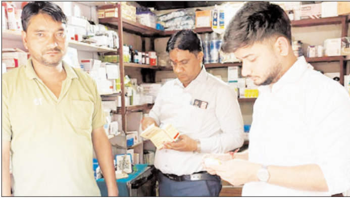
नारकोटिक दवाओं के दुरुपयोग पर प्रशासन सख्त केदारनाथ यात्रा के प्रमुख पड़ाव गौरीकुंड, सोनप्रयाग, पफाटा एवं रामपुर स्थित विभिन्न मेडिकल स्टोर्स का औचक निरीक्षण