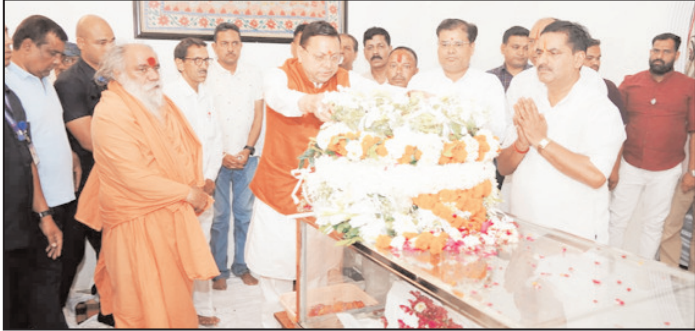
सीएम धामी ने स्वर्गीय खंडूडी को अर्पित की भावभीनी श्रद्धांजलि

खंडूडी का जाना केवल एक नेता का निधन नहीं माना जा रहा बल्कि उत्तराखंड की उस राजनीति के एक अध्याय का अंत माना जा रहा है। खंडूडी में सादगी अनुशासन और व्यक्तिगत ईमानदारी सबसे बड़ा गुण माना जाता था। आज उत्तराखंड में उनके निधन की खबर से पहाड़ के गांवों से लेकर मैदानों तक खामोशी छाई हुई है।