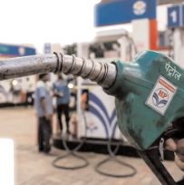
पेट्रोल 98.64 व डीजल 91.58 रुपये में एक लीटर मिलेगा

शाह टाइम्स ब्यूरो नई दिल्ली। राष्ट्रीय राजधानी दिल्ली में मंगलवार से पेट्रोल 87 पैसे और डीजल 91 पैसे प्रति लीटर महंगा हो गया। तेल विपणन कंपनियों ने पांच दिन में दूसरी बार दोनों ईंधनों के दाम बढ़ाए हैं।