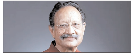
भुवन चंद्र खंडूजी का निधन: उत्तराखंड की सियासत के एक युग का अंत