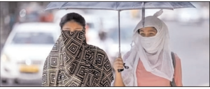
उत्तर प्रदेश में प्रचंड गर्मी से आम जनजीवन प्रभावित

नई दिल्ली, मुजफ्फरनगर, देहरादून, हल्द्वानी, मुदाबाद, बरेली, मेरठ व लखनऊ से प्रकाशित