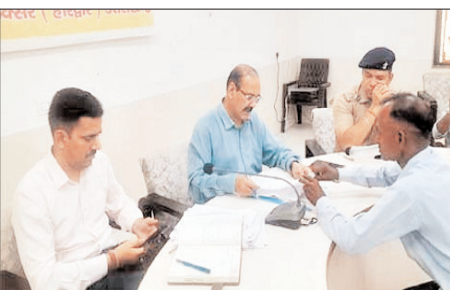
इस सड़क का निर्माण कार्य शुरू करवा दिया जाएगा। किसान की समस्या का समाधान। एक पीड़ित किसान ने शिकायत दर्ज कराई कि पिछले एक वर्ष से भी अधिक समय से उसके खेत में एक पेड़ गिरा हुआ है। वह उसे हटाने की अनुमति के लिए लगातार अधिकारियों के चक्कर काट रहा था। मामले को गंभीरता से लेते हुए एसडीएम ने वन विभाग के कर्मचारियों को तुरंत पेड़ हटाने की अनुमति देने और कार्रवाई

है। एसडीएम ने कड़े निर्देश दिए हैं कि इन सभी लंबित शिकायतों का निस्तारण अगले 15 दिनों के भीतर मौके पर जाकर सुनिश्चित किया जाए। तहसील दिवस में आए कुछ प्रमुख मामलों में एसडीएम ने लापरवाही एक शिकायतकर्ता ने बताया कि उसने अपना गैस सिलेंडर बुक कराया था, लेकिन एजेंसी ने उसका सिलेंडर किसी दूसरे व्यक्ति को दे दिया। अब उसे रोजाना परेशान कर दोबारा बुकिंग कराने को कहा जा रहा है तहसील रोड का निर्माण लक्कर तहसील मार्ग की बदहाली को लेकर नगर पालिका परिषद से जवाब मांगा गया था। इस पर नगर पालिका के अधिकारियों ने आश्वासन दिया कि बहुत जल्द