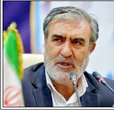
द टेलीग्राफ की रिपोर्ट के मुताबिक 500 करोड़ से ज्यादा का इनाम दे सकता है ईरान। ईरानी संसद का राष्ट्रीय सुरक्षा आयोग इस बिल की तैयारी कर रहा है।

तेहरान/वाशिंगटन। ईरान की संसद अमेरिकी राष्ट्रपति डोनाल्ड ट्रम्प और इजराइली प्रधानमंत्री बेंजामिन नेतन्याहू की हत्या करने वालों को 500 करोड़ से ज्यादा इनाम देने वाला बिल ला सकती है। द टेलीग्राफ की रिपोर्ट के मुताबिक, ईरानी संसद का राष्ट्रीय सुरक्षा आयोग इस बिल की तैयारी कर रहा है। आयोग के प्रमुख इब्राहिम अजीजी ने कहा कि 'इस्लामिक रिपब्लिक की सैन्य और सुरक्षा बलों की जवाबी कार्रवाई' नाम से बिल तैयार किया जा रहा है। ईरानी संसद महमूद नवाविजन ने कहा कि संसद जल्द इस बिल पर वॉटिंग कर सकती है, जो ट्रम्प और नेतन्याहू को जहन्यम पहुंचाने वालों को इनाम देगा। रिपोर्ट में कहा गया है कि ईरान के सर्वोच्च