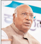
मल्लिकार्जुन खड़गे, कांग्रेस अध्यक्ष

सरकार ने 15 मई के बाद आज सुबह अचानक फिर पेट्रोल और डीजल के दाम बढ़ा दिए, अब स्पष्ट हो गया है कि देश संकट में है और श्री मोदी को इसका जवाब देना चाहिए, दाम बढ़े चार ही दिन हुए कि मोदी सरकार ने पेट्रोल-डीजल के दाम फिर बढ़ा दिए, पूरी भूमिका बनाकर, बचत का उपदेश देकर अपनी नाकामियों का बोझ जनता पर डालने का कार्य प्रगति पर है, आम जनता की लूट और उद्योग पति गौतम अडानी को अमेरिका से छूट, यही मोदी जी का कम्प्रोमाइज्ड मॉडल है। प्रधानमंत्री ने अमेरिका से हाथ-पैर जोड़कर रूसी तेल खरीदने की अनुमति की अर्वाह एक महीने के लिए बढ़वाई है और इससे देश के स्वाभिमान को ठेस पहुंची है। उन्होंने कहा कि यदि सरकार के अनुसार रूसी तेल खरीदने की अनुमति मिल गई है, तो पेट्रोल-डीजल की कीमतों का बोझ आम जनता पर क्यों डाला जा रहा है।