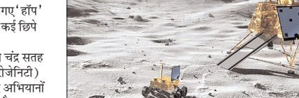
वैज्ञानिक आधार और आवास निर्माण की योजनाओं के लिए आवश्यक है। यह अध्ययन इस प्रकार का पहला अग्रगण्य उदाहरण है। उल्लेखनीय है कि चंद्रयान-3 का विक्रम लैंडर

चेन्नई। भारत के तीसरे चंद्र मिशन चंद्रयान-3 के विक्रम लैंडर द्वारा किए गए 'हॉप' प्रयोग के दक्षिणी ध्रुव से जुड़े कई छिपे रहस्यों का खुलासा किया है। वैज्ञानिकों ने इस प्रयोग के जरिये चंद्र सतह की रेगोलिथ विषयमता (रेगोलिथ हेटेरोजेनिटी) का पता लगाया है, जो भविष्य के चंद्र अभियानों के लिए बेहद महत्वपूर्ण माना जा रहा है। इन निष्कर्षों से चंद्रमा के दक्षिणी ध्रुवीय क्षेत्र में सतही अभियानों को लेकर नई जानकारी मिली है। वैज्ञानिकों का कहना है कि स्थानीय स्तर पर सतह की विविधता को समझना भविष्य में चंद्रमा पर