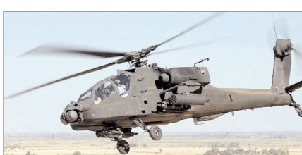
भारतीय सैन्य ताकत होगी और मजबूत

वाशिंगटन, वार्ता भारत और अमेरिका के बीच रक्षा सहयोग लगातार मजबूत होता जा रहा है। इसी कड़ी में अमेरिका ने भारत को अपाचे हेलीकॉप्टर और एम777ए2 अल्ट्रा-लाइट हॉवित्जर तोपों के लिए सपोर्ट सर्विस और संबंधित उपकरणों की संभावित बिक्री को मंजूरी दे दी है। अमेरिकी विदेश विभाग ने इस फैसले की आधिकारिक जानकारी दी। अमेरिका के अनुसार, अपाचे हेलीकॉप्टरों के लिए सपोर्ट सर्विस डील की अनुमानित कीमत करीब