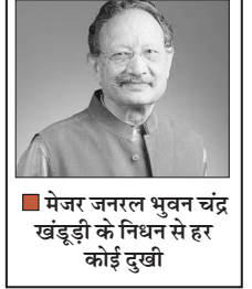
मेजर जनरल भुवन चंद्र खंडूड़ी के निधन से हर कोई दुखी