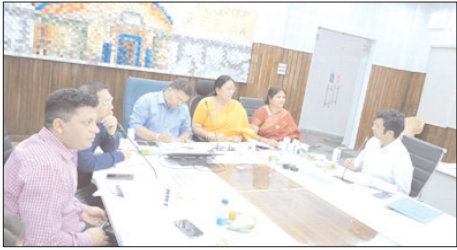
■ आजीविका, पर्यटन, सड़क, पेयजल और ग्रामीण विकास योजनाओं पर रहेगा विशेष फोकस