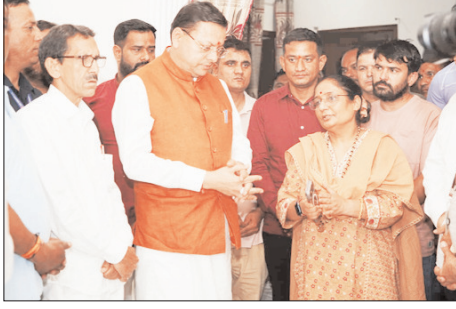
मुख्यमंत्री पुष्कर सिंह धामी ने पूर्व मुख्यमंत्री बी.सी. खंडूडी के निधन पर उनके आवास पहुंच कर विधानसभा स्पीकर ऋतु खंडूडी से मिलकर शोक संवेदना जताई।

सुबह 10 बजे प्रदेश भाजपा कार्यालय में लाया जाएगा खंडूडी का पार्थिव शरीर