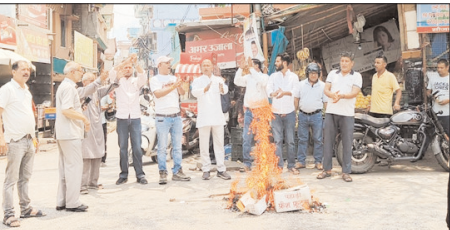
कीर्तिनगर में कांग्रेसियों ने फूँका सरकार का पुतला

शाह टाइम्स संवाददाता कीर्तिनगर। डीजल-पेट्रोल की बढ़ती कीमतों और लगातार सामने आ रहे परीक्षा पेपर लीक मामलों को लेकर कांग्रेस कार्यकर्ताओं ने विरोध प्रदर्शन किया।