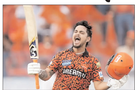
जब मैं विकेटकीपिंग कर रहा था तो मुझे एहसास हुआ कि पिच आसान नहीं है। मुझे लग रहा था कि इस टोटल को भी हासिल करना आसान नहीं होने वाला है क्योंकि पिच इतनी आसान नहीं थी और खास तौर से स्पिनर्स और

तीसरे ओवर में तीन नम्बर पर बल्लेबाजी करने आए किशन ने ए सुनिश्चित किया कि वह अंत तक क्रीज पर रहेंगे। 47 गेंदों में 70 रन बनाकर जब वह आउट हुए तब एसआरएच को नौ गेंदों में केवल छह रन चाहिए थे। पोस्ट मैच प्रेजेंटेशन में किशन ने कहा कि