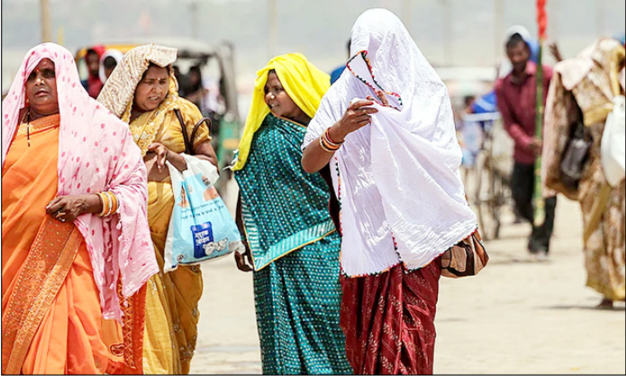
प्रयागराज। भीषण गर्मी के बीच सिर पर पल्लू डालकर तेज धूप से खुद को बचाती महिलाएं।