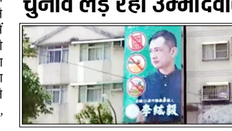
विपक्षी सांसद बोले: वे अपराधी होते हैं, भारतीय बोले: यह नस्लीय भेदभाव है