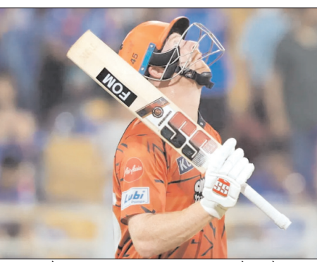
रन बनाए और फिर से 555 रन के साथ तालिका में शीर्ष पर पहुंच गए। वह साई सुदर्शन से सिर्फ एक रन और शुभमन गिल से तीन रन आगे हैं। गुजरात टाइटन्स (जीटी) के दोनों ओपनर अभी भी ऑरेंज कैप की दौड़ में मजबूती से बने हुए हैं। टॉप पांच में उनके पीछे विराट कोहली (आरसीबी) 542

ऑरेंज कैप लीडरबोर्ड एसआरएच के स्टार बल्लेबाज हेनरिक क्लासेन के पास मैचों के बीच छह दिन का अंतर था और उनकी गैरमौजूदगी में ऑरेंज कैप की खिलाड़ियों के बीच घूमती रही। लेकिन सोमवार को वापसी करते हुए उन्होंने 26 गेंदों पर 47