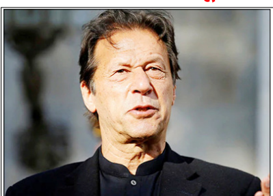
इमरान खान ने 24 फरवरी 2022 को मास्को में रूसी राष्ट्रपति व्लादिमीर पुतिन से मुलाकात की थी। मुलाकात के बाद ठीक उसी दिन रूस ने यूक्रेन पर हमला शुरू किया था।

इस्लामाबाद/वाशिंगटन। पाकिस्तान के पूर्व प्रधानमंत्री इमरान खान की सरकार गिरने को लेकर नया दावा सामने आया है। अमेरिकी मीडिया आउटलेट ड्रॉप साइट न्यूज की रिपोर्ट में कहा गया है कि इमरान को कुर्सी सिर्फ अविश्वास प्रस्ताव से नहीं गई थी। इसके पीछे अमेरिकी साजिश और पाक सेना की भूमिका थी। रिपोर्ट के मुताबिक, इमरान खान ने 24 फरवरी 2022 को मास्को में रूसी राष्ट्रपति व्लादिमीर पुतिन से मुलाकात की थी। ठीक उसी दिन रूस ने यूक्रेन पर हमला शुरू किया था। अमेरिका इस यात्रा से नाराज था। वह चाहता था कि पाकिस्तान यूक्रेन युद्ध पर रूस की खुलकर आलोचना करे, लेकिन इमरान सरकार ने तटस्थ रुख अपनाया।