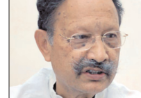
काफी समय से मैक्स अस्पताल में चल रहा था इलाज, सीएम धामी ने जताया दुख

शाह टाइम्स ब्यूरो देहरादून। उत्तराखंड के पूर्व मुख्यमंत्री भुवन चंद्र खंडूजी का मंगलवार को निधन हो गया। वे काफी समय से अस्वस्थ होने के कारण देहरादून के मैक्स अस्पताल में भर्ती थे। सीएम पुष्कर सिंह धामी ने पूर्व मुख्यमंत्री ने निधन पर शोक व्यक्त किया है। देहरादून स्थित मैक्स सुपर स्पेशलिस्ट हॉस्पिटल में उनका पिछले तकरवीर एक माह से इलाज चल रहा था। बताया जा रहा है कि खंडूजी हृदय संबंधी दिक्कतों से जूझ रहे थे। 91 साल की उम्र में उनका निधन हुआ। वे