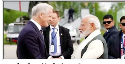
व्यापार और संस्थागत सहयोग के तहत भी कई महत्वपूर्ण समझौतों को अंतिम रूप दिया गया

ओस्लो। भारत और नार्वे ने द्विपक्षीय संबंधों को नई दिशा देते हुए अपने संबंधों को ग्रीन स्ट्रेटजिक पार्टनरशिप के स्तर तक उन्नत करने के साथ-साथ समुद्री सहयोग, हरित प्रौद्योगिकी, अंतरिक्ष, स्वास्थ्य, डिजिटल विकास और वैज्ञानिक अनुसंधान सहित कई क्षेत्रों में सहयोग को मजबूत करने के उद्देश्य से नौ समझौतों और तीन पहलों की घोषणा की है।