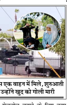
दोनों के शव मस्जिद के पास एक वाहन में मिले, शुरुआती जांच में माना जा रहा है कि उन्होंने खुद को गोली मारी

वाशिंगटन। अमेरिका के सैन डिएगो स्थित मस्जिद में गोलीबारी में 5 लोगों की मौत हो गई। इनमें एक सिविलियर गार्ड और दो संदिग्ध शामिल हैं। पुलिस के मुताबिक, दोनों संदिग्ध किशोर थे। एक की उम्र 17 साल और दूसरे की 19 साल थी। दोनों के शव मस्जिद के पास एक वाहन में मिले। शुरुआती जांच में माना जा रहा है कि उन्होंने खुद को गोली मारी। इस मामले की जांच हेतु फ्रांसिस के एंगल से की जा रही है। हालांकि, हमले के पीछे की वजह पर फिलहाल ज्यादा जानकारी शेर नहीं की गई है। यह हमला इस्लामिक सेंटर ऑफ सैन डिएगो में हुआ। यह सैन डिएगो काउंटी की सबसे बड़ी मस्जिद है। परिसर में एक स्कूल भी है, जहां बच्चों को अरबी भाषा, इस्लामिक