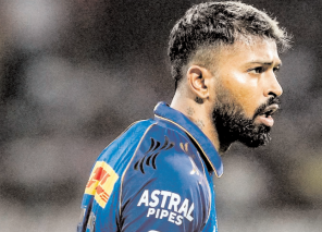
कोलकाता, वार्ता। मुंबई इंडियंस (एमआई) के कप्तान हार्दिक पंड्या पर उनकी मैच फीस का 10 प्रतिशत जुर्माना लगाया गया है और साथ ही उन्हें एक डिमेंटर पॉइंट भी दिया गया है। यह कार्रवाई बुधवार को कोलकाता के इंडन गार्डन में कोलकाता नाइट राइडर्स (केकेआर) के खिलाफ खेले गए मैच में हुई थी। हार्दिक पंड्या को कोलकाता नाइट राइडर्स के लिए आईपीएल की आचार संहिता के अनुच्छेद 2-2 का उल्लंघन करते हुए पचा गया। यह अनुच्छेद मैच के दौरान क्रिकेट के