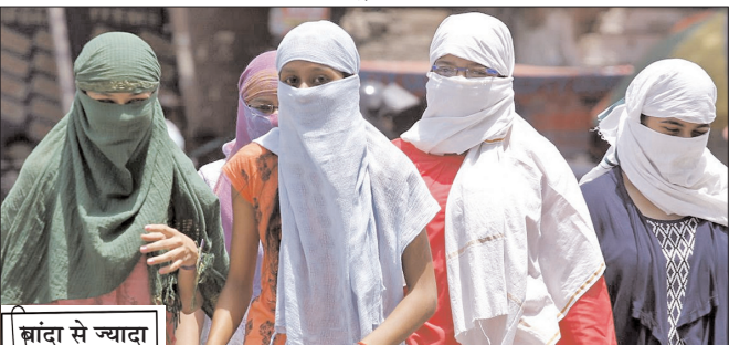
बांदा से ज्यादा तापमान मिस्त्र के असवान में 49.4 डिग्री और सऊदी के अराफात में 48.4 डिग्री सेल्सियस रहा

दुनियाभर में सबसे ज्यादा तापमान वाले टॉप-5 शहरों में खजुराहो 47.4 डिग्री सेल्सियस के साथ चौथे नंबर पर रहा। इधर, बलरामपुर में भीषण गर्मी के कारण कस्तूरबा गांधी आवासीय विद्यालय में पढ़ाई के दौरान 8 छात्राएं बेहोश हो गईं। सभी को उल्टी, सिरदर्द और बेहोशी जैसी शिकायतें-शेष पृष्ठ दो पर