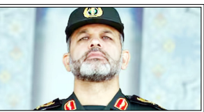
अहमद वहीदी लंबे समय से ईरान की सुरक्षा और सैन्य रणनीति का अहम चेहरा रहे हैं

तेहरान। अमेरिका के साथ जारी युद्धविराम और परमाणु वार्ता के बीच ईरान में एक कट्टरपंथी सैन्य चेहरे का प्रभाव तेजी से बढ़ा दिख रहा है। ईरान की रिवोल्यूशनरी गार्ड के प्रमुख ब्रिगेडियर जनरल अहमद वाहिदी अब अमेरिका के साथ संपादित समझौते और युद्ध खत्म करने को लेकर रणनीति तय करने वाले सबसे अहम नेताओं में शामिल माने जा रहे हैं। रिपोर्ट के मुताबिक, वहीदी उन चुनिंदा नेताओं में शामिल हैं जो ईरान के सर्वोच्च नेता मौजतबा खामेनेई के सीधे संपर्क में हैं। बताया जा रहा है कि फरवरी में इजरायली हमलों में घायल होने के बाद खामेनेई सार्वजनिक जीवन से दूर हैं। ऐसे में ईरान की सत्ता के भीतर प्रभाव और नियंत्रण को लेकर खींचतान तेज हो गई है। अहमद वहीदी लंबे समय से ईरान की सुरक्षा और सैन्य रणनीति का अहम