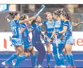
भारतीय महिला हॉकी टीम गुरुवार तक के ऑस्ट्रेलिया के पर्य दौरे के लिए स्वाना हो गई। टीम 26, 27, 29 और 30 मई को पर्य हॉकी स्टेडियम में मेजबान टीम के खिलाफ चार मैच खेलेगी।

बेंगलूर, वार्ता। भारतीय महिला हॉकी टीम गुरुवार तक के ऑस्ट्रेलिया के पर्य दौरे के लिए स्वाना हो गई। टीम 26, 27, 29 और 30 मई को पर्य हॉकी स्टेडियम में मेजबान टीम के खिलाफ चार मैच खेलेगी। यह दौरा कई प्रतिस्पर्धी नाम का अवसर प्रदान करेगा, जिससे भारतीय महिला हॉकी टीम को दुनिया की सर्वश्रेष्ठ टीमों में से एक के खिलाफ खूब को परखने का मौका मिलेगा।