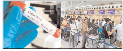
इबोला का डर: नजर रखें और सतर्क रहें