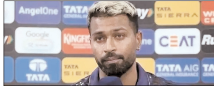
हार्दिक पंड्या पर मैच फीस का 10 फीसदी जुर्माना