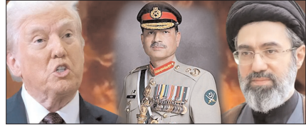
पाकिस्तान के जरिये अमेरिका का नया युद्ध विराम प्रस्ताव