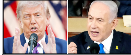
कतर, सऊदी अरब और यूएई जैसे खाड़ी देशों की अपील पर यह फैसला लिया गया: ट्रंप

नेल अविव/वाशिंगटन। ईरान युद्ध को लेकर अमेरिकी राष्ट्रपति डोनाल्ड ट्रंप और इजरायली प्रधानमंत्री बेजायिन नेतन्याहू के बीच मतभेद खुलकर सामने आ गए हैं। एक रिपोर्ट के मुताबिक, नेतन्याहू चाहते हैं कि ईरान पर हमले जारी रहें, जबकि ट्रंप फिलहाल बातचीत और डील को मौका देना चाहते हैं। रिपोर्ट के मुताबिक, मंगलवार को दोनों नेताओं के बीच करीब एक घंटे तक फोन पर बातचीत हुई। अमेरिकी अधिकारी ने बताया कि नेतन्याहू ने ट्रंप से कहा कि ईरान पर प्रस्तावित हमले रोकना गलती है और सैन्य कार्रवाई जारी रहनी चाहिए। ट्रंप ने नेतन्याहू को बताया था कि अमेरिका ईरान पर नए टारगेट्स हमले की तैयारी कर रहा है। इस ऑपरेशन को 'ऑपरेशन स्लेजहैमर' नाम दिया जाना था, लेकिन करीब 24 घंटे बाद ट्रंप ने घोषणा कर दी कि मंगलवार के लिए तय हमलों को फिलहाल रोक दिया गया है। ट्रंप ने कहा कि कतर, सऊदी अरब और यूएई जैसे खाड़ी देशों को