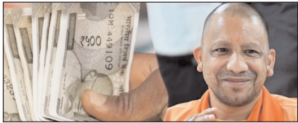
यूपी के कर्मचारियों-पेंशनरों को राहत, डीए 2 प्रतिशत बढ़ा

नई दिल्ली, मुजफ्फरनगर, देहरादून, हल्द्वानी, मुरादाबाद, बरेली, मेरठ व लखनऊ से प्रकाशित