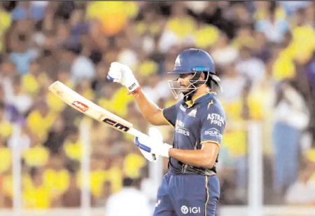
लॉग-ऑफ पर शार्द को कैच धमकते सुदर्शन ने 53 गेंदों में 84 रन की बहतरीन पारी खेली, जिसमें 7 चौके और 4 छक्के शामिल हैं। इसके बाद तबतिया विना खाला खेले रन आउट हो गए। गायकबाइ ने मिड-आफ से शानदार डाइरेक्ट हिट लगाकर उन्हें पवेलियन भेजा। हालांकि,

जवाब में लक्ष्य की पीछा करने उतरी चेन्नई की खराब शुरूआत, 31 रन पर तीन विकेट खोए