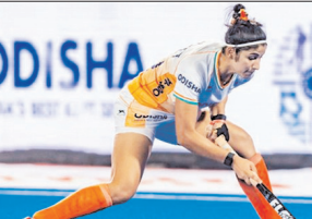
भारतीय अंडर 18 महिला हॉकी टीम ने मध्य प्रदेश के उदय मय मंडला (पाई जी) सेंद्रल साई सेंटर में खेले जा रही सीरीज के चौथे और अंतिम मैच में ऑस्ट्रेलिया की अंडर18 महिला टीम को 4-1 से हराकर शानदार परफॉर्म किया।