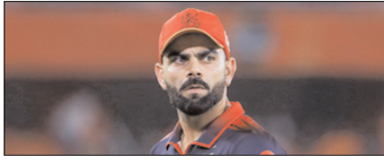
एसआरएच के खिलाफ मैच के बाद कोहली ने हेड से नहीं मिलाया हाथ