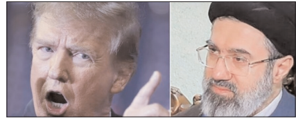
ट्रम्प की धमकियों पर ईरान का पलटवार