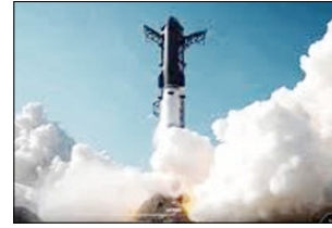
■ लगभग एक घंटे बाद स्टारशिप स्पेसक्राफ्ट हिंद महासागर में सुरक्षित लैंड करने में कामयाब रहा

टेक्सास। दुनिया के सबसे ताकतवर रॉकेट स्टारशिप के नए और बड़े वर्जन (वी-3) का पहला लॉन्च सफलताओं और नौकामियों का मिला-जुला सफर रहा। टेक्सास के दक्षिणी छोर पर स्थित स्टारबेस लॉन्चिंग पैड से उड़ान भरने के बाद इंजन में खराबी आ गई। इस कारण रॉकेट के नष्ट होने का खतरा मंडरा रहा था। इसके बावजूद लगभग एक घंटे बाद स्टारशिप स्पेसक्राफ्ट हिंद महासागर में सुरक्षित लैंड करने में कामयाब रहा। स्टारशिप सीरीज के पहले भी कई लॉन्च हो चुके हैं, लेकिन इस तीसरी पीढ़ी (वी-3) के अपग्रेड रॉकेट का पहला ही टेस्ट था और स्टारशिप का 12वां टेस्ट था। इसे भारतीय समय के अनुसार 23 मई की सुबह लॉन्च किया गया। दुनिया के सबसे अमीर कारोबारी इलान मस्क की कंपनी स्पेसएक्स ने इस रॉकेट को बनाया है। स्टारशिप स्पेसक्राफ्ट (ऊपरी हिस्सा) और सुपर हेवी बूस्टर (निचला हिस्सा) को कलंबियाली 'स्टारशिप' कहा