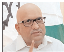
महोबा पुलिस ने विभिन्न गंभीर धाराओं में मुकदमा दर्ज किया, बिना सूचना निकाला था काफिला

प्रधानमंत्री नरेंद्र मोदी के विरुद्ध अभद्र टिप्पणी एवं आपत्तिजनक टिप्पणी करने के आरोप में उत्तर प्रदेश कांग्रेस अध्यक्ष अजय राय तथा उनके सहयोगियों को खिलाफ महोबा पुलिस ने विभिन्न गंभीर धाराओं में मुकदमा दर्ज किया है।