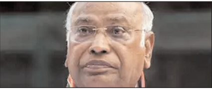
तीन बार ईंधन मूल्य में वृद्धि, सरकार में नेतृत्व संकट का संकेत : खड़गे

नई दिल्ली, मुजफ्फरनगर, देहरादून, हल्द्वानी, मुगदाबाद, बरेली, मेरठ व लखनऊ से प्रकाशित