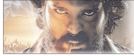
'पेड़ड़ी' दे सकती है रामचरण के करियर को नई पहचान