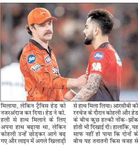
मिलाया, लेकिन ट्रैविस हेड को नजरअंदाज कर दिया। हेड ने कोहली से हाथ मिलाने के लिए अपना हाथ बढ़ाया था, लेकिन कोहली उन्हें छोड़कर आगे बढ़ गए और लाइन में अगले खिलाड़ी से हाथ मिला लिया। आरसीबी की रनचेज के दौरान कोहली और हेड के बीच कुछ हल्की नोक-झोंक होती भी दिखाई दी। हालांकि, यह साफ नहीं हो पाया कि दोनों के बीच यह तनाव किस वजह से

हैदराबाद, वार्ता। आईपीएल 2026 में हैदराबाद के सनराइजर्स (एसआरएच) और रॉयल चैलेंजर्स बंगलुरु (आरसीबी) मैच के बाद आरसीबी के सलामी बल्लेबाज विराट कोहली ने एसआरएच के सलामी बल्लेबाज ट्रैविस हेड से हाथ मिलाने से इनकार कर दिया। मैच के बाद होने वाली पारंपरिक हैंडशेक लाइन में कोहली ने एसआरएच कप्तान पेट कमिस और अभिषेक शर्मा से हाथ