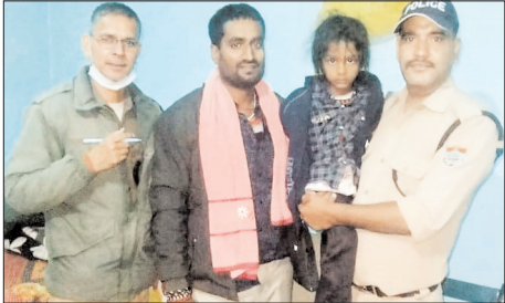
गौरीकुण्ड पुलिस ने त्वरित कार्रवाई कर परजनों से मिलया

शाह टाइम्स संवाददाता रुद्रप्रयाग। केदारनाथ धाम यात्रा मार्ग पर रुद्रप्रयाग पुलिस की सतर्कता और संवेदनशील कार्यशैली का एक और सराहनीय उदाहरण सामने आया है। गौरीकुण्ड पुलिस ने भीड़भाड़ के बीच परजनों से बिछड़े 5 वर्षीय मासूम बच्चे को त्वरित कार्रवाई करते हुए सकुशल खोजकर उसके परिवार के सुपुर्द कर दिया।