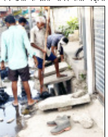
नालियों की सफाई और कूड़ा निस्तारण कार्य में तेजी से काम चल रहा है।

शुभ समापन होने के तुरंत बाद जिला प्रशासन ने सफाई कार्यों को प्राथमिकता देते हुए नगर निगम, लोक निर्माण विभाग, राष्ट्रीय राजमार्ग प्राधिकरण तथा अन्य संबंधित एजेंसियों को संयुक्त रूप से अभियान चलाने के निर्देश दिए। परिणामस्वरूप विभिन्न क्षेत्रों में नालियों की सफाई, सड़कों से कूड़ा हटाने और जलभरण की समस्याओं को दूर करने के लिए तेजी से कार्य शुरू कर दिया गया।