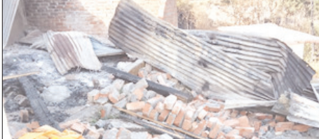
सामान भी पूरी तरह नष्ट हो गया। आग लगने की सूचना मिलते ही स्थानीय ग्रामीण मौके पर पहुंचे और आग बुझाने का भरसक प्रयास किया, लेकिन तेज लपटों के कारण आग पर काबू पाना मुश्किल हो

शाह टाइम्स संवाददाता चकराता। विकासखंड कालसी के नागथात स्थित सरस्वती शिशु विद्या मंदिर में जंगल में लगी भीषण आग ने भारी तबाही मचा दी। आग की चपेट में आने से विद्यालय का संपूर्ण स्टोर रूम तथा एक कमरे को खिड़की और दरवाजा जलकर राख हो गए। स्टोर रूम में रखा फर्नीचर, अलमारियां एवं अन्य आवश्यक