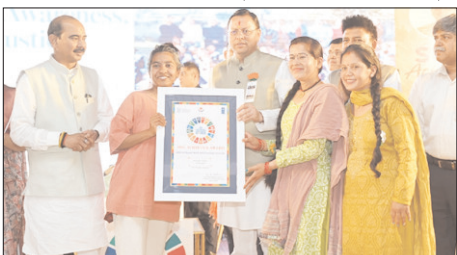
समारोह उदय शंकर नृत्य एवं संगीत अकादमी में हुआ आयोजित

शाह टाइम्स ब्यूरो देहरादून। राज्य स्तरीय एसडीजी एचीवर्स अवार्ड समारोह अल्मोड़ा के उदय शंकर नृत्य एवं संगीत अकादमी में सम्पन्न हुआ। कार्यक्रम में मुख्यमंत्री पुष्कर सिंह धामी ने बतौर मुख्य अतिथि प्रतिभाग किया। इस वर्ष के लिए 32 संघटनों, व्यक्तियों, समूहों को उनके द्वारा किए गए नवाचारी एवं सतत पहलों के लिए सम्मानित किया गया। इसके अतिरिक्त जिला स्तरीय एसडीजी की वार्षिक रैंकिंग में 6 जनपदों को शीर्ष तीन स्थान प्राप्त करने पर पुरस्कृत किया गया। मुख्यमंत्री ने पुरस्कृत विजेताओं को बधाई दी। मुख्यमंत्री पुष्कर सिंह धामी ने एसडीजी एचीवर्स अवार्ड समारोह को संबोधित करते हुए कहा कि आज का यह अवसर उन सभी