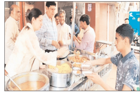
हुए कहा कि माता जी की पुण्यतिथि को अपने श्रीचरणों में शाश्वत शांति प्रदान करें।