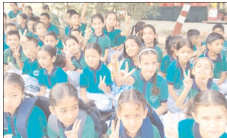
मीटर रेस तथा अन्य कई रोमांचक खेलों का आयोजन किया गया। प्रत्येक प्रतियोगिता में खिलाड़ियों ने शानदार प्रदर्शन कर अपनी क्षमता और खेल कौशल का परिचय दिया।

शाह टाइम्स संवाददाता विकासनगर। ब्राइट एंजेल्स स्कूल जीवनगढ़ विकासनगर में खेल भावना के साथ वार्षिक स्पोर्ट्स वीक का आयोजन किया गया। पूरे सप्ताह विद्यालय का वातावरण प्रतियोगिता की भावना से सराबोर रहा। स्पोर्ट्स वीक में विद्यालय के जूनियर एवं सीनियर वर्ग के छात्रों ने बड़ चढ़कर भाग लिया। प्रतियोगिताओं में खो-खो, फुटबाल, कबड्डी, बैडमिंटन, बास्केटबॉल, स्कूल रेस, 50 व 100