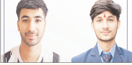
पीवाईडीएस से जुड़े दो नए छात्रों को मिली 100 प्रतिशत स्कॉलरशिप