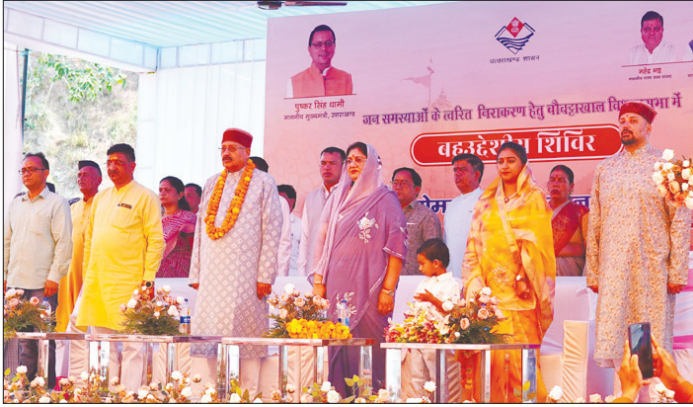
मंत्री का स्वास्थ्य जांच भी की गई। विभिन्न विभागों द्वारा लगाए गए स्टॉल लोगों के आकर्षण का केंद्र रहे।

बुधवार को चौबट्टाखाल विधानसभा क्षेत्र के अंतर्गत पोखड़ा विकासखंड मुख्यालय में सोमनाथ स्थापना पर्व के अवसर पर बहुउद्देशीय शिविर और सांस्कृतिक कार्यक्रम आयोजित किए गए। शिविर का शुभारंभ करते हुए कैबिनेट मंत्री सतपाल महाराज ने अधिकारियों को जनता की समस्याओं के त्वरित समाधान के निर्देश दिए। शिविर में 20 दिव्यांग जनों को विकलांग प्रमाण पत्र वितरित किए गए, जबकि करीब 150