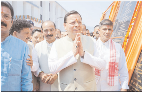
17 योजनाओं का लोकार्पण तथा 9 योजनाओं का किया शिलान्यास

शाह टाइम्स ब्यूरो अल्मोड़ा। मुख्यमंत्री पुष्कर सिंह धामी ने आज अल्मोड़ा पहुंचकर करीब 138 करोड़ की योजनाओं का लोकार्पण और शिलान्यास किया। इस अवसर पर मुख्यमंत्री ने कुल 138.092 करोड़ ₹0 की योजनाओं का लोकार्पण एवं शिलान्यास किया गया जिनमें 112.113 करोड़ ₹0 का लोकार्पण एवं 25.979 करोड़ ₹0 की योजनाओं का शिलान्यास किया। अल्मोड़ा के सोबन सिंह जीना विवि के नवीन प्रशासनिक भवन में आयोजित कार्यक्रम में मुख्यमंत्री ने अल्मोड़ा को विभिन्न विकास योजनाओं की सौगात दी है। मुख्यमंत्री ने कहा कि इन योजनाओं से सड़क, शिक्षा, स्वास्थ्य, पेयजल, सिंचाई, नगर विकास एवं ग्रामीण आधारभूत सुविधाओं को नई मजबूती मिलेगी। उन्होंने कहा कि हमारी सरकार का स्पष्ट संकल्प है कि विकास का लाभ समाज के अतिम व्यक्तित्व तक पहुंचे और पर्वतीय क्षेत्रों में रहने वाले लोगों को बेहतर सुविधाएं उपलब्ध हों। इसी उद्देश्य के साथ प्रदेशभर में सड़क संपर्क, स्वास्थ्य सेवाओं, शिक्षा व्यवस्था एवं पेयजल योजनाओं को तेजी से आगे