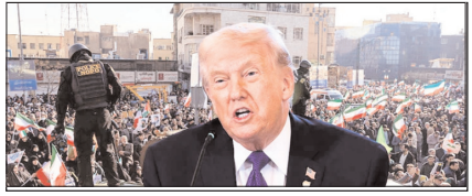
ईरान और अमेरिका के बीच फिर छिड़ सकता है युद्ध