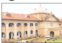
इलाहाबाद हाईकोर्ट ने खारिज की याचिका

ने आदेश दिया है। कोर्ट ने निजी परिसरों के भीतर सद्भावनापूर्ण प्रार्थना की रक्षा करते हुए माना था कि व्यक्तिगत धार्मिक प्रथा में मनमाने ढंग से हस्तक्षेप नहीं किया जा सकता, लेकिन इन फैसलों को यह मानकर नहीं पढ़ा जा सकता कि निजी परिसरों में संगठित या नियमित सामूहिक गतिविधि की पूरी छूट है। जहां गतिविधि उस क्षेत्र से आगे बढ़ती है और सार्वजनिक क्षेत्र को प्रभावित करना शुरू करती है, वहां वैध विनियमन लागू होता है। कोर्ट ने कहा कि पूर्व निर्णय निजी परिसरों को अनियंत्रित सामूहिक स्थान में बदलने का अधिकार नहीं देता है। कोर्ट का कहना था कि धर्म का पालन करने का अधिकार सार्वजनिक व्यवस्था के अधीन है और इसका प्रयोग इस तरह से नहीं किया जा सकता कि यह दूसरों के इन अधिकारों में हस्तक्षेप करे। यदि धर्म को निजी मान भी लिया जाए, तो भी याचिकाकर्ता मांगी गई राहत का हकदार नहीं है। कोर्ट ने सुनवाई के दौरान कहा कि रिकार्ड से पता चलता है वह किसी मौजूदा प्रथा की रक्षा नहीं कर रहा है, बल्कि गांव के भीतर और बाहर के व्यक्तियों को शामिल करते हुए नियमित सामूहिक सभाओं को शुरू करने की मांग कर रहा है।