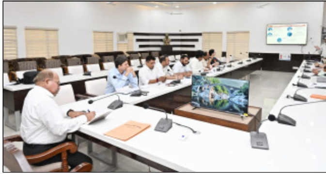
बैठक में मुख्य चिकित्सा अधिकारी ने उपस्थित अधिकारियों को निर्देश दिए हैं कि इस कार्यक्रम को सफल बनाने के लिए संबंधित अधिकारी आपसी समन्वय के साथ कार्य करते हुए, इसका व्यापक प्रचार प्रसार किया जाए ताकि अधिक से अधिक बच्चों को निर्धारित तिथि को ही दवाई खिलाई जाए, साथ ही सभी आंगनवाड़ी केंद्रों पर विशेष ध्यान देने के निर्देश दिए। उन्होंने कहा कि किसी भी प्रतिक्लृष्ट घटनाओं के प्रबंधन के लिए टोल फ्री नंबर 104 एसएमएस, व्हाट्सएप के माध्यम से शिक्षक/आशा/आंगनवाड़ी कार्यकर्ता/एनएम को उपलब्ध कराए। उन्होंने कहा कि वर्तमान में आंगनवाड़ी कार्यकर्ता हरद्वार में हैं तथा आंगनवाड़ी में अध्ययनरत बच्चे दवा से वंचित न रहे इसके लिए क्षेत्र की आशा के माध्यम से बच्चों को एल्बेडाजोल की दवा खिलाई जाए इसके लिए उन्होंने बाल विकास विभाग, शिक्षा विभाग एवं एमओआईसी आपसी समन्वय के साथ कार्य करते हुए रणनीति तैयार करने के निर्देश दिए। इस दौरान जिला शिक्षा अधिकारी (प्रा.शि.) अमित कुमार चन्द, मुख्य नगर स्वास्थ्य अधिकारी डॉ गंभीर तालियान, जिला कार्यक्रम अधिकारी महिला एवं बाल विकास धर्मवीर, चिकित्सा अधीक्षक भगवानपुर डॉ अनुज सिसोदिया, लक्कर डॉ रफीक, इमलीखंडा डॉ राव अकरम, बहादुराबाद डॉ आरती बहल, खानपुर डॉ कुंजन, प्रोग्राम ऑफिसर आरकेएसके/एनडीडी भजन पावर सहित आंगनवाड़ी सुपरवाइजर मौजूद रहे।

हरिद्वार। 7 मई को आयोजित होने वाले राष्ट्रीय कृमि मुक्ति दिवस के सफल क्रियान्वयन के लिए जिला अधिकारी मयूर दीक्षित के निर्देशन में मुख्य चिकित्सा अधिकारी आर के सिंह की अध्यक्षता में जिला समन्वय समिति की बैठक का आयोजन जिला सभागार में किया गया। बैठक में मुख्य चिकित्सा अधिकारी आर के सिंह ने अवगत कराया कि 7 मई को जनपद हरिद्वार के 1 से 19 आयु वर्ग के लगभग 712146 बच्चों, किशोर एवं किशोरियों को कृमि मुक्ति की दवा एल्बेडाजोल की गोली समस्त स्कूल तथा आंगनवाड़ी केंद्रों पर खिलाई जायेगी।