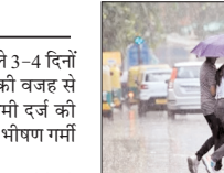
पहले हफ्ते से आंधी-तूफान संग बेमौसम वर्षा का अलर्ट

लखनऊ। उत्तर प्रदेश में पिछले 3-4 दिनों से हुई बारिश और आंधी तूफान की वजह से अधिकतम तापमान में प्रभावी कमी दर्ज की गई, जिससे अप्रैल माह में पड़ रही भीषण गर्मी से प्रदेशवासियों को राहत मिली है।