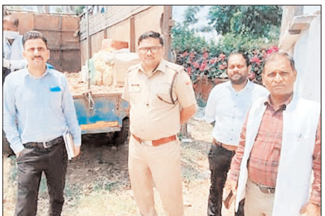
निरीक्षक कोतवाली लक्ष्मण के पत्राचार पर माननीय न्यायालय/उप जिलाधिकारी लक्ष्मण ने 24 अप्रैल 2026 को कमेटी गठित कर विनियमिता (बमेजतनबजपवद) के आदेश पर किए थे। 02 मई 2026 को कोतवाली परिसर में गठित कमेटी के समक्ष निम्नलिखित मालों का विधि-विधान से निस्तारण किया गया: अज्ञात शकों के विसरा 51 मामलों से संबंधित कुल 96 जमा आबकारी अधिनियम अवैध शराब व अन्य संबंधित 146 माल। कुल संख्या: 197 इकाई निस्तारण कमेटी के मुख्य सदस्यइस विनियमिता प्रक्रिया को निष्पक्ष और पारदर्शी बनाने के लिए गठित कमेटी में

शाह टाइम्स संवाददाता लक्ष्मण। वरिष्ठ पुलिस अधीक्षक हरिद्वार के निर्देशों के अनुपालन में, लक्ष्मण पुलिस ने थाना मालखाने में वर्षों से जमा अज्ञात शकों के विसरा और आबकारी अधिनियम के तहत जब्त किए गए सामानों के निस्तारण की प्रक्रिया को सफलतापूर्वक संपन्न किया। शनिवार को गठित कमेटी की मौजूदगी में कुल 197 मालों को नियमानुसार नष्ट किया गया। न्यायालय के आदेश पर हुई कार्रवाईमालखाने में लंबित मामलों के बोझ को कम करने और पुराने सामान के विधिक निस्तारण हेतु पुलिस अधीक्षक ग्रामीण व क्षेत्राधिकारी लक्ष्मण के पर्यवेक्षण में एक प्रस्ताव तैयार किया गया था। प्रभारी