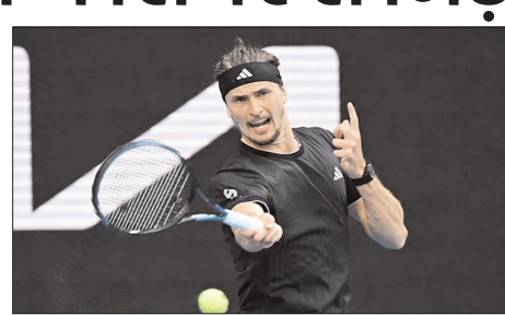
बहुत खुश हूँ। बहुत सारे कड़े मुकामले हुए, खासकर टूर्नामेंट की शुरुआत में। मैं जानिक के साथ फिर से खेलने का इंतजार कर रहा हूँ और एक कड़े मैच की उम्मीद कर रहा हूँ। रविवार को जो बेहतर खेलना, वही जीतगा। दूसरे वरीयता प्राप्त खिलाड़ी ने

मैड्रिड, वार्ता। अलेक्जेंडर ज्वेरेव दुनिया के नंबर 1 खिलाड़ी जानिक सिनर के साथ एक और बड़े मुकाबले के लिए तैयार हैं। जर्मन खिलाड़ी ने शुरुआत रात 21 साल के बेल्जियम के खिलाड़ी अलेक्जेंडर ब्लॉक्स के खिलाफ 6-2, 7-5 से शांत और संयमित जीत के साथ मैड्रिड ओपन के फाइनल में अपनी जगह पकड़ी कर ली, और इस टूर्नामेंट में अपने शानदार रिकॉर्ड को बनाए रखा। स्पेन की राजधानी में अपनी 30वीं जीत के साथ, ज्वेरेव रोजर फेडरर और राफेल नडाल के बाद तीसरे ऐसे खिलाड़ी बन गए हैं जो मैड्रिड में चार बार फाइनल में पहुंचे हैं। ज्वेरेव ने जीत के बाद कहा कि मै फाइनल में पहुंचकर