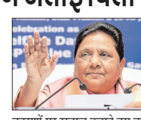
कारणों पर सवाल उठाते हुए कहा कि चाहे अंतरराष्ट्रीय परिस्थितियां जिम्मेदार हों या अन्य कारण, सरकार को आम जनजीवन के हित को ध्यान में रखते हुए नीतियां बनानी चाहिए। उन्होंने कहा कि कर्मशियल सिलेंडर की भारी किल्लत के बीच कीमतों में अचानक वृद्धि की खबरें सभी मीडिया माध्यमों में प्रमुखता से सामने आई हैं, जिससे लोगों में बेचैनी बढ़ी है। उनका मानना है कि इससे रसोई गैस के साथ-साथ पेट्रोल, डीजल और अन्य पेट्रोलियम पदार्थों की कीमतों में भी बढ़ोतरी हो सकती है। मायावती ने इस स्थिति के

देश में कर्मशियल गैस सिलेंडर की कीमतों में एकमुश्त 993 रुपये की बढ़ोतरी के बाद राजनीतिक प्रतिक्रियाएं तेज हो गई हैं। बहुजन समाज पार्टी प्रमुख मायावती ने इस बढ़ोतरी को लेकर चिंता व्यक्त करते हुए कहा है कि इसका सीधा असर आम जनजीवन पर पड़ेगा और महंगाई और बढ़ने की आशंका है।