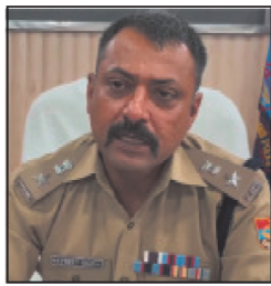
लिए सीआईड्यू टीम को जिम्मेदारी सौंपी गई। सीआईड्यू टीम ने त्वरित