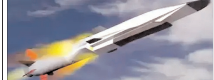
शाह टाइम्स ब्यूरो

'सुपरसोनिक ब्रह्मोस' से दोगुनी होगी रफ्तार