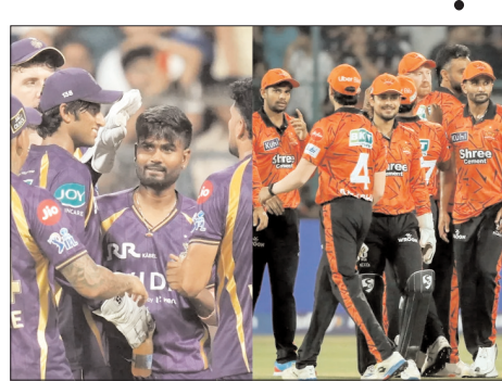
बैटिंग टीम बन गई है, जो टॉप ऑर्डर में लगातार आक्रामक खेल और मिडिल ऑर्डर में गहराई के दम पर अपने विरोधियों पर हावी हो रही है। उनकी ताजा मिसाल मुंबई इंडियंस के खिलाफ देखने

हैदराबाद, वार्ता। सनराइजर्स हैदराबाद की विस्फोटक बैटिंग का नया इम्फिहान तब होगा, जब वे रविवार को यहां राजीव गांधी इंटरनेशनल क्रिकेट स्टेडियम में आईपीएल 2026 के दिन के मैच में कोलकाता नाइट राइडर्स की मेजबानी करेंगे। इस मैच में सबकी नजर इस बात पर होगी कि क्या केकेआर टूर्नामेंट की सबसे खतरनाक बैटिंग यूनिट को रोक पाएगा।