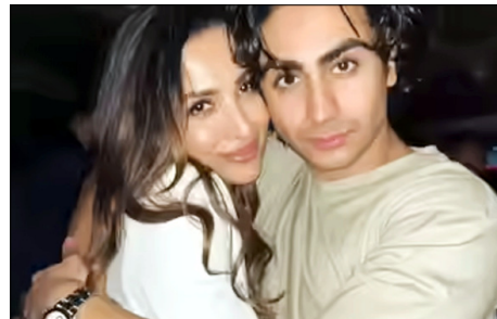
मलाइका ने माना कि बेटे की सोच उनसे अलग है। उन्होंने उसे समझाया कि जिंदगी के हर पफेज का अलग अनुभव होता है और परिवार बनाना भी उसका हिस्सा है। उन्होंने कहा कि रिश्ते बदलते रहते हैं और जिंदगी में कुछ भी स्थायी नहीं होता। इंटरव्यू में मलाइका ने सेल्फ-लव पर भी बात की। उन्होंने कहा कि वह हर दिन खुद से प्यार करने को कहती हैं।

उसने कहा कि एक्यूआई 500-1000 तक पहुंच रहा है, ऐसे माहौल में बच्चों को दुनिया में लाना सही नहीं लगता। मलाइका ने माना कि बेटे की सोच उनसे अलग है। उन्होंने उसे समझाया कि जिंदगी के हर फेज का अलग अनुभव होता है और परिवार बनाना भी उसका हिस्सा है। उन्होंने कहा कि रिश्ते बदलते रहते हैं और जिंदगी में कुछ भी स्थायी नहीं होता। इंसान को परिस्थितियों के हिसाब से खुद को ढालना पड़ता है। इंटरव्यू में मलाइका ने सेल्फ-लव पर भी बात की। उन्होंने कहा कि वह हर दिन खुद से प्यार करने को कहती हैं, क्योंकि अगर इंसान खुद को स्वीकार नहीं करेगा, तो जिंदगी खुलकर नहीं जी पाएगा। मलाइका अरोड़ा की शादी 1998 में अरबाज खान से हुई थी। दोनों का 2017 में तलाक हो गया था।