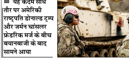
यह कदम सीधे तौर पर अमेरिकी राष्ट्रपति डोनाल्ड ट्रम्प और जर्मन चांसलर फ्रेडरिक मर्ज के बीच बयानबाजी के बाद सामने आया

वाशिंगटन। अमेरिका ने जर्मनी से करीब 5000 सैनिक हटाने का फैसला किया है। अमेरिकी रक्षा मंत्रालय के मुताबिक यह प्रक्रिया अगले 6 से 12 महीनों में पूरी होगी। यह कदम सीधे तौर पर अमेरिकी राष्ट्रपति डोनाल्ड ट्रम्प और जर्मन चांसलर फ्रेडरिक मर्ज के बीच बयानबाजी के बाद सामने आया है। मर्ज ने पिछले महीने एक कार्यक्रम में कहा था कि अमेरिका के पास कोई अच्छी प्लानिंग नहीं है। उसे पता ही नहीं है कि वह इस जंग से बाहर कैसे निकलेगा। उन्होंने कहा कि ईरान बातचीत को टालने में माहिर है और अमेरिका को बिना नतीजे के इस्लामाबाद तक आना-जाना पड़ा। इससे अमेरिका को ईरान के सामने अपमानित होना पड़ा। इससे ट्रम्प नाराज हो गए थे। उन्होंने भी जो लेंकर कहा कि वे बहुत खराब काम कर रहे हैं। उनको लगता है कि ईरान के पास परमाणु हथियार होना अच्छी बात है। उन्हें हकीकत की समझ नहीं है। मुताबिक दिसम्बर तक