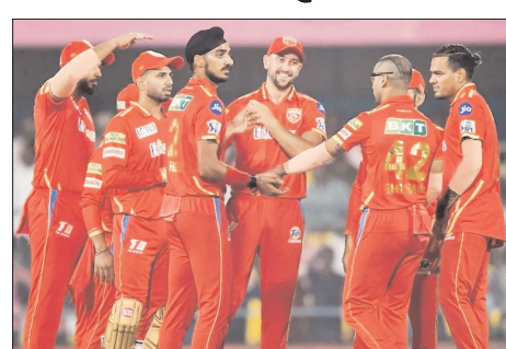
दिल्ली कैपिटल्स के खिलाफ पंजाब का 265 रनों का रिकॉर्ड-तोड़ चेज है। एक ऐसे फॉर्मेट में जहां कभी 200 रनों के स्कोर को छूना भी नामुमकिन माना जाता था, पंजाब किंग्स ने

अहमदाबाद, वार्ता। पंजाब किंग्स आईपीएल 2026 में एक ऐसे मुकाम पर पहुंच गई है, जहां अब बड़े से बड़े टारगेट भी उन्हें रोकने के लिए काफी नहीं लगते। रविवार रात नरेंद्र मोदी स्टेडियम में गुजरात टाइटन्स का सामना करने की तैयारी करते हुए, पंजाब किंग्स टूर्नामेंट की सबसे निडर चेज करने वाली टीम के तौर पर अपनी साख बनाए हुए है, एक ऐसी टीम जो 220 से ज्यादा के स्कोर को भी आसानी से चेज करने लायक बना सकती है। यह साख सिर्फ हवा-हवाई बातों से नहीं बनी है। इसे लगातार बेहतरीन बैटिंग परफॉर्मेंस से बनाया गया है, जिसकी सबसे बड़ी मिसाल इस सीजन की शुरुआत में