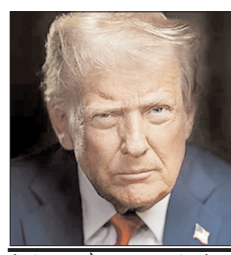
मैं ही कार और ट्रक बनाएंगी, तो उन पर कोई टैक्स नहीं लगाया जाएगा। ट्रंप के मुताबिक, इस समय अमेरिका में कई नई

ट्रंप का कहना है कि यूरोपीय संघ पहले से तय व्यापार समझौते का पालन नहीं कर रहा है, इसलिए यह फैसला लिया गया है। हालांकि अगर यूरोपीय कंपनियां अमेरिका