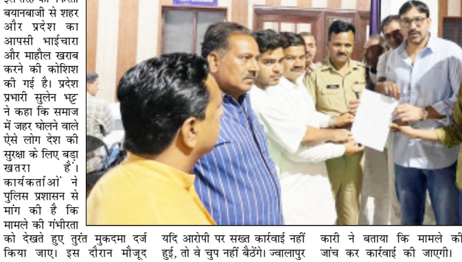
यदि आरोपी पर सख्त कार्रवाई नहीं हुई, तो वे चुप नहीं बैठेंगे। ज्वालपुर कारी ने बताया कि मामले को जांच कर कार्रवाई की जाएगी।