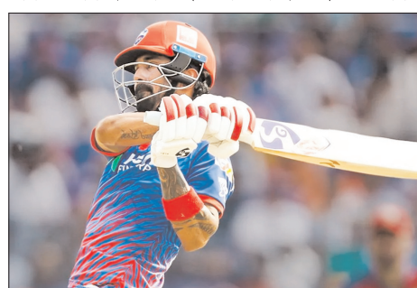
और अब चौथे स्थान पर हैं। उनके और राहुल के बीच सनराइजर्स हैदराबाद के दो बल्लेबाज अभिषेक शर्मा (425 रन) और हाइनरिक क्लासन (414 रन) मौजूद हैं। इस मामले में यशस्वी जायसवाल 312 रनों के साथ

जयपुर, वार्ता। दिल्ली कैपिटल्स के धाकड़ बल्लेबाज केएल राहुल ने राजस्थान रॉयल्स (आरआर) के खिलाफ 75 रनों की पारी खेल कर अर्रेंज कैप पर कब्जा कर लिया है। दिल्ली कैपिटल्स के सलामी बल्लेबाज केएल राहुल ने इस सीजन में तीन बार सिगल डिजिट किए हैं और एक बार 18 रन बनाए। लेकिन अपनी शो पांच पारियों में 92, 57, 37, नाबाद 152 और शुरुआत को आरआर के खिलाफ 75 रन बनाए। इसी के साथ इस सीजन में उनके कुल रन 433 हो गए हैं और वह रन बनाने वालों की सूची में शीर्ष पर पहुंच गए हैं।