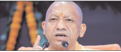
यूपी ने बनाया 9 साल में 9 लाख से अधिक नौकरी देने का रिकॉर्ड: योगी

नई दिल्ली, मुजफ्फरनगर, देहरादून, हल्द्वानी, मुगदाबाद, बरेली, मेरठ व लखनऊ से प्रकाशित