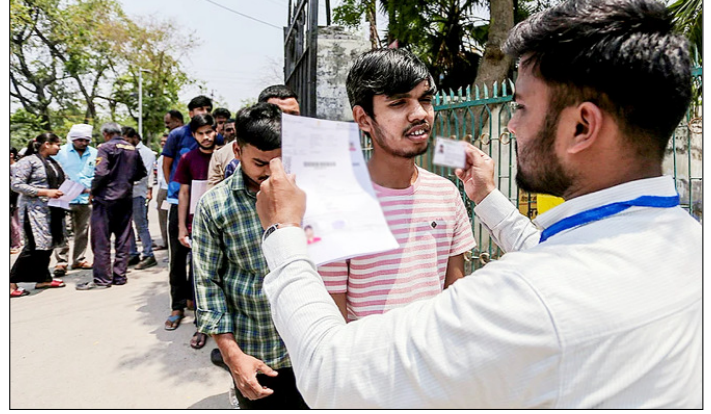
प्रयागराज। राष्ट्रीय पात्रता-सह प्रवेश परीक्षा (NEET & UG) में शामिल होने से पहले उम्मीदवारों की जांच करते हुए।

बना रहा है। सोशल मीडिया पर जारी वीडियो में बीएलए अपने हमलों को 'आजादी की लड़ाई' के रूप में पेश करता है, जिससे उसे स्थानीय युवाओं का समर्थन मिल रहा है। बलूचिस्तान में अलगाववाद की शुरुआत 1948 में पाकिस्तान के गठन के बाद हुई थी। स्थानीय लोगों का आरोप है कि उनके क्षेत्र के प्राकृतिक संसाधनों का फायदा बाहरी कंपनियों और केंद्र सरकार उठाती है, जबकि उन्हें रोजगार, शिक्षा और स्वास्थ्य जैसी बुनियादी सुविधाएं नहीं मिलतीं। इसी असंतोष के कारण शिक्षित युवाओं का एक वर्ग भी उग्रवाद की ओर झुक रहा है। बलूचिस्तान की सीमा ईरान और अफगानिस्तान से लगती है। ऐसे में इन देशों में अस्थिरता का सीधा असर इस क्षेत्र पर पड़ता है। पाकिस्तानी अधिकारियों को आशंका है कि अगर ईरान के पूर्वी हिस्से में हालात बिगड़ते हैं, तो बीएलए जैसे संगठन और मजबूत हो सकते हैं और सीमा पार से हमले बढ़ सकते हैं।