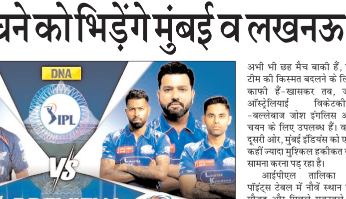
आईपीएल 2026 की तालिका में सबसे निचले स्थान पर चल रही मुंबई इंडियंस और लखनऊ सुपरजायंट्स उम्मीदों के साथ वानखेड़े स्टेडियम में आमने-सामने होगी