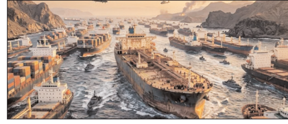
अमेरिका की नाक के नीचे से निकला ईरानी सुपर टैंकर