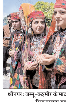
श्रीनगर: जम्मू-कश्मीर के मादक पदार्थों के हानिकारक प्रभावों के बारे में जागरूकता बढ़ाने के लिए चलाए गए 'नशा मुक्त अभियान' के दौरान लोक कलाकार।

सभी तैयारियां पूरी कर ली गई हैं। सभी मतगणना केंद्रों पर सुरक्षा के पुख्ता इंतजाम किए गए हैं। मतदाता सूचियों के विशेष गहन पुरीक्षण (एसआईआर) को लेकर राष्ट्रव्यापी बहस के बीच पश्चिम बंगाल, तमिलनाडु, केरल, असम और केंद्र शासित प्रदेश पुदुचेरी की विधानसभा के चुनावों में मतदाताओं से मतदान में बहचदकर भागीदारी को। पश्चिम बंगाल और तमिलनाडु में आजादी के बाद मतदान-प्रतिशत के नये रिकॉर्ड बने। पश्चिम बंगाल में दो चरणों में हुए चुनाव में मतदान का कुल प्रतिशत-शेखर पृष्ठ दो पर