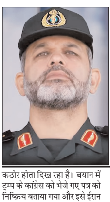
कठोर होता दिख रहा है। बयान में ट्रंप के कार्रवाई को भेज पाए पत्र को निष्क्रिय बताया गया और इसे ईरान की वार्ता शर्तों की स्वीकारोक्ति के संकेत के रूप में प्रस्तुत किया गया।

तेहरान। ईरान की इस्लामिक रिवालयनरी गार्ड कोर (आईआरजीसी) ने कहा है कि मोजुदा पश्चिम एशियाई तनाव में अमेरिका की रणनीतिक स्थिति तेजी से सीमित होती जा रही है और अमेरिकी राष्ट्रपति डोनाल्ड ट्रंप को सामने विकल्प अब बेहद कम रह गए हैं।