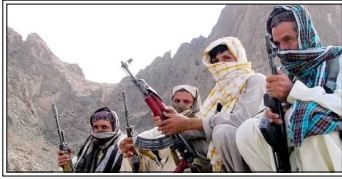
हमलावरों ने बैंक, पुलिस स्टेशन, जेल और सरकारी इमारतों को निशाना बनाया। कई जगहों पर आगजनी की गई और मुख्य सड़कों को जाम कर दिया गया।

क़वेटा। पाकिस्तान के बलूचिस्तान में बढ़ती हिंसा ने अमेरिका-पाकिस्तान के रैको डिक माइनिंग प्रोजेक्ट को संकट में डाल दिया है। मीडिया रिपोर्टों के मुताबिक इसकी वैल्यू करीब 7.7 अरब डॉलर (64000 करोड़) है। बलूच लिबरेशन आर्मी (बीएलए) के 500 से ज्यादा लड़ाकों ने 31 जनवरी को बलूचिस्तान के कई इलाकों में हमला कर 58 लोगों की हत्या कर दी थी, जिससे रैको डिक माइनिंग प्रोजेक्ट की सुरक्षा पर सबाल खड़े हो गए। हमलावरों ने बैंक, पुलिस स्टेशन, जेल और सरकारी इमारतों को निशाना बनाया। कई जगहों पर आगजनी की गई और मुख्य सड़कों को जाम कर दिया गया, जिससे क़वेटा और कराची के बीच कर्नेक्टिविटी प्रभावित हुई। कुछ हमलावरों ने आत्मघाती ब्रिस्फोट भी किए। रिपोर्टों के मुताबिक, हमलावरों ने आर्टोमेटिक राइफल और ग्रेनेड लॉन्चर जैसे आधुनिक हथियारों का इस्तेमाल किया। इनमें से कुछ हथियार अफगानिस्तान में 2021 के