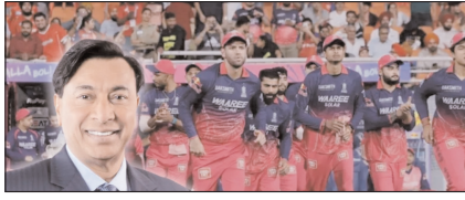
लक्ष्मी मित्तल ने राजस्थान रॉयल्स फ्रेंचाइजी को 15,660 करोड़ में खरीदा