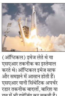
(ऑप्टिकल) इमेज लेते थे या एसएआर तकनीक का इस्तेमाल करते थे। ऑप्टिकल इमेज साफ और समझने में आसान होती हैं। एसएआर या नौ सिंथेटिक अपचर रडार तकनीक बादलों, बारिश या रात में भी इमेजिंग कर सकती है।