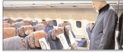
महाशक्ति के पतन का कारण मासूमों की शहादत