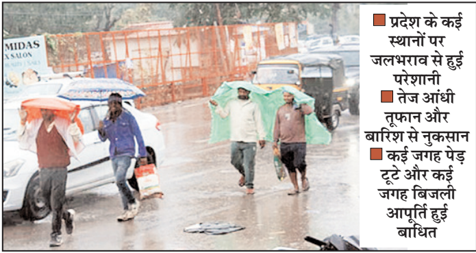
■ प्रदेश के कई स्थानों पर जलभराव से हुई परेशानी ■ तेज आंधी तूफान और बारिश से नुकसान ■ कई जगह पेड़ टूटे और कई जगह बिजली आपूर्ति हुई बाधित

शाह टाइम्स टीम देहरादून। उत्तराखण्ड में रविवार को सुबह एक ओर एक आंधी तूफान और तेज बारिश से मौसम का मिजाज बदल गया। प्रदेश के कई जिलों में झमाझम बारिश देखने को मिली। प्रदेश के अधिकांश हिस्सों में बारिश और बर्फबारी हुई है। बारिश और बर्फबारी से तापमान में गिरावट आ गई। वहीं तेज अंधड़ से पेड़ तक उखड़ गए जिससे जनजीवन अस्त व्यक्त हो गया और लोगों को परेशानियों का सामना करना पड़ा। कई क्षेत्रों में बिजली आपूर्ति भी प्रभावित हो गई।