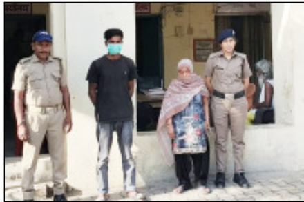
अधीक्षक के निर्देश पर कनखल पुलिस ने तुरंत टीम का गठन किया। पुलिस ने इलाकों के सैकड़ों सीसीटीवी कैमरों को फुटेज खंगाली और अपने मुखबिर तंत्र को सक्रिय किया। इलेक्ट्रॉनिक सर्विलांस और तकनीकी जांच की मदद से पुलिस को अहम सुराग मिले, जिसके