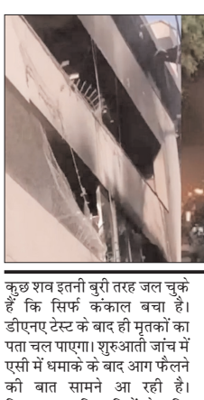
कुछ शव इतनी बुरी तरह जल चुके हैं कि सिर्फ कंकाल बचा है। डॉनएट्टेस्ट के बाद ही मृतकों का पता चल पाएगा। शुरुआती जांच में एसी में धमाके के बाद आग फैलने की बात सामने आ रही है। फिलहाल अधिकारियों ने पुष्टि