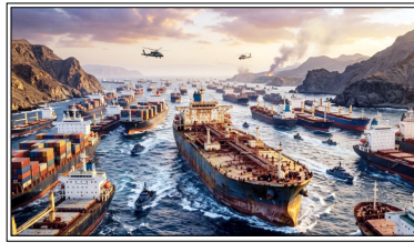
ईरानी जहाज अब एशिया-प्राशांत क्षेत्र में पहुंचा, घटना से अमेरिका की पहरेदारी पर सबाल खड़े हुए।

तेहरान। अमेरिका और ईरान के बीच लुकाछिपी खेल में एक ताजा रिपोर्ट ने विश्वभर में खलबली मचा कर रख दी है। मानिटरिंग फर्म टेकरटैकसंडाटकाम ने दावा किया है कि ईरान का एक बहुत बड़ा तेल का जहाज अमेरिकी नौसेना की सख्त नाकेबंदी को चकमा देकर बाहर निकल गया है। यह जहाज अब एशिया-प्राशांत क्षेत्र में पहुंच गया है।