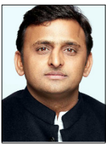
अखिलेश यादव, राष्ट्रीय अध्यक्ष, सपा

जनता इस बात को बखुबी जानती थी कि चुनाव खत्म होते ही महंगाई का ग्राफ ऊपर जाएगा, और आज वही हो रहा है, भाजपा अपने करीबियों को ज्यादा मुनाफा कमाने से नहीं रोक रही है, जिसके कारण आम जनता महंगाई की मार झेल रही है, हमें तब तक नहीं रुकना चाहिए जब तक हम अपना लक्ष्य हासिल न कर लें, समाजवादी सरकार में बांटे गए लैपटॉप आज भी सूचारू रूप से चल रहे हैं, जिन्हें डिजिटल डिवाइड खत्म करने के उद्देश्य से दिया गया था, यदि स्मार्ट मीटर में बेईमानी संभव है, तो ईवीएम में गड़बड़ी क्यों नहीं हो सकती, भाजपा भय का माहौल बनाकर चुनाव लड़ती है, पश्चिम बंगाल में जनता का चुनाव है और ममता बनर्जी ही वहां बनी रहेंगी, अकेले गोरखपुर में ही हजारों शिक्षकों के पद काम हो गए हैं, जिससे पूरे प्रदेश की चिंताजनक स्थिति का अंदाजा लगाया जा सकता है।