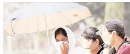
पश्चिम यूपी में 50 से 60 किलोमीटर प्रति घंटा की रफ्तार से चलेंगी तेज हवाएं

शाह टाइम्स ब्यूरो लखनऊ। उत्तर प्रदेश में एक बार फिर मौसम का मिजाज बदलने से पश्चिमी इलाकों में गर्मी से फौरी राहत मिली है जबकि पूर्वी क्षेत्र में अगले 24 घंटों के दौरान कई जिलों में गरज-चमक, तेज आंधी, वज्रपात और ओलावृष्टि के आसार हैं। अमरौहा, मुरादाबाद, संभल और अलीगढ़ समेत पश्चिमी उत्तर प्रदेश विशेष रूप से तराई और पश्चिमी जिलों में तेज हवाओं के साथ बारिश हुई जिससे लोगों को गर्मी से फौरी राहत मिली। मौसम विज्ञान विभाग के लखनऊ केंद्र द्वारा जारी प्रभाव आधारित पूर्वानुमान एवं चेतावनी के अनुसार 12 मई को पश्चिमी और पूर्वी उत्तर प्रदेश के कई