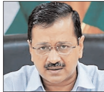
पेट्रोल डीजल वाले बयान पर बोली 'आप'

नई दिल्ली, वार्ता आम आदमी पार्टी के राष्ट्रीय संयोजक अरविंद केजरीवाल ने कहा है कि प्रधानमंत्री नरेंद्र मोदी को इस बारे में स्थिति स्पष्ट करनी चाहिए कि इस समय देश की अर्थव्यवस्था कैसी है और एक साल बाद अर्थव्यवस्था कैसी रहने वाली है। श्री केजरीवाल ने आज यहां संवाददाता सम्मेलन में कहा कि पश्चिम एशिया संकट का प्रभाव दुनिया भर में है लेकिन प्रधानमंत्री ने जिस प्रकार देशवासियों से सात आह्वान किया है उस प्रकार के कदम किसी देश में नहीं उठाए। प्रधानमंत्री ने सिर्फ मध्यम वर्ग से ही कुर्बानी देनी की अपील की है जो बहुत दुखद है। अगर सबसे अधिक कुर्बानी देनी थी, तो सरकार को अपने खर्चों में कटौती