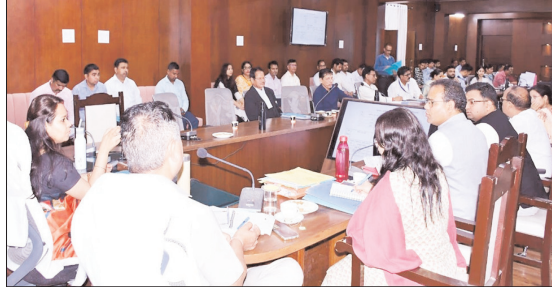
उप जिलाधिकारियों को राशन कार्ड सत्यापन का रेंडम वेरिफिकेशन करने तथा राशन गोदामों और सस्ता गल्ला निर्देश दिए गए।