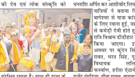
बागनाथ मंदिर में डोला पहुंचने पर श्रद्धालुओं ने माता के डोले में पुष्प, चावल और धनराशि अर्पित कर आशीर्वाद लिया।