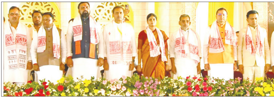
प्रधानमंत्री नरेन्द्र मोदी की मौजूदगी में मुख्यमंत्री पुष्कर सिंह धामी मंगलवार को असम के नवनियुक्त सीएम हिमंता विश्वा सरमा के शपथग्रहण समारोह में शामिल हुए। शपथग्रहण के दौरान भाजपा और एनडीए शासित राज्यों के कई मुख्यमंत्री भी मौजूद रहे।