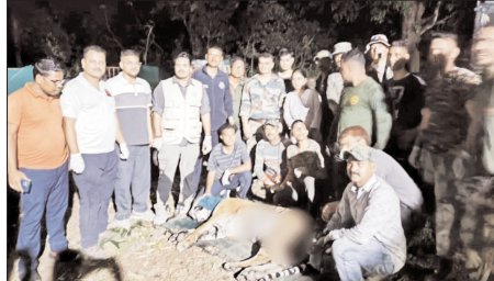
मोहान वन क्षेत्र में मानव-वन्यजीव संघर्ष की घटना के बाद वन विभाग द्वारा चलाया गया लगातार रेस्क्यू एवं निगरानी अभियान आखिरकार सफल रहा।

शाह टाइम्स संवाददाता अल्मोड़ा। मोहान वन क्षेत्र में मानव-वन्यजीव संघर्ष की घटना के बाद वन विभाग द्वारा चलाया गया लगातार रेस्क्यू एवं निगरानी अभियान आखिरकार सफल रहा। वन विभाग की टीम ने सोमवार को ग्राम सभा तड़म क्षेत्र में सक्रिय बाघ का सफल रेस्क्यू कर उसे सुरक्षित रूप से कावेट टाइगर रिजर्व भेज दिया। उप प्रभागीय वनाधिकारी काकुल पुंडरी ने बताया कि मोहान वन प्रभाग की कैमोहरिया बीट अंतर्गत ग्राम सभा तड़म में 31 मार्च 2026 को मानव-वन्यजीव संघर्ष की घटना सामने आने के बाद विभाग लगातार सतर्कता बरत रहा था। क्षेत्र में ड्रोन, ट्रैप कैमरे और विशेष गरीबी दलों की मदद से लगातार निगरानी की जा रही थी। ग्रामीणों की सुरक्षा के लिए पिंजरे, फॉक्स लाइट, सायरन तथा अनियमन उपकरण भी तैनात किए गए थे। वन विभाग की टीम ने रात्रिकालीन गश्त, ट्रैकिंग और संच ऑपरेशन लगातार जारी रखा। अनियमित चिट्ठे टाइगर रिजर्व और नैनीताल चिट्ठीयाघर की विशेषज्ञ रेस्क्यू टीमों का भी सहयोग लिया गया। उन्होंने बताया कि 3 मई को ग्राम सभा तड़म के समीप बाघ को ट्रैकुलाइज करने का प्रयास किया गया था, लेकिन घने जंगल और विषम परिस्थितियों के कारण उस समय सफलता नहीं मिल सकी। इसके बाद अतिरिक्त आवाजही से बचने की सलाह दी गई है।