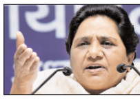
मध्य पूर्व एशिया में व्याप्त तनाव बोली बसपा प्रमुख

शाह टाइम्स ब्यूरो लखनऊ। बहुजन समाज पार्टी की मुखिया मायावती ने मध्य पूर्व एशिया में व्याप्त तनाव पर चिंता व्यक्त करते हुए केंद्र और राज्यों से जन हित में उचित कदम उठाने की अपील की है। सुश्री मायावती ने प्रधानमंत्री नरेंद्र मोदी द्वारा देशवासियों से 'संयम' बरतने की अपील का हवाला देते हुए कहा कि इससे साफ है कि भारत के सामने संकट केवल पेट्रोल, डीजल और रसोई गैस जैसे पेट्रोलियम पदार्थों तक सीमित नहीं रहेगा, बल्कि यह एक बड़े आर्थिक संकट का रूप ले सकता है। उन्होंने आशंका जताई कि इस संकट से करोड़ों भारतीयों का जीवन प्रभावित होगा और स्थिति के और बिगड़ने की भी संभावना है। बसपा प्रमुख ने अपने बयान में कहा कि कोरोना काल की मार के बाद देश की लगभग