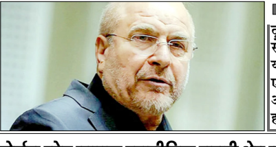
कोई भी अन्य दृष्टिकोण पूरी तरह से बेनतीजा रहेगा, यह एक के बाद एक असफलता के अलावा कुछ नहीं होगा।

तेहरान/दोहा। ईरानी संसद के अध्यक्ष मोहम्मद बाघर गालिबफ ने कहा कि पश्चिमी एशिया संघर्ष को सुलझाने के लिए ईरान के 14-सूत्रीय योजना का कोई विकल्प नहीं है। गालिबफ ने सोशल मीडिया एक्स पर कहा कि ईरानी लोगों के अधिकारों को स्वीकार करने के अलावा कोई विकल्प नहीं है, जैसा कि 14-सूत्रीय प्रस्ताव में बताया गया है।