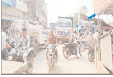
वार शिकायत की जा चुकी है, लेकिन अब तक कोई ठोस कार्रवाई नहीं हुई। लोगों ने मांग की है कि सोहेलपुर मार्ग से अतिक्रमण हटाकर सड़क को खाली कराया जाए ताकि जायरीनों, राहगीरों और स्कूली बच्चों को जाम की समस्या से राहत मिल सके।

डंपरों की आवाजाही के चलते स्थिति और गंभीर हो रही है। मंगलवार को भी सड़क पर जाम लग गया। जाम के कारण स्कूली बच्चों और स्थानीय लोगों को परेशानी उठानी पड़ी। जबकि दरगाह साबिर पाक को जियारत के लिए आने वाले जायरीनों को भी खासी दिक्कतों का सामना करना पड़ा। स्थानीय लोगों का कहना है कि सोहेलपुर मार्ग पर आए दिन जाम लगना आम बात हो गई है, लेकिन पुलिस प्रशासन और नगर पंचायत इस ओर ध्यान नहीं दे रहे हैं।