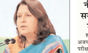
नीट परीक्षा रद्द होने पर सुप्रिया श्रीनेत ने बोला हमला

नई दिल्ली, वार्ता कांग्रेस ने नीट यूजी 2026 परीक्षा रह होने पर केंद्र सरकार की आलोचना की और केंद्रीय शिक्षा मंत्री धर्मेश प्रधान से इस्तीफा देने की मांग की है। कांग्रेस की सोशल मीडिया, डिजिटल प्लेटफॉर्म चेयरपर्सन सुप्रिया श्रीनेत ने पेपर लीक मामले को लेकर केंद्र की भारतीय जनता पार्टी सरकार और केंद्रीय शिक्षा मंत्री पर गंभीर आरोप लगाए हैं। उन्होंने कहा कि इस बार करीब 22 लाख छात्रों ने नीट परीक्षा दी थी। छात्रों ने दिन-रात मेहनत कर तैयारी की, अभिभावकों ने कोचिंग और परीक्षा से जुड़े खर्च उठाए, लेकिन अंत में उन्हें पेपर लीक और परीक्षा रह होने का सामना करना पड़ा। उन्होंने कहा कि शायद फजी डिग्री वालों से शिक्षा के संबंध में गंभीरता की आशा ही बेमानी है। केंद्रीय शिक्षा मंत्री धर्मेश प्रधान को अपने पद पर बने रहने का कोई हक नहीं है। कांग्रेस नेता ने आरोप लगाया कि सरकार शिक्षा व्यवस्था को संभालने में पूरी तरह विफल रही है। मंत्री और सरकार देश के छात्रों के भविष्य को लेकर गंभीर नहीं हैं और एक इतिहास भी