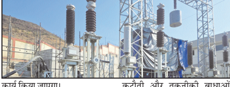
कार्य किया जाएगा।

आज होगा ऐतिहासिक लाइन संयोजन कार्य, सात घंटे बंद रहेगी बिजली