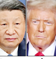
ट्रंप का 2021 के बाद यह पूर्वी एशियाई देश का पहला दौरा है

वाशिंगटन/बीजिंग। अमेरिकी राष्ट्रपति डोनाल्ड ट्रंप चीनी राष्ट्रपति शी जिनिपिंग से मुलाकात के लिए बीजिंग रवाना हो गए हैं, जहां दोनों वैश्विक नेता व्यापार, युद्ध कूटनीति और ताइवान पर गंभीर चर्चा करेंगे। ट्रंप का 2017 के बाद यह पूर्वी एशियाई देश का पहला दौरा है। इस दौरान एशकों में सबसे अहम अमेरिका-चीन सम्मेलन होने की संभावना है।