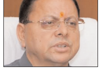
लघु जल विद्युत परियोजना की नीति में संशोधन पर मुहर मुख्यमंत्री पुष्कर धामी की अध्यक्षता में हुई मंत्रिमंडल की बैठक

देहरादून। मुख्यमंत्री पुष्कर सिंह धामी की अध्यक्षता में बुधवार को हुई कैबिनेट की बैठक में 19 प्रस्तावों को मंजूरी दी गई। कैबिनेट ने प्रदेश में चकबंदी को लेकर महत्वपूर्ण निर्णय लिया है। इसके अलावा कैबिनेट ने कई अन्य विभागों से संबंधित फैसले भी लिए हैं। कैबिनेट ने चकबंदी को लेकर जो फैसला लिया है उसके मुताबिक पर्वतीय क्षेत्रों में स्वैच्छिक चकबंदी होगी। हर जिले में 10 गांव का लक्ष्य रखा गया है। 75 प्रतिशत ग्रामीणों की सहमति जरूरी होगी। डिजिटल माध्यम से चकबंदी होगी। आपत्ति का निस्तारण भी होगा। राजस्व परिषद समीक्षा अधिकारी सेवा नियमावली में संशोधन को मंजूरी। कम्प्यूटर का ज्ञान के बजाय 8000 को टाइपिंग स्पीड, माइक्रोसॉफ्ट ऑफिस, विंडोज का भी ज्ञान जरूरी। संगंध पौध केंद्र का नाम परम्पूरी अनुसंधान संस्थान होगा। सुप्रीम कोर्ट के