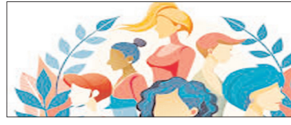
स्त्री को खुद लिखनी होगी अपनी परिभाषा