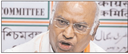
बुजुर्गों, विधवाओं व दिव्यांगों के साथ अन्याय कर रही है मोदी सरकार: खड़गे

नई दिल्ली, मुजफ्फरनगर, देहरादून, हल्द्वानी, मुरादाबाद, बरेली, मेरठ व लखनऊ से प्रकाशित