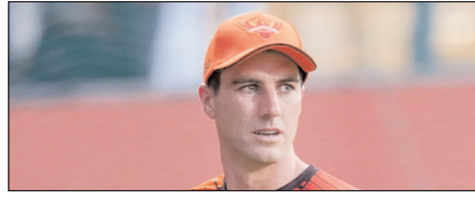
पैट कमिंस पर धीमे ओवर रेट के लिए 12 लाख रुपये का जुर्माना