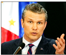
ईरान की सैन्य ताकत को बढ़ा नुकसान पहुंचाया गया है, हेगसेथ

सवाल उठाए। सीनेटर क्रिस कुन्स ने कहा कि यह युद्ध बिना किसी स्पष्ट लक्ष्य और अंत की योजना के लड़ा जा रहा है, जिसकी कीमत अमेरिकी जनता चुका रही है। वहीं सीनेटर पैटी मरे ने बढ़ती ईंधन और खाद्य कीमतों के बीच भारी रक्षा खर्च पर सवाल उठाए। पेंटागन के मुताबिक ईरान संघर्ष पर अब तक करीब 29 अरब डॉलर खर्च हो चुके हैं, हालांकि अमेरिकी सैन्य ठिकानों को हूए नुकसान का पूरा आकलन अभी बाकी है। सुनवाई के दौरान सबसे बड़ा