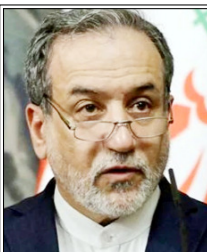
अराघची ने यह बात तेहरान में नार्वे के उप-विदेश मंत्री के साथ बैठक के दौरान कही

तेहरान। ईरान के विदेश मंत्री अब्बास अराघची ने अमेरिका की आलोचना की। उन्होंने कहा कि वाशिंगटन के कदमों से भरोसे में कमी शांति कायम होने में सबसे बड़ी बाधा है। अराघची ने यह बात तेहरान में नार्वे के उप-विदेश मंत्री के साथ बैठक के दौरान कही। ईरानी सरकारी प्रसारक प्रेस टीवी ने यह जानकारी दी। प्रेस टीवी के मुताबिक, अराघची ने अमेरिकी पक्ष के कथित अहंकारी रुख और धमकी भरी तथा भ्रष्टाचार भाषा की आलोचना की। उन्होंने कहा कि अमेरिका की नीयत में कमी और बेईमानी ही युद्ध को पूरी तरह खत्म करने में सबसे बड़ी बाधा है। उन्होंने कहा कि ईरान पर अमेरिका और इजरायल के सैन्य हमले ही मौजूदा स्थिति और होमजुज जलडमरूमध्य में तनाव को मुख्य वजह हैं। उन्होंने यह भी कहा कि