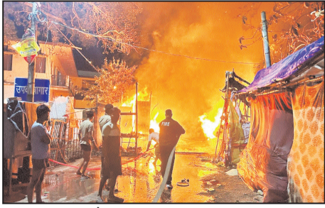
शाह टाइम्स संवाददाता

पांच गरीब व्यापारियों की दुकानों को निगल गई आग, लाखों का नुकसान