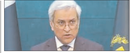
भारत में दोनों देशों के बीच संवाद की मांग उठाने का स्वागत: अंबाबी पेज 12