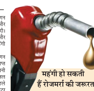
महंगी हो सकती हैं रोजमर्रा की जरूरत की चीजें

नई दिल्ली। तेल विपणन कंपनियों ने शुक्रवार को पेट्रोल और डीजल की कीमतों में बढ़ाव कर दी। साथ ही राष्ट्रीय राजधानी दिल्ली और आसपास के शहरों में सीएनजी भी महंगा हो गई है। देश की सबसे बड़ी तेल विपणन कंपनी इंडियन ऑयल कॉर्पोरेशन से प्राप्त जानकारी के अनुसार, राष्ट्रीय राजधानी दिल्ली में शुक्रवार से गैर-ब्रांडेड डीजल 90.67 रुपये प्रति लीटर हो गया है। पहले इसकी कीमत 87.67 रुपये प्रति लीटर थी। इसी प्रकार एक लीटर पेट्रोल की कीमत तीन रुपये बढ़ाकर 97.77 रुपये कर दी गई है। डेढ़ साल में पहली बार पेट्रोल-डीजल के दाम बढ़ाए गए हैं। पिछली बार 30 अक्टूबर 2024 को दोनों जीवाश्म ईंधनों के दाम बढ़ाए गए थे। राष्ट्रीय राजधानी और आसपास के शहरों