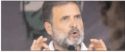
अडानी के हित में मोदी ने किया अमेरिका के साथ व्यापार समझौता : राहुल गांधी पेज 2

नई दिल्ली, मुजफ्फरनगर, देहरादून, हल्द्वानी, मुताबाद, बरेली, मेरठ व लखनऊ से प्रकाशित