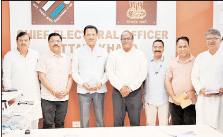
मुख्य निर्वाचन अधिकारी ने एसआईआर को लेकर की राजनैतिक दलों के साथ बैठक

मुख्य संवाददाता शाह टाइम्स देहरादून। भारत निर्वाचन आयोग कि निर्देशों के कम में आगामी 29 मई से उत्तराखण्ड में विशेष गहन पुनरीक्षण की प्रक्रिया प्रारम्भ होगी।