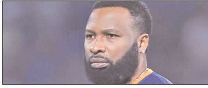
पोलार्ड पर मैच फीस का 15 फीसदी जुर्माना खेल टाइम्स