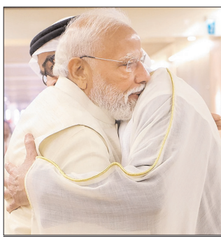
और मजबूत करने पर चर्चा की। उन्होंने ऊर्जा, व्यापार और निवेश, समुद्री अर्थव्यवस्था, तकनीकी क्षेत्र

संयुक्त अरब अमीरात (यूएई) ने भारत में पांच अरब डॉलर के निवेश की घोषणा की है इसके अलावा दोनों देशों ने ऊर्जा, रक्षा, जहाजरानी और सुपर कंप्यूटर सहित छह क्षेत्रों में सहयोग के समझौते किए हैं।