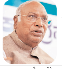
आर्थिक संकट की बड़ी वजह मोदी सरकार में नेतृत्व संकट, दूरदर्शिता का अभाव: मल्लिकार्जुन खड़गे

नई दिल्ली। कांग्रेस अध्यक्ष मल्लिकार्जुन खड़गे ने देश में उत्पन्न ईंधन समस्या को मोदी सरकार निर्मित संकट करार दिया और कहा कि इसके लिए सरकार में बैठे लोगों में दूरदर्शिता का अभाव तथा उनकी अक्षमता जिम्मेदार है। खड़गे ने शुरुवार को यहां कहा कि देश की जनता को यह समझना होगा कि वैश्विक ईंधन संकट के साथ-साथ भारत में आर्थिक संकट की बड़ी वजह मोदी सरकार में नेतृत्व संकट, दूरदर्शिता का अभाव और अयोग्यता है। उन्होंने आरोप लगाया कि इस संकट का खामियाजा जनता को पेट्रोल, डीजल और रसोई गैस के बढ़े दामों के रूप में अपनी जेब से भुगताना पड़ रहा है। उन्होंने कहा कि डीजल की कीमतों में वृद्धि का महंगाई पर व्यापक प्रभाव होता है और इससे पूरे देश में महंगाई की शृंखलाबद्ध मार पड़ती है, जिसका असर उद्योगों, किसानों और घरेलू बजट पर होता है। कांग्रेस अध्यक्ष ने आरोप लगाया कि पश्चिम एशिया में युद्ध शुरू होने के समय सरकार ने स्थिति को सामान्य बताने का प्रयास किया और कांग्रेस पार्टी द्वारा उठाए गए वाजिब सवालों को खारिज किया है। उनका कहना था कि रूस से तेल खरीदने को लेकर मार्च में अमेरिका ने 30 दिन की छूट की 'अनुमति' देने जैसे अपमानजनक शब्दों का इस्तेमाल किया। उन्होंने सवाल किया कि आखिर प्रधानमंत्री नरेंद्र मोदी ने देश को ऐसी स्थिति में क्यों पहुंचा दिया कि भारत को अनुमति मांगनी पड़े।