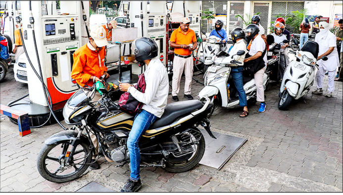
जम्मू-कश्मीर। वैश्विक कच्चे तेल की बढ़ती कीमतों के बीच पेट्रोल और डीजल की कीमतों में चार साल से अधिक समय में पहली बार 3 रुपये लीटर की बढ़ोतरी के बाद पेट्रोल पंप पर यात्री।