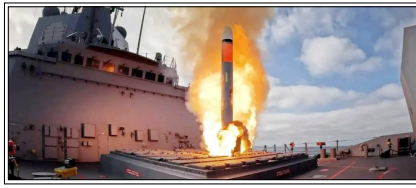
अधिकारी इस कार्यक्रम को पांच वर्षों में लगभग 12000 मिसाइलों की आपूर्ति के लिए अतिरिक्त धन की मांग कर रहे हैं

वाशिंगटन। अमेरिका ने कई संघर्षों में हथियारों के भारी इस्तेमाल के बाद गंभीर रूप से घट रहे मिसाइल भंडार को फिर से भरने के लिए व्यापक पहल की शुरुआत की है जिसके तहत 10000 से अधिक सस्ते कूज मिसाइलों और लगभग 12000 सस्ते हाइप-सोनिक हथियार हासिल करने के प्रयासों की घोषणा की गई है। इस योजना की घोषणा ऐसे समय में की गई है, जब यूक्रेन और इजरायल को बड़े पैमाने पर सैन्य सहायता देने के साथ-साथ 2025 और 2026 में ईरान में प्रत्यक्ष सैन्य अभियान चलाने के बाद अमेरिकी सैन्य आपूर्ति बहुत कम हो गई है। युद्ध विभाग के अनुसार, 'लो-कॉस्ट कंटेनरिज्ड मिसाइल्स' (एलसीसीएम) नामक एक नए कार्यक्रम के तहत एंडुरिल इंडस्ट्रीज, लेइदास, कोएस्पायर और जून 5 टेक्नोलॉजीज के साथ रूपरेखा समझौते पर हस्ताक्षर किए गए हैं। युद्ध विभाग ने हालांकि इस बारे में बहुत कम तकनीकी विवरण दिए हैं कि 'कंटेनरिज्ड' मिसाइलों का वास्तव में क्या अर्थ है, लेकिन एंडुरिल द्वारा जारी सूचना के अनुसार इन मिसाइलों की शिपिंग कंटेनरों जैसे दिखने वाले बक्सों से लॉन्च करते हुए दिखाया गया है। इस सूचना ने व्यापक ध्यान आकर्षित किया है क्योंकि ऐसे प्रणालियों को सैद्धांतिक रूप से नागरिक मालवाहक जहाजों पर छिपाया जा सकता है या पारंपरिक सैन्य बुनियादी ढांचे के बिना तेजी से तैनात किया जा सकता है। एक अलग समझौते में, युद्ध विभाग ने अगले दो वर्षों में कम से कम 500 ब्लैकबियर्ड हाइपरसोनिक मिसाइलों की खरीद के लिए अर्ध-अप स्टैलियन के साथ एक सौदे की