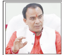
स्वामी विवेकानंद ई-पुस्तकालय योजना के तहत छात्रों को मिलेगी डिजिटल पुस्तकें

मुख्य संवाददाता शाह टाइम्स देहरादून। उच्च शिक्षा विभाग के अंतर्गत संचालित राज्य विश्वविद्यालयों, महाविद्यालयों एवं अशासकीय अनुदानित महाविद्यालयों में 'स्वामी विवेकानंद उत्तराखण्ड ई-पुस्तकालय योजना' लागू कर दी गई है। योजना के तहत शिक्षण संस्थानों में अध्ययनरत विद्यार्थियों को ऑनलाइन एकीकृत प्लेटफॉर्म पर सभी पाठ्यक्रमों की ई-बुक सहित अन्य डिजिटल कंटेंट उपलब्ध कराया जाएगा, ताकि छात्र-छात्राओं को किताबों को लेकर कोई दिक्कत न हो। योजना के तहत क्रियान्वयन के लिए शासन स्तर से सभी विश्वविद्यालयों के कुलपतियों एवं निदेशक उच्च शिक्षा को निर्देश जारी कर दिये गये हैं।