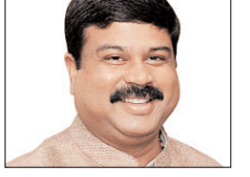
हर साल करीब एक करोड़ छात्रों की परीक्षाएं सफलतापूर्वक कराती है एजेंसी: केंद्रीय शिक्षा मंत्री

नई दिल्ली, वार्ता केंद्रीय शिक्षा मंत्री धर्मendra प्रधान ने शुरुवार को कहा कि राष्ट्रीय परीक्षा एजेंसी (एनटीए) की कमान योग्य हाथों में है और वह हर साल करीब एक करोड़ छात्रों की परीक्षाएं सफलतापूर्वक कराती है। प्रधान ने यहां संवाददाता सम्मेलन में कहा कि एनटीए की कमान योग्य हाथों में है। यह एजेंसी शीर्ष न्यायालय की सिफारिशों पर बनी है और हर साल करीब एक करोड़ छात्रों की परीक्षाएं सफलतापूर्वक कराती है। उन्होंने कहा कि एनटीए की कमान योग्य हाथों में है और हर साल करीब एक करोड़ छात्रों की परीक्षाएं सफलतापूर्वक कराती है। उन्होंने कहा कि एनटीए की कमान योग्य हाथों में है और हर साल करीब एक करोड़ छात्रों की परीक्षाएं सफलतापूर्वक कराती है। उन्होंने कहा कि एनटीए की कमान योग्य हाथों में है और हर साल करीब एक करोड़ छात्रों की परीक्षाएं सफलतापूर्वक कराती है।