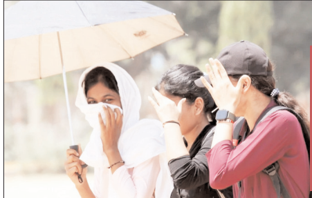
मौसम विभाग ने आगामी दिनों में भीषण गर्मी और लू चलने की चेतावनी जारी की