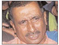
दिल्ली हाईकोर्ट का उल्टा फैसला निलंबन का फैसला किया रद्द

नई दिल्ली। सुप्रीम कोर्ट ने उन्नाव दुष्कर्म मामले में एक महत्वपूर्ण फैसला सुनाया है। श्रीष अदालत ने दिल्ली हाईकोर्ट के उस फैसले को रद्द कर दिया है, जिसमें पूर्व विधायक कुलदीप सिंह सेंगर को आजीवन कारावास की सजा निलंबित की गई थी। यह मामला 2017 के उन्नाव दुष्कर्म से जुड़ा है। दिल्ली हाईकोर्ट ने सेंगर को अंतिम जमानत देते हुए सजा निलंबित