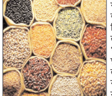
चावल, दालों में तेजी, खाद्य तेलों में रही घट-बढ़

नई दिल्ली, वार्ता घरेलू थोक जिस बाजारों में शुरुवार को चावल का औसत भाव बढ़ गया। चावल के साथ दालों में भी तेजी देखी गई। गेहूं और चीनी में टिकाव रहा जबकि खाद्य तेलों में उतार-चढ़ाव का रुख रहा। औसत दर्जे के चावल की औसत कीमत 18 रुपये बढ़कर 3,867 रुपये प्रति क्विंटल पर पहुंच गई। गेहूं 2,787 रुपये प्रति क्विंटल पर लगभग स्थिर रहा। आटा तीन रुपये प्रति क्विंटल फिसल गया। दाल-दलहानों में मसूर दाल की औसत कीमत 20 रुपये प्रति क्विंटल बढ़ गई। तुअर दाल 19 रुपये और उड़द दाल 17 रुपये महंगी हुई। मूंग दाल भी पांच रुपये ऊपर रहा। चना दाल की कीमत पिछले कारोबारी दिवस के स्तर पर टिकी रही। मलेशिया के बुरसा मलेशिया डेरिवेटिव एक्सचेंज में पाप ऑयल का जुलाई वायदा 24 रिपिट चढ़कर 4,417 रिपिट प्रति टन पर पहुंच गया।