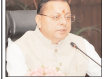
राज्य सरकार के कार्मिकों व पेंशनरों को महंगाई भत्ता दिये जाने का मुख्यमंत्री ने किया अनुमोदन

शाह टाइम्स ब्यूरो देहरादून। मुख्यमंत्री पुष्कर सिंह धामी ने केन्द्र सरकार की भांति, 01 जनवरी, 2026 से राज्य सरकार के कार्मिकों एवं पेंशनरों को महंगाई भत्ते की मौजूदा दर 58 प्रतिशत से बढ़ाकर 60 प्रतिशत प्रतिमाह किए जाने का अनुमोदन प्रदान किया है।