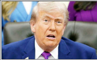
डोनाल्ड ट्रम्प ने दावा किया: चीन नहीं चाहता ईरान परमाणु हथियार हासिल करे

राष्ट्रपति ने कहा: ईरानी परमाणु सुविधाओं पर बमबारी दोहरा सकता है अमेरिका