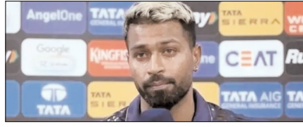
हार्दिक पंड्या पर मैच फीस का 10 फीसदी जुर्माना