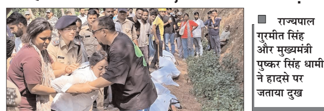
राज्यपाल गुरुमीत सिंह और मुख्यमंत्री पुष्कर सिंह धामी ने हादसे पर जताया दुःख

गिरी। कार में सवार पांच लोगों की मौके पर ही मौत हो गई। मृतकों में मूल रूप से खटीमा निवासी पति-पत्नी और उनके दो बच्चे