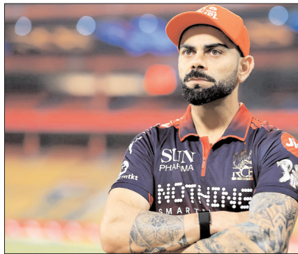
सालों की अनियमितता और करीबी हार के बाद, बेंगलुरु को इस सीजन में आधिकारिक सही संतुलन मिल गया लगता है, जिसमें उनकी बैटिंग और बॉलिंग दोनों युनिट्स एक योगदान मिल रहा है। आरसीबी 18 पॉइंट्स और 1-065 के बेहतरीन नेट रन रेट के साथ इस मुकाबले में उतर रही है, जिससे लीग चरण को टॉप पर खत्म करने के लिए

हैदराबाद, वार्ता। विराट कोहली की रॉयल चैलेंजर्स बेंगलुरु और सनराइजर्स हैदराबाद की विस्फोटक बैटिंग ताकत के बीच एक ब्लॉकबस्टर मुकाबला शुरूवार को यहां राजीव गांधी इंटरनेशनल क्रिकेट स्टेडियम में धूम मचाने के लिए तैयार है, क्योंकि आईपीएल 2026 का लीग चरण एक रोमांचक अंत की ओर बढ़ रहा है। हालांकि दोनों टीमों ने पहले ही प्लेऑफ के लिए क्वालिफाई कर लिया है, फिर भी टॉप-टू में जगह बनाने की दौड़ में यह मुकाबला बहुत अहम है, जिससे इस सीजन के सबसे ज्यादा इंतजार वाले मैचों में से एक में और भी ज्यादा रोमांच जुड़ गया है। सभी की नजरें पूरी तरह से कोहली पर टिकी होंगी, जिन्होंने रॉयल चैलेंजर्स बेंगलुरु के लिए एक जबरदस्त सीजन खेलाकर अपने पुराने रंग में वापसी की है। भारत के पूर्व कप्तान ने 13 पारियों में 54-20 की औसत और 164-74 के स्ट्राइक रेट से 542 रन बनाए हैं, और पॉइंट्स टेबल में टॉप पर पहुंचने में आरस।