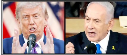
कतर, सऊदी अरब और यूएई जैसे खाड़ी देशों की अपील पर यह फैसला लिया गया: ट्रंप

नेल अवीव/वाशिंगटन। ईरान युद्ध को लेकर अमेरिकी राष्ट्रपति डोनाल्ड ट्रंप और इजरायली प्रधानमंत्री बेजायिन नेतन्याहू के बीच मतभेद खुलकर सामने आ गए हैं। एक रिपोर्ट के मुताबिक, नेतन्याहू चाहते हैं कि ईरान पर हमले जारी रहें, जबकि ट्रंप फिलहाल बातचीत और डील को मौका देना चाहते हैं। रिपोर्ट के मुताबिक, मंगलवार को दोनों नेताओं के बीच करीब एक घंटे तक फोन पर बातचीत हुई। अमेरिकी अधिकारी ने बताया कि नेतन्याहू ने ट्रंप से कहा कि ईरान पर प्रस्तावित हमले रोकना गलती है और सैन्य कार्रवाई जारी रहनी चाहिए। ट्रंप ने नेतन्याहू को बताया था कि अमेरिका ईरान पर नए टारगेट्स हमले की तैयारी कर रहा है। इस ऑपरेशन को 'ऑपरेशन स्लेजहैमर' नाम दिया जाना था, लेकिन करीब 24 घंटे बाद ट्रंप ने घोषणा कर दी कि मंगलवार के लिए तय हमलों को फिलहाल रोक दिया गया है। ट्रंप ने कहा कि कतर, सऊदी अरब और यूएई जैसे खाड़ी देशों को