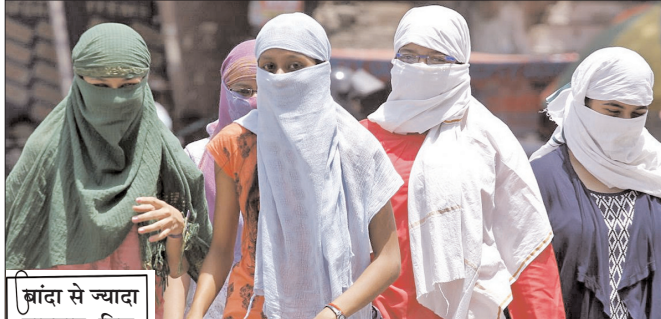
बांदा से ज्यादा तापमान मिस्र के असवान में 49.4 डिग्री और सऊदी के अराफात में 48.4 डिग्री सेल्सियस रहा

दुनियाभर में सबसे ज्यादा तापमान वाले टॉप-5 शहरों में खजुराहो 47.4 डिग्री सेल्सियस के साथ चौथे नंबर पर रहा। इधर, बलरामपुर में भीषण गर्मी के कारण कस्तूरबा गांधी आवासीय विद्यालय में पढ़ाई के दौरान 8 छात्राएं बेहोश हो गईं। सभी को उल्टी, सिरदर्द और बेहोशी जैसी शिकायतें -शेष पृष्ठ दो पर