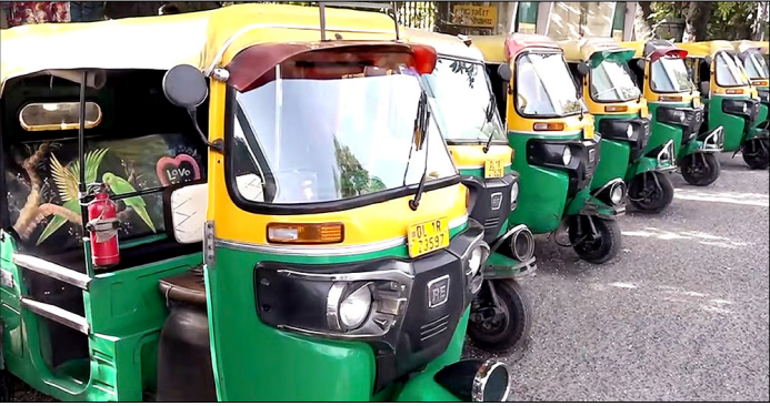
नई दिल्ली। ऑल इंडिया मोटर ट्रांसपोर्ट कांग्रेस (एआईएमटीसी) द्वारा वाणिज्यिक वाहनों पर पर्यावरण क्षतिपूर्ति उपकर बढ़ाने के फैसले के विरोध में बुलाई गई तीन दिवसीय हड़ताल के दौरान कतार में खड़े ऑटो-रिक्शा।