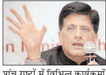
पांच राष्ट्रों में विभिन्न कार्यक्रमों के दौरान स्वगत किया गया, भारतीय प्रवासियों द्वारा उन्हें जो सम्मान दिया गया और भारत को मिले तीन अंतर्राष्ट्रीय सम्मान, जिनमें दो देशों और खाद्य एवं कृषि संगठन द्वारा प्रधानमंत्री को सम्मानित किया गया, वह हर भारतीय के लिए गर्व की बात है। यह केवल कूटनीतिक और राजनीतिक मंच पर की गई एक अंतर्राष्ट्रीय यात्रा मात्र नहीं थी। इस दौरान उन्होंने श्री गांधी पर निशाना साधते हुए कहा कि एक तरफ पूरी दुनिया भारत और प्रधानमंत्री को और बहुत भरपूर के साथ देखती है।

भारतीय जनता पार्टी ने प्रधानमंत्री नरेंद्र मोदी को गद्दार कहे जाने पर कांग्रेस नेता राहुल गांधी को आड़े हाथों लिया है और कहा है कि वह अपने शब्दों और भाषणों के जरिए बार-बार अपना असली स्वभाव और चरित्र दिखा रहे हैं।