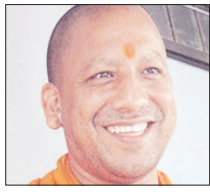
एक जनवरी 2026 से लागू होगा बढ़ा हुआ महंगाई भत्ता