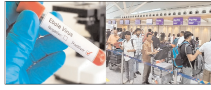
इबोला का डर: नजर रखें और सतर्क रहें