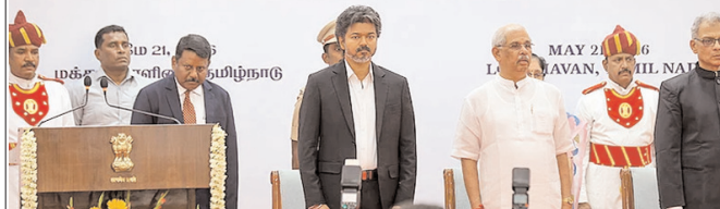
थाई वलथु 'सबसे आखिर में बजाया गया। पिछली सरकारों में ये हमेशा पहले बजाया जाता था। तमिलनाडु में सीएम विजय की कैबिनेट का विस्तार हुआ, जिसमें 23 विधायकों ने मंत्री पद की शपथ ली। इनमें दो कांग्रेस के विधायक भी शामिल हैं।