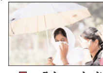
गर्मी के तलख तेवरों से सामान्य जन जीवन बुरी तरह प्रभावित, पशु पक्षी भी हो रहे बेहाल

लखनऊ। प्रचंड गर्मी और ताप लहरी का सामना कर रहे उत्तर प्रदेश के लोगों को राहत मिलने के फिलहाल कोई आसार नहीं है। मौसम विभाग के अनुसार पूरे प्रदेश में भीषण गर्मी और लू का प्रकोप जारी रहेगा।