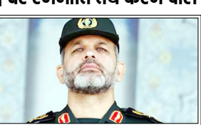
अहमद वाहिदी लंबे समय से ईरान की सुरक्षा और सैन्य रणनीति का अहम चेहरा रहे हैं

तेहरान। अमेरिका के साथ जारी युद्धविराम और परमाणु वार्ता के बीच ईरान में एक कट्टरपंथी सैन्य चेहरे का प्रभाव तेजी से बढ़ा दिख रहा है। ईरान की रिवोल्यूशनरी गार्ड के प्रमुख ब्रिगेडियर जनरल अहमद वाहिदी अब अमेरिका के साथ संपादित समझौते और युद्ध खत्म करने को लेकर रणनीति तय करने वाले सबसे अहम नेताओं में शामिल माने जा रहे हैं।