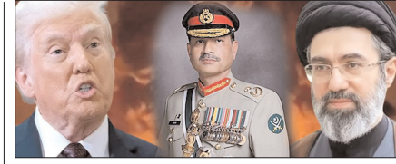
पाकिस्तान के जरिये अमेरिका का नया युद्ध विराम प्रस्ताव