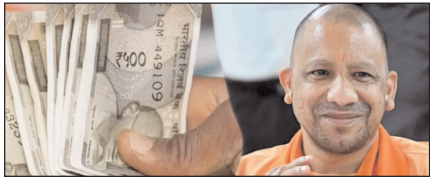
यूपी के कर्मचारियों-पेंशनरों को राहत, डीए 2 प्रतिशत बढ़ा

नई दिल्ली, मुजफ्फरनगर, देहरादून, हल्द्वानी, मुगदाबाद, बरेली, मेरठ व लखनऊ से प्रकाशित