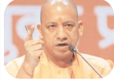
देवरिया के पोखरभिड़ा गांव में आयोजित जनसभा में बोले सीएम योगी राज्य में अब कानून व्यवस्था बेहतर

देवरिया, वार्ता उत्तर प्रदेश के मुख्यमंत्री योगी आदित्यनाथ ने कहा कि आज उत्तर प्रदेश की पहचान 'एक जिला एक उत्पाद', सुरासन, कानून के राज और तेजी से विकसित हो रहे राज्य के रूप में बन रही है, जबकि पहले प्रदेश की पहचान गुंडाराज और माफियाराज से होती थी। योगी शुकवार को देवरिया शहर से सटे पोखरभिड़ा गांव में आयोजित जनसभा को संबोधित कर रहे थे। इस दौरान उन्होंने 655 करोड़ 45 लाख रूपए लागत की 19 विकास परियोजनाओं का लोकार्पण और शिलान्यास किया। उन्होंने कहा कि देवरिया की जनता ने भाजपा को जिले की सार्ता विधानसभा सीटों पर विजय दिलाई देवरिया के मुख्यमंत्री योगी आदित्यनाथ ने कहा कि आज उत्तर प्रदेश की पहचान 'एक जिला एक उत्पाद', सुरासन, कानून के राज और तेजी से विकसित हो रहे राज्य के रूप में बन रही है, जबकि पहले प्रदेश की पहचान गुंडाराज और माफियाराज से होती थी। योगी शुकवार को देवरिया शहर से सटे पोखरभिड़ा गांव में आयोजित जनसभा को संबोधित कर रहे थे। इस दौरान उन्होंने 655 करोड़ 45 लाख रूपए लागत की 19 विकास परियोजनाओं का लोकार्पण और शिलान्यास किया। उन्होंने कहा कि देवरिया की जनता ने भाजपा को जिले की सार्ता विधानसभा सीटों पर विजय दिलाई