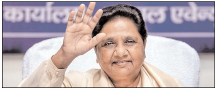
बिजली संकट से निजात दिलाने के उचित कदम उठाए सरकार: मायावती पेज 2

नई दिल्ली, मुजफ्फरनगर, देहरादून, हल्द्वानी, मुताबाद, बरेली, मेरठ व लखनऊ से प्रकाशित