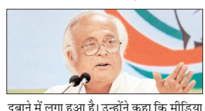
दबाने में लगा हुआ है। उन्होंने कहा कि मीडिया रिपोर्टों के अनुसार एनटीए के महानिदेशक ने एक संसदीय समिति के समक्ष दावा किया है कि नीट-यूजी 2026 परीक्षा का पेपर लीक नहीं हुआ था। रमेश ने कहा कि यदि यह दावा सही है, तो यह बेहद शर्मनाक और चौंकाने वाली बर्दमानी है, क्योंकि परीक्षा से पहले कीवत तौर पर एक 'गोस पेपर' विद्यार्थियों के बीच प्रसारित हो रहा था, जिसमें वास्तविक परीक्षा में आए दर्जनों प्रश्न शामिल थे। उन्होंने सवाल किया कि यदि इसे पेपर लीक नहीं माना जा रहा है, तो फिर इसे क्या कहा जाएगा और सरकार अब इसे नकारने की कोशिश क्यों कर रही है। कांग्रेस नेता ने आरोप लगाया कि मोदी सरकार इससे पहले भी नीट-यूजी 2024 में सामने आई व्यापक अनियमितताओं को दबाने की कोशिश कर चुकी है।

परीक्षा के पेपर लीक मामले में सरकार ने संसदीय समिति के समक्ष गलत बयान दिया नई दिल्ली, वार्ता कांग्रेस ने आरोप लगाया है कि नीट-यूजी 2026 परीक्षा के पेपर लीक मामले में सरकार ने संसदीय समिति के समक्ष गलत बयान दिया है और 2024 के पेपर लीक की सच्चाई छिपाने का प्रयास किया है, जिससे लाखों छात्रों का नुकसान हुआ है, इसलिए प्रधानमंत्री नरेंद्र मोदी तथा शिक्षा मंत्री धर्मेश प्रधान को इसकी जिम्मेदारी लेनी चाहिए। पार्टी ने यह भी आरोप लगाया है कि मोदी सरकार राष्ट्रीय परीक्षा एजेंसी (एनटीए) के माध्यम से परीक्षा घांघलियों और पेपर लीक मामले को सच्चाई दबाने का काम कर रही है तथा नीट-यूजी 2026 परीक्षा में पेपर लीक मामले को नकारने की कोशिश की जाती रही है। कांग्रेस संचार विभाग के प्रभारी जयराम रमेश ने शुकवार को सांशल मीडिया प्लेटफॉर्म 'एक्स' पर कहा कि 2018 में एनटीए के गठन के बाद से ही सरकार और उसका तंत्र परीक्षा मार्फिया के साथ मिलीभगत कर एनटीए द्वारा आयोजित परीक्षाओं में व्यापक अनियमितताओं और घाघली की सच्चाई दबाने में लगा हुआ है। तो फिर इसे क्या कहा जाएगा और सरकार अब इसे नकारने की कोशिश क्यों कर रही है। कांग्रेस नेता ने आरोप लगाया कि मोदी सरकार इससे पहले भी नीट-यूजी 2024 में सामने आई व्यापक अनियमितताओं को दबाने की कोशिश कर चुकी है।