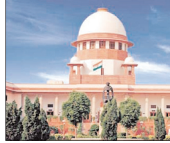
कहा: अगर संपन्न बच्चों के लिए फिर से आरक्षण मांगा जाए, तो हम कभी भी इस चक्र से बाहर नहीं निकल पाएंगे

जस्टिस बीवी नागरला और जस्टिस उज्वल भूइया की बेंच ने ये कमेंट तब किया। जब वे कर्नाटक हाईकोर्ट के एक फैसले के खिलाफ दायर याचिका पर सुनवाई कर रहे थे। याचिकाकर्ता को क्रीमी लेयर के आधार पर