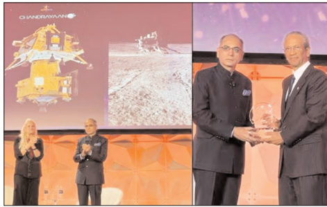
वाला दुनिया का पहला देश बना था। चंद्रमा का दक्षिणी ध्रुव वैज्ञानिक और रणनीतिक दृष्टि से बेहद महत्वपूर्ण माना जाता है। इस क्षेत्र को सतह पर इससे पहले कोई मिशन नहीं पहुंच पाया था। मिशन ने भविष्य के मानव चंद्र अभियानों के लिए अहम वैज्ञानिक आंकड़े उपलब्ध कराए। साथ ही चंद्रमा के दक्षिणी ध्रुवीय क्षेत्र की मिट्टी में कई महत्वपूर्ण रासायनिक तत्वों की मौजूदगी की पुष्टि की।

यह सम्मान 21 मई को वाशिंगटन डीसी में आयोजित कार्यक्रम के दौरान दिया गया। 23 अगस्त 2023 को चंद्रयान-3 ने इतिहास रचते हुए चंद्रमा के दक्षिणी ध्रुव के पास सफल सॉफ्ट लैंडिंग की थी। भारत ऐसा करने