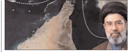
होर्मुज स्ट्रेट में जहाजों से फीस वसूलेगा ईरान पेज 12