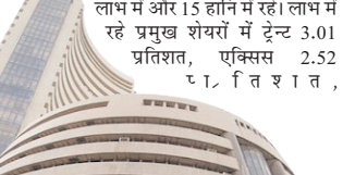
लाभ में और 15 हानि में रहे। लाभ में रहे प्रमुख शेयरों में टैट्ट 3.01 प्रतिशत, एक्सिस 2.52 प्रतिशत, एचडीएफसी बैंक 1.77 प्रतिशत, एशियन पेंट 1.56 प्रतिशत और हिंदुस्तान लोवर 1.06 प्रतिशत लाभ में रहा। एचडीएफसी बैंक, कोटक बैंक, बजाज फाइनेंस, अल्ट्रासीमेंट, बजाज फिनसेंस, इंडिगो और रिलायंस भी लाभ में रहे। सनफार्मा, आईटीसी, पावरग्रिड, भेल, भारती एयरटेल और इन्फोसिस जैसे कई प्रमुख शेयरों में 2.43 प्रतिशत से 0.61 प्रतिशत तक की गिरावट रही। संसेक्स में शामिल सूचना प्रौद्योगिकी क्षेत्र की अन्य कंपनियों के शेयर भी गिरावट में बंद हुए। पूरे दिन कारोबार के दौरान बाजार में उतार-चढ़ाव बना रहा।

मुंबई, वार्ता निजी क्षेत्र के बैंकों और वित्तीय सेवा कंपनियों के शेयरों को निवेशकों के समर्थन तथा इंजीनियरिंग और अवसरचनना क्षेत्र से जुड़ी कुछ चुनिंदा कंपनियों के शेयरों में लिवाली निकलने से स्थानीय शेयर बाजारों के प्रमुख शेयर सूचकांक शुकवार को बढ़त के साथ बंद हुए। शुरुआती कारोबार में रुपये की विनिमय दर में सुधार के संकेतों से भी बाजार को समर्थन मिला। बंबई बाजार का संसेक्स 231,99 अंक या 0.31 प्रतिशत बढ़कर 75,415.35 पर बंद हुआ, जबकि निफ्टी 64.60 अंक या 0.27 प्रतिशत बढ़कर 23,719.30 पर बंद हुआ। संसेक्स सुबह 75,260.39 पर खुलने के बाद ऊपर में 75,810.97 और नीचे में 75,230.75 अंक तक गया था। कल बाजार 75,183.36 पर बंद हुआ था। इसी तरह निफ्टी 50 सुबह 23,671.20 पर खुल कर ऊपर में 23,835.65 और नीचे में 23,671 अंक तक गया था। बीएसई में आज साप्ताहिक कारोबार के आखिरी दिन 15 शेयर