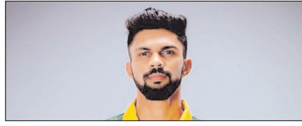
सीएसके के कप्तान गायकवाड़ पर लगा 24 लाख का जुर्माना खेल टाइम्स