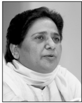
—सुश्री मायावती, अध्यक्ष, बसपा

सरकार को बिजली संकट से आमजन को निजात दिलाने के त्वरित उपाय करने चाहिए, बिजली संकट से गरीब, मध्यम वर्ग, किसान, छोटे व्यापारी और करोड़ों मेहनतकश लोगों का जीवन अति-कष्टदायी बन गया है, उत्तर प्रदेश जैसे विशाल आबादी वाले राज्य में भीषण गर्मी के इस मौसम में बिजली की कम आपूर्ति व कटौती आदि की आम शिकायतों को लेकर लोग विभिन्न रूपों में अपना आक्रोश भी प्रकट कर रहे हैं, जिसकी चर्चा समाचार माध्यमों में भी काफी व निरन्तर रहती है, सरकार बिजली आपूर्ति सम्बंधी लोगों के कष्ट व परेशानियों को ध्यान में रखते हुए जरूरी उपाय तत्काल सुनिश्चित करे, साथ ही, नए बिजलीघर के माध्यम से भी आगे के लिए बिजली आपूर्ति को सुधारने का प्रयास करे तो यह व्यापक जनहित में उचित होगा।