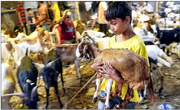
वाराणसी। बकरीट (ईद-उल-अजहा) के त्योहार से पहले पशु बाजार में बकरा खरीदने के बाद उसको गोद में उठाकर ले जाता एक बच्चा।