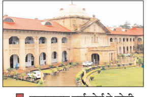
इलाहाबाद हाईकोर्ट ने योगी सरकार से मांगा जवाब