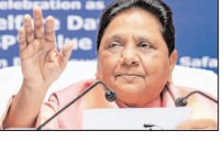
बसपा प्रमुख मायावती ने की मांग

शाह टाइम्स ब्यूरो लखनऊ। बहुजन समाज पार्टी अध्यक्ष मायावती ने उत्तर प्रदेश में भीषण गर्मी के बीच बिजली कटौती पर चिंता जताते हुए कहा कि सरकार को बिजली संकट से आमजन को निजात दिलाने के त्वरित उपाय करने चाहिए। सुश्री मायावती ने एक्स पर जारी संदेश में कहा कि बिजली संकट से गरीब, मध्यम वर्ग, किसान, छोटे व्यापारी और करोड़ों महंतन कश लोगों का जीवन अति-कष्टदाई बन गया है। उत्तर प्रदेश जैसे विशाल आबादी वाले राज्य में भीषण गर्मी के इस मौसम में बिजली की कम आपूर्ति व कटौती आदि की आम शिकायतों व उसको लेकर विशेषकर गरीब, मध्यम वर्ग, किसान, छोटे व्यापारियों व अन्य करोड़ों महंतन कश लोगों का जीवन