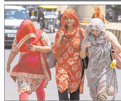
छत्तीसगढ़, हरियाणा, दिल्ली, मध्य प्रदेश, पंजाब, तेलंगाना, उत्तर प्रदेश और महाराष्ट्र में भी हीटवेव चलेगी। असम, मेघालय, कर्नाटक, नगालैंड, मणिपुर, मिजोरम, त्रिपुरा, कर्नाटक और तमिलनाडु में भारी बारिश का अनुमान है। 24 मई को बिहार, दिल्ली, हरियाणा, उत्तर प्रदेश, महाराष्ट्र, मध्य प्रदेश, छत्तीसगढ़, पंजाब, राजस्थान और तेलंगाना में हीटवेव की स्थिति बनी रह सकती है। पश्चिम बंगाल, ओडिशा और तमिलनाडु के कुछ हिस्सों में गर्म और उमसभरा मौसम बना रह सकता है - श्रेष्ठ पृष्ठ दो पर

यूपी के 13 शहर इनमें शामिल, 35 शहरों में रात में भी गर्म हवाएं चलीं, कई राज्य में स्कूलों के टाइम बदले गए, बांदा फिर टॉप पर