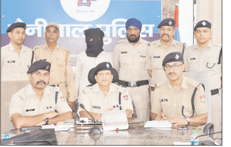
थाना मुखानी को तहरीर दी कि बच्ची नगर नंबर-1 स्थित उनके कार्यालय का शटर उखाड़कर

मुखांनी पुलिस ने 24 घंटे के भीतर दबोचा शातिर चोर, चोरी किए गए 3.17 लाख रुपये बरामद