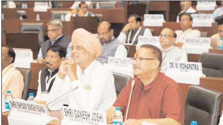
नई दिल्ली में केंद्रीय कृषि मंत्री शिवराज सिंह चौहान की अध्यक्षता में आयोजित राष्ट्रीय कृषि सम्मेलन के समापन कार्यक्रम में सूबे के कृषि मंत्री