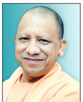
-योगी आदित्यनाथ, मुख्यमंत्री, उप्र

वर्तमान सरकार के कार्यकाल में माफिया, गुंडे और बदमाश अपनी औकात में आ गए हैं तथा प्रदेश छोड़कर भाग चुके हैं, अब किसी में इतनी हिम्मत नहीं है कि बेटियों और व्यापारियों की सुरक्षा में संघ लगा सके, यदि कोई अपराधी बेटियों और व्यापारियों की सुरक्षा में संघ लगाने की सोचता भी है, तो उसका इंतजार यमराज करते हैं, पूर्ववर्ती सरकार में नेताओं की स्थिति ऐसी थी कि माफियाओं को देखकर उनके पसीने छूट जाते थे, जबकि आज माफिया प्रदेश से गायब हैं, वर्तमान समय में प्रदेश में रामलीला, श्रीकृष्ण जन्माष्टमी, रक्षाबंधन, होली, दीपावली और दशहरा जैसे सभी पर्व-त्योहार उत्साह और शांति के साथ मनाए जा रहे हैं, अब किसी गुंडे या माफिया में इतनी हिम्मत नहीं है कि वह किसी पर्व या त्योहार में विघ्न डाल सके।