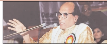
'बहुत तलाश किया, कोई आदमी ना मिला' बहुत याद आएंगे बशीर बद्र सम्पादकीय