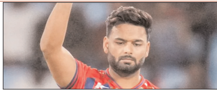
ऋषभ पंत ने लखनऊ सुपर जाइंट्स की कप्तानी छोड़ी खेल टाइम्स