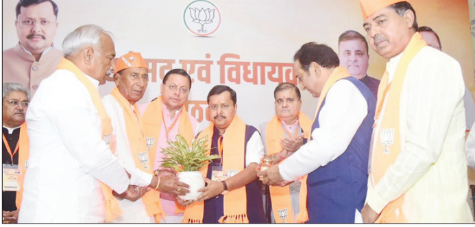
जन जन तक पहुंचे केंद्र और राज्य सरकार की उपलब्धियों का ब्यौरा भाजपा राष्ट्रीय अध्यक्ष ने की सांसद व विधायकों के साथ बैठक

मुख्य संवाददाता शाह टाइम्स देहरादून। भाजपा राष्ट्रीय अध्यक्ष नितिन नबीन ने सांसदों और विधायकों को पार्टी विचार परिवार बढ़ाने की दृष्टि से विधानसभावार कार्ययोजना में भूमिका निभाने के निर्देश दिए हैं। साथ ही पूर्व में हुए विस और लोस चुनाव में हारी हुई सीटों पर चर्चा तथा प्रवास के लिए लोकसभा एवं राज्यसभा सांसदों की जिम्मेदारी सुनिश्चित की जा रही है।