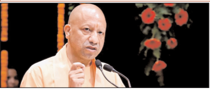
बेटी, व्यापारी को छेड़ने वाले का इंटरजार अब यमराज करते हैं: मुख्यमंत्री योगी पेज 2

shahtimes2015@gmail.com च्येठ शुक्ल पक्ष 13 विक्रमी सम्वत् 2083 12 जिलाहज्जा 1447 हिजरी नई दिल्ली, मुजफ्फरनगर, देहरादून, हल्द्वानी, मुगदाबाद, बरेली, मेरठ व लखनऊ से प्रकाशित