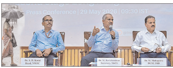
आईएमडी ने दक्षिण-पश्चिम मानसून के लिए अपना दूसरा दीर्घकालिक अनुमान किया जारी

नई दिल्ली। मौसम विज्ञान विभाग (आईएमडी) ने साल 2026 के दक्षिण-पश्चिम मानसून (जून से सितंबर) के लिए अपना दूसरा दीर्घकालिक अनुमान शुक्रवार को जारी कर दिया। इसके अनुसार देश के प्रमुख कई हिस्सों में इस साल मानसून की बारिश सामान्य से कम रहने का अनुमान है। देश में बारिश के मुख्य स्रोत दक्षिण-पश्चिम मानसून के लंबी अवधि के औसत (एलपीए) का 90 प्रतिशत होने की संभावना है और इसमें चार फीसदी घट-बढ़ हो सकती है। मौसम विज्ञान विभाग ने यहां एक संवाददाता सम्मेलन में यह जानकारी दी। मौसम विभाग ने