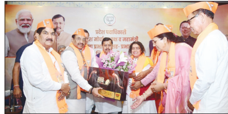
कार्यकर्ताओं में जोश भरकर बोले राष्ट्रीय अध्यक्ष, उत्तराखण्ड में सांस्कृतिक राष्ट्रवादी सरकार

मुख्य संवाददाता शाह टाइम्स देहरादून। भाजपा राष्ट्रीय अध्यक्ष ने देवभूमि से हमेशा भगवा संदेश को देश दुनिया में ले जाने लक्ष्य के साथ 2027 चुनाव में जीत का आह्वान किया है। उन्होंने जोर देते हुए कहा कि ये सिर्फ एक सरकार नहीं बल्कि सांस्कृतिक राष्ट्रवादी विचारों की सरकार है, जिसे प्रचंड बहुमत से वापिस लाना जरूरी है।