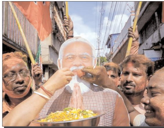
टीवीके स्पष्ट रूप से सबसे बड़ी पार्टी के रूप में उभरी है। केरल में सत्ता परिवर्तन के संकेतों के बीच एक दशक बाद कांग्रेस के नेतृत्व में संयुक्त लोकतांत्रिक मोर्चा की सरकार बनेगी। असम और पुडुचेरी में राष्ट्रीय जनतांत्रिक गठबंधन सरकार की वापसी निश्चित हो गई है। चुनाव आयोग के रूझानों के आंकड़ों के अनुसार पश्चिम बंगाल में एग्जिट पोल के अनुमानों के अनुरूप भाजपा को

नई दिल्ली। पांच राज्यों के विधानसभा चुनाव की मतगणना के रूझानों में पश्चिम बंगाल और तमिलनाडु में भारी उलटफेर की संभावना के साथ भारतीय जनता पार्टी बंगाल में अपने दम पर जबरदस्त बहुमत हासिल करने जा रही है। पश्चिम बंगाल की मुख्यमंत्री और टीएमसी अध्यक्ष ममता बनर्जी भवानीपुर से सुबेदु अधिकारी से 15,114 वोटों से चुनाव हार गईं। सुबेदु के खिलाफ यह उनको लगातार दूसरी हार है। 2021 विधानसभा चुनाव में सुबेदु नंदीग्राम से ममता के खिलाफ जीते थे। ममता हार से पहले ही काउंटिंग सेंटर से निकल गईं। उन्होंने आरोप लगाया कि, मुझे अंदर धक्का दिया और पीटा गया। यहां दोबारा काउंटिंग होगी चाहिए। उधर तमिलनाडु में अभिनेता विजय के करिश्मे के दम पर