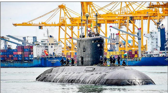
कोलंबो। श्रीलंका के साथ समुद्री सहयोग बढ़ाने के उद्देश्य से आयोजित यात्रा के दौरान भारतीय नौसेना की एनडुब्लू आईएनएस सिंधुकेसरी श्रीलंका पहुंची।