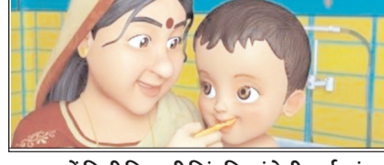
न हाथ में डिग्री फिर भी जिंदगियां देती दाईं मां सम्पादकीय