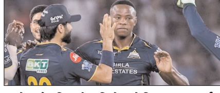
ऑरेंज कैप फिर से अभिषेक के सिर, रबाडा पर्पल कैप की दौड़ में खेल टाइम्स