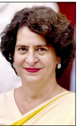
-प्रियंका गांधी वाड़ा कांग्रेस सांसद, वायनाड

केरल की जनता का भरोसा ही यूडीएफ के लिए मार्गदर्शक शक्ति बनेगा और आने वाले पांच वर्षों में इमानदारी एवं विनम्रता के साथ किए गए वादों को पूरा करने का प्रयास किया जाएगा, वायनाड में यूडीएफ को 7 में से 7 सीटों पर मिली जीत जनता के मजबूत विश्वास का प्रतीक है, क्षेत्र के विकास के लिए सभी प्रतिनिधि मिलकर काम करेंगे और जनता की उम्मीदों पर खरा उतरने की पूरी कोशिश करेंगे, यूडीएफ कार्यकर्ताओं और नेताओं के अथक प्रयासों से एकजुट और प्रगतिशील केरल का संदेश हर घर तक पहुंचा है तथा आने वाले वर्षों में जनता की सेवा का संकल्प और मजबूत होगा।