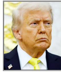
और कामन सिन्कोरिटी फेमवर्क विकसित कर रहे हैं। मैक्रों ने अमेरिकी राष्ट्रपति डोनाल्ड ट्रम्प द्वारा शुरू किए गए प्रोजेक्ट फ्रीडम में शामिल होने से साफ इनकार कर दिया। यह पहल होर्मुज जलडमरूमध्य में जहाजों की आवाजाही बहाल करने के लिए शुरू की गई है। उन्होंने कहा कि हम ऐसी किसी पहल में हिस्सा नहीं लेंगे, जिसका ढांचा स्पष्ट न हो। हालांकि फ्रांस ने जलमार्गों को फिर से खोलने के प्रयासों का समर्थन किया, लेकिन यह भी स्पष्ट किया कि वह किसी भी फोर्स-वेब्ड आपरेशन में शामिल नहीं होगा, जब तक कि उसका स्पष्ट और सहमति आधारित ढांचा न हो। मैक्रों ने कहा कि होर्मुज

पेरिस। पश्चिम एशिया में बढ़ते तनाव और स्ट्रेट ऑफ होर्मुज को लेकर जारी संकट के बीच फ्रांस के राष्ट्रपति इमैनुएल मैक्रों ने साफ कर दिया है कि यूरोप इस मुद्दे पर अमेरिका से अलग रणनीति अपनाएगा। फ्रांस के राष्ट्रपति ने कहा कि यूरोप अपना स्वतंत्र सुरक्षा ढांचा तैयार कर रहा है और अमेरिका के नेतृत्व वाले किसी अस्पष्ट सैन्य आपरेशन का हिस्सा नहीं बनेगा।