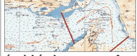
ईरान ने होर्मुज स्ट्रेट का नया नक्शा जारी किया पेज 12