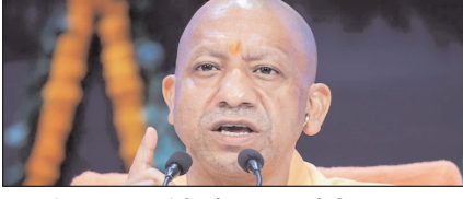
उपरी की तबादला नीति में सरकार ने किया बदलाव पेज 2

नई दिल्ली, मुजफ्फरनगर, देहरादून, हल्द्वानी, मुगदाबाद, बरेली, मेरठ व लखनऊ से प्रकाशित