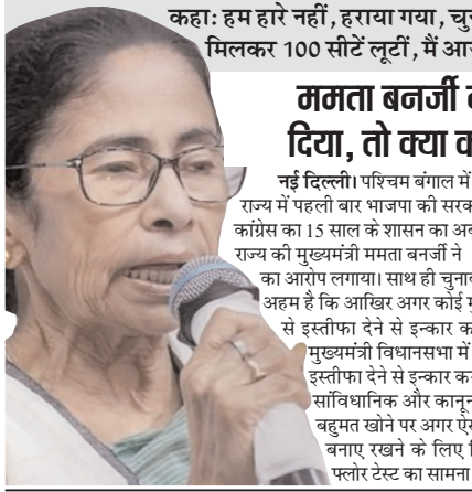
कहा: हम हारे नहीं, हराया गया, चुनाव आयोग विलेन, भाजपा से मिलकर 100 सीटें लूटीं, मैं आजाद पंछी, शेर की तरह लड़ूंगी

कोलकाता, वार्ता पश्चिम बंगाल की मुख्यमंत्री ममता बनर्जी ने मंगलवार को कोलकाता में प्रेस कॉन्फ्रेंस के दौरान कहा कि मैं सीएम पद से इस्तीफा नहीं दूंगी। हम जनता से हैं, साजिश से हारे हैं। इसलिए इस्तीफा देने राजभवन नहीं जाऊंगी। ममता ने आगे कहा कि चुनाव आयोग असली विलेन है। उसने भाजपा के साथ मिलकर 100 सीटें लूटीं। अब मेरे पास कोई इस्तीफा नहीं है, मैं आजाद पंछी हूँ। कहीं से भी चुनाव लड़ सकती हूँ, सड़कों पर रहूंगी। ममता ने आरोप लगाया कि भाजपा ने काउंटिंग सेंट्रों पर कब्जा कर लिया था। मेरे साथ बदसलूकी की। उम्मीदवारों और कार्यकर्ताओं के साथ अत्याचार किया। पार्टी और इंडिगो गठबंधन के नेता मेरे साथ हैं। हम फिर से उभरेंगे और शेर की तरह लड़ेंगे। पश्चिम बंगाल सहित 5