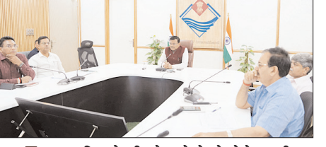
■ मुख्य सचिव ने की प्रदेश के रोपवे प्रोजेक्ट की समीक्षा, जागेश्वर धाम परियोजना में रोपवे को किया जाए शामिल ■ प्रदेश में रोपवे प्रोजेक्ट की प्राथमिकता तय करने के लिए उपसमिति गठित, मसूरी रोपवे के लोअर टर्मिनल की अडचनों को अगले तीन दिन में निस्तारण करें सम्बन्धित विभाग

शाह टाइम्स ब्यूरो देहरादून। मुख्य सचिव आनंद बर्दान ने मंगलवार को प्रदेश में रोपवे निर्माण की प्रगति की समीक्षा की। बैठक के दौरान मुख्य सचिव ने विभिन्न रोपवे प्रोजेक्ट्स की अद्यतन स्थिति की जानकारी ली। उन्होंने रोपवे प्रोजेक्ट के लिए नियामक प्राधिकरण के रूप में ब्रिडकुल को मजबूत किए जाने के निर्देश दिए। इसके रोल और रेस्पॉसिबिलिटी का ड्राफ्ट शीघ्र तैयार किए जाने के निर्देश दिए हैं। मुख्य सचिव ने जागेश्वर धाम योजना में रोपवे प्रोजेक्ट को शामिल किए जाने भी निर्देश दिए हैं। मुख्य सचिव ने रोपवे बनाने के लिए प्राथमिकता तय करने हेतु उपसमिति गठित करने के निर्देश दिए हैं। उन्होंने प्रमुख सचिव नियोजन की अध्यक्षता में सचिव पर्यटन, सचिव आवास, सचिव