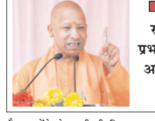
घायलों का त्वरित और समुचित इलाज तथा सभी प्रभावितों को 24 घंटे के भीतर अनुमन्य राहत राशि उपलब्ध कराई जाए: मुख्यमंत्री

शाह टाइम्स ब्यूरो लखनऊ। उत्तर प्रदेश के मुख्यमंत्री योगी आदित्यनाथ ने प्रदेश में आंधी, वर्षा और आक. शीघ्र बिजली से हुई जनहानि को गंभीरता से लेते हुए प्रशासन को अलर्ट मोड पर रखने के निर्देश दिए हैं। मंगलवार को मुख्यमंत्री ने मृतकों के परिजनों के प्रति गहरी संवेदना व्यक्त करते हुए अधिकारियों को सख्त निर्देश दिया कि घायलों का त्वरित और समुचित इलाज सुनिश्चित किया जाए तथा सभी प्रभावितों को 24 घंटे के भीतर अनुमन्य राहत राशि उपलब्ध कराई जाए। मुख्यमंत्री ने स्पष्ट कहा कि जनहानि, पशुहानि और घायलों को समयबद्ध सहायता देना प्रशासन की प्राथमिक जिम्मेदारी है। उन्होंने चेतावनी दी कि राहत कार्यों में किसी भी स्तर पर लापरवाही बर्दाश्त नहीं की जाएगी और जिम्मेदार अधिकारियों के खिलाफ कार्रवाई तय होगी। उन्होंने सभी जिलाधिकारियों को निर्देश दिया है कि वे फील्ड में रहकर राहत एवं सहाय कार्यों को लगातार निगरानी करें। साथ ही, प्रभावित क्षेत्रों में आवश्यक संसाधनों की उपलब्धता सुनिश्चित करने के लिए शासन से समन्वय बनाए रखें। प्रशासन ने लोगों से अपील की है कि खराब मौसम के दौरान घरों में ही रहें और खुले स्थानों, पेड़ों तथा बिजली के खंभों से दूर रहें। प्रभावित क्षेत्रों में राहत और सहाय कार्यों में सक्रिय कर दी गई है, ताकि किसी भी आपात स्थिति में त्वरित कार्रवाई की जा सके और जनहानि को न्यूनतम रखा जा सके। दूसरी ओर उत्तर प्रदेश में आगामी दिनों में मौसम का मिजाज बदलता नजर आएगा। मौसम विभाग द्वारा मंगलवार को जारी ताजा पूर्वानुमान