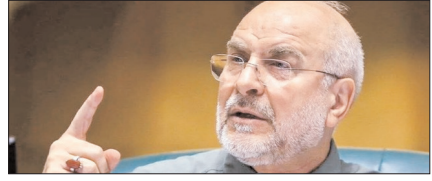
होर्मुज तनाव के बीच अमेरिकी प्रभाव कम हो जाएगा: गालिबफ