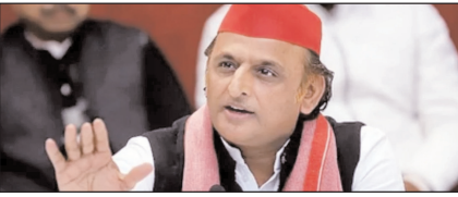
महिला आरक्षण पर भाजपा अपना रुख साफ करे: अखिलेश यादव

नई दिल्ली, मुजफ्फरनगर, देहरादून, हल्द्वानी, मुगदाबाद, बरेली, मेरठ व लखनऊ से प्रकाशित