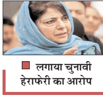
लगाया चुनावी हेराफेरी का आरोप

श्रीनगर, वार्ता जम्मू-कश्मीर की पूर्व मुख्यमंत्री एवं पीपुल्स डेमोक्रेटिक पार्टी की अध्यक्ष महबूबा मुफ्ती ने मंगलवार को चुनाव आयोग पर गंभीर आरोप लगाते हुए कहा कि यह संस्था केंद्रीय एजेंडियों के साथ मिलकर चुनावी प्रक्रिया को कमजोर कर रही है। सुश्री मुफ्ती का यह बयान पश्चिम बंगाल चुनावों में भारतीय जनता पार्टी की बड़ी जीत के एक दिन बाद आया है। उन्होंने इन परिणामों को देश की लोकतांत्रिक संस्थाओं की गिरती स्थिति के प्रति बड़ी चिंता का हिस्सा बताया। पीडीपी अध्यक्ष ने सोशल मीडिया प्लेटफॉर्म 'एक्स' पर एक पोस्ट में कहा कि टीएन शेषन द्वारा किए गए सुधारों के बाद कभी भारत की मजबूत चुनाव प्रणाली की पूरी दुनिया में प्रशंसा होती थी और आयोग को लोकतंत्र का 'निडर