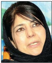
-महबूबा मुफ्ती, अध्यक्ष, पीडीपी

चुनाव आयोग केंद्रीय एजेंसियों के साथ मिलकर चुनावी प्रक्रिया को कमजोर कर रहा है, पश्चिम बंगाल चुनावों के परिणाम देश की लोकतांत्रिक संस्थाओं की गिरती स्थिति के प्रति बड़ी चिंता का हिस्सा है, टीएम शेषन द्वारा किए गए सुधारों के बाद कभी भी भारत की मजबूत चुनाव प्रणाली की पूरी दुनिया में प्रशंसा होती थी और आयोग को लोकतंत्र का निडर रक्षक माना जाता था, आज वही संस्था केंद्रीय एजेंसियों की मदद से चुनावी प्रक्रिया में बाधा डालने के आरोपों के घेरे में है, देश भले ही विश्वगुरु बनने का लक्ष्य हासिल न कर पाया हो, लेकिन चुनावी हेराफेरी की कला में जरूर महारत हासिल कर ली है, पश्चिम बंगाल के हालिया घटनाक्रम इस परेशान करने वाली वास्तविकता का ताजा उदाहरण है।