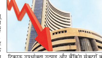
टिकाऊ उपभोक्ता उत्पाद और बैंकिंग सेक्टरों के सूचकांक नीचे बंद हुए। एनएसई में जिन 3,391 कंपनियों के शेयरों में आज कारोबार हुआ उनमें से 1,600 के शेयर ऊपर और 1,680 के लाल निशान में रहे। अन्य 111 कंपनियों के शेयर अंततः अपरिवर्तित बंद हुए। संसेक्स की कंपनियों में महिंद्रा एंड महिंद्रा का शेयर 3.41 फीसदी मजबूत हुआ। अल्ट्राटेक सीमेंट में 1.79 प्रतिशत और बजाज फाइनेंस, हिंदुस्तान यूनीलिवर और इंडोफिसिस के शेयर भी हरे निशान में रहे।

मुंबई, वार्ता विदेशों से मिले मिश्रित संकेतों के बीच घरेलू शेयर बाजारों में बैंकिंग सेक्टर में बिकवाली से मंगलवार को प्रमुख सूचकांक नीचे बंद हुए। बीएसई का 30 शेयरों वाला संवेदी सूचकांक संसेक्स 251.61 अंक (0.33 प्रतिशत) गिरकर 77,017.79 अंक पर बंद हुआ। इससे पहले संसेक्स को शुरुआत गिरावट के साथ हुई थी और दोपहर तक यह 750 अंक से ज्यादा टूट गया था, लेकिन बाद में इसने काफी हद तक वापसी की। नेशनल स्टॉक एक्सचेंज (एनएसई) का निफ्टी-50 सूचकांक भी 86.50 अंक यानी 0.36 प्रतिशत फिसलकर 24,032.80 अंक पर रहा। दोनों सूचकांक पिछले कारोबारी दिवस पर बढ़त में रहे थे। बृहद बाजार में लिक्विडिटी का जोर रहा। मझौली कंपनियों का मिडकैप-50 सूचकांक 0.07 प्रतिशत और छोटी कंपनियों का स्मॉलकैप-100 सूचकांक 0.28 प्रतिशत ऊपर रहा। ऑटो, एफएमसीजी और फार्मा सेक्टरों में अच्छी तेजी रही जबकि रियलटी,