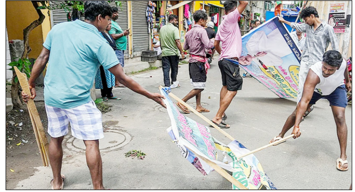
कोलकाता। पश्चिम बंगाल विधानसभा चुनाव में भाजपा की जीत के बाद टॉलीगंज निर्वाचन क्षेत्र की सड़कों से टीएमसी के होर्डिंग्स-बैनर फाड़कर फेंकते भाजपा समर्थक।

अधिकारियों ने बताया कि 'ज्याइंट टास्क फोर्स साउथर्न स्पीयर' ने उस नाव को निशाना बनाया जिसके बारे में जानकारी मिली थी कि वह प्रतिबंधित आतंकवादी संगठनों से जुड़ी है और ड्रग्स तस्करी के रास्ते पर जा रही है। इस पूरी कार्रवाई में किसी भी अमेरिकी सैनिक को चोट नहीं आई है। यह ताजा कार्रवाई ट्रम्प प्रशासन द्वारा लैटिन अमेरिका में 'नाको-टेररिज्म' के खिलाफ सितम्बर से चलाए जा रहे अभियान का हिस्सा है। कैरिबियन और पूर्वी प्रशांत क्षेत्र में फैले इस अभियान में अब तक कम से कम 188 लोग मारे जा चुके हैं। हालांकि, अमेरिकी सेना ने अभी तक सार्वजनिक रूप से ऐसे सबूत पेश नहीं किए हैं जिनसे यह पुष्टि हो सके कि निशाना बनाए गए जहाजों में नशीली दवाएँ मौजूद थीं। भले ही इस समय दुनिया का ध्यान पश्चिमी एशिया के संघर्ष पर है, लेकिन पिछले कुछ हफ्तों में इस तरह के हमलों की संख्या में वृद्धि हुई है। इससे यह संकेत मिलता है कि पश्चिमी गोलार्ध में अमेरिका के नशीली दवाओं के खिलाफ चलाए जा रहे अभियान उसकी प्राथमिकता बने हुए है।