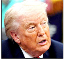
ट्रम्प इस युद्ध के लिए समय-समय पर अलग-अलग शब्दों का इस्तेमाल कर रहे

वाशिंगटन। अमेरिकी राष्ट्रपति डोनाल्ड ट्रम्प ने ईरान के साथ जारी सैन्य संघर्ष को 'छोटा युद्ध' करार देते हुए इसके प्रभाव और पैमाने को कमतर बताने का प्रयास किया है। ट्रम्प ने व्हाइट हाउस में छोटे व्यवसायों से जुड़े एक कार्यक्रम को संबोधित करते हुए कहा कि हमारा देश इस समय काफी तरक्की कर रहा है, जबकि हम एक संघर्ष में उलझे हुए हैं, जिसे मैं जिसे मैं लघु युद्ध कहता हूँ। गौरतलब है कि ट्रम्प इस युद्ध के लिए समय-समय पर अलग-अलग शब्दों का इस्तेमाल कर रहे हैं। कभी वह इसे 'युद्ध' कहते हैं, तो कभी 'सैन्य अभियान', 'भ्रमण' या सिर्फ एक