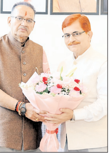
■ कृषि मंत्री ने नई जिम्मेदारियों के लिए दी शुभकामनाएं