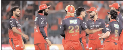
बेंगलुरु में आईपीएल फाइनल की मेजबानी के मौकों पर संकट