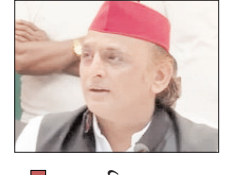
कहा: महिला आरक्षण को उत्तर प्रदेश के 2027 विधानसभा चुनाव में लागू किया जाए

शाह टाइम्स ब्यूरो लखनऊ। समाजवादी पार्टी अध्यक्ष अखिलेश यादव ने महिला आरक्षण को लेकर भाजपा सरकार पर निशाना साधते हुए मंगलवार को कहा कि पीडीए (पिछड़ा, दलित, अल्पसंख्यक) की स्पष्ट मांग है कि संसद में पारित महिला आरक्षण को उत्तर प्रदेश के 2027 विधानसभा चुनाव में लागू करने की तत्काल घोषणा की जाए। यादव ने कहा कि यह विधेयक समस्त विपक्ष के सहयोग से पारित हुआ है, ऐसे में अब भाजपा सरकार को अपनी मंशा स्पष्ट करनी चाहिए। यदि सरकार इस पर घोषणा नहीं करती है, तो उसे यह भी स्पष्ट करना चाहिए कि क्या भाजपा और