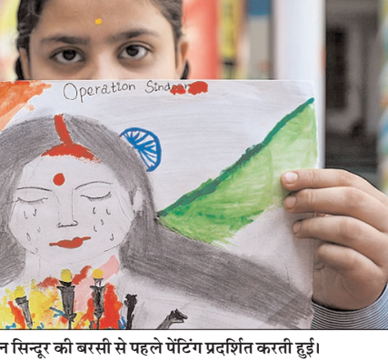
जम्मू: एक स्कूली छात्रा ऑपरेशन सिन्दूर की बरसी से पहले पेंटिंग प्रदर्शित करती हुई।