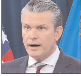
अमेरिकी रक्षा मंत्री हेगसेथ बोले- सीजफायर अभी भी लागू

वाशिंगटन/तेहरान। पश्चिम एशिया में तनाव एक बार फिर बढ़ता दिख रहा है, जहां ईरान और अमेरिका के बीच स्ट्रेट ऑफ होर्मुज को लेकर स्थिति बेहद संवेदनशील बनी हुई है। हालात ऐसे हैं कि सीजफायर की घोषणा के बावजूद दोनों पक्षों की सैन्य गतिविधियां जारी हैं। अमेरिकी रक्षा मंत्री पीट हेगसेथ ने स्पष्ट किया है कि सीजफायर अभी भी लागू है और इसे खत्म नहीं माना जा सकता। उन्होंने कहा कि स्ट्रेट ऑफ होर्मुज में जहाजों की सुरक्षा के लिए चलाया जा रहा अभियान अलग और सीमित प्रकृति का है। उन्होंने यह भी कहा कि यह ऑपरेशन केवल वाणिज्यिक जहाजों की