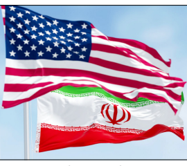
यूएई ने इस हमले की कड़ी निंदा करते हुए इसे तनाव बढ़ाने वाला कदम बताया है

संयुक्त अरब अमीरात (यूएई) के फुजैरा पेट्रोलियम उद्योग क्षेत्र पर ईरान के ड्रोन हमले के बाद स्थिति और भी गंभीर हो गई है। इस हमले में तीन भारतीय नागरिक घायल हुए हैं। यूएई ने इस हमले की कड़ी निंदा करते हुए इसे तनाव बढ़ाने वाला कदम बताया है। इस घटना ने उस शांति को खत्म कर दिया है जो अमेरिका और ईरान के बीच युद्धविराम के बाद से बनी हुई थी। दोनों देशों के बीच आठ अप्रैल को युद्धविराम की घोषणा हुई थी, जिससे 22 अप्रैल को आगे बढ़ाया गया था। इस बीच राजनयिक माध्यमों से प्रस्तावों का आदान-प्रदान जारी है। हालांकि, ट्रम्प ने चेतावनी दी है कि यदि ईरानी सेना ने होर्मुज जलडमरूमध्य या फारस की खाड़ी में कहीं भी अमेरिकी जहाजों को निशाना बनाने का दुस्साहस किया, तो उन्हें 'धरती से मिटा दिया जाएगा।' ईरान की प्रतिक्रिया भी उतनी ही आक्रामक रही है। ईरानी संसद के अध्यक्ष मोहम्मद बाघेर गालीबाफ ने अमेरिका और उसके सहयोगियों पर युद्धविराम के उल्लंघन और