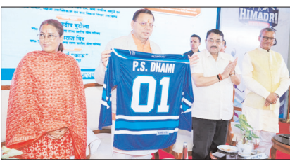
■ उत्तराखण्ड में लागू होगा स्पोर्ट्स लेगेसी प्लान, 8 शहरों में खुलेंगे 23 खेल अकादमियां