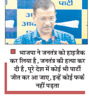
भाजपा ने जनतंत्र को हाइजैक कर लिया है, जनतंत्र की हत्या कर दी है, पूरे देश में कोई भी पार्टी जीत कर आ जाए, इन्हें कोई फर्क नहीं पड़ता

नई दिल्ली, वार्ता आम आदमी पार्टी के राष्ट्रीय संयोजक अरविंद केजरीवाल ने भारतीय जनता पार्टी पर जनतंत्र की हत्या करने का आरोप लगाते हुए कहा कि पूरे देश में कोई भी पार्टी जीत कर आ जाए, इन्हें कोई फर्क नहीं पड़ता है, क्योंकि एजेंडियां लगाकर विधायकों को तोड़कर सरकारें गिरा देते हैं। केजरीवाल ने पंजाब के मुख्यमंत्री भगवंत सिंह मान के साथ दिल्ली आए पार्टी के विधायकों के साथ कपूरथला हाउस में संवाद किया। उन्होंने इस दौरान कहा कि आज पूरे देश में बहुत बंध संकेत छाया हुआ है। भाजपा ने जनतंत्र को हाइजैक कर लिया है, जनतंत्र की हत्या कर दी है। पूरे देश में कोई भी पार्टी जीत कर आ जाए, इन्हें कोई फर्क नहीं पड़ता है। इसके बाद ए ईडी-सीबीआई और पीसे से, उस पार्टी के विधायक तोड़ लेते हैं, पार्टीयां तोड़ लेते हैं, जेल भेज देते हैं और सरकारें गिरा देते हैं। जीतने के लिए ये लोग वोट काट देते हैं, अपना वोट जुड़वा देते हैं। सोमवार को पश्चिम बंगाल चुनाव का आया परिणाम कोई चुनाव नहीं था। पिछले 3-4 महीने से हम देख रहे हैं कि पश्चिम बंगाल के अंदर तांडव चल रहा है। इसी तरह इन्होंने बिहार, महाराष्ट्र में किया। इन्होंने कहा कि जब मैं जेल गया, उससे पहले नई दिल्ली विधानसभा में 1 लाख 48 हजार वोट थे। जब मैं लौट कर आया तो 1 लाख 6 हजार वोट बचे थे। इन्होंने करीब 6 महीने के अंदर 42 हजार वोट कटवा दिया। पिछली बार नई दिल्ली विधानसभा सीट से मैं 30 हजार वोट से जीता था। इन्होंने 42 हजार