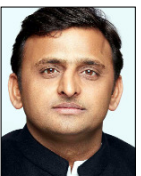
-अखिलेश यादव, अध्यक्ष, समाजवादी पार्टी

उप्र में मंत्रिपरिषद विस्तार में मुख्यमंत्री की कोई भूमिका नहीं रह गई है और फैसेले ऊपर से आने वाली परिषदों के आधार पर हो रहे हैं, समय बिताने के लिए करना है कुछ काम, वैसे भी मंत्रिमंडल के विस्तार में तो इनका कोई काम है नहीं, उधर से पचा आया, यहाँ तो सिर्फ पढ़ी जाएगी, भाजपा राज में वैसे भी सीएम का मतलब बस यही रह गया है, कुरियर मैसेंजर, जनता पूछ रही है कि फिल्म सबसे आगे बैठकर देखेंगे या पीछे बैठकर साथ ही उन्होंने यह भी कहा कि फिल्म ध्यान से देखिएगा, हो सकता है कर्मफल-कंसफल का सिद्धांत समझ में आए और कुछ सकारात्मक बदलाव देखने को मिले, मूल रूप से व्यक्ति नहीं, बल्कि उसका लालच और लोभ बुरा होता है, जो दुराचरण का रूप ले लेता है।