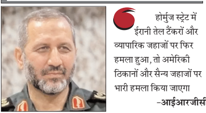
होर्मुज स्ट्रेट में ईरानी तेल टैंकरों और व्यापारिक जहाजों पर फिर हमला हुआ, तो अमेरिकी ठिकानों और सैन्य जहाजों पर भारी हमला किया जाएगा -आईआरजीसी

संयुक्त राष्ट्र में अमेरिका के प्रस्ताव को बहरीन एवं अन्य देशों का समर्थन मिलने की रिपोर्टों के बीच दी चेतावनी