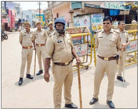
घटे, इसके लिए रविवार को भारी पुलिस बल और पीएसो तैनात रही। पुलिस ने गांव के भीतर जाने वाले रास्तों और गलियों में कई जगह मजबूत बैरिकेडिंग की हुई है। प्रशासनिक अधिकारियों का

शाह टाइम्स ब्यूरो देवबन्द। दो बीघा जमीन को लेकर भड़के जालीय बवाल के बाद रविवार को दूसरे दिन भी स्थिति तनावपूर्ण बनी हुई है। सुरक्षा और कानून-व्यवस्था के महंजर पूरे गांव को छावनी में तब्दील कर दिया गया है। प्रशासन ने एहतियात के तौर पर गांव की सभी सीमाओं को पूरी तरह सील करते हुए बाहरी व्यक्तियों के प्रवेश पर पूरी तरह प्रतिबंध लगा दिया है। लालवाला गांव में दो बीघा विवादित जमीन पर कब्जे को लेकर टाकुर और अनुसूचित समाज के लोग आमने-सामने आ गए थे। इस दौरान दोनों पक्षों में भारी पथराव हुआ था, जिसे नियंत्रित करने के लिए पुलिस को लाठीचार्ज का सहारा लेना पड़ा था। इस हिंसक बवाल में तीन महिलाओं सहित आठ लोग घायल हुए थे, जिनका उपचार चल रहा है। गांव में दोबारा कोई अग्रिय घटना न