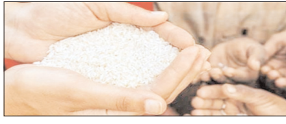
अनाज के ढेर पर बैठी भूखी दुनिया सम्पादकीय