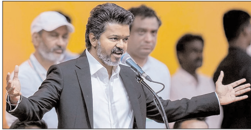
नौ अन्य मंत्री भी मंत्रिमंडल में शामिल, सभी ने तमिल भाषा में ईश्वर के नाम पर शपथ ग्रहण की

तमिलनाडु की राजनीति में एक नया अध्याय लिखते हुए, नवगठित पार्टी 'तमिलनाडु वेत्री कथगम' (टीवीके) के संस्थापक और अभिनेता-राजनेता सी. जोसेफ विजय ने रविवार को राज्य के 13वें मुख्यमंत्री के रूप में शपथ ली। उन्होंने इस राज्य में कई दशकों से शासन की बागडोर संभालने वाले दलों द्रविड़ मुनेत्र कथगम (द्रमुक) और अन्नाद्रमुक को हरा कर यह मुकाम हासिल किया। उन्होंने चुनाव में शानदार प्रदर्शन करते हुए इन दोनों पार्टियों के लगभग 60 साल पुराने एकाधिकार को समाप्त कर दिया। रविवार सुबह करीब दस बजे, जवाहरलाल नेहरू इंडोर स्टेडियम में आयोजित एक सादे समारोह