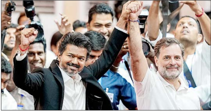
चेन्नई। जवाहरलाल नेहरू स्टेडियम में अपने शपथ ग्रहण समारोह के दौरान लोकसभा में विपक्ष के नेता राहुल गांधी के साथ हाथ मिलाते तमिलनाडु के नवनिर्वाचित मुख्यमंत्री (टीवीके) प्रमुख विजय।