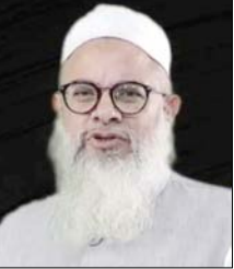
सकता। उन्होंने प्रधानमंत्री नरेंद्र मोदी से बंगाल के मुख्यमंत्री सुवेदु अधिकारी के पूर्व में दिए गए बयान का संज्ञान लेने की भी मांग की। क्योंकि वह सबका साथ, सबका विकास और सबका विश्वास का दावा करते हैं।