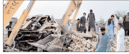
आत्मघाती हमले से दहला पाक, विस्फोटक से भरी गाड़ी चेकपोस्ट से टकराई