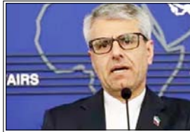
बकाई ने अपनी पोस्ट में 'हॉलीवुड फिल्म 'डा. स्ट्रेज़लव' का उल्लेख करते हुए अमेरिकी बयानबाजी का उदाहरण भी उड़ाया

तेहरान। इरान ने अमेरिका के राष्ट्रपति डोनाल्ड ट्रम्प की कथित परमाणु धमकी को बेतुकी और बेवकूफता का उदाहरण माना है। इरानी विदेश मंत्रालय ने कहा है कि यह टिप्पणी अमेरिका की कथित 'शांति की इच्छा' से मेल नहीं खाती है। इरान के विदेश मंत्रालय के प्रवक्ता इस्माइल बकाई ने सोशल मीडिया मंच एक्स पर कहा कि यह 'विकृत विडंबना' है कि अमेरिका एक ओर शांति और परमाणु संकट रोकने को बात करता है और दूसरी ओर 'एक बड़ी चमक' जैसी भाषा का इस्तेमाल कर सैन्य धमकी देता है। बकाई ने अपनी पोस्ट में 'हॉलीवुड फिल्म 'डा. स्ट्रेज़लव' का उल्लेख करते हुए अमेरिकी बयानबाजी का उदाहरण भी उड़ाया। यह प्रतिक्रिया ट्रम्प के उस बयान के बाद आई जिसमें उन्होंने कहा था कि यदि इरान के साथ युद्धविराम समाप्त होता है तो आपकी जानने की जरूरत नहीं पड़ेगी, बस इरान से उठती एक बड़ी चमक दिखाई देगी। उन्होंने यह भी कहा था कि इरान को समझौते पर जल्द हस्ताक्षर कर देने चाहिए, अन्यथा उसे 'काफी दर्द' झेलना पड़ेगा। इस बीच,