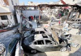
पिछले सप्ताह इजरायली हमलों में पूरे देश में 120 से अधिक लोग मारे गए जिनमें महिलाएं और बच्चे भी शामिल

बेरूत। लेबनान के स्वास्थ्य मंत्रालय ने कहा कि इजरायल द्वारा लेबनान में किए गए भीषण हमलों में 39 लोग मारे गए। यह जानकारी बीबीसी ने रविवार को दी। मंत्रालय ने कहा कि दक्षिणी शहर सकसाकियाह पर हुए एक इजरायली हमले में एक बच्चे सहित कम से कम सात लोग मारे गए।