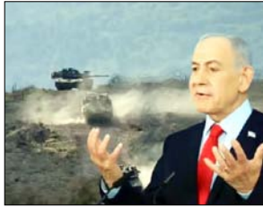
वॉल स्ट्रीट जर्नल का अमेरिकी अधिकारियों सहित अन्य स्रोतों के हवाले से खुलासा

तेहरान। इजरायली अधिकारियों ने इरान के खिलाफ हवाई हमले शुरू करने के लिए इराकी रिंगिस्तान में गुप्त सैन्य अड्डा स्थापित किया है। यह जानकारी रविवार को वॉल स्ट्रीट जर्नल ने अमेरिकी अधिकारियों सहित अन्य स्रोतों के हवाले से दी। स्रोतों के अनुसार, इजरायली सेना ने विशेष बलों को रखने के लिए एक टिकाना बनाया है। यह बेस इजरायली वायु सेना के लिए रसद केंद्र के रूप में भी काम करता है। स्रोतों का दावा है कि इस बेस की स्थापना इरान के खिलाफ सैन्य कार्रवाई शुरू होने के ठीक पहले हुई थी। प्रकाशन ने स्पष्ट किया कि वहां खोज और बचाव दल भी तैनात किए गए हैं ताकि विमान गिरने पर इजरायली पायलटों की तलाश की जा सके। एक अनाम स्रोत ने बताया कि इजरायली वायु सेना के विशेष बल, जिन्हें दुश्मन के इलाके में तोड़फोड़ की कार्रवाई का प्रशिक्षण दिया गया है, वे भी इस बेस पर तैनात हैं। स्रोतों ने वॉल स्ट्रीट जर्नल को बताया कि इराकी रिंगिस्तान में स्थित यह इजरायली बेस का पता लगभग मार्च में लगा था। अखबार ने अनाम इराकी सरकारी मीडिया का हवाला देते हुए