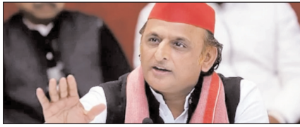
अखिलेश यादव ने योगी मंत्रिपरिषद विस्तार पर कसा तंज

नई दिल्ली, मुजफ्फरनगर, देहरादून, हल्द्वानी, मुरादाबाद, बरेली, मेरठ व लखनऊ से प्रकाशित