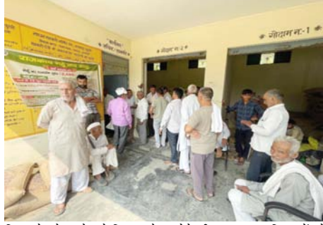
किसानों को 4 बोर के हिसाब से 500 बोर देने थे लेकिन केंद्र प्रभारी ने कुल 83 किसानों को ही खाद दिया और फिर खाद खतम