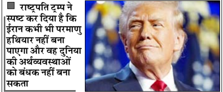
राष्ट्रपति ट्रम्प ने स्पष्ट कर दिया है कि ईरान कभी भी परमाणु हथियार नहीं बना पाएगा और वह दुनिया की अर्थव्यवस्थाओं को बंधक नहीं बना सकता।

वाशिंगटन/तेहरान। अमेरिकी राष्ट्रपति डोनाल्ड ट्रम्प ने पश्चिम एशिया में युद्ध को समाप्त करने के उद्देश्य से ईरान के जवाबी प्रस्ताव को सिरे से खारिज कर दिया और उसकी प्रतिक्रिया को 'पूरी तरह अस्वीकार्य' करार दिया है। ट्रम्प ने सोमवार को एक पोस्ट में लिखा कि मैंने अभी-अभी ईरान के तथाकथित 'प्रतिनिधियों' की प्रतिक्रिया पढ़ी है। मुझे यह पसंद नहीं आई-पूरी तरह अस्वीकार्य। यह फटकार ऐसे समय में आई है जब दोनों पक्ष (जो अप्रैल से बातचीत करने की कोशिश कर रहे हैं) ईरान के परमाणु कार्यक्रम और किसी भी संभावित युद्धविराम समझौते की शर्तों पर