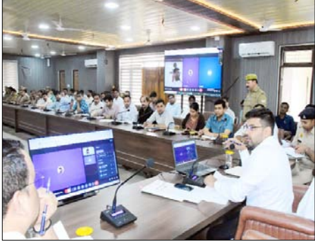
दृष्टि से एजेंडा बिंदु के अनुसार समीक्षा करते हुए उचित दिशा निर्देश देते हुए सड़क दुर्घटनाओं को रोकने के लिए जहाँ पर भी अधिक रोड एक्सीडेंट होते हैं उन स्थानों को पर विशेष रूप से सुधारात्मक कार्यवाही के निर्देश एनएचआई को दिए गए। बैठक में जिलाधिकारी ने यातायात की सुरक्षा की दृष्टि से शहर से निकलने वाले जंक्शन पर लाइट की व्यवस्था सुचारू रखने के निर्देश दिए।

शाह टाइम्स संवाददाता शामली। जिलाधिकारी की अध्यक्षता में आयोजित बैठक को में जिलाधिकारी ने सड़क सुरक्षा की दृष्टि से एजेंडा बिंदु के अनुसार समीक्षा करते हुए उचित दिशा निर्देश देते हुए सड़क दुर्घटनाओं को रोकने के लिए जहाँ पर भी अधिक रोड एक्सीडेंट होते हैं उन स्थानों को पर विशेष रूप से सुधारात्मक कार्यवाही के निर्देश एनएचआई को दिए गए। जिलाधिकारी शामली आलोक यादव की अध्यक्षता में कलेक्ट्रेट सभागार में जिला सड़क सुरक्षा समिति की बैठक आयोजित की गई। आयोजित बैठक में जिलाधिकारी ने संबंधित अधिकारियों से सड़क सुरक्षा की