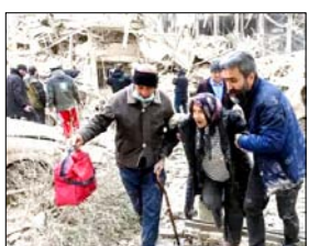
पश्चिम एशिया में युद्ध समाप्त करने के लिए ईरान का प्रस्ताव उदार और तार्किक

तेहरान। ईरान ने अमेरिका को दिए अपने जवाब में अमेरिकी शांति प्रस्ताव को यह कहते हुए खारिज कर दिया कि इसका मतलब अमेरिकी सरकार की अत्यधिक मांगों के आगे झुकना होगा। प्रेस टीवी की एक रिपोर्ट में यह जानकारी दी गई। ईरानी समाचार एजेंसी आईएसएनए ने पहले बताया था कि अमेरिकी संदेश पर ईरान की प्रतिक्रिया युद्ध समाप्त करने और फारस की खाड़ी और होर्मुज जलडमरूमध्य में जहाजों की सुरक्षा सुनिश्चित करने पर केंद्रित थी। अमेरिकी राष्ट्रपति डोनाल्ड ट्रम्प ने संघर्ष समाधान के लिए अमेरिकी प्रस्ताव पर ईरान की प्रतिक्रिया को पूरी तरह अस्वीकार्य बताया। प्रेस टीवी के अनुसार, ईरान की प्रतिक्रिया योजना में इस बात पर जोर दिया गया है कि अमेरिका को इस्तामिक गणराज्य को युद्ध क्षतिपूर्ति का भुगतान करना होगा। मुझे की शुरुआत में ईरानी विदेश मंत्रालय के एक प्रवक्ता ने कहा कि तेहरान को इस्तामिक गणराज्य के नए 14 सूत्री प्रस्ताव के संबंध में पाकिस्तान के माध्यम से अमेरिका से जवाब मिला है। ईरान की तत्सनीय समाचार एजेंसी ने रविवार को बताया कि अमेरिका के साथ बातचीत के लिए ईरान के प्रस्तावों का पाठ, जिसे तेहरान ने वाशिंगटन को भेजकर जवाब दिया था, में प्रतिबंध हटाने, होर्मुज जलडमरूमध्य पर ईरान का पूर्ण नियंत्रण और विदेशों में ईरानी संपत्तियों को मुक्त