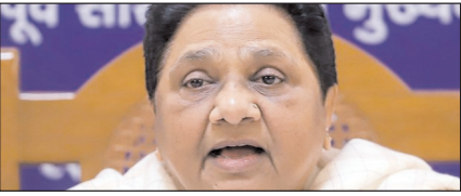
मंत्रिमंडल विस्तार का सकारात्मक असर आमजन के जीवन पर पड़े, तो बेहतर: माया पेज 2

नई दिल्ली, मुजफ्फरनगर, देहरादून, हल्द्वानी, मुगदाबाद, बरेली, मेरठ व लखनऊ से प्रकाशित