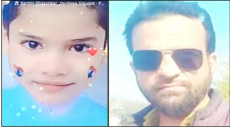
पुत्रियों सानिया और सबा के साथ बाइक से रिश्तेदारी में सिवाल खास गए थे। शाम करीब छह बजे परिवार वापस खतौली लौट रहा था। इसी दौरान जानी क्षेत्र में

खतौली। मेरठ के थाना जानी क्षेत्र में गंगनहर कांवेड पटरी मार्ग रविवार शाम उस समय चोख-पुकार से गूँज उठा, जब तेज रफ्तार कार ने बाइक सवार परिवार को टक्कर मार दी। हादसे में खतौली निवासी पिता और उनके मासूम बेटे की मौत पर ही मौत हो गई, जबकि दो बेटियाँ गंभीर रूप से घायल हो गईं। घटना के बाद खतौली के मोहल्ला इस्लामनगर में मातम पसरा हुआ है।