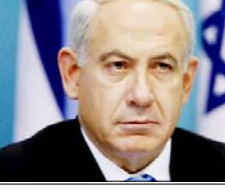
ईरान क्षेत्रीय प्रॉक्सी समूहों का समर्थन करना जारी रख रहा है और अपनी बैलिस्टिक मिसाइल क्षमताओं को बढ़ा रहा है।

तेल अवीव। इजरायल के प्रधानमंत्री बेंजामिन नेतन्याहू ने दोहराया है कि ईरान के साथ युद्ध तब तक 'खत्म नहीं होगा', जब तक कि प्रमुख रणनीतिक मुद्दों का समाधान नहीं हो जाता जिनमें ईरान के संघर्षित यूरेनियम के भंडार को हटाना, परमाणु केंद्रों को नष्ट करना और ईरान के क्षेत्रीय प्रभाव पर अंकुश लगाना शामिल है। सोबीएस न्यूज के कार्यक्रम '60 मिनट्स' को दिए साक्षात्कार में नेतन्याहू ने कहा कि यह अभी खत्म नहीं हुआ है, क्योंकि अब भी वहां परमाणु सामग्री और संघर्षित यूरेनियम मौजूद है। इसे ईरान से बाहर निकालना होगा। अब भी वहां संघर्षित केंद्र हैं, जिन्हें नष्ट करना बाकी है। उन्होंने कहा कि ईरान क्षेत्रीय प्रॉक्सी समूहों का समर्थन