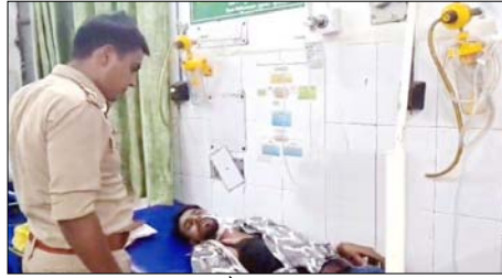
पुरानी रॉजिश सामने आ रही है। फिलहाल घटना की छानबीन शुरू कर दी। घायल के साथी का कहना है कि करीब 2 वर्ष पूर्व किसी बात को लेकर विवाद हुआ था और इस मामले में फैंसला हो गया था, लेकिन लोगों ने एक बार फिर घटना कर दी है।