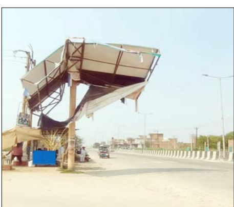
अलावा ऊन रोड कॉर्नर पर लगा एक बड़ा एडवर्टाइजमेंट बोर्ड भी तेज हवा के चलते टूटकर लटक गया है, जो कभी भी बड़ा हादसा होने का कारण बन सकता है। स्थानीय लोगों के अनुसार यह बोर्ड सड़क के किनारे खतरनाक स्थिति में लटक हुआ है और तेज हवा या बारिश के दौरान इसके गिरने का खतरा बना रहता है। ऐसे में यहां से गुजरने वाले दोपहिया और चारपहिया वाहन चालकों की सुरक्षा पर भी सवाल खड़े हो रहे हैं। स्थानीय नागरिकों ने प्रशासन और संबंधित विभाग से जल्द कार्रवाई करने की मांग की है। लोगों का कहना है कि यदि समय रहते बोर्डों को ठीक नहीं कराया गया तो किसी भी समय दुर्घटना हो सकती है। नागरिकों ने चेतावनी दी कि यदि समस्या का जल्द समाधान नहीं हुआ तो वे आंदोलन करने को मजबूर होंगे।

शाह टाइम्स संवाददाता थानाभवन। दिल्ली-सहारनपुर हाईवे स्थित थाना भवन-चरथावल बस स्टैंड मोड़ पर लगे सांकेतिक बोर्ड काफी समय से उखड़े पड़े हैं, लेकिन संबंधित विभाग की ओर से अब तक उन्हें दुरुस्त कराने की दिशा में कोई कदम नहीं उठाया गया है। इससे क्षेत्र के लोगों में नाराजगी बढ़ती जा रही है। स्थानीय नागरिकों का कहना है कि हाईवे पर लगे सांकेतिक बोर्ड वाहन चालकों के लिए दिशा-निर्देशन का महत्वपूर्ण माध्यम होते हैं, लेकिन बोर्ड उखड़ जाने के कारण बाहर से आने वाले यात्रियों और वाहन चालकों को भारी परेशानी का सामना करना पड़ रहा है। इसके