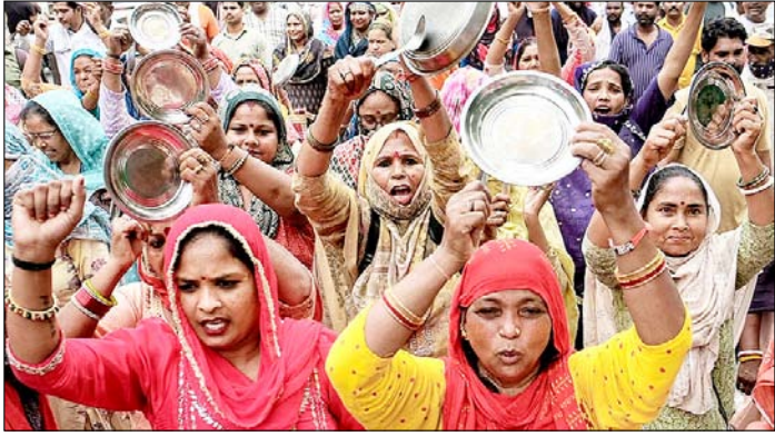
गुरुग्राम। हरियाणा में राज्य सरकार के खिलाफ अपनी मांगों के समर्थन में आयोजित विरोध रैली के दौरान गुरुग्राम नगर निगम (एमसीजी) के कर्मचारी बर्तन बजाते हुए।

ईयू जलद यूक्रेन को 90 अरब यूरो के कर्ज की पहली किस्त जारी करेगा ब्रुसेल्स। यूरोपीय संघ (ईयू) की कमिश्नर फॉर इनलार्जमेंट मार्टा कोस ने सोमवार को कहा कि अगले सप्ताह संघ यूक्रेन को 90 अरब यूरो (105.7 अरब अमेरिकी डॉलर) के कर्ज पैकेज की पहली किस्त जारी करेगा। सुकोस ने कहा कि हम सही रास्ते पर हैं और मुझे उम्मीद है कि अगले सप्ताह हम पहली किस्त जारी कर पाएंगे। ईयू के सदस्य देशों ने 23 अप्रैल को यूक्रेन के लिए 90 अरब यूरो के कर्ज पैकेज को औपचारिक रूप से मंजूरी दी थी। यूरोपीय परिषद के अध्यक्ष एटोरियो कोस्टा ने पहले कहा था कि यूक्रेन को इस कर्ज को तभी चुकाना होगा, जब उसे रूस से हजाने की रकम मिलेगी।