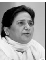
-श्री मायावती अध्यक्ष, बहुजन समाज पार्टी

मंत्रिमंडल का घटना-बढ़ाना और विस्तार सत्तारूढ़ दल का आंतरिक राजनीतिक विषय होता है, इसलिए इस पर ज्यादा टिप्पणी करना उचित नहीं है, लेकिन इसका असर आमजन, खासकर गरीबों, मजदूरों, किसानों, युवाओं और महिलाओं के जीवन पर सकारात्मक रूप से दिखना चाहिए, सरकार और मंत्रियों के कामकाज में समाज के हर वर्ग, विशेषकर कमजोर तबकों की जान-माल और महत्व की सुरक्षा सुनिश्चित होती दिखाई देनी चाहिए, यदि ऐसा नहीं हुआ, तो लोग इसे केवल राजनीतिक जुगाड़ और सरकारी संसाधनों पर बढ़ा बोझ मानेंगे।