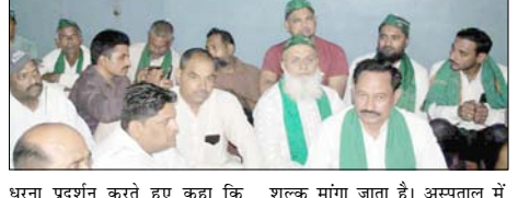
धरना प्रदर्शन करते हुए कहा कि स्वास्थ्य कर्मियों का व्यवहार मरीजों के तीमारदारों के प्रति सही नहीं है। अस्पताल में चिकित्सक समय पर नहीं मिलते हैं। रेबीज के टीके वाली सिरिंज बाहर से मंगाई जाती है। डिलीवरी करने वाली महिलाओं से सुविधा