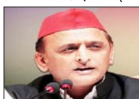
■ भाजपाई अपनी कमाई के स्वर्णकरण में लगे

बीजेपी पर सपा मुखिया अखिलेश यादव ने बोला तीखा हमला शाह टाइम्स ब्यूरो लखनऊ। उत्तर प्रदेश के पूर्व मुख्यमंत्री और समाजवादी पार्टी के राष्ट्रीय अध्यक्ष अखिलेश यादव ने भारतीय जनता पार्टी पर तीखा हमला बोलते हुए सोमवार को कहा कि चुनाव खत्म होते ही सरकार को 'संकट' याद आ गया। उन्होंने कहा कि देश के लिए सबसे बड़ा संकट भाजपा ही है और केंद्र सरकार की हालिया अपीलें उसकी आर्थिक व नीतिगत विफलताओं को उजागर करती हैं। सपा प्रमुख ने कहा कि यदि इतनी पाबंदियां लगानी पड़ रही हैं, तो पांच ट्रिलियन डॉलर की जुमलाई अर्थव्यवस्था कैसे बनेगी। आरोप लगाया कि भाजपा सरकार के हाथ से आर्थिक व्यवस्था की लगाम छूट चुकी है। डॉलर लगातार मजबूत हो रहा है और रुपया कमजोर होता जा रहा है। यादव ने सोने की खरीद को लेकर सरकार को अपील पर भी कटाक्ष किया। जनता तो वैसे भी डेढ़ लाख तोले का सोना खरीदने की स्थिति में नहीं है, बल्कि भाजपा के लोग ही अपनी काली कमाई का स्वर्णकरण करने में लगे हैं। इसकी जानकारी लखनऊ से लेकर गोरखपुर और अहमदाबाद से लेकर गुवाहाटी तक ली जा सकती है।