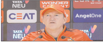
अश्लील भाषा के इस्तेमाल पर आरसीबी के कोच एंडी फ्लोवर पर लगा जुर्माना खेल टाइम्स