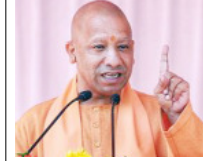
■ भारत की चेतना में बसता है सनातन और चेतना अजर-अमर है सोमनाथ देश की जड़ों को जोड़ने का प्रयास