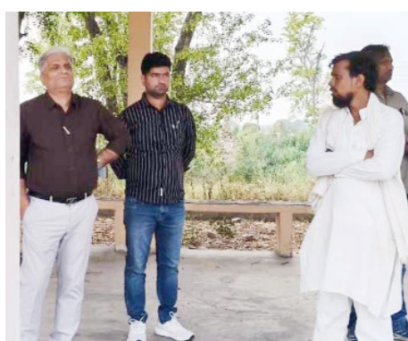
इसके साथ ही उन्होंने टूटी हुई फर्श की मरम्मत शीघ्र कराने,

सचिव को कड़ी फटकार लगाते हुए कहा कि सार्वजनिक और संवेदनशील स्थलों की देखभाल में किसी भी प्रकार की लापरवाही बर्दाश्त नहीं की जाएगी। उन्होंने कहा कि अंत्येष्टि स्थल ग्रामीणों की भावनाओं से जुड़ा स्थान होता है, ऐसे में वहां स्वच्छता और सुव्यवस्थित व्यवस्था होना अत्यंत आवश्यक है। लेकिन निरीक्षण के दौरान वहां की स्थिति बेहद खराब पाई गई, जिससे प्रशासनिक लापरवाही स्पष्ट रूप से सामने आई। उन्होंने ग्राम सचिव को स्पष्ट निर्देश दिए कि पूरे परिसर में तत्काल प्रभाव से साफ-सफाई अभियान चलाया जाए और हर कोने को स्वच्छ बनाया जाए।