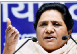
■ मामला ताकत की बजाय कानूनी तरीके से सुलझाए

शाह टाइम्स ब्यूरो लखनऊ। बहुजन समाज पार्टी अध्यक्ष मायावती ने सहारनपुर जिले के लालवाला गांव में हुई हिंसा पर चिंता जताते हुए निष्पक्ष कार्रवाई की मांग की है। सुश्री मायावती ने सोमवार को एक्स पर लिखा, सहारनपुर के एक गांव में एक भूमि पर मूर्ति रखने को लेकर दो पक्षों के बीच विवाद हुआ, जो बाद में संघर्ष में बदल गया। उन्होंने आरोप लगाया कि इस घटना में दलित समाज के कई लोग घायल हुए हैं। बसपा अध्यक्ष ने पुलिस और प्रशासन से मामले में तत्काल तथा निष्पक्ष कार्रवाई करने की मांग करते हुए कहा कि प्रशासन को हालात पर पूरी तरह नियंत्रण रखते हुए शांति व्यवस्था बनाए रखने के लिए प्रभावी कदम उठाने चाहिए। बसपा सुप्रीमो ने दोनों पक्षों से भी संयम बरतने और आपसी सौहार्द बनाए रखने की अपील की। उन्होंने कहा कि मामले को तत्काल के बजाय कानूनी तरीके से सुलझाया जाना चाहिए, ताकि क्षेत्र में तनाव न बढ़े और शांति कायम रह सके। गौरतलब है कि सहारनपुर के देवबंद क्षेत्र के लालवाला गांव में 9-10 मई को लगभग दो बीघा जमीन पर कब्जे और कथित तौर पर महाराणा प्रताप की मूर्ति लगाने को लेकर दो समुदायों के बीच हिंसक झड़प हुई। पत्थरबाजी और लाठीचार्ज में तीन महिलाओं समेत आठ लोग घायल हो गए। पुलिस ने घटना के बाद गांव में सुरक्षा बलों को तैनात कर निगरानी बढ़ा दी है। प्रशासनिक अधिकारी स्थिति पर नजर बनाए हुए हैं।