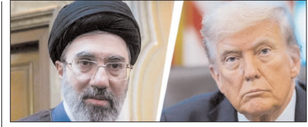
ईरान ने अमेरिकी योजना को किया खारिज पेज 12