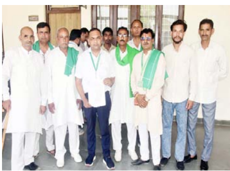
नहीं की गई तो ग्रामीणों को भारी परेशानी का सामना करना पड़ सकता है। किसान यूनियन पदा. धिकारियों ने जिलाधिकारी से मामले की जांच कराते हुए मिट्टी खनन पर रोक लगाने तथा