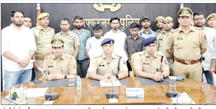
कैप्सूल पकड़े जा रहे हैं।

मुजफ्फरनगर। इसान इसान के जीवन से खिलवाड़ करने में लगा हुआ है कही नशीली दवाई व इंजेक्शन बेचकर नई पीढ़ी को मौत के मुँह में धकेला जा रहा है तो कही खाद्य पदार्थ में मिलाकर खोरी का धंधा फलफूल कर रहा है। इतना ही नहीं नकली और प्रतिबंधित दवाइयों को कुछ बाजारों में बेचा जा रहा है जिससे साफ हो रहा है कि अधिक धन कमाने के लिए मनुष्य ही मनुष्य की जान का दुश्मन बना हुआ है, हालांकि इन सभी में चाहे वो खाद्य पदार्थ हो, चाहे नकली दवाई हो चाहे प्रतिबंधित दवाई ही क्यों ना हो, अधिक पैसा कमाने के लिए यह सब कुछ किया जा रहा है इस तरह के मामलों में पुलिस काफी लोगों को जेल भेज चुकी है, लेकिन इसके बावजूद भी कानून का खौफ शायद लोगों के दिल में नहीं है। नकली और प्रतिबंधित दवाइयों, मिलावटी खाद्य पदार्थ के पीछे बड़े-बड़े कारोबारी के नाम भी सामने आ चुके हैं कुछ दिन के लिए पुलिस प्रशासन व संबंधित विभाग कुछ दिन ही शिकंजा कसता है, लेकिन कुछ समय बाद फिर वही चीजे बाजार में उतरा दी जाती हैं। सोमवार को भी एसएसपी की टीम ने 40 लाख से अधिक के प्रतिबंधित कैप्सूल बरामद कर कई लोगों को सलाखों