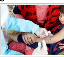
■ देश में खसरे के पुष्ट और संदिग्ध मामलों की कुल संख्या 60 हजार से अधिक हो गई है

बाका। बांग्लादेश में खसरे का प्रकोप गंभीर होता जा रहा है, इस बीमारी से मरने वालों की संख्या बढ़कर 432 हो गई है। स्थानीय मीडिया रिपोर्टों के अनुसार, पिछले 24 घंटों में कम से कम आठ और लोगों की मौत हुई है।