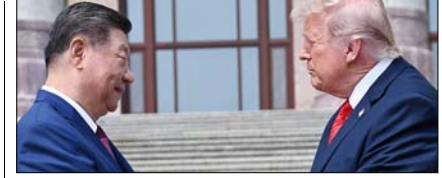
ताइवान पर चीन की अमेरिका को सख्त चेतावनी