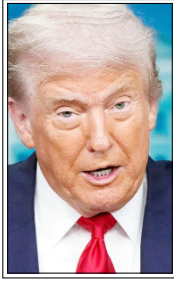
■ ट्रम्प के साथ विदेश मंत्री मार्को रुबियो, ट्रेजरी सिक्रेटरी स्कॉट बेसेंट और रक्षा मंत्री पीट हेगसेथ भी चीन पहुंचे हैं

वाशिंगटन। चीन ताइवान को अपना हिस्सा मानता है, जबकि अमेरिका ताइवान को हथियार देने की तैयारी कर रहा है। ट्रम्प प्रशासन ने ताइवान के लिए 11 अरब डॉलर के हथियार पैकेज को मंजूरी दी है, हालांकि उसकी डिलीवरी अभी शुरू नहीं हुई है। ताइवान दुनिया में चिप निर्माण का बड़ा केंद्र है और आर्टिफिशियल इंटेलिजेंस उद्योग के लिए बेहद महत्वपूर्ण माना जाता है। ट्रम्प अमेरिका में चिप उत्पादन बढ़ाने के लिए ताइवान के साथ व्यापारिक सहयोग मजबूत करना चाहते हैं। इसी सिलसिले में एनवीडिया के सीओओ जेन्सेन हुआंग भी अमेरिकी प्रतिनिधिमंडल का हिस्सा बने हैं। ट्रम्प के साथ विदेश मंत्री मार्को रुबियो, ट्रेजरी सिक्रेटरी स्कॉट बेसेंट और रक्षा मंत्री पीट हेगसेथ भी चीन पहुंचे हैं। इसके अलावा टेक, रक्षा, कृषि और वित्त क्षेत्र के कई बड़े कारोबारी भी प्रतिनिधिमंडल में शामिल हैं।