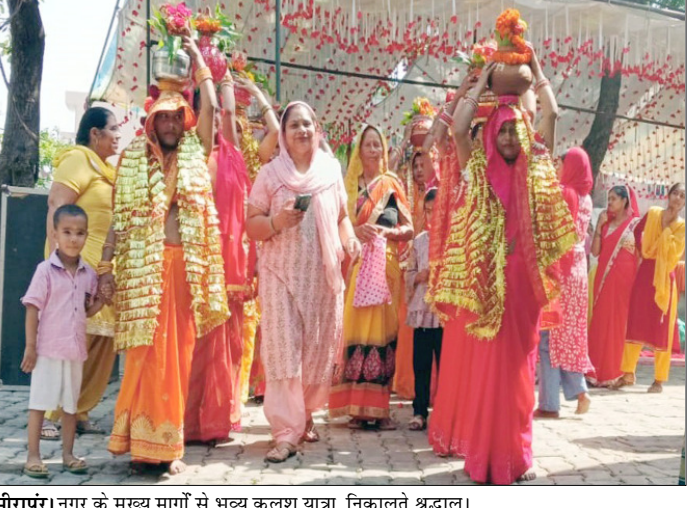
मीरापुर। नगर के मुख्य मार्गों से भव्य कलश यात्रा निकालते श्रद्धालु।