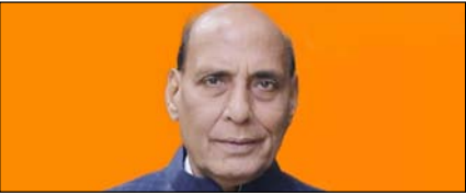
रक्षा विनिर्माण के क्षेत्र में आत्मनिर्भरता जरूरी: राजनाथ सिंह

नई दिल्ली, मुजफ्फरनगर, देहरादून, हल्द्वानी, मुतादाबाद, बरौली, मेरठ व लखनऊ से प्रकाशित