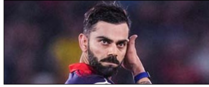
ऑरेंज कैप टेबल में तीसरे नंबर पर पहुंचे विराट कोहली