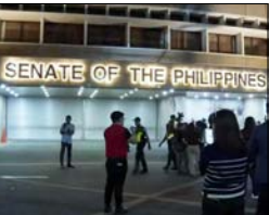
■ फिलीपींस के राष्ट्रपति फर्डिनेंड मार्कोस जूनियर ने देर रात जारी वीडियो में कहा कि इस घटना में सरकार का कोई हाथ नहीं