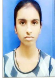
छात्र-छात्राओं को बधाई दी।