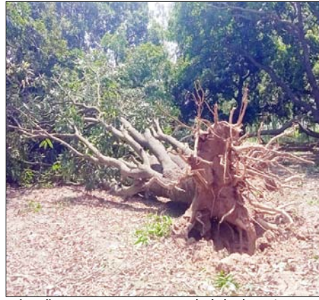
कई वर्षों बाद इतना भयंकर आंधी-तूफान देखने को मिला है, जिसने पूरे क्षेत्र में तबाही का मंजर खड़ा कर दिया।

वहीं आम के बागों में भी तूफान ने भारी नुकसान पहुंचाया। तेज हवाओं के चलते बड़ी मात्रा में कच्चे आम जमीन पर गिर गए, जिससे बाग मालिकों और ठेकेदारों को लाखों रुपये के नुकसान की आशंका जताई जा रही है। कई स्थानों पर बड़े-बड़े आम के वृक्ष भी जड़ से उखड़ गए। ग्रामीणों का कहना है कि पिछले कई वर्षों बाद इतना भयंकर आंधी-तूफान देखने को मिला है, जिसने पूरे क्षेत्र में तबाही का मंजर खड़ा कर दिया।