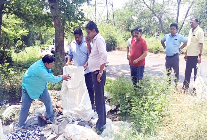
खतौली: बरामद सरकारी दवाइयों को अपने कब्जे में लेते विभाग के अधिकारी।