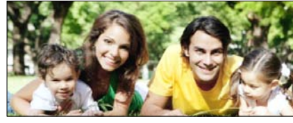
सामाजिकता की सबसे बड़ी कुंजी है परिवार