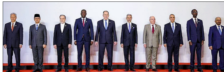
संस्थागत सुधारों पर केंद्रित संघर्ष में अतिरिचितता का सामना कर रही है। इसके पीछे सशस्त्र संघर्ष, जलवायु संकट और आर्थिक संकट का सामना कर रही है। इसके पीछे सशस्त्र संघर्ष, जलवायु संकट और आर्थिक संघर्ष का सामना कर रही है। इसके पीछे सशस्त्र संघर्ष, जलवायु संकट और आर्थिक संघर्ष का सामना कर रही है।

नई दिल्ली। भारत ने कहा है कि बढ़ते भू-राजनीतिक तनाव, आर्थिक अस्थिरता और कमजोर होती बहुपक्षीय संस्थाएं वैश्विक व्यवस्था को अधिक नाजुक बना रही हैं और ब्रिक्स देशों को स्थिरता तथा वैश्विक शासन व्यवस्था में सुधार के लिए एकजुट होकर कदम उठाने चाहिए।