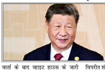
■ चीन के राष्ट्रपति ने कहा: अमेरिका-चीन के बीच टकराव का कारण बन सकता है ताइवान

बीजिंग। चीन के राष्ट्रपति शी जिनपिंग ने बीजिंग में हुई द्विपक्षीय वार्ता के दौरान अमेरिका को राष्ट्रपति डोनाल्ड ट्रम्प को चेतावनी दी है कि ताइवान मुद्दे पर किसी भी प्रकार की गलत रणनीति दोनों देशों को 'संघर्ष' की ओर धकेल सकती है। गुरुवार को महाशक्ति शिखर सम्मेलन के तहत हुई बैठक में ट्रम्प ने शी को 'महान नेता' और 'मित्र' बताते हुए कहा कि दोनों देशों का 'भविष्य शानदार' होगा।