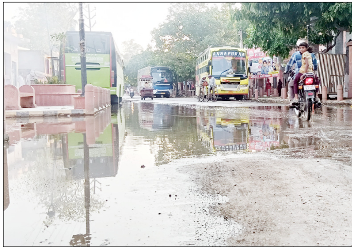
मोरना। शुक्रताल के मुख्य मार्ग पर गंदगी और जलभराव से हर कोई परेशान।