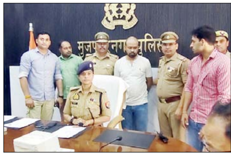
ठगी की जिसमें पुलिस ने आरोपी को गिरफ्तार कर लिया। गंभीर बात यह है कि इस तरह के कई मामले ऐसे सामने आ चुके हैं जिसमें पढ़े लिखे युवक व छात्र साइबर ठगी के अपराध में आरोपी पाए जा रहे हैं।

शाह टाइम्स संवाददाता मुजफ्फरनगर। यूपी के अन्य जनपद के थानों के साथ-साथ जनपद मुजफ्फरनगर में भी साइबर ठगी का अपराध जोर पकड़ रहा है। पुलिस भले ही अपराधियों को सलाखों के पीछे डाल रही है, लेकिन ठगों के मामले नहीं रूक रहे। शुरुवार को भी एसपी क्राइम के नेतृत्व में साइबर ठगी का मामला का खुलासा किया गया। आरोपी ग्रेजुएट है और उसने व्यापारियों को एनईएफटी भुगतान का फर्जी प्रमाण दिखाकर सामान लिया। और इसी तरह लाखों की