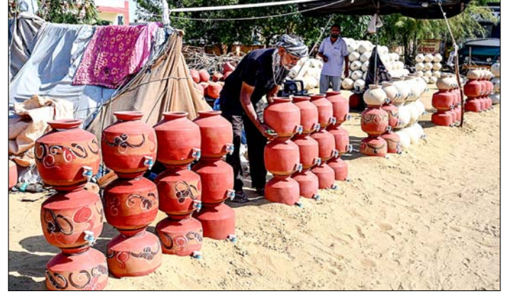
बीकानेर। राजस्थान में गर्मी के दिनों में मिट्टी के बर्तनों को बिछी के लिए सजाता विकला।

तेहरान। ईरान की लगभग नौ करोड़ की आबादी पिछले दो महीनों से इंटरनेट पर भारी पाबंदियों का सामना कर रही है। यह 'ब्लैकआउट' दुनिया के सबसे लंबे और सख्त प्रतिबंधों में से एक बन गया है, जिसने देश की ऑनलाइन अर्थव्यवस्था को पूरी तरह तबाह कर दिया है। इंटरनेट बंद होने का सबसे बुरा असर छोटे और मध्यम उद्योगों पर पड़ा है। फेशन, फिटनेस, विज्ञापन और खुदरा व्यापार जैसे क्षेत्रों से जुड़े कारोबारियों की आय पूरी तरह खत्म हो गई है। गौरतलब है कि ईरान की ऑनलाइन अर्थव्यवस्था ने लंबे समय तक सरकारी पाबंदियों और अंतर्राष्ट्रीय प्रतिबंधों के बावजूद खुद को संभाले रखा था लेकिन अब यह चरमर गइ है। अमेरिका और इजरायल के साथ हुए अस्थिर और नाजुक समझौते के बावजूद, ईरान के शासकों ने इंटरनेट सेवा बहाल करने से इनकार कर दिया है।