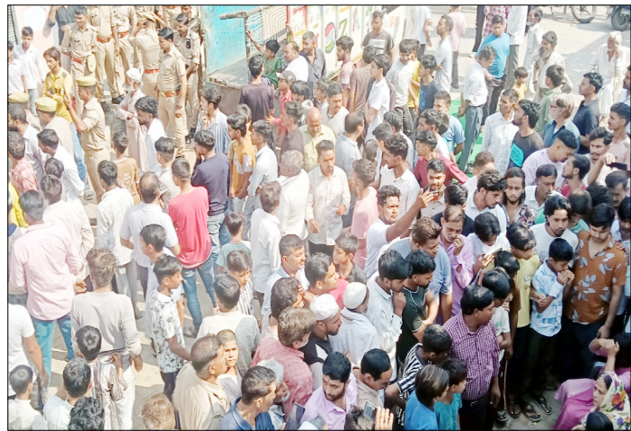
मोरना: घटना से आक्रोशित ग्रामीण धरना प्रदर्शन करते हुए।