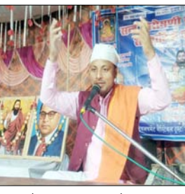
ले जाता है। जो हमें ज्ञान देता है वह पूजनीय है। उन्होंने कहा कि गुरु