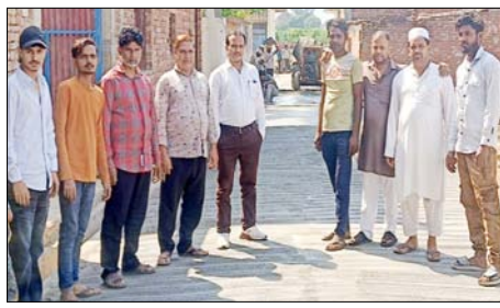
जानसठ। नवनिर्मित सड़क का अवलोकन करते क्षेत्रवासी।

दिए। नोटिस में स्पष्ट निर्देश दिए गए हैं कि एक सप्ताह के भीतर खर्च की गई धनराशि का मदवार ब्यौर प्रमाण सहित उपलब्ध कराए या फिर रिकवरी की पूरी राशि सरकारी खाते में जमा करें। ऐसा न करने पर संबंधित सचिव और प्रधानों के खिलाफ विभागीय कार्रवाई की जाएगी। विभाग ने चेतावनी दी है कि रिकवरी जमा न करने वाले प्रधानों को अनापत्ति प्रमाण पत्र जारी नहीं किया जाएगा। एनओसी न मिलने की स्थिति में वे आगामी पंचायत चुनाव लड़ने से वंचित हो सकते हैं। सचिवों के खिलाफ भी सेवा संबंधी कार्रवाई अमल में लाई जाएगी।