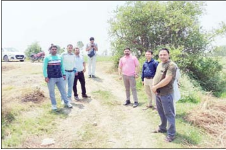
करने के निर्देश पूर्व में ही जारी किए गए थे, जिसके फलस्वरूप सर्वे कार्य सुचारु रूप से पूर्ण हुआ।