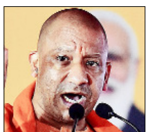
श्रमवीर गौरव कार्यक्रम में बोले सीएम पहले होता था श्रमिकों का शोषण, अब नहीं

शाह टाइम्स ब्यूरो लखनऊ। अंतर्राष्ट्रीय मजदूर दिवस के अवसर पर मुख्यमंत्री योगी आदित्यनाथ ने श्रमिकों के हितों को लेकर सख्त रुख अपनाते हुए फैक्ट्री मालिकों और ठेकेदारों को स्पष्ट चेतावनी दी। उन्होंने कहा कि अब श्रमिकों से काम लेकर धुगतान में टालमटोल या कटौती बर्दाश्त नहीं की जाएगी। उन्होंने कहा कि यदि श्रमिक न काम किया है, तो उसे उसका पूरा दाम मिलना ही चाहिए, अन्यथा सरकार सख्त कार्रवाई करेगी। लखनऊ स्थित इंदिरा गांधी प्रतिष्ठान में आयोजित 'श्रमवीर गौरव कार्यक्रम' को संबोधित करते हुए मुख्यमंत्री ने