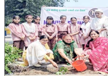
हमारे सच्चे मित्र हैं। ये बिना कुछ मांगे हमें जीवनदायिनी ऑक्सीजन, फल, फूल व छाया देते हैं। पर्यावरण संरक्षण हमारे जीवित रहने की पहली शर्त है। उन्होंने लोगों से अपील की कि अपने जन्म दिन, सालगिरह या जीवन के हर विशेष अवसर पर एक पौधा जरूर लगाएं। जब तक धरती हरी भरी है तभी तक मानव का अस्तित्व सुरक्षित है। यहां