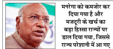
मनरेगा को कमजोर कर दिया गया है और मजदूरी के खर्च का बड़ा हिस्सा राज्यों पर डाल दिया गया, जिससे राज्य परेशानी में आ गए

कांग्रेस अध्यक्ष मल्लिकार्जुन खड़गे ने महात्मा गांधी राष्ट्रीय ग्रामीण रोजगार गारंटी योजना (मनरेगा) को फिर से शुरू करने और श्रमिकों के लिए न्यूनतम मजदूरी बढ़ाने की मांग की है। खड़गे ने शूक्रवार को सोशल मीडिया एक्स पर लिखा कि बढ़ती बेरोजगारी सरकार की नीतियों का परिणाम है और सरकार ने जो श्रम संहिता लागू की है उससे कामगारों की स्थिति कमजोर हुई है। इसके अलावा ठेका श्रमिक व्यवस्था तथा 'हायर एंड फायर' जैसी नीतियों का बढ़ावा दिया गया है। उन्होंने कहा कि इन श्रम कानूनों की समीक्षा की जानी चाहिए। कांग्रेस अध्यक्ष ने कहा कि मनरेगा को कमजोर कर दिया गया है और मजदूरों के खर्च का बड़ा हिस्सा राज्यों पर डाल दिया गया है, जिससे राज्यों