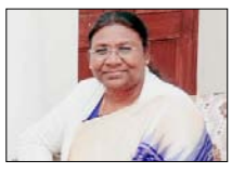
प्रशिक्षण से संबंधित विषयों पर की चर्चा