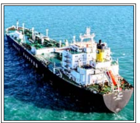
शांति के प्रयासों को झटका यूईई बोला: होर्मुज के मुद्दे पर ईरान पर नहीं किया जा सकता है: भरोसा

लंदन/दुबई। पश्चिम एशिया में बढ़ते तनाव के कारण रणनीतिक होर्मुज जलडमरूमध्य से जहाजों की आवाजाही में भारी कमी आई है। समुद्री सुरक्षा अधिकारियों के आकलन के अनुसार, संघर्ष शुरू होने के बाद से यातायात 90 फीसदी से अधिक घट गया है। यह गिरावट अमेरिका और इजरायल के ईरान पर हमलों तथा तेहरान की जवाबी कार्रवाई के बाद हुई है।