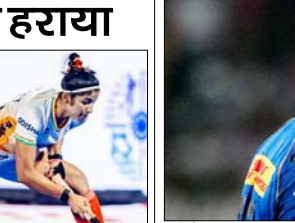
जौत पर मुहर लगा दी। यह जीत भारतीय टीम के लिए एक कड़े मुकामले वाली सीरीज का शानदार अंत साबित हुई, जिससे टीम को इस महीने के आखिर में जापान में शुरू होने वाले अंडर-18 एशिया कप के लिए अच्छी तैयारी करने का मौका मिला।