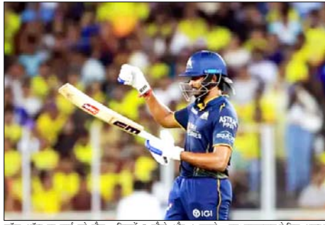
लॉन-ऑफ पर शार्द को कैच थाम बैठे। सुदर्शन ने 53 गेंदों में 84 रन का बहतरीन पारो खेले, जिसमें 7 चौके और 4 छक्के शामिल हैं। इसके बाद तबतला बिना खाता खेले रन आउट हो गए। गायकबाड़ ने मिड-आफ से शानदार ड्राइवकर रिट लगाकर उन्हें पवेलियन भेजा। हालांकि,

जवाब में लक्ष्य की पीछा करने उतरी चेन्नई की खराब शुरूआत, 31 रन पर तब तक विकेट खोए अहमदाबाद, वार्ता। आईपीएल 2026 का 66वां मुक. तबला गुजरात टाइटंस और चेन्नई सुपर किंग्स के बीच खेला जा रहा है। चेन्नई ने अहमदाबाद के नरेंद्र मोदी स्टेडियम में टॉस जीतकर पहले बलिंग का फैसला किया है। गुजरात ने 19 ओवर के बाद एक विकेट के नुकसान पर 216 रन बना लिए हैं। शुभमन गिल 64 रन बनाकर आउट हुए। 19वें ओवर में कंबाज के ओवर में 15 रन आए, लेकिन चेन्नई ने दो अहम विकेट भी खोए। ओवर की पहली गेंद पर सुदर्शन ने शानदार छक्का जड़ा, लेकिन अगली ही गेंद पर वह बड़ा शट खेलने के प्रयास में