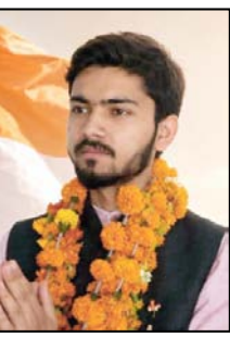
आज देश जिस डिजिटल भारत की ओर बढ़ रहा है, उसकी मजबूत नींव राजीव गांधी ने ही रखी थी। उन्होंने युवाओं को राजनीति और देश निर्माण से जोड़ने का कार्य किया। उन्होंने कहा कि पंचायती