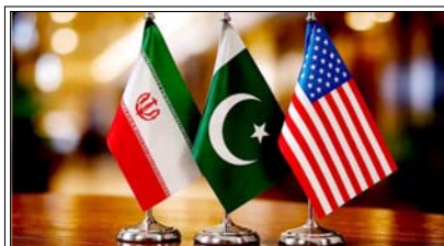
ईरान अमेरिका के साथ अच्छी नीयत से बातचीत कर रहा है, लेकिन उसे अमेरिका पर अब भी गहरा शक है: बघाई

तेहरान। अमेरिका ने पश्चिम एशिया संघर्ष को स्थाई रूप से खत्म करने के लिए पाकिस्तान के जरिये नया युद्धविराम प्रस्ताव भेजा है। अल अरबिया की रिपोर्ट के मुताबिक, इस मामले से जुड़े कूटनीतिक सूत्रों ने यह जानकारी दी है। ईरान इस प्रस्ताव की समीक्षा कर रहा है, लेकिन अब तक उसने कोई आधिकारिक जवाब नहीं दिया है। दोनों पक्षों के बीच मतभेद कम करने के लिए मध्यस्थता कोशिश कर रहे हैं। इसी बीच, पाकिस्तान के सेना प्रमुख आसिम मुनीर ने ईरान यात्रा का प्लान बनाया है। इससे पहले ईरान के विदेश मंत्रालय के प्रवक्ता इस्माइल बघाई ने कहा था कि ईरान अमेरिका के साथ अच्छी नीयत से बातचीत कर रहा है, लेकिन उसे अमेरिका पर अब भी गहरा शक है। ईरान के सरकारी मीडिया प्रेस टीवी के मुताबिक, बघाई ने कहा कि ईरान को उसके 14 सूत्रीय प्रस्ताव पर अमेरिका का जवाब मिल गया है और उसकी समीक्षा की जा रही है। उन्होंने बताया कि पाकिस्तान के गृह मंत्री मोहसिन नकवी की तेहरान यात्रा का मकसद दोनों पक्षों के बीच बातचीत को आसान बनाना है। बघाई ने कहा कि इस समय हमारी प्राथमिकता लेबनान समेत सभी मोर्चों पर युद्ध खत्म करना है। ईरान ने अपनी मुख्य मांगों में जमा फंड जारी करने, समुद्री रास्तों में कथित