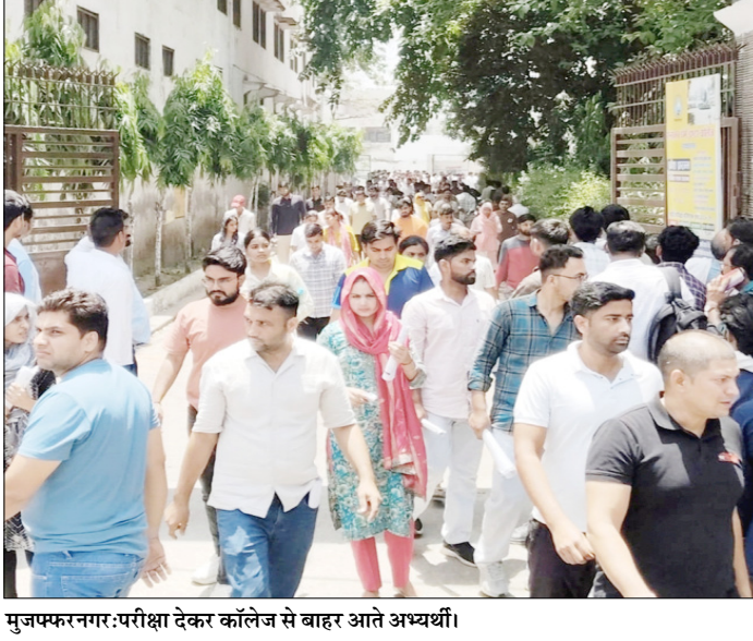
मुजफ्फरनगर: परीक्षा देकर कॉलेज से बाहर आते अभ्यर्थी।

बताया कि 1359 अभ्यर्थी अनुपस्थित रहे और परीक्षा पूरी तरह निष्पक्ष, पारदर्शी, शांतिपूर्वक एवं नकलविहीन हुई। इस दौरान कुछ अभ्यर्थियों ने एक सिपाही पर गंभीर आरोप लगाते हुए उसकी जांच कराने की मांग भी की। अभ्यर्थियों ने इसकी शिकायत कॉलेज प्रशासन से करते हुए निष्पक्ष जांच की मांग की। अभ्यर्थियों का कहना था कि एक सिपाही परीक्षा के दौरान संदिग्ध दिखाई पड रहा था। उन्होंने सिपाही पर गंभीर आरोप जड़े है।