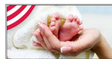
नागरिकता हासिल कर ले। साउथ कैरोलिना की सांसद मेस ने सोशल मीडिया पर बयान जारी करते हुए कहा कि उन्होंने लंबे समय से लंबित संवैधानिक संशोधन पेश किया है। उन्होंने तर्क दिया कि अमेरिका के राष्ट्रपति और उपराष्ट्रपति बनने के लिए पहले से ही नेचुरल बॉर्न सिटिजन यानी जन्म से अमेरिकी नागरिक होना जरूरी है, इसलिए यही नियम कांग्रेस, संघीय अदालतों और सीनेट से मंजूर

वाशिंगटन। अमेरिका में प्राकृतिक रूप से नागरिकता हासिल करने वाले लोगों के अधिकारों को लेकर नई बहस छिड़ गई है। रिपब्लिकन सांसद नैन्सी मेस ने एक संवैधानिक संशोधन प्रस्ताव पेश किया है, जिसमें प्राकृतिक रूप से अमेरिकी नागरिक बने लोगों को कांग्रेस सदस्य, संघीय न्यायाधीश और सीनेट की पुष्टि वाले महत्वपूर्ण पदों पर नियुक्त होने से रोकने की मांग की गई है। इस प्रस्ताव को लेकर डेमोक्रेटिक नेताओं ने तीखी प्रतिक्रिया दी है और इसे नस्लवादी, घृणित और विधेय मूल के लोगों के खिलाफ बताया है। प्राकृतिक रूप से नागरिकता का मतलब है कि कोई व्यक्ति जन्म से उस देश का नागरिक न हो, लेकिन बाद में कानूनी प्रक्रिया पूरी करके उस देश की