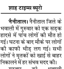
गिरी। कार में सवार पांच लोगों की मौत पर ही मौत हो गई। मृतकों में मूल रूप से खटीमा निवासी पति-पत्नी और उनके दो बच्चों

समेत यूपी के लखनऊ निवासी चालक शामिल था। जानकारी के मुताबिक इलेक्ट्रिक महिंद्रा कार (यूपी-32-क्यूक्यू 1874) ढैला