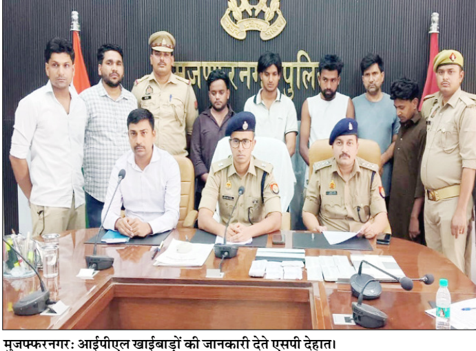
मुजफ्फरनगर: आईपीएल खाईबाड़ी की जानकारी देते एसपी देहात।