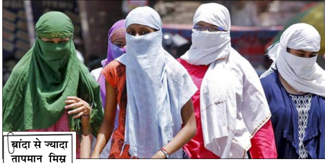
बांदा से ज्यादा तापमान मिस्त्र के असवान में 49.4 डिग्री और सऊदी के अराफात में 48.4 डिग्री सेल्सियस रहा

दुनियाभर में सबसे ज्यादा तापमान वाले टॉप-5 शहरों में खजुराहो 47.4 डिग्री सेल्सियस के साथ चौथे नंबर पर रहा। इधर, बलरामपुर में भीषण गर्मी के कारण कस्तूरबा गांधी आवासीय विद्यालय में पढ़ाई के दौरान 8 छात्राएं बेहोश हो गईं। सभी को उल्टी, निरर्द्र और बेहोशी जैसी शिकायतें-शेष पृष्ठ दो पर