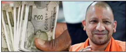
यूपी के कर्मचारियों-पेंशनरों को राहत, डीए 2 प्रतिशत बढ़ा

नई दिल्ली, मुजफ्फरनगर, देहरादून, हल्द्वानी, मुस्ताबाद, बरेली, मेरठ व लखनऊ से प्रकाशित