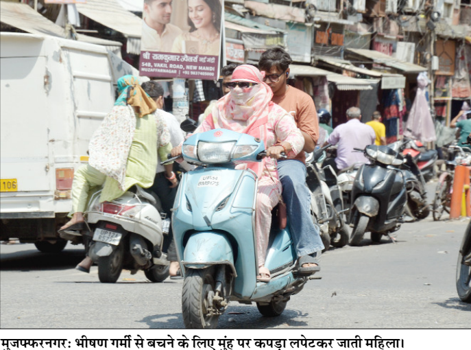
मुजफ्फरनगर: भीषण गर्मी से बचने के लिए मुंह पर कपड़ा लपेटकर जाती महिला।

को बंधक बनाने का आरोप लगाया गया। बताया जाता है कि किसी तरह चाईलड लाईन को एक गुप्त सूचना मिली जिसके बाद टीम संघावली में पहुंचकर किशोरी को मुक्त कराया इस मामले में मन्सूरपुर पुलिस तरफ अज्ञान बनी हुई। पुलिस का कहना है कि बाल कल्याण समिति एव चाईलड लाईन इस मामले को देख रहा है। पुलिस कड़ा कहना है कि तहरीर आने के बाद कार्यवाही की जायेगी। कुल मिलाकर रोजी रोटी के लिए तंगहाली के चलते बीमा से देहरादून आये के साथ यह घटना गई और इसका जिम्मेदार सगी मौसी काही बताय जा रहा है।