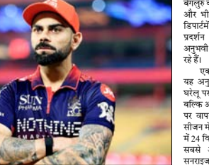
बेंगलुरु की बैटिंग लाइनअप की गहराई और भी ज्यादा उजागर किया। बॉलिंग डिपार्टमेंट ने भी देवाय में लगातार अच्छा प्रदर्शन किया है, जिसको अगुवाई अंतर्भूती तैज गेंदबाज धनुनेश्वर कुमार कर रहे हैं। एक दिलचस्प पहलू यह भी है कि यह अनुभवी तेज गेंदबाज हैदराबाद में पंचरू परदेसी के खिलाड़ी के तौर पर नहीं, बल्कि आरसीवी के प्रमुख गेंदबाज के तौर पर वापसी कर रहा है। धनुनेश्वर इस सीजन में असाधारण रहे हैं, और 13 मैचों में 24 विकेट लेकर परफॉर्म कर रहे हैं। हालांकि, सनराइज हैदराबाद के पास अपने टिके विकेट भी विरोधी टीम को चुनौती देने के लिए काफी ताकत है। 22 कप्तान की अगुआई वाली इस टीम ने अपनी रणनीति आक्रामक बैटिंग और निरर शार्द के दुर्द-गिरं बनाई है, खासकर अपने परेडू मैदान हैदराबाद में, जहां ज्यादा स्कोर वाले मुकामले अथ एक आम बात हो गई है। दक्षिण अफ्रीको स्टार हेनरिक क्लासन

हैदराबाद, वार्ता। विराट कोहली को रॉयल चैलेंजर्स बेंगलुरु और सनराइज हैदराबाद की विस्फोटक बैटिंग ताकत के बीच एक खोजक मुकामला शुरूआत की यहा राबिज गोटे इंटरनेशनल क्रिकेट स्टेडियम में घुम मानसे के लिए तैयार है। कॉन्क्रेट आईपीएल 2026 का लॉग चरण एक रोमांचक और भी ओर बढ़ रहा है। हालांकि, सभी टीमों में पहले ही प्लेऑफ के लिए बल्लेबाई कर लिया है, फिर भी टॉप-2 में जग बनने की लड़ाई में यह मुकामला बहुत अहम है, जिससे इस सीजन के सबसे ज्यादा इंतजार वाले मैचों में से एक में ओर भी ज्यादा रोमांच पैदा होगा है। सभी को नरारं प्रारं से कोहली पर टिको होगी, जिन्होंने पिछले चैंलेंसर्स बेंगलुरु के लिए जबरदस्त सीजन खेलेकर अपने पुराने रन में वापसी की है। भारत के पूर्व कप्तान के लीड में 54-20 की औसत और 164-74 के स्ट्राइक रेट से 542 रन बनाए हैं, और साइड स्ट्रेम में टॉप पर सुदर्शन में आर. तेवी को शानदार बतक ही अनुबाई की है।