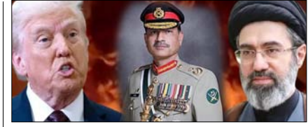
पाकिस्तान के जरिये अमेरिका का नया युद्ध विराम प्रस्ताव