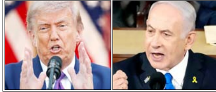
कतर, सऊदी अरब और यूएई जैसे खाड़ी देशों की अपील पर यह फैसला लिया गया: ट्रम्प

तेल अवीव/वाशिंगटन। ईरान युद्ध को लेकर अमेरिकी राष्ट्रपति डोनाल्ड ट्रम्प और इजरायली प्रधानमंत्री बेजायिन नेतन्याहू के बीच मतभेद खुलकर सामने आ गए हैं। एक रिपोर्ट के मुताबिक, नेतन्याहू चाहते हैं कि ईरान पर हमले जारी रहें, जबकि ट्रम्प फिलहाल बातचीत और डील को मौका देना चाहते हैं। रिपोर्ट के मुताबिक, मंगलवार को दोनों नेताओं के बीच करीब एक घंटे तक फोन पर बातचीत हुई। अमेरिकी अधिकारी ने बताया कि नेतन्याहू ने ट्रम्प से कहा कि ईरान पर प्रस्तावित हमले रोकना गलती है और सैन्य कार्रवाई जारी रहनी चाहिए।