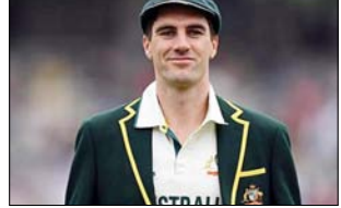
होने वाला बॉर्डर-गायकर टूर्नामेंट ऑस्ट्रेलिया के शुरूआती नाइटूट प्रदर्शन से खुश नहीं हैं। ऑस्ट्रेलिया के बड़े खिलाड़ियों को अंतर्राष्ट्रीय क्रिकेट और वॉपीएल दोनों में प्रतिबद्धता होना है। पांच वर्षों बाद खिलाड़ी इस महीने की शुरूआत में क्रिकेट ऑस्ट्रेलिया के शुरूआती नाइटूट प्रदर्शन से खुश नहीं हैं। ऑस्ट्रेलिया के बड़े खिलाड़ियों को अंतर्राष्ट्रीय क्रिकेट और वॉपीएल दोनों में प्रतिबद्धता होना है। पांच वर्षों बाद खिलाड़ी इस महीने की शुरूआत में

नई दिल्ली, वार्ता। पैट कर्मिसन ने स्पष्ट कहा है कि क्रिस के कम अगले कुछ वॉ तक ऑस्ट्रेलियाई क्रिकेट उनकी प्राथमिकता होगी। यह बयान दस वर्षों के बीच आया है, जिसमें कहा जा रहा है कि ऑस्ट्रेलिया के कुछ बड़े खिलाड़ी आईपीएल से आगे बढ़कर अन्य पंचाडजी क्रिकेट खेलने के लिए स्ट्रेटोय टीम से दूरी बना सकते हैं। ऑस्ट्रेलिया के टेस्ट और वनडे कप्तान कर्मिसन पहले ही पाकिस्तान और बांग्लादेश के आगामी दौरों से वाहर रहने वाले हैं, क्योंकि उन्हें उच्चता तालमेल बिठाओ में हिस्सा लेना है। उन्हें आसत 2026 से आसत 2027 के बीच होने वाले 20 (संपन्न: 21) टेस्ट मैचों से पहले आराम की भी जरूरत है। इसमें भारत में