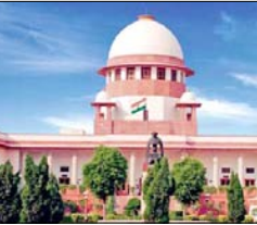
कहा: अगर संपन्न बच्चों के लिए फिर से आरक्षण मांगा जाए, तो हम कभी भी इस चक्र से बाहर नहीं निकल पाएंगे

नई दिल्ली। सुप्रीम कोर्ट ने शुक्रवार को सरकारी नौकरी में क्रीमी लेयर के कैंडिडेट के आरक्षण लेने पर चिंता जताई। कोर्ट ने कहा कि अगर माता-पिता दोनों आईएस अफसर हैं, तो उनके बच्चों को आरक्षण क्यों मिलना चाहिए। शिक्षा और आर्थिक सशक्तिकरण के साथ-साथ सामाजिक गतिशीलता भी आती है। ऐसे में अगर संपन्न बच्चों के लिए फिर से आरक्षण मांगा जाए, तो हम कभी भी इस चक्र से बाहर नहीं निकल पाएंगे।