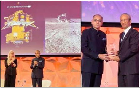
वाला दुनिया का पहला देश बना था। चंद्रमा का दक्षिणी ध्रुव वैज्ञानिक और रणनीतिक दृष्टि से बेहद महत्वपूर्ण माना जाता है। इस क्षेत्र को सतह पर इससे पहले कोई मिशन नहीं पहुंच पाया था। मिशन ने भविष्य के मानव चंद्र अभियानों के लिए अहम वैज्ञानिक आंकड़े उपलब्ध कराए। साथ ही चंद्रमा के कर्मी महत्वपूर्ण रासायनिक तत्वों की मौजूदगी की पुष्टि की।

यह सम्मान 21 मई को वाशिंगटन डीसी में आयोजित कार्यक्रम के दौरान दिया गया। 23 अगस्त 2023 को चंद्रयान-3 ने इतिहास रचते हुए चंद्रमा के दक्षिणी ध्रुव के पास सफल सॉफ्ट लैंडिंग की थी। भारत ऐसा करने