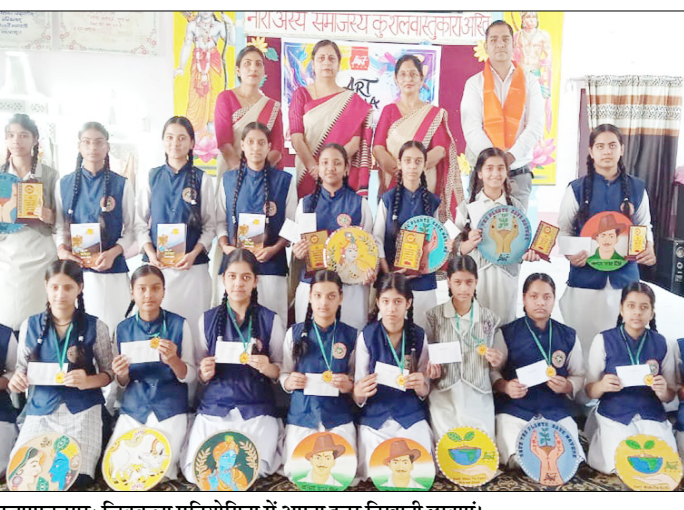
मुजफ्फरनगर: चित्रकला प्रतियोगिता में अपना हुनर दिखाती छात्राएं।