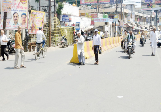
मुजफ्फरनगर: भीषण गर्मी के चलते सूनी पड़ी शहर की मुख्य सड़कों।