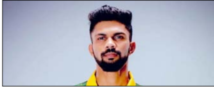
सीएसके के कप्तान गायकवाड़ पर लगा 2.4 लाख का जुर्माना