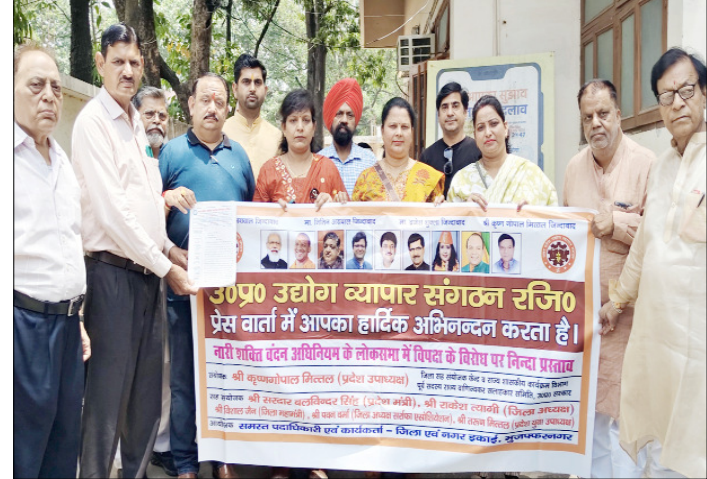
मुजफ्फरनगर: लोकसभा में विपक्ष के विरोध पर निन्दा करते उ.प्र.व्यापार संगठन के पदाधिकारी।

में कर लिया। विभागीय अधिकारियों का कहना है कि अभियान के दौरान पकड़े गये वाहनों पर 2,12,000/- रुपये से अधिक का जुर्माना किया गया है। बता दे कि जनपद में तेज गति, तेज रफतार और ओवरलोड वाहनों के कारण दुर्घटनाएं हो रही हैं। कई सड़क हादसे ऐसे भी हो चुके हैं जिनमें कई-कई लोगों की जान भी चली गई। कहीं स्कूली बस से दुर्घटनाएं हो रही हैं तो कहीं तेज रफतार कार छोटे वाहनों को कुचल रही हैं। इतना ही नहीं छोटे वाहनों की अधिक गति लगातार लोगों की जान ले रही है। कई हादसे तो ऐसे हुए जिनमें कार व वाइक पीछे से बड़े वाहन में घुस गईं।