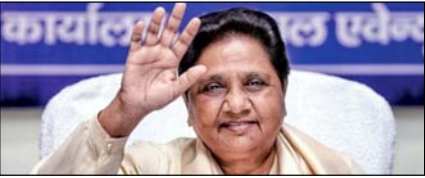
बिजली संकट से निजात दिलाने के उचित कदम उठाए सरकार: मायावती

नई दिल्ली, मुजफ्फरनगर, देहरादून, हल्द्वानी, मुतादाबाद, बरौली, मेरठ व लखनऊ से प्रकाशित