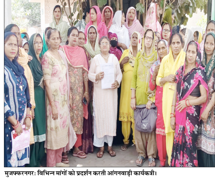
मुजफ्फरनगर: विभिन्न मांगों को प्रदर्शन करती आंगवाड़ी कार्यकर्त्री।