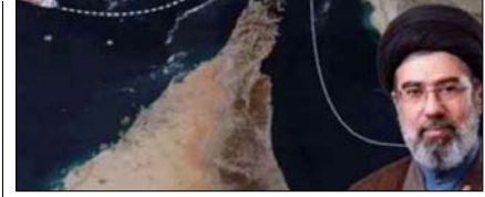
होर्मुज स्ट्रेट में जहाजों से फीस वसूलेगा ईरान