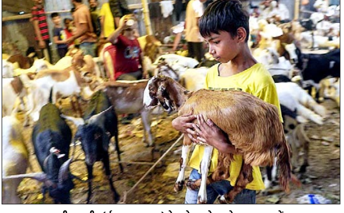
वाराणसी। बकरीट (ईट-उल-अजहा) के त्योहार से पहले पशु बाजार में बकरा खरीदने के बाद उसको गोद में उठाकर ले जाता एक बच्चा।