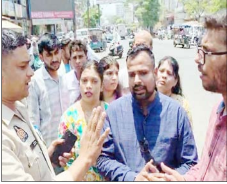
पहुँचा। प्रदर्शनकारी विशाल ट्रेडर्स के शोरूम पर पहुंचकर विरोध प्रदर्शन करना चाहते थे, लेकिन उससे पहले ही पुलिस ने उन्हें रोक लिया। तो उनकी पुलिस से झड़प भी हुई। पुलिस एसी और

मुजफ्फरनगर। एक परिवार ने खराब एसी से परेशान होकर उसका जनाजा निकालते हुए विरोध प्रदर्शन किया। बाकायदा एसीशजनाजा को फूलों की माला पहनाकर ई-रिक्शा की छत पर रखा गया और फिर जुलूस निकालते हुए लाउड स्पीकर से एनाउंस करते हुए शहर की सड़कों पर घुमाया गया। जुलूस जानसठ रोड स्थित कंबल वाला बाग से शुरू होकर बालाजी चौक रोड, ब्रिचकमा चौक होते हुए भोपा रोड रेलवे ओवरब्रिज तक