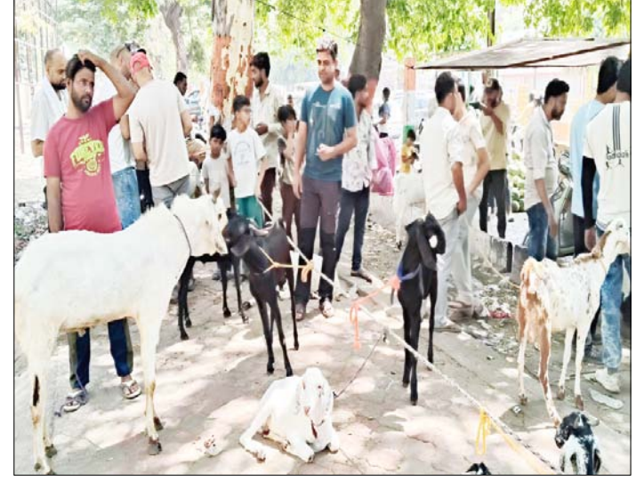
मुजफ्फरनगर: ईद-उल-अजहा पर कुर्बानियों के लिए बकरों की खरीदारी करते अकीदतमंद।