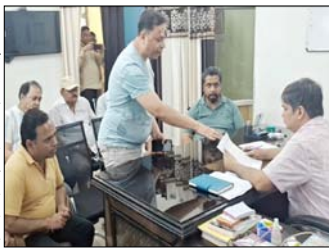
नहीं उठाए गए तो व्यापारियों को आंदोलन के लिए मजबूर होना पड़ेगा। ज्ञापन सौंपने के दौरान व्यापार मंडल के कई पदाधिकारी और व्यापारी मौजूद रहे।

गया है और अपने साथियों के माध्यम से व्यापारियों व आम लोगों को डराकर अवैध वसूली कर रहा है। उन्होंने कहा कि नगर के कई क्षेत्रों में लोग भय और असुरक्षा का माहौल महसूस कर रहे हैं, जिससे व्यापारिक गतिविधियां भी प्रभावित हो रही हैं। ज्ञापन में व्यापार मंडल ने उल्लेख किया कि वर्ष 2016 में विनय जैन के खिलाफ खतौली थाने में धारा 386 आईपीसी सहित विभिन्न धाराओं में मुकदमे दर्ज किए गए थे। बाद में उसे जेल भेजा गया और इलाहाबाद हाईकोर्ट से जमानत मिली थी। व्यापारियों का आरोप है कि जमानत मिलने के बाद