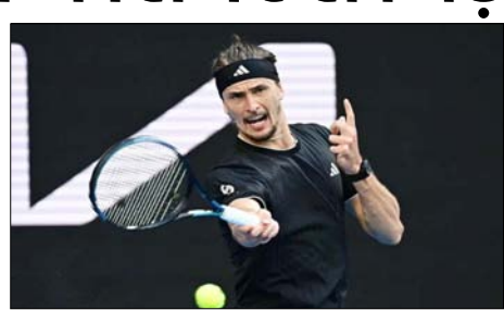
सिनर की राजधानी में अपनी 30वीं जीत के साथ, ज्वेरेव रोजर फेडर और राफेल नडाल के बाद तीसरे ऐसे खिलाड़ी बन गए हैं जो मैड्रिड में चार बार फाइनल में पहुंचे हैं। ज्वेरेव ने जीत के बाद कहा कि मै फाइनल में पहुंचकर बहुत खुश हूँ। बहुत सारे कड़े मुकामले हुए, खासकर टूर्नामेंट की शुरुआत में। मैं जानिक के साथ फिर से खेलने का इंतजार कर रहा हूँ और एक कड़े मैच की उम्मीद कर रहा हूँ। रविवार को जो बेहतरीन खेलेंगे, वही जीतगा। दूसरे वरीयता प्राप्त खिलाड़ी ने