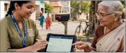
उप्र: जनगणना 2027: दो चरणों में होगी प्रक्रिया, घर-घर जाकर जुटाया जाएगा डेटा

नई दिल्ली, मुजफ्फरनगर, देहरादून, हल्द्वानी, मुरादाबाद, बरेली, मेरठ व लखनऊ से प्रकाशित