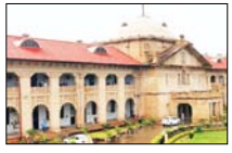
इलाहाबाद हाईकोर्ट ने खारिज की याचिका