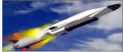
शाह टाइम्स ब्यूरो

'सुपरसोनिक ब्रह्मोस' से दोगुनी होगी रफ्तार