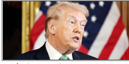
हंसी के बीच कहा: क्यूबा नामक एक स्थान है, जिस पर हम लगभग तुरंत नियंत्रण कर लेंगे

फ्लोरिडा। अमेरिका के राष्ट्रपति डोनाल्ड ट्रम्प ने क्यूबा पर 'तत्काल कब्जा' करने की घोषणा करते हुए संकेत दिया कि 'ईरान के साथ मिशन पूरा होने' के बाद अमेरिका इस कैरेबियाई राष्ट्र की ओर अपने नौसैनिक बड़े भेज सकता है। ट्रम्प ने ये टिप्पणियां फ्लोरिडा में आयोजित एक सार्वजनिक कार्यक्रम के दौरान कीं। इससे पहले उन्होंने क्यूबा सरकार और उनसे जुड़ी संस्थाओं के खिलाफ प्रतिबंधों का विस्तार करने वाले एक कार्यकारी आदेश पर हस्ताक्षर किए। ट्रम्प ने कार्यक्रम में उपस्थित लोगों को हंसी के बीच कहा कि क्यूबा नामक एक स्थान है, जिस पर हम लगभग तुरंत नियंत्रण कर लेंगे। क्यूबा की अपनी समस्याएं हैं। पहले हम एक काम खत्म करेंगे— मुझे पहले एक काम पूरा करना पसंद है। उन्होंने अपनी पुरानी बातों को दोहराते हुए कहा कि क्यूबा के खिलाफ कोई भी कार्रवाई ईरान के साथ जारी अमेरिका-इजरायल युद्ध के बाद की जा