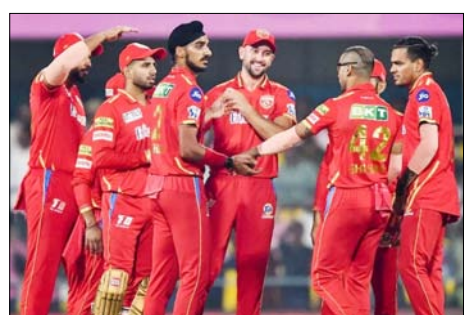
एक ऐसी टीम जो 220 से ज्यादा के स्कोर को भी आसानी से चेज करने लायक बना सकती है। यह साख सिर्फ हवा-हवाई बातों से नहीं बनी है। इसे लगातार बेहतरीन बेटिंग परफॉर्मिस से बनाया गया है, जिसकी सबसे बड़ी मिसाल इस सीजन की शुरुआत में

अहमदाबाद, वार्ता। पंजाब किंग्स आईपीएल 2026 में एक ऐसे मुकाम पर पहुंच गई है, जहां अब बड़े से बड़े टारगेट भी उन्हें रोकने के लिए काफी नहीं लगते। रविवार रात नरेंद्र मोदी स्टेडियम में गुजरात टाइटन्स का सामना करने की तैयारी करते हुए, पंजाब किंग्स टूर्नामेंट की सबसे निडर चेज करने वाली टीम के तौर पर अपनी साख बनाए हुए हैं।