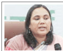
घर-घर जाकर जुटाया जाएगा डेटा