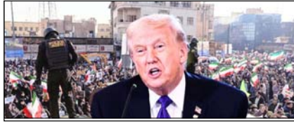
ईरान और अमेरिका के बीच फिर छिड़ सकता है युद्ध