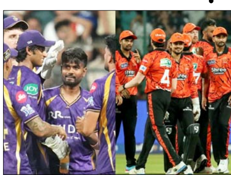
एसआरएच लगातार पांच मैच जीतकर जबरदस्त लय में है। यह उनके शुरुआती लड़खड़ाते प्रदर्शन के बाद एक शानदार वापसी है, जिसमें उन्होंने अपने शुरुआती चार में से तीन मैच गंवा दिए थे। तब से हैदराबाद की यह फ्रेंचाइजी आईपीएल की सबसे खोफनाक

हैदराबाद, वार्ता। सनराइजर्स हैदराबाद की विस्फोटक बेटिंग का नया इम्फिहान तब होगा, जब वे रविवार को यहां राजीव गांधी इंटरनेशनल क्रिकेट स्टेडियम में आईपीएल 2026 के दिन के मैच में कोलकाता नाइट राइडर्स की मेजबानी करेंगे। इस मैच में सबकी नजर इस बात पर होगी कि क्या केकेआर टूर्नामेंट की सबसे खतरनाक बेटिंग यूनिट को रोक पाएगा।