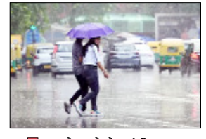
पहले हफ्ते से आंधी-तूफान संग बेमौसम वर्षा का अलर्ट

लखनऊ। उत्तर प्रदेश में पिछले 3-4 दिनों से हुई बारिश और आंधी तूफान की वजह से अधिकतम तापमान में प्रभावी कमी दर्ज की गई, जिससे अप्रैल माह में पड़ रही भीषण गर्मी से प्रदेशवासियों को राहत मिली है। पश्चिमी विक्षोभ का असर कम होने के कारण प्रदेश के दोनों संभागों में अगले 2 दिनों तक मौसम ड्राई बना रहेगा, अधिकतम तापमान में वृद्धि दर्ज की जाएगी। वहीं 4 मई को एक नया पश्चिमी विक्षोभ सक्रिय हो रहा है, जिसके कारण उत्तर प्रदेश में फिर से एक बार बेमौसम बारिश का सिलसिला शुरू होगा, जिससे अधिकतम तापमान में कमी दर्ज की जाएगी। वहीं कानपुर में रात में 7 डिग्री परा गिरा, अब 4 और 5 मई को फिर से झमाझम बारिश का अलर्ट जारी किया गया है। पिछले 24 घंटे में उत्तर प्रदेश में अनुमानित बारिश 0.5 मिमी के सापेक्ष 5 मिमी रिपोर्ट की गई, जो कि सामान्य से 900 प्रतिशत अधिक है। वहीं 1 मार्च से लेकर 1 मई तक अनुमानित बारिश 15.4 मिली मीटर के सापेक्ष 26.4 मिलीमीटर रिपोर्ट की