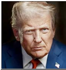
मैं ही कार और ट्रक बनाएंगी, तो उन पर कोई टैक्स नहीं लगाया जाएगा।

ट्रम्प का कहना है कि यूरोपीय संघ पहले से तय व्यापार समझौते का पालन नहीं कर रहा है, इसलिए यह फैसला लिया गया है। हालांकि अगर यूरोपीय कंपनियां अमेरिका