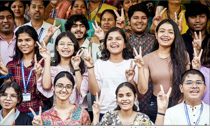
नागपुर। महाराष्ट्र स्टेट बोर्ड एचएससी कक्षा 12 के परिणाम घोषित होने के बाद जश्न मनाते छात्र।