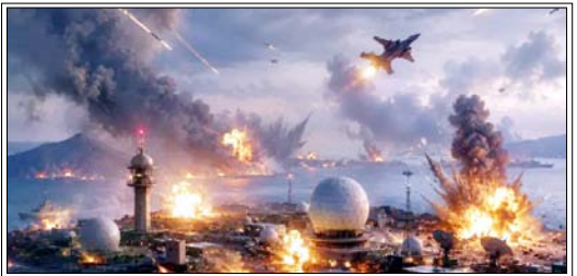
अमेरिकी लड़ाकू विमानों ने ईरान की हवाई रक्षा प्रणालियों, एक ग्राउंड कंट्रोल स्टेशन और दो हमलावर ड्रोन को नष्ट कर दिया

वाशिंगटन/तेहरान। अमेरिका-ईरान के बीच जारी संघर्षविषयों को आगे बढ़ाने और होर्मुज जलडमरूमध्य को फिर से खोलने के उद्देश्य से किए गए प्रस्तावित समझौते में अमेरिकी राष्ट्रपति डोनाल्ड ट्रम्प की ओर से कुछ बदलाव सुझाकर उसे वापस भेजने के बावजूद ईरान और अमेरिका के बीच हमलों और जवाबी हमलों का सिलसिला जारी है।