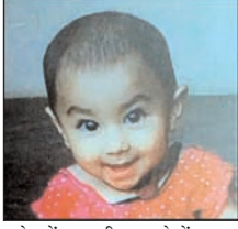
चपेट में आ गयी। हादसे में मासूम की मौके पर ही मौत हो गयी। घटना से स्वजन में चीत्कार मच गयी और मुहल्ले के लोग भी एकत्र हो गए। चूँकि ई-रिक्शा चालक भी मोहल्ले का ही था इसलिए दोनों पक्षों के बीच फैसला हो गया। इसलिए पुलिस को सूचना नहीं दी गई।

शाह टाइम्स संवाददाता, गजरीला। ई-रिक्शा बैक करते समय पड़ोसी की 03 वर्षीय मासूम बच्ची की मौत हो गयी। वह गली में खेल रही थी। घटना से परिजनों में चीख पुकार मच गयी। बाद में दोनों पक्षों के बीच फैसला हो गया और