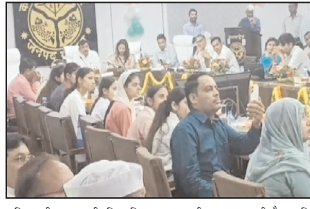
और समर्पण के साथ करें। परिश्रम कठिन अवश्य हो सकता है, लेकिन सफलता का वास्तविक मार्ग मेहनत से ही निकलता है, शॉर्टकट से नहीं। उन्होंने सभी मेधावी छात्र-छात्राओं को बधाई देते हुए उनके उज्वल