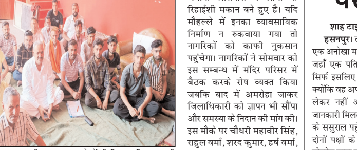
नगर के मोहल्ला लक्ष्मीनगर के नागरिकों का आरोप है कि रईसद्वारा और उसकी पत्नी भूरी मुहल्ले में ही बिना प्राधिकरण की अनुमति के व्यावसायिक प्रयोग के लिए भवन निर्माण करा रहे हैं,

शाह टाइम्स संवाददाता, गजरीला। नगर के मुहल्ला लक्ष्मीनगर का नागरिकों ने एक व्यक्ति पर बिना प्राधिकरण से बिना नगर के मोहल्ला लक्ष्मीनगर का मामला नक्शा पास कराये ही औद्योगिक एवं व्यावसायिक प्रयोग के लिए भवन निर्माण कराये जाने का मुद्दा उठाते हुए निर्माण कार्य रुकवाने की मांग की है, अन्यथा धरने की चेतावनी भी दी है। नागरिकों ने इस बाबत जिलाधिकारी को ज्ञापन भी सौंपा है।