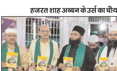
हजरत शाह अब्बन के उर्स का चौथा दिन

शाह टाइम्स संवाददाता हसनपुर। हजरत पीर शाह अब्बन बदेर चिरती रहमतुल्लाह अलेह के उर्स के चौथे दिन कव्वालों ने