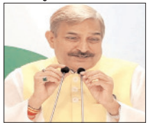
राज्यसभा उपनेता और पार्टी सांसद प्रमोद तिवारी ने कहा- जनता की जेब पर डाका

नई दिल्ली, वार्ता कर्मश्रियल एलपीजी सिलेंडर की कीमतों में एक बार फिर बढ़ोतरी होने के बाद कांग्रेस के राज्यसभा उपनेता और सांसद प्रमोद तिवारी ने केंद्र सरकार पर जनता की जेब पर डाका डालने का आरोप लगाते हुए कहा है कि एक तरफ प्रधानमंत्री मन की बात करते हैं, वहीं दूसरी तरफ उनकी सरकार गैस सिलेंडर के दाम बढ़ाकर आम लोगों पर आर्थिक बोझ डाल रही है। तिवारी ने सोमवार को कहा कि 19 किलो वाले कर्मश्रियल एलपीजी सिलेंडर की कीमत में 42 रुपये की वृद्धि कर दी गई है। इसके बाद दिल्ली में इसकी कीमत 3113.50 रुपये और कोल. काला में 3255.50 रुपये पहुंच गई है। उन्होंने यह भी कहा कि 5