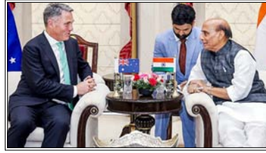
रक्षा मंत्री राजनाथ सिंह और ऑस्ट्रेलिया के रक्षा मंत्री रिचर्ड मार्ल्स ने सोमवार को यहाँ दूसरे भारत व ऑस्ट्रेलिया रक्षा मंत्री संवाद की सह अध्यक्षता की

नई दिल्ली। भारत और ऑस्ट्रेलिया ने अपनी रणनीतिक रक्षा साझेदारी को मजबूती से आगे बढ़ाते हुए समुद्री सुरक्षा, रक्षा उद्योग, परस्पर सैन्य संचालन क्षमता और उभरती प्रौद्योगिकियों के क्षेत्रों में सहयोग बढ़ाने पर सहमति व्यक्त की है। दोनों देशों ने हिन्द-प्रशांत क्षेत्र में सुरक्षा और स्थिरता को मजबूत करने की अपनी प्रतिबद्धता दोहराई।