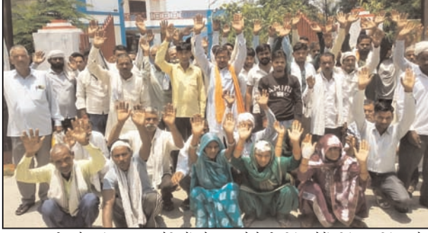
थाना प्रभारी को जांच कर आरोपियों के खिलाफ कार्रवाई के निर्देश दिए। प्रदर्शन करने