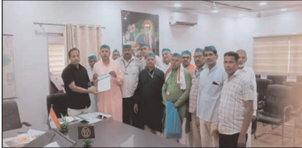
शाह टाइम्स ब्यूरो अमरोहा। गन्ना किसानों के बकाया भुगतान व जर्जर सड़कों के निर्माण समेत कई मांगों को लेकर भाकियू आठ जून को कलेक्ट्रेट में महापंचायत

आठ जून को कलेक्ट्रेट में किसानों की महापंचायत