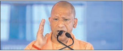
आमजन की समस्याओं का समयबद्ध निस्तारण हो: मुख्यमंत्री योगी

नई दिल्ली, मुजफ्फरनगर, देहरादून, हल्द्वानी, पुरादाबाद, बरेली, मेरठ व लखनऊ से प्रकाशित