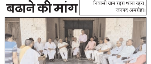
शाह टाइम्स संवाददाता

गांव में किसानों की पंचायत, सर्किल रेट बढ़ाने की मांग