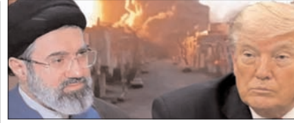
अमेरिका ने ईरान की रडार-ड्रोन कंट्रोल साइट्स पर किया हमला