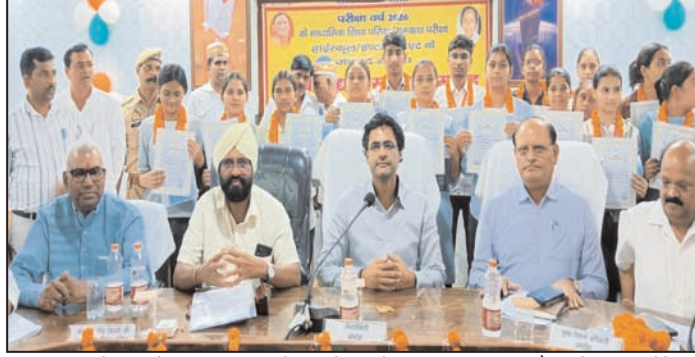
लक्ष्य पर ध्यान केंद्रित करते हुए अपनी प्रतिभा को निखारते रहना चाहिए। उन्होंने कहा कि जिन विद्यार्थियों के