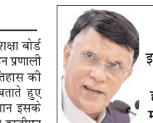
शिक्षा मंत्री धर्मदेव प्रधान इस्तीफा दें या उन्हें तत्काल पद से हटाएं प्रधानमंत्री मोदी: पवन खेड़ा

नई दिल्ली, वार्ता कांग्रेस ने केंद्रीय माध्यमिक शिक्षा बोर्ड (सीबीएसई) की डिजिटल मूल्यांकन प्रणाली को खामियों को देश के शिक्षा इतिहास की सबसे बड़ी संस्थागत विफलता बताते हुए कहा है कि शिक्षा मंत्री धर्मदेव प्रधान इसके लिए जिम्मेदार हैं और उन्हें पद से इस्तीफा देना चाहिए अथवा प्रधानमंत्री नरेंद्र मोदी को उन्हें तत्काल हटा देना चाहिए। कांग्रेस संचार विभाग के प्रमुख पवन खेड़ा ने सोमवार को यहां पार्टी मुख्यालय में संवाददाता सम्मेलन में आरोप लगाया कि मोदी सरकार के 12 वर्षों के शासन में देश की शिक्षा व्यवस्था लगातार कमजोर हुई है। सीबीएसई, नीट, यूजीसी-नेट और सीयूईटी जैसे मामलों में देश को परीक्षा प्रणाली को विश्वसनीयता पर गंभीर सवाल खड़े कर दिए हैं। खेड़ा ने यह भी आरोप लगाया कि सीबीएसई ने डिजिटल मूल्यांकन प्रणाली लागू करने से पहले शिक्षकों और विशेषज्ञों की गंभीर चेतावनियों को नजर अंदाज किया। उनके अनुसार परीक्षा के दौरान दर्जनों तकनीकी कर्मियों सामने आई थीं, लेकिन