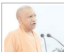
अनावश्यक विलंब होने पर संबंधित अधिकारियों की जवाबदेही भी तय की जाए: मुख्यमंत्री

उन्होंने कहा कि आमजन की समस्याओं का समयबद्ध निस्तारण सुनिश्चित किया जाए तथा अनावश्यक विलंब होने पर संबंधित अधिकारियों की जवाबदेही भी तय की जाए। जनता दर्शन के दौरान मुख्यमंत्री के समक्ष राज्य और पुलिस विभाग से जुड़े कई प्रकरण प्रस्तुत किए गए। मुख्यमंत्री ने अधिकारियों को निर्देशित किया कि लॉबिंग राजस्व वार्ता का निर्धारित समय सीमा के भीतर निस्तारण किया जाए। छह