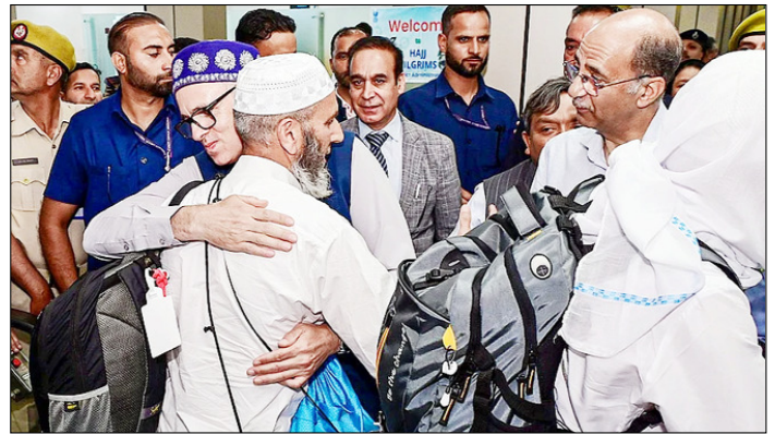
श्रीनगर। हवाई अड्डे पर मक्का से आने वाले हज यात्रियों के पहले जट्टे का स्वागत करते जम्मू-कश्मीर के मुख्यमंत्री उमर अब्दुल्ला।

नई दिल्ली। दक्षिण अफ्रीका के उपराष्ट्रपति शिपोकोसा पॉलुस माशातिले ने मंगलवार को यहां उपराष्ट्रपति सीपी राधाकृष्णन से मुलाकात की और द्विपक्षीय संबंधों को और मजबूत बनाने की प्रतिबद्धता जताई। दोनों नेताओं ने भारत-दक्षिण अफ्रीका द्विपक्षीय संबंधों को और सुदृढ़ बनाने पर सार्थक चर्चा की, जिसमें व्यापार, निवेश, रक्षा सहयोग, कौशल विकास तथा जन-से-जन संबंधों को मजबूत करने पर विशेष ध्यान दिया गया। उन्होंने विकासशील देशों की प्राथमिकताओं को आगे बढ़ाने तथा ब्रिक्स, जी-20, इन्फ्रा और हिंद महासागर तटीय संघ जैसे बहुपक्षीय मंचों में सहयोग बढ़ाने पर भी विचारों का आदान-प्रदान किया। दोनों नेताओं ने द्विपक्षीय आर्थिक संबंधों की पूर्ण क्षमता का उपयोग करने के उपायों पर चर्चा की।