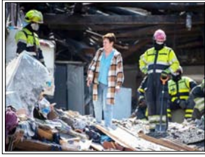
रात भर हुए इन हवाई हमलों में आवासीय इमारतें मलबे में तब्दील हो गईं, जिसमें कई बच्चों सहित दर्जनों लोग घायल हुए हैं: बीबीसी

कीव। यूक्रेन पर रूस के मिसाइल और ड्रोन हमले में कम से कम 13 लोगों की मौत हो गई है। इनमें से नौ लोग निग्रो में और चार राजधानी कीव में मारे गए। यह हाल के महीनों में मॉस्को की ओर से किए गए सबसे बड़े हमलों में से एक है। बीबीसी के अनुसार, रात भर हुए इन हवाई हमलों में आवासीय इमारतें मलबे में तब्दील हो गईं, जिसमें कई बच्चों सहित दर्जनों लोग घायल हुए हैं।