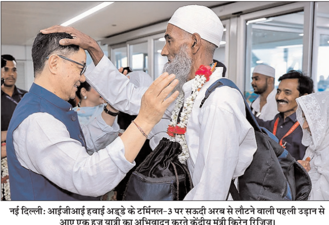
नई दिल्ली: आईजीआई हवाई अड्डे के टर्मिनल-3 पर सऊदी अरब से लौटने वाली पहली उड़ान से आए एक हज यात्री का अभिवादन करते केंद्रीय मंत्री किरन रिजिजू

प्रधानमंत्री रिसर्च चेर योजना के लिए आवेदन शुरू नई दिल्ली। शिक्षा मंत्रालय के उच्च शिक्षा विभाग की ओर से प्रधानमंत्री रिसर्च चेर (पीएमआरसी) योजना 2026 के लिए आवेदन शुरू हो गए हैं। शिक्षा मंत्रालय ने मंगलवार को बताया कि पीएमआरसी केंद्र सरकार की एक प्रमुख राष्ट्रीय पहल है जिसका उद्देश्य दुनिया भर में कार्यरत भारतीय मूल के उत्कृष्ट शोधकर्ताओं, वैज्ञानिकों, तकनीकी विशेषज्ञों और पेशेवरों को भारत के शीर्ष उच्च शिक्षण संस्थानों, राष्ट्रीय प्रयोगशालाओं और अनुसंधान केंद्रों से जोड़ना है।