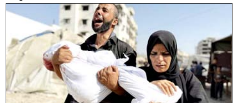
पिछले 48 घंटों के दौरान सात शवों और 25 घायलों को गाजा के अस्पतालों में लाया गया

गाजा। फलस्तीन के गाजा पट्टी क्षेत्र पर इजरायल के हमले निरंतर जारी हैं और इन हमलों से गाजा में अब तक मरने वालों की संख्या बढ़कर 72938 पहुंच गई है। गाजा के स्वास्थ्य मंत्रालय ने मंगलवार को बताया कि पिछले 48 घंटों के दौरान सात शवों और 25 घायलों को गाजा के अस्पतालों में लाया गया है। मंत्रालय के अनुसार पिछले साल 11 अक्टूबर को युद्धविराम लागू होने के बाद से अब तक गाजा में 929 लोगों की मौत हो चुकी है और 2811 अन्य घायल हुए हैं। इसके अलावा मलबे के नीचे से 781 शवों को भी निकाला गया है। स्वास्थ्य मंत्रालय के आंकड़ों के अनुसार, सात अक्टूबर 2023 से अब तक गाजा में मृतकों की कुल संख्या 72938 और घायलों की संख्या 172919 तक पहुंच गई है।