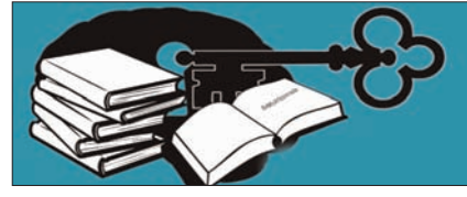
दूटते भरोसे के वेंडिलेटर पर देश की परीक्षा व्यवस्था