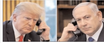
लेबनान पर इजरायली हमले से ट्रम्प नाराज, नेतन्याहू को फटकार लगाई