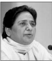
—सुशी मायावती अध्यक्ष, बहुजन समाज पार्टी