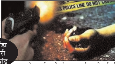
बिलसंडा व्यापारी हत्याकांड

मामले में अब तक तीन साजिशकर्ताओं और चार हमलावरों समेत सात आरोपी दबोचे