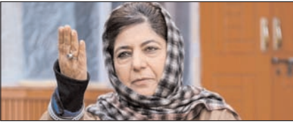
महबूबा ने की जम्मू-कश्मीर पर संवाद के लिए साझा प्रतिनिधि मंडल भेजने की अपील

नई दिल्ली, मुजफ्फरनगर, देहरादून, हल्द्वानी, मुगदाबाद, बरेली, मेरठ व लखनऊ से प्रकाशित