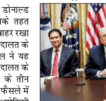
संघीय अपील अदालत के न्यायाधीशों के एक विभाजित पैनल ने यह फैसला सुनाया