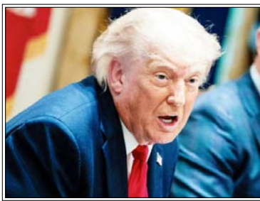
नेतन्याहू ने सेना को लेबनान में अपने जमीनी अभियान का विस्तार करने का निर्देश दिया है। इजरायल ने नबातिएह शहर के निकट एक रणनीतिक पहाड़ी पर स्थित ऐतिहासिक व्यूफोर्ट किले पर भी कब्जा कर लिया है।

इजरायल के पीएम नेतन्याहू को फोन कर फटकार लगाई, कहा- पागल हो गए हो क्या, तुरंत ये सब रोको