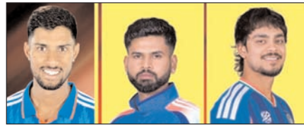
सूर्यकुमार की कप्तानी लेने की दौड़ में श्रेयस अय्यर, ईशान किशन व तिलक वर्मा