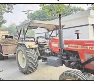
दो दिन पहले पकड़ी पांच ट्रैक्टर ट्राली पुलिस ने मोटी रकम लेकर छोड़ी

सूत्रों से मिली जानकारी के मुताबिक दो दिन पहले क्षेत्र के गांव धौरंग के पास पुलिस को खनन करते हुए पांच ट्रैक्टर ट्रालियों को पकड़ा था, जिन्हें मोटी रकम लेकर छोड़ दिया गया। इसके साथ ही पुलिस ने तीन दिन पहले 3 ट्रैक्टर ट्राली पकड़ कर मंडी में लाकर खड़ा कर दिया था, तीन दिनों तक इसकी रिपोर्ट खनन विभाग को नहीं भेजी गई, बल्कि उनका एम वी एक्ट में चालान कर दिया गया, इसके लिए पुलिस को खनन माफिया ने अच्छी मिठाई दी है, ऐसी चर्चा क्षेत्र में हो रही है। पुलिस प्रशासन का काम कर रहे हैं ग्रामीण मामला चाहे देह व्यापार का हो या खनन का, क्षेत्र के लोगों का भरोसा स्थानीय पुलिस और प्रशासन से उठता जा रहा है। एक दिन पहले ही क्षेत्र के ग्राम डांडिया वीरम नगला के ग्रामीणों ने स्थानीय पुलिस को फोन न कर सीधे कप्तान को फोन कर क्षेत्र में हो रहे देह व्यापार की जानकारी दी। जिस पर बड़ी कार्यवाही हो सकी थी। ऐसे ही गुरुवार को सुबह क्षेत्र के गांव सहोदर नगला के ग्रामीणों ने पहले जब एसडीएम का फोन नहीं उठा तो उन्होंने सीधे डीएम को फोन कर डाला, जिनकी फटकार पर राजस्व टीम ने यह बड़ी कार्यवाही की।