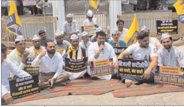
शाह टाइम्स ब्यूरो अमरोहा। प्रदेश में व्याप्त बिजली संकट, अघोषित कटौती, महंगी बिजली दरों और स्मार्ट