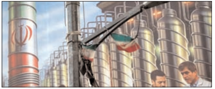
10 न्यूक्लियर बम बना सकता है ईरान: आईईए