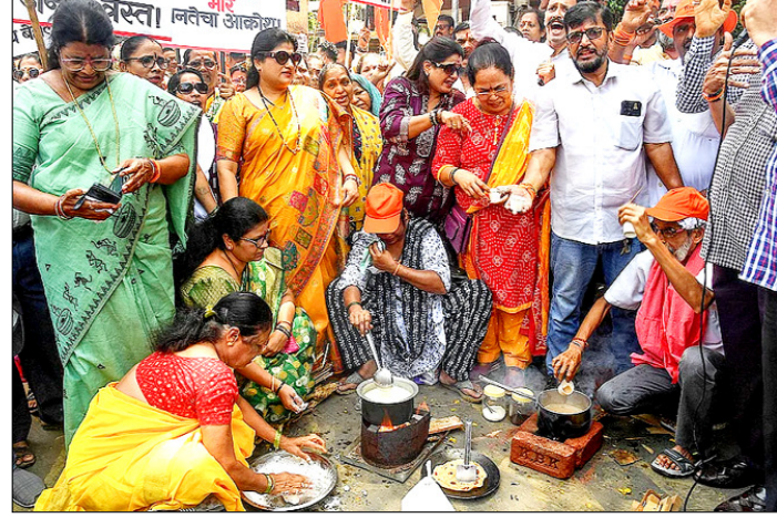
मुंबई। केंद्र सरकार द्वारा पेट्रोल और एलपीजी गैस की कीमतों में की गई वृद्धि के खिलाफ विरोध प्रदर्शन करते शिवसेना (यूबीटी) कार्यकर्ताओं।

ईरान ने साफ कहा है कि अगर उस पर या उसके हितों पर हमला हुआ तो वह कड़ा जवाब देगा। साथ ही कुवैत और बहरीन को चेतावनी दी गई है कि अगर उनका जमीन का इस्तेमाल ईरान के खिलाफ हुआ तो उसे नजरअंदाज नहीं किया जाएगा। वहीं अमेरिकी संसद के निचले सदन ने ईरान के खिलाफ सैन्य कार्रवाई पर राष्ट्रपति की शक्तियों को सीमित करने का प्रस्ताव पास किया है। इस फैसले का ट्रम्प ने कड़ा विरोध किया और इसे देशहित के खिलाफ बताया। दूसरी ओर मिडिल ईस्ट में तनाव के बावजूद सीजफायर की उम्मीदों के चलते वैश्विक बाजार में कच्चे तेल की कीमतों में हल्की गिरावट दर्ज की गई है। ब्रेंट क्रूड करीब 0.69 प्रतिशत गिरकर 97.14 डॉलर प्रति बैरेल पर पहुंचा, जबकि डब्ल्यूटीआई क्रूड 0.65 प्रतिशत गिरकर 95.40 डॉलर प्रति बैरेल।