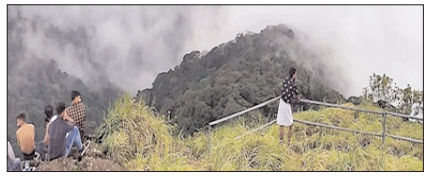
दिल्ली की गर्मी से बचना है, तो यहां जाएं