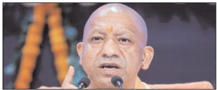
प्रकृति विरोधी माफिया से सतर्क रहें: सीएम योगी

नई दिल्ली, मुजफ्फरनगर, देहरादून, हल्द्वानी, मुगदाबाद, बरेली, मेरठ व लखनऊ से प्रकाशित