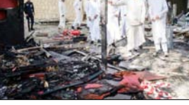
एयरपोर्ट को हुआ नुकसान अमेरिकी निर्मित पैट्रियट रक्षा प्रणाली की विफलता के कारण हुआ

ईरान का दावा: पैट्रियट मिसाइल सिस्टम की खराबी से हुआ नुकसान