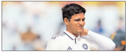
भारत-अफगानिस्तान टेस्ट से शुरु होगा गिल का दौरा