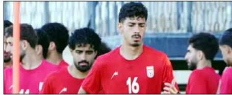
स्टाफ अभी भी वीजा का इंतजार कर रहे हैं। महासंघ का कहना है कि इससे टीम को बराबरी का मौका नहीं मिल रहा है और वह इस मामले को फीफा के सामने उठाएगा। वहीं, अमेरिकी अधिकारियों का कहना है कि सभी खिलाड़ियों, कोच, ट्रेनर और कुछ सपोर्ट स्टाफ को वीजा जारी कर दिया गया है, लेकिन कुछ आवेदनों