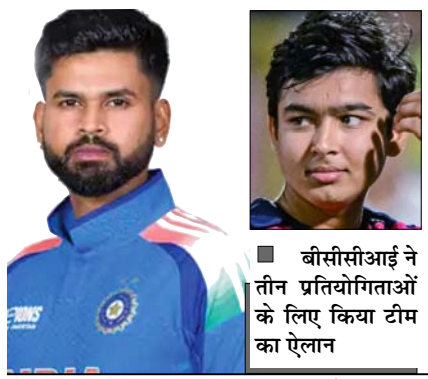
श्री अय्यर भारतीय पुरुष टी-20 क्रिकेट टीम के इतिहास में 15वें कप्तान होंगे। भारत अपने दौरे की

मुम्बई। भारतीय क्रिकेट कंट्रोल बोर्ड (बीसीसीआई) ने शनिवार को आयरलैंड और इंग्लैंड के आगामी दौर (जून-जुलाई) और सितम्बर से जापान में होने वाले 2026 एशियाई खेलों के लिए श्रेयस अय्यर को राष्ट्रीय टी-20 टीम का नया कप्तान बनाया है। राष्ट्रीय टीम चयनकर्ताओं युवा आतिथी बल्लेबाज वैभव सूर्यवंशी को भी टीम में शामिल किया है। तिलक वर्मा भारतीय टीम के उपकप्तान होंगे। इसके अलावा 15 वर्षीय युवा सनसनी वैभव सूर्यवंशी को पहली बार राष्ट्रीय टीम में शामिल किया गया है। उन्हें तीनों टीमें जगह मिली है। टीम में हरिष रणा की भी वापसी हुई है, जिन्होंने आखिरी बार इस साल फरवरी की शुरुआत में कोई प्रतिस्पर्धी मैच खेला है। सूर्यकुमार