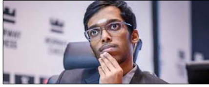
प्रज्ञानंद ने आखिरी राउंड में नॉर्वे चेस 2026 का खिताब जीता