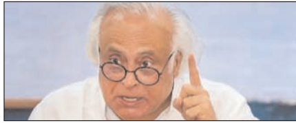
सीबीएसई में अनियमितताएं धर्मप्रधान की अक्षमता का प्रमाण: कांग्रेस पृष्ठ 2

नई दिल्ली, मुजफ्फरनगर, देहरादून, हल्द्वानी, मुगदाबाद, बरेली, मेरठ व लखनऊ से प्रकाशित