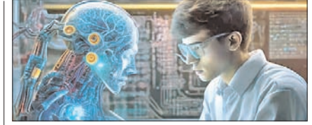
AI के सबसे अच्छे 5 कोर्स: नहीं होगी नौकरी की दिक्कत करियर