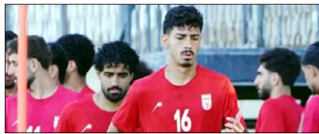
स्टाफ अभी भी वीजा का इंतजार कर रहे हैं। महासंघ का कहना है कि इससे टीम को बराबरी का मौका नहीं मिल रहा है और वह इस मामले को फीफा के सामने उठाएगा। वहीं, अमेरिकी अधिकारियों का कहना है कि सभी खिलाड़ियों, कोच, ट्रेनर और कुछ सपोर्ट स्टाफ को वीजा जारी कर दिया गया है, लेकिन कुछ आवेदनों

तेहरान। ईरान और इजरायल के बीच जारी जंग के बावजूद ईरानी फुटबॉल टीम के खिलाड़ियों को अमेरिका का वीजा मिला गया है। हालांकि टीम के कई सपोर्ट स्टाफ और अधिकारियों को अब तक अमेरिकी वीजा नहीं मिला है। इस पर ईरान ने अमेरिका पर भेदभाव करने का आरोप लगाया है। ईरानी सरकारी मीडिया के मुताबिक, फुटबॉल महासंघ के महासचिव हेदायत मोन्बेनी, उपाध्यक्ष मेहदी मोहम्मद नबी समेत 14 अधिकारी और सहयोगी