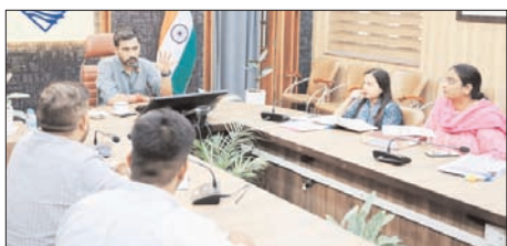
स्मार्ट सिटी परियोजनाओं की प्रगति, हैंडओवर की स्थिति एवं संचालन-अनुरक्षण कार्यों की जिलाधिकारी ने की समीक्षा

बैठक में जानकारी दी गई कि स्मार्ट सिटी के अंतर्गत स्वीकृत 22 परियोजनाओं में से 21 परियोजनाएं पूर्ण हो चुकी हैं तथा इनमें से 10 परियोजनाओं को संबंधित विभागों को हस्तांतरित किया जा चुका है। एक परियोजना, ग्रीन बिल्डिंग, वर्तमान में निर्माणाधीन है। इस पर जिलाधिकारी ने शेष 11 पूर्ण