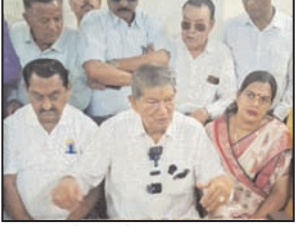
अग्निवीर योजना को समाप्त कर पूर्व की भर्ती व्यवस्था बहाल की जाएगी।

नजूल, श्रमिकों और किसानों के मुद्दों पर भाजपा सरकार को घेरा