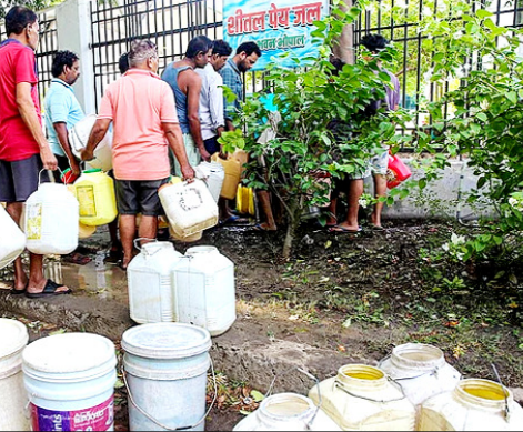
मोपाल। कोला जल आपूर्ति की मरम्मत पूरी न हो पाने के कारण आपूर्ति बाधित होने से पानी भरने के लिए कतार में खड़े लोग।

वाशिंगटन। अमेरिका ने शुक्रवार को ईरान के खिलाफ बड़ी आर्थिक कार्रवाई करते हुए उसके एक 'संगठित नेटवर्क' पर नए प्रतिबंधों का एलान किया है। अमेरिकी प्रशासन के अनुसार, यह नेटवर्क 'अवैध ऊर्जा व्यापार और वैश्विक वित्तीय धोखाधड़ी' में लिप्त था। इसके जरिए दक्षिण और पूर्वी एशिया के बाजारों में करोड़ों डॉलर मूल्य की ईरानी एलपीजी की तस्करी की जा रही थी। अमेरिकी विदेश और वित्त मंत्रालय के जारी बयानों के मुताबिक ईरान इसे ओमान जैसे तीसरे देशों का बताकर बेच रहा था। इस पूरे खेल को छिपाने के लिए संयुक्त अरब अमीरात (यूएई) और चीन में सक्रिय मुखौटा कंपनियों के साथ-साथ ईरान के जहाजों के लिए छद्म बेड़े का इस्तेमाल किया जा रहा था। ये जहाज अपनी पहचान और ईंधन के ईरानी मूल को छिपाकर परिवहन कर रहे थे।