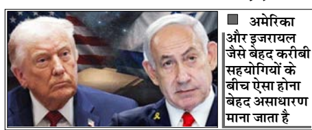
अमेरिका और इजरायल जैसे बेहद करीबी सहयोगियों के बीच ऐसा होना बेहद असाधारण माना जाता है

वाशिंगटन। अमेरिका और इजरायल के बीच ईरान को लेकर मतभेद बढ़ रहे हैं। इस बीच अमेरिकी रक्षा विभाग (पेंटागन) के भीतर यह चिंता बढ़ गई है कि इजरायल अमेरिकी अधिकारियों और ट्रम्प सरकार की अंदरूनी जानकारी जुटाने के लिए जासूसी की कोशिश कर रहा है। एक रिपोर्ट के मुताबिक दो मोज़ेदा और एक पूर्व अमेरिकी अधिकारी ने बताया कि पेंटागन की डिफेंस इंटेलिजेंस एजेंसी (डीआईए) ने हाल ही में इजरायल से जुड़े काउंटर-इंटेलिजेंस खतरे का स्तर बढ़ाकर 'क्रिटिकल' कर दिया है। यह एजेंसी का सबसे गंभीर अलर्ट माना जाता है। अमेरिका और इजरायल जैसे बेहद करीबी सहयोगियों के बीच ऐसा होना बेहद असाधारण माना जाता है। हालांकि इजरायल ने इन आरोपों