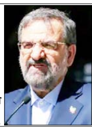
वार्ताएं गतिरोध की स्थिति में हैं और इस गतिरोध को तोड़ना ट्रम्प की जिम्मेदारी है: रेजाई

तेहरान। ईरान के वरिष्ठ सलाहकार मोहसिन रेजाई ने कहा है कि अमेरिका और ईरान के बीच किसी भी संभावित समझौते की सफलता इस बात पर निर्भर करेगी कि ट्रम्प प्रशासन ईरान की 24 अरब डॉलर की जल्द की हुई संपत्तियों को जारी करने की मांग स्वीकार करता है या नहीं। सीएनएन को दिए एक साक्षात्कार में ईरान के सर्वोच्च नेता अयातुल्ला मोजतबा खामनेई के सैन्य सलाहकार रेजाई ने कहा कि अब अगला कदम अमेरिका के राष्ट्रपति डोनाल्ड ट्रम्प को उठाना है। उन्होंने कहा कि वार्ताएं गतिरोध की स्थिति में हैं और इस गतिरोध को तोड़ना ट्रम्प की जिम्मेदारी है। गंदे अब ट्रम्प के पाले में हैं। उन्होंने चेतावनी दी कि यदि सैन्य टकराव फिर शुरू हुआ तो अमेरिका का दायरा फारस की खाड़ी से कहीं आगे तक फैल सकता है। रेजाई के अनुसार ईरान चाहता है कि अंतरिम समझौते पर हस्ताक्षर होते ही 12 अरब डॉलर जारी किए जाएं, जबकि शेष 12 अरब डॉलर बाद में दिए जाएं। उन्होंने कहा कि यह राशि जारी करना विश्वास बहाली का महत्वपूर्ण कदम होगा और युद्ध समाप्त करने के लिए समझौते तक पहुंचने में मदद करेगा। उन्होंने कहा कि यदि ट्रम्प वास्तव में ईरान के साथ समझौता करना चाहते हैं तो यह 24 अरब डॉलर विश्वास की परीक्षा है। अमेरिका को यह परीक्षा पास करनी होगी,