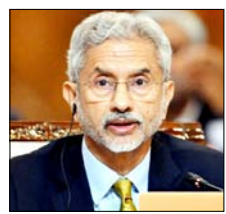
कहा: इससे अवैध कब्जा वैध नहीं होगा, 7 जून को 24 सीटों पर वोटिंग

नई दिल्ली। भारत ने पाकिस्तान के कब्जे वाले गिलगित-बाल्टिस्तान में 7 जून को होने वाले विधानसभा चुनावों का कड़ा विरोध किया है। विदेश मंत्रालय ने जारी बयान में कहा कि पाकिस्तान जिस क्षेत्र पर अवैध और जबरन कब्जा किए हुए है, वहां चुनाव कराने की उसकी योजना पूरी तरह अस्वीकार्य है। विदेश मंत्रालय ने कहा कि पूरा जम्मू-कश्मीर और लद्दाख, जिसमें गिलगित-बाल्टिस्तान भी शामिल है, भारत का अभिन्न और अविभाज्य हिस्सा है।