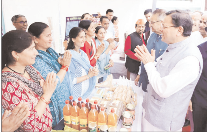
अल्मोड़ा के हवालबाग में हुआ भव्य कार्यक्रम, बड़ी संख्या में पहुंचे किसान

खेत बचाओ अभियान को जनादोलन बनाने का आह्वान, किसानों ने लिया मिट्टी और कृषि संरक्षण का संकल्प