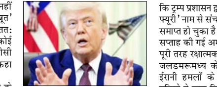
कुछ ऐसी चीजें हैं जिन्हें करने के बारे में उन्होंने कभी नहीं सोचा था, लेकिन अब उन्हें करना पड़ेगा: ट्रम्प

कुछ ऐसी चीजें हैं जिन्हें करने के बारे में उन्होंने कभी नहीं सोचा था, लेकिन अब उन्हें करना पड़ेगा। उनके पास कोई विकल्प नहीं है, हालांकि इसमें थोड़ा समय लगेगा। ट्रम्प की यह टिप्पणी ऐसे समय आई है, जब अमेरिका और ईरान के बीच युद्ध समाप्त करने के लिए चल रही वार्ता चौथे महीने में प्रवेश कर चुकी है। अप्रैल में हुआ युद्धविराम अभी तक किसी तरह कायम है, लेकिन दोनों देशों के बीच कूटनीतिक गतिरोध बना हुआ है। हाल के दिनों में अप्रैल में हुआ युद्धविराम अमी तक किसी तरह कायम है। अमेरिका के विदेश मंत्री मार्को रूबियो ने बुधवार को कांग्रेस के सदस्यों से कहा