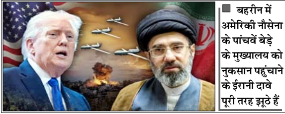
बहरैन में अमेरिकी नौसेना के पांचवें बेड़े के मुख्यालय को नुकसान पहुंचाने के ईरानी दावे पूरी तरह झूठे हैं

इसी दौरान एक अन्य मोर्चे पर इजरायल-लेबनान में संघर्ष विराम समझौता होने के बावजूद इजरायली सेना और हिजबुल्लाह के बीच झड़पें तेज हो गई हैं। हालांकि आधिकारिक तौर पर यह युद्धविराम लागू है, लेकिन जमीन पर इसका पालन बेहद कमजोर नजर आ रहा है। अमेरिकी केंद्रीय कमान (सैंटकॉम) ने एक बयान में कहा कि ईरानी बलों ने होर्मुज जलडमरूमध्य और पड़ोसी खाड़ी देशों की ओर कई बैलिस्टिक मिसाइलें और ड्रोन्स दागे। शुरुआती आकलन के अनुसार, अमेरिकी सेना ने कुवैत और बहरैन को निशाना बनाकर दागों गई सात मिसाइलों में से छह को हवा में ही नष्ट कर दिया, जबकि सातवीं मिसाइल लक्ष्य तक पहुंचने से पहले ही गिर गई। बयान में कहा गया है कि किसी भी अमेरिकी कर्मियों को कोई नुकसान नहीं पहुंचा है। सैंटकॉम ने कहा कि बहरैन में अमेरिकी नौसेना के पांचवें बेड़े के