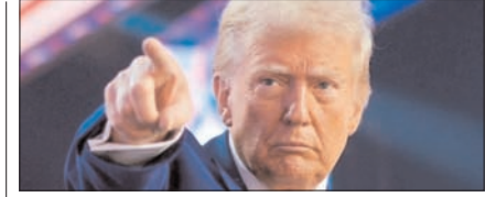
डोनाल्ड ट्रम्प की ईरान को नई धमकी