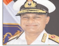
एडमिरल त्रिपाठी 31 मई को अपनी सेवा से हो गए थे रिटायर

पद संभालने के बाद उन्हें साउथ ब्लॉक परिसर में औपचारिक गार्ड ऑफ ऑनर दिया गया। इसके साथ ही वे भारतीय नौसेना के 27वें नौसेना प्रमुख बन गए हैं। दूसरी तरफ, निवर्तमान नौसेना प्रमुख एडमिरल दिनेश कुमार त्रिपाठी ने राष्ट्रीय युद्ध स्मारक जाकर देश के लिए बलिदान देने वाले वीर सैनिकों को श्रद्धांजलि दी। एडमिरल दिनेश