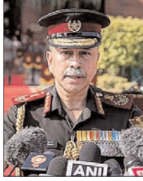
कहा: उनका मुख्य ध्यान सशस्त्र बलों के बदलाव और संगठनात्मक सुधारों पर होगा

नई दिल्ली। जनरल एनएस राजा सुब्रमणि ने रविवार को भारत के नए चीफ ऑफ डिफेंस स्टाफ (सीडीएस) के रूप में कार्यभार संभाल लिया। उन्हें पाकिस्तान और चीन के मामलों का बड़ा विशेषज्ञ माना जाता है। उनका मुख्य उद्देश्य महत्वकांक्षी मिलिट्री थिएटरेशन (सैन्य थिएटराइजेशन) योजना को लागू करना और तीनों सेनाओं के बीच तालमेल को मजबूत करना है। उन्होंने जनरल अमिल चौहान को जगह ली है। जनरल सुब्रमणि ने अपने पूर्ववर्तियों, दिवंगत जनरल बिपिन रावत और जनरल अमिल चौहान के शानदार नेतृत्व और योगदान के प्रति आभार जताया। जनरल चौहान शनिवार को देश के सबसे वरिष्ठ सैन्य कमांडर के रूप में अपना कार्यकाल पूरा करके सेवानिवृत्त हुए। जनरल सुब्रमणि इससे पहले राष्ट्रीय सुरक्षा परिषद सचिवालय (एनएससीएस) में सैन्य सलाहकार के रूप में काम कर रहे थे। वह पिछले साल 31 जुलाई को