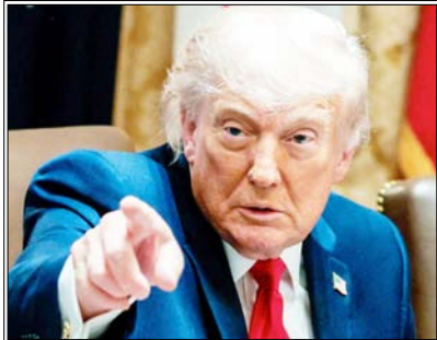
हम एक बहुत अच्छे समझौते के करीब हैं अगर हम इसे कर लेते हैं, तो अच्छा है: ट्रम्प

कहा: अमेरिका ईरान से बहुत अच्छे समझौते के करीब, नहीं बनी बात, तो अपनाएं दूसरा रास्ता