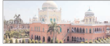
छोटे से मदरसे से विश्व विख्यात संस्था बनना मामूली बात नहीं