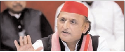
हुगली में टीएमसी सांसद कल्याण बनर्जी पर हमले की अखिलेश यादव ने की निंदा

नई दिल्ली, मुजफ्फरनगर, देहरादून, हल्द्वानी, मुगदाबाद, बरेली, मेरठ व लखनऊ से प्रकाशित