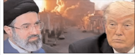
अमेरिका ने ईरान की रडार-ड्रोन कंट्रोल साइट्स पर किया हमला पेज 12