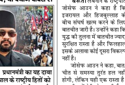
प्रधानमंत्री का यह दावा नेपाल के राष्ट्रीय हितों को नुकसान पहुंचाने वाला है

काठमांडू। नेपाल के प्रधानमंत्री बालेन शाह ने रविवार को कहा था कि सिर्फ भारत ने ही नेपाली जमीन पर कब्जा नहीं किया, बल्कि नेपाल ने भी कुछ भारतीय इलाकों पर कब्जा किया है। इस बयान का आज नेपाल की संसद में जमकर विरोध हुआ, विपक्षी दलों ने बालेन शाह से भारत से जुड़े इस विवादित दावे पर जवाब मांगा।