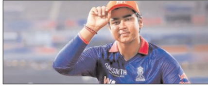
सूर्यवंशी ने जीते ऑरेंज कैप, एमवीपी और इमर्जिंग प्लेयर अवार्ड खेल टाइम्स