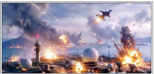
अमेरिकी लड़ाकू विमानों ने ईरान की हवाई रक्षा प्रणालियों, एक ग्राउंड कंट्रोल स्टेशन और दो हमलावर ड्रोन को नष्ट कर दिया

वाशिंगटन/तेहरान। अमेरिका-ईरान के बीच जारी संघर्षविषयों को आगे बढ़ाने और होर्मुज जलडमरूमध्य को फिर से खोलने के उद्देश्य से किए गए प्रस्तावित समझौते में अमेरिकी राष्ट्रपति डोनाल्ड ट्रम्प की ओर से कुछ बदलाव सुझाकर उसे वापस भेजने के बावजूद ईरान और अमेरिका के बीच हमलों और जवाबी हमलों का सिलसिला जारी है।