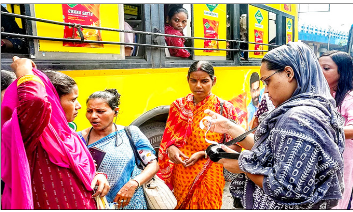
कोलकाता। राज्यव्यापी महिला मुफ्त बस यात्रा योजना लागू होने के बाद यात्रियों का टिकट देखती महिला कंडक्टर।