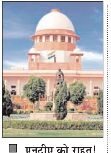
एनटीई को राहत! मामले की सुनवाई जुलाई तक स्थगित की