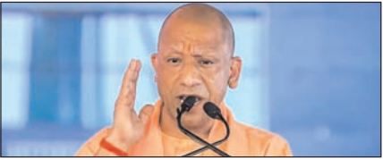
आमजन की समस्याओं का समयबद्ध निस्तारण हो: मुख्यमंत्री योगी पेज 2

shahtimes2015@gmail.com आषाढ़ कृष्ण पक्ष 1 विक्रमी सम्वत् 2083 15 जिलाहज्जा 1447 हिजरी नई दिल्ली, मुजफ्फरनगर, देहरादून, हल्द्वानी, मुरादाबाद, बरेली, मेरठ व लखनऊ से प्रकाशित