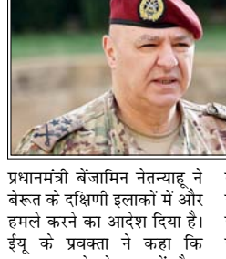
यूरोपीय संघ (ईयू) ने इजरायल से लेबनान में बढ़ती सैन्य कार्रवाई रोकने की अपील की

बेरूत। लेबनान के राष्ट्रपति जोसेफ आउन ने कहा है कि इजरायल और हिजबुल्लाह के बीच संघर्ष खत्म करने के लिए बातचीत जारी है। उन्होंने कहा कि युद्ध की तुलना में बातचीत ज्यादा सुरक्षित रास्ता है और फिलहाल इसके अलावा कोई दूसरा विकल्प नहीं है। जोसेफ आउन ने कहा, बातचीत से समस्या तुरंत हल नहीं होगी, लेकिन यही एक रास्ता है। बातचीत में देरी हो सकती है या कुछ रुकावटें आ सकती हैं, फिर भी यह आगे बढ़ रही है। यूरोपीय संघ (ईयू) ने इजरायल से लेबनान में बढ़ती सैन्य कार्रवाई रोकने की अपील की है। यह बयान ऐसे समय आया है जब इजरायली