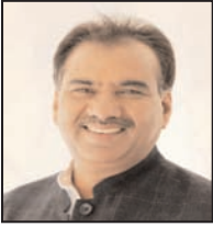
सांसद ने कहा कि आंधी-तूफान के कारण ग्रामीण और शहरी क्षेत्रों में बिजली आपूर्ति प्रभावित हुई है, जिससे आम जनता और किसानों को भारी परेशानी का सामना करना पड़ रहा है।

शाह टाइम्स ब्यूरो अमरोहा। भीषण गर्मी, आंधी-तूफान और लगातार हो रही बिजली कटौती को लेकर सांसद चौधरी कंवर सिंह तंवर ने बिजली विभाग के अधिकारियों के प्रति सख्त रुख अपनाया है। उन्होंने अधीक्षण अभियंता से फोन पर वार्ता कर क्षेत्र में बढ़ती बिजली संबंधी शिकायतों पर नारा जगी जगाई और जल्द से जल्द व्यवस्था दुरुस्त करने के निर्देश दिए। सांसद ने कहा कि आंधी-तूफान के कारण ग्रामीण और शहरी क्षेत्रों में बिजली आपूर्ति प्रभावित हुई है, जिससे आम जनता और किसानों को भारी परेशानी का सामना करना पड़ रहा है। इसके अलावा उन्होंने लो-वोल्टेज और ओवरलोडिंग की समस्या को गंभीरता से लेते हुए फुके ट्रांसफार्मरों को 24 घंटे के भीतर बदलने तथा जर्जर तारों की मरम्मत कराने के निर्देश दिए। अधीक्षण अभियंता ने सांसद को आश्वासित किया कि क्षेत्र में बिजली व्यवस्था को जल्द ही सुचारु कर समस्याओं का समाधान किया जाएगा।