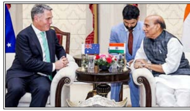
रक्षा मंत्री राजनाथ सिंह और ऑस्ट्रेलिया के रक्षा मंत्री रिचर्ड मार्ल्स ने सोमवार को यहाँ दूसरे भारत व ऑस्ट्रेलिया रक्षा मंत्री संवाद की सह अध्यक्षता की

नई दिल्ली। भारत और ऑस्ट्रेलिया ने अपनी रणनीतिक रक्षा साझेदारी को मजबूती से आगे बढ़ाते हुए समुद्री सुरक्षा, रक्षा उद्योग, परस्पर सैन्य संचालन क्षमता और उभरती प्रौद्योगिकियों के क्षेत्रों में सहयोग बढ़ाने पर सहमति व्यक्त की है। दोनों देशों ने हिन्द-प्रशांत क्षेत्र में सुरक्षा और स्थिरता को मजबूत करने की अपनी प्रतिबद्धता दोहराई।