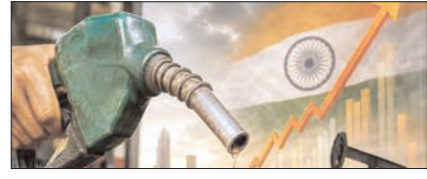
महंगाई की मार झेलता आम आदमी, मजे में जिदगी जीता एक वर्ग! सम्पादकीय