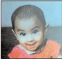
चपेट में आ गयी। हादसे में मासूम की मौत पर ही मौत हो गयी। घटना से स्वजन में चीत्कार मच गयी और मुहल्ले के लोग भी एकत्र हो गए। चूँकि ई-रिक्शा चालक भी मोहल्ले का ही था इसलिए दोनों पक्षों के बीच फैसला हो गया। इसलिए पुलिस को सूचना नहीं दी गई।

शाह टाइम्स संवाददाता, गजरीला। ई-रिक्शा बैक करते समय पड़ोसी की 03 वर्षीय मासूम बच्ची की मौत हो गयी। वह गली में खेल रही थी। घटना से परिजनों में चीख पुकार मच गयी। बाद में दोनों पक्षों के बीच फैसला हो गया और