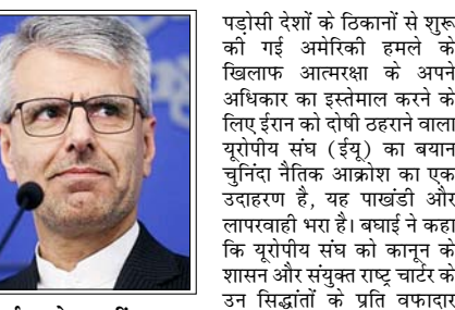
ईरान ऐसा नहीं मानता कि केवल सुरक्षा परिषद का प्रस्ताव ही समझौते के लागू होने की गारंटी होगा