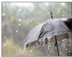
बारिश में भीग गए नौतपा, फर्रुखाबाद सबसे गर्म जिला रहा, गरज चमक के साथ तेज हवाएं भी चलेगी, तापमान में होगी गिरावट

शाह टाइम्स ब्यूरो लखनऊ। पिछले दिनों सक्रिय पश्चिमी विक्षोभ अब धीरे-धीरे कमजोर पड़ रहा है, जिसकी वजह से उत्तर प्रदेश में आंधी पानी और ओले गिरने का सिलसिला कम होगा। प्रदेश के पश्चिमी इलाकों में आज और आने वाले 5-6 दिनों तक कुछ स्थानों पर गरज चमक के साथ बारिश और तेज रफ्तार हवा चल सकती है। वहीं पूर्वी उत्तर प्रदेश में मौसम ड्राई रहेगा। पूर्वी उत्तर प्रदेश में भी दो-तीन दिन बाद कुछ स्थान पर गरज चमक के साथ बारिश और आंधी चलने की संभावना है।