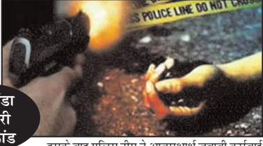
बिलसंडा व्यापारी हत्याकांड

मामले में अब तक तीन साजिशकर्ताओं और चार हमलावरों समेत सात आरोपी दबोचे