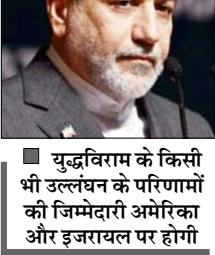
युद्धविराम के किसी भी उल्लंघन के परिणामों की जिम्मेदारी अमेरिका और इजरायल पर होगी

इरान ने उत्तरी इजरायली निवासियों को इलाका खाली करने की दी चेतावनी