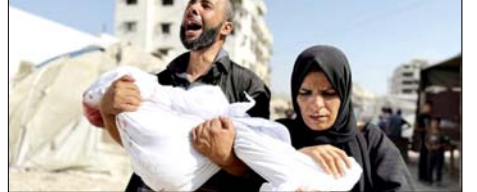
पिछले 48 घंटों के दौरान सात शवों और 25 घायलों को गाजा के अस्पतालों में लाया गया

गाजा। फलस्तीन के गाजा पट्टी क्षेत्र पर इजरायल के हमले निरंतर जारी हैं और इन हमलों से गाजा में अब तक मरने वालों की संख्या बढ़कर 72938 पहुंच गई है। गाजा के स्वास्थ्य मंत्रालय ने मंगलवार को बताया कि पिछले 48 घंटों के दौरान सात शवों और 25 घायलों को गाजा के अस्पतालों में लाया गया है। मंत्रालय के अनुसार पिछले साल 11 अक्टूबर को युद्धविराम लागू होने के बाद से अब तक गाजा में 929 लोगों की मौत हो चुकी है और 2811 अन्य घायल हुए हैं। इसके अलावा मलबे के नीचे से 781 शवों को भी निकाला गया है। स्वास्थ्य मंत्रालय के आंकड़ों के अनुसार, सात अक्टूबर 2023 से अब तक गाजा में मृतकों की कुल संख्या 72938 और घायलों की संख्या 172919 तक पहुंच गई है। रिपोर्ट में कहा गया है कि इजरायल ने अमेरिका के समर्थन से सात अक्टूबर 2023 को गाजा पट्टी के निवासियों के खिलाफ व्यापक सैन्य अभियान शुरू किया था। हालांकि, वह हमला आंदोलन को समाप्त करने और इजरायल के बंदियों की वापसी सुनिश्चित करने के अपने घोषित उद्देश्यों को हासिल करने में विफल रहा और अंततः हमला के साथ युद्धविराम पर सहमत होना पड़ा। रिपोर्ट के अनुसार, युद्धविराम लागू होने के बाद भी इजरायल ने इसके कुछ प्रावधानों को लागू करने से इनकार किया है और गाजा पट्टी पर अपने सैन्य अभियान जारी रखे हैं।