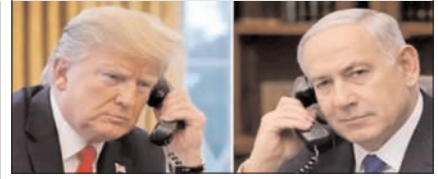
लेबनान पर इजरायली हमले से ट्रम्प नाराज, नेतन्याहू को फटकार लगाई