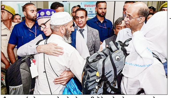
श्रीनगर। हवाई अड्डे पर मक्का से आने वाले हज यात्रियों के पहले जट्टे का स्वागत करते जम्मू-कश्मीर के मुख्यमंत्री उमर अब्दुल्ला।

नई दिल्ली। दक्षिण अफ्रीका के उपराष्ट्रपति शिपोकोसा पॉलुस माशातिले ने मंगलवार को यहां उपराष्ट्रपति सीपी राधाकृष्णन से मुलाकात की और द्विपक्षीय संबंधों को और मजबूत बनाने की प्रतिबद्धता जताई। दोनों नेताओं ने भारत-दक्षिण अफ्रीका द्विपक्षीय संबंधों को और सुदृढ़ बनाने पर सार्थक चर्चा की, जिसमें व्यापार, निवेश, रक्षा सहयोग, कौशल विकास तथा जन-से-जन संबंधों को मजबूत करने पर विशेष ध्यान दिया गया। उन्होंने विकासशील देशों की प्राथमिकताओं को आगे बढ़ाने तथा ब्रिक्स, जी-20, ईन्सा और हिंद महासागर तटीय संघ जैसे बहुपक्षीय मंचों में सहयोग बढ़ाने पर भी विचारों का आदान-प्रदान किया। दोनों नेताओं ने द्विपक्षीय आर्थिक संबंधों की पूर्ण क्षमता का उपयोग करने के उपायों पर चर्चा की।