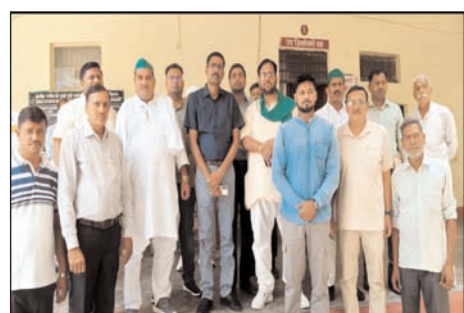
कि क्षेत्र में विभाग की पहल पर एक इकाई द्वारा हंडपंप, आरो प्लांट, ट्यूबवैल आदि लगवाकर शुद्ध पानी देने का प्रयास किया जायेगा। क्षेत्र से