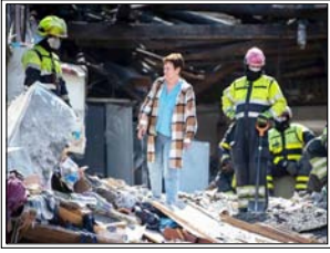
रात भर हुए इन हवाई हमलों में आवासीय इमारतें मलबे में तब्दील हो गईं, जिसमें कई बच्चों सहित दर्जनों लोग घायल हुए हैं: बीबीसी

कीव। यूक्रेन पर रूस के मिसाइल और ड्रोन हमले में कम से कम 13 लोगों की मौत हो गई है। इनमें से नौ लोग निग्रो में और चार राजधानी कीव में मारे गए। यह हाल के महीनों में मॉस्को की ओर से किए गए सबसे बड़े हमलों में से एक है। बीबीसी के अनुसार, रात भर हुए इन हवाई हमलों में आवासीय इमारतें मलबे में तब्दील हो गईं, जिसमें कई बच्चों सहित दर्जनों लोग घायल हुए हैं।