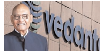
गई सभी जानकारी उपलब्ध करा रहे हैं। कंपनी सभी लागू कानूनों और नियमों का पालन करने के लिए प्रतिबद्ध है। चूंकि यह मामला अभी नियामक प्रक्रिया के अधीन है, इसलिए हम इस स्तर पर आगे कोई टिप्पणी करने में असमर्थ हैं। यह कार्रवाई ऐसे समय में हुई है जब कंपनी अपने कारोबार को चार नई

शाह टाइम्स ब्यूरो नई दिल्ली। प्रवर्तन निदेशालय (ईडी) ने विदेशी मुद्रा प्रबंधन अधिनियम (फंमा) के नियमों के कथित उल्लंघन के मामले में मंगलवार को अनिल अग्रवाल के नेतृत्व वाले वेदांता समूह के परिसरों पर छापेमारी की। यह छापेमारी वेदांता द्वारा अपनी मुख्य कंपनी वेदांता रिसोर्सेज को किए गए रॉयल्टी भुगतान की जांच के सिलसिले में समूह के मुंबई और दिल्ली स्थित कार्यालयों पर की जा रही है। इस मामले पर वेदांता के प्रवक्ता ने कहा कि हम अधिकारियों को पूरा सहयोग दे रहे हैं और मांगी गई सभी जानकारी उपलब्ध करा रहे हैं। कंपनी सभी लागू कानूनों और नियमों का पालन करने के लिए प्रतिबद्ध है। चूंकि यह मामला अभी नियामक प्रक्रिया के अधीन है, इसलिए हम इस स्तर पर आगे कोई टिप्पणी करने में असमर्थ हैं। यह कार्रवाई ऐसे समय में हुई है जब कंपनी अपने कारोबार को चार नई सूचीबद्ध कंपनियों में बांटने (डी मर्जर) की प्रक्रिया में जुटी है। कंपनी को इस बंटवारे की प्रक्रिया के लिए विभिन्न विनियामक मंजूरीयां भी मिल चुकी हैं। प्रवर्तन निदेशालय की छापेमारी की रिपोर्टों के बाद वेदांता के शेयरों पर बिकवाली का दबाव देखा गया और वे चाटे में चले गए।