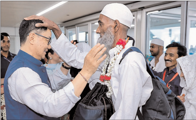
नई दिल्ली: आईजीआई हवाई अड्डे के टर्मिनल-3 पर सऊदी अरब से लौटने वाली पहली उड़ान से आए एक हज यात्री का अभिवादन करते केंद्रीय मंत्री किरन रिजिजू

प्रधानमंत्री रिसर्च चेर योजना के लिए आवेदन शुरू नई दिल्ली। शिक्षा मंत्रालय के उच्च शिक्षा विभाग की ओर से प्रधानमंत्री रिसर्च चेर (पीएमआरसी) योजना 2026 के लिए आवेदन शुरू हो गए हैं। शिक्षा मंत्रालय ने मंगलवार को बताया कि पीएमआरसी केंद्र सरकार की एक प्रमुख राष्ट्रीय पहल है जिसका उद्देश्य दुनिया भर में कार्यरत भारतीय मूल के उत्कृष्ट शोधकर्ताओं, वैज्ञानिकों, तकनीकी विशेषज्ञों और पेशेवरों को भारत के शीर्ष उच्च शिक्षण संस्थानों, राष्ट्रीय प्रयोगशालाओं और अनुसंधान केंद्रों से जोड़ना है।