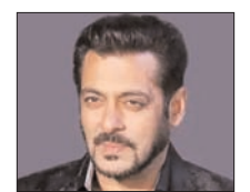
आरोप लगाया: फिल्म से उनके व्यक्तित्व संबंधी अधिकारों का घोर उल्लंघन हुआ