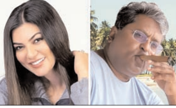
सुष्मिता को अपनी लाइफ के सबसे जरूरी लोगों में से एक बताया और खुलासा किया कि उनके ब्रेकअप में दूरी ने अहम भूमिका निभाई थी। लंदन में रहने वाले इस कारोबारी के अनुसार, दोनों के बीच कोई ड्रामेटिक ब्रेकअप नहीं हुआ था। बल्कि, धीरे-धीरे

नई दिल्ली। 2022 में जब बॉलीवुड एक्ट्रेस सुष्मिता सेन और आईपीएल के पूर्व बांस ललित मोदी के अफेयर की खबरें आईं, तो दुनिया ने सुष्मिता को न जाने कितने गर्दे ताने दिए थे, लेकिन मंगलवार को इंटरनेट ने दुनिया से एक ऐसी खबर आई है जिसने हर किसी को चौंका दिया है। खुद ललित मोदी ने इस राज पर से एसा पर्दा उठाया है कि टूलर्स के मुंह पर ताला लग गया है। ललित मोदी ने साफ कह दिया है कि भाई साहब, सुष्मिता मेरे पैसों पर नहीं पल रही थीं, बल्कि कहानी तो एकदम उल्टी थी। ललित मोदी ने ये भी खुलासा किया कि वे एक्ट्रेस के खर्च पर पलने वाले बॉयफ्रेंड थे। दरअसल हुमन्स ऑफ बॉम्बे के साथ हाल ही में हुई बातचीत में ललित मोदी ने