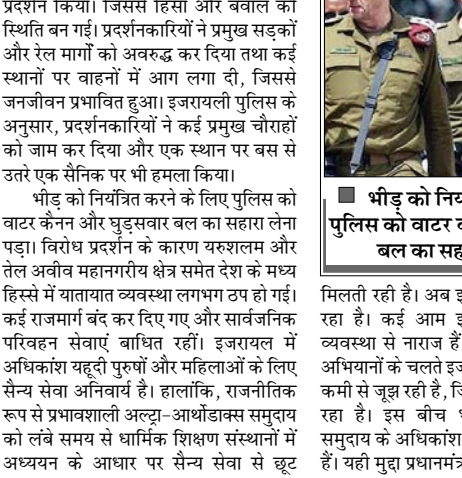
बीडू को नियंत्रित करने के लिए पुलिस को वाटर कैनन और बुद्धिसवार बल का सहारा लेना पड़ा। मिलाती रही है। अब इस छूट पर खतरा मंडरा रहा है। कई आम इजरायली नागरिक इस व्यवस्था से नाराज हैं, क्योंकि लगातार सैन्य अभियानों के चलते इजरायली सेना सैनिकों की कमी से जुझ रही है, जिससे सेना पर दबाव बढ़ रहा है। इस बीच भी अल्ट्रा-आर्थोडॉक्स समुदाय के अधिकांश युवा भर्ती से बाहर रहते हैं। यही मुद्दा प्रधानमंत्री बेंजामिन नेतन्याहू की सत्तारूढ़ गठबंधन सरकार के लिए भी संकट बन गया है। अल्ट्रा-आर्थोडॉक्स दलों द्वारा समर्थन वापस लेने के बाद समय से पहले चुनाव की आशंका भी बढ़ गई है। संसदीय समिति के आंकड़ों के अनुसार, हर साल करीब 13000 अल्ट्रा-आर्थोडॉक्स युवा 18 वर्ष की भर्ती आयु तक पहुंचते हैं, लेकिन इन्होंने से 10 प्रतिशत से भी कम सेना में शामिल होते हैं। सैनिकों की भारी कमी से जुझ रही इजरायली सेना अनिवार्य सैन्य सेवा की अवधि बढ़ाने पर विचार कर रही है। वर्तमान में अधिक। शं यहुदी पुरुषों को लगभग तीन वर्ष और महिलाओं को दो वर्ष की अनिवार्य सैन्य सेवा देनी होती है, जिसके बाद रिजर्व ड्यूटी भी करनी पड़ती है। यरूशलम में प्रदर्शनकारी इजरायल ट्रापर ने कहा, शय सभ्यताइस अपने अस्तित्व को लड़ाई मानता है। सेना में शामिल होने का मतलब धर्म से समझौता करना है। हम अपना धर्म नहीं छोड़ना चाहते, इसलिए हमारे लिए जीवन-मरण का सवाल है। कई प्रदर्शनकारियों ने ऐसे पोस्टर भी उड़ाए जिन पर लिखा था कि हम जियोनिस्ट बनकर जिन से बेहतर यहुदी बनकर मरना पसंद करेंगे।

सैनिकों की भारी कमी से जुझ रही इजरायली सेना