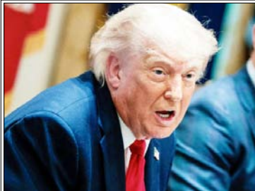
नेतन्याहू ने सेना को लेबनान में अपने जमीनी अभियान का विस्तार करने का निर्देश दिया है। इजरायल ने नबातिह शहर के निकट एक रणनीतिक पहाड़ी पर स्थित ऐतिहासिक व्यूफोर्ट किले पर भी कब्जा कर लिया है।

इजरायल के पीएम नेतन्याहू को फोन कर फटकार लगाई, कहा- पागल हो गए हो क्या, तुरंत ये सब रोको